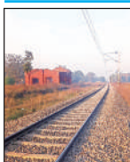
मनकापुर–अयोध्या रेल मार्ग।

अयोध्या खण्ड के दोहरीकरण को मंजूरी मिल चुकी थी, लेकिन बीच का हिस्सा सिंगल लाइन होने के कारण ट्रेनों का संचालन बाधित रहता था। अब इस स्वीकृति के बाद अयोध्या–मनकापुर सेक्शन दोनों ओर से दोहरी लाइन से जुड़ जाएगा, जिससे अयोध्या इंटरचेंज पर ट्रेनों की आवाजाही कहीं अधिक सुचारु होगी। रेलवे अधिकारियों के अनुसार परियोजना के पूरा होने से रेल