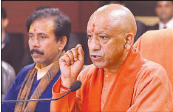
वाराणसी में पत्रकारों से वार्ता करते मुख्यमंत्री योगी आदित्यनाथ।

● काशी में मणिकर्णिका घाट के पुनर्विकास को लेकर मुख्यमंत्री ने विपक्ष के आरोपों का दिया जवाब