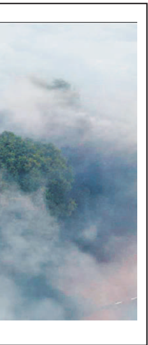
प्रयागराज में शनिवार सुबह घने कोहरे से घिरा श्री आदि शंकर विमान मंडपम।