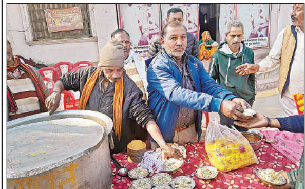
खिचड़ी भोज कराते समिति के लोग।