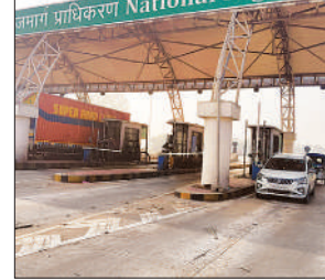
टोल प्लाजा से गुजरते वाहन।