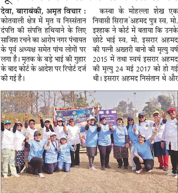
पिकनिक के दौरान इनरव्हील क्लब के सदस्य।