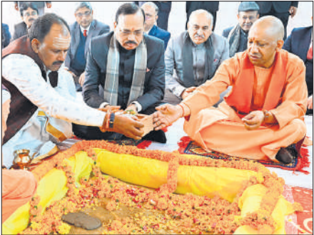
चंदौली में एकीकृत न्यायालय परिसर के शिलान्यास अवसर पर भूमि पूजन करते सीजेआई सूर्यकांत और मुख्यमंत्री योगी।

साकार करने वाला कदम है। यह देश के अन्य राज्यों के लिए उदाहरण बनेगा। न्यायमूर्ति सूर्यकांत ने यह भी कहा कि जब भी वे अन्य राज्यों में जाएंगे, वहां उत्तर प्रदेश के न्यायिक