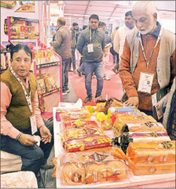
फूड एक्सपो में लगे स्टाल पर उत्पाद देखते लोग।

अमृत विचार, लखनऊ : ज्यादा दूध का उत्पादन उत्तर प्रदेश में होता है, लेकिन उसकी मार्केटिंग नहीं हो पा रही है। उन्होंने बताया कि श्वेत क्रांति के समय भारत में क्रॉस ब्रीडिंग की नीति को अपनाया गया। उस नीति ने भारत को दूध उत्पादन में नंबर वन पर पहुंचा दिया, लेकिन क्रॉस