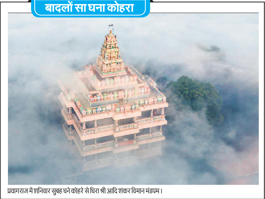
प्रयागराज में शनिवार सुबह घने कोहरे से घिरा श्री आदि शंकर विमान मंडपम।

■ महिला प्रीमियर लीग में यूपी चॉरियर्स की मुंबई इंडियंस पर लगातार दूसरी जीत - 14