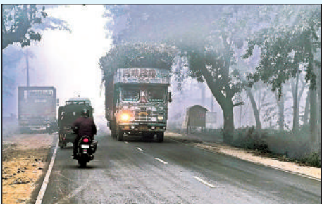
घने कोहरे के चलते लाइट जलाकर निकलते वाहन।

पयागपुर (बहराइच)। मकर संक्रांति का पर्व बीतते ही क्षेत्र में मौसम ने अचानक करवट बदल ली है। शनिवार सुबह से ही पूरा पयागपुर क्षेत्र घने कोहरे की सफेद चादर में लिपटा नजर आया, जिससे आम जनजीवन पूरी तरह अस्त-व्यस्त हो गया है। अचानक बढ़ी इस कड़ाके की ठंड ने लोगों को घरों में दुबकने पर मजबूर कर दिया है कोहरे का असर सड़कों पर सबसे ज्यादा देखने को मिला। आलम यह था कि विजिबिलिटी (दृश्यता) घटकर शून्य तक पहुंच गई। हाईवे और मुख्य मार्गों पर चलने वाले वाहन चालकों को भारी दिक्कतों का सामना करना पड़ा। घने कोहरे के कारण ट्रक, कार और बाइक सवारों को दिन के उजाले में भी अपनी हेडलाइट जलाकर रेंगने पर मजबूर होना पड़ा मकर संक्रांति के बाद तापमान में आई इस भारी गिरावट से हटुरन काफी बढ़ गई है। सुबह के समय बाजार और सड़कों पर सन्नाटा पसरा रहा। लोग ठंड से बचने के लिए अलाव का सहारा लेते नजर आए। मौसम के इस बदले मिजाज का सबसे ज्यादा असर दैनिक मजदूरों और राहगीरों पर पड़ रहा है घने कोहरे को देखते हुए प्रशासन और पुलिस विभाग ने वाहन चालकों से बेहद सावधानी बरतने की अपील की है। विशेष रूप से मोड़ और क्रॉसिंग पर वाहनों की गति धीमी रखने और इंडिकेटर का प्रयोग करने की सलाह दी गई है, ताकि किसी भी अप्रिय घटना से बचा जा सके।