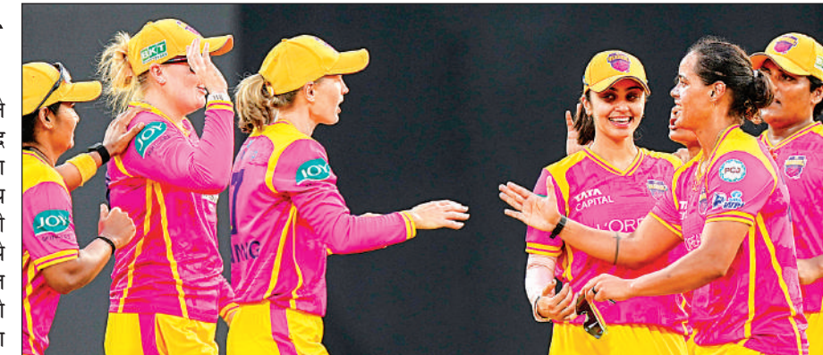
जीत का जश्न मनाती यूपी वॉरियर्स की खिलाड़ी।