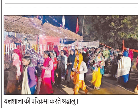
यज्ञशाला की परिक्रमा करते श्रद्धालु।