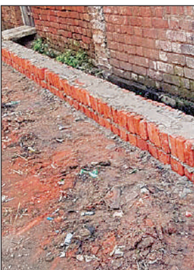
मिट्टी पाटकर लगाई जा रही पीली ईंट।