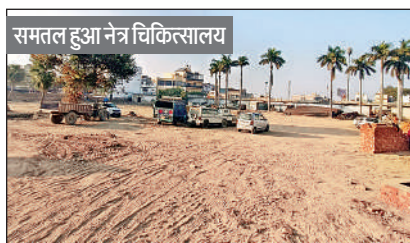
समतल हुआ नेत्र चिकित्सालय

अब ऐसा दिख रहा सीतापुर नेत्र चिकित्सालय परिसर।