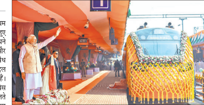
पश्चिम बंगाल के मालदा में हावड़ा और गुवाहाटी (कामाख्या) के बीच चलने वाली देश की पहली वंदे भारत स्लीपर ट्रेन को हरी झंडी दिखाते प्रधानमंत्री नरेंद्र मोदी।

मोदी ने मुस्लिम बहुल जिले मालदा में रैली को संबोधित करते हुए कहा कि घुसपैठ पश्चिम बंगाल के सामने एक बहुत बड़ी चुनौती है। उन्होंने कहा कि भाजपा सत्ता में आने पर पश्चिम बंगाल में घुसपैठियों पर नकेल कसने और अवैध प्रवासन को रोकने के लिए ठोस कदम उठाएगी। उन्होंने कहा, दुनिया में ऐसे विकसित और समृद्ध देश हैं जिनके पास धन की कोई कमी नहीं है, फिर भी वे घुसपैठियों को बाहर निकाल रहे हैं। पश्चिम बंगाल से घुसपैठियों को निकालना