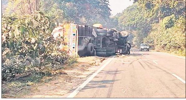
हाईवे किनारे बने गड्ढे में फंसकर पलटा ट्रक।

खास बात यह है कि वाहनो के पलटने के दौरान हाईवे पर पेट्रोलिंग करने वाले विभिन्न