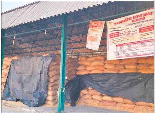
मंडी समिति में एक क्रय केंद्र पर लगा धान।

जनपद में तीन अक्टूबर से सरकारी धान खरीद शुरू हुई थी।