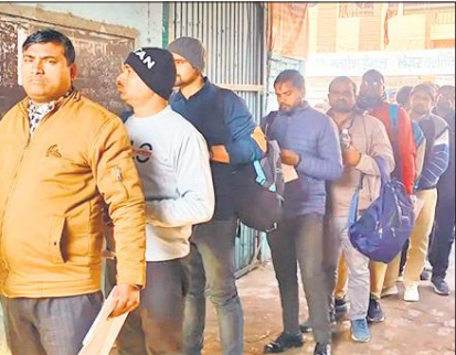
परीक्षा केंद्र पर लगी परीक्षार्थियों की लाइन।