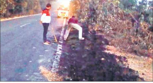
हाईवे किनारे मुसीबत बने गड्ढे को पटान करते श्रमिक।

मामला पीलीभीत-पूरनपुर हाईवे से जुड़ा हुआ है। बरसात के दिनों में माला जंगल के नजदीक हाईवे किनारे एक बड़ा गड्ढा हो गया था। भारी वाहनों के ओवरटेक