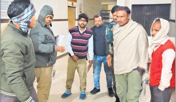
हादसे के बाद सीएचसी में पहुंचे परिजन और पुलिस।