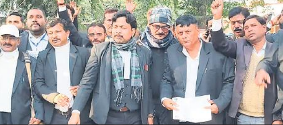
डीएम कार्यालय पर पलिया बार एसोसिएशन के अधिवक्ता।