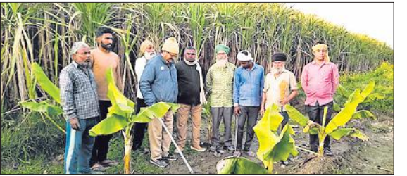
खेत में तेंदुए के पग चिह्न देखते वनकर्मि व ग्रामीण।

किसानों को बच्चों की पढ़ाई, दवाई, घरेलू खर्च और गन्ने की बुवाई में खाद-बीज के लिए खर्च की सता रही चिंता