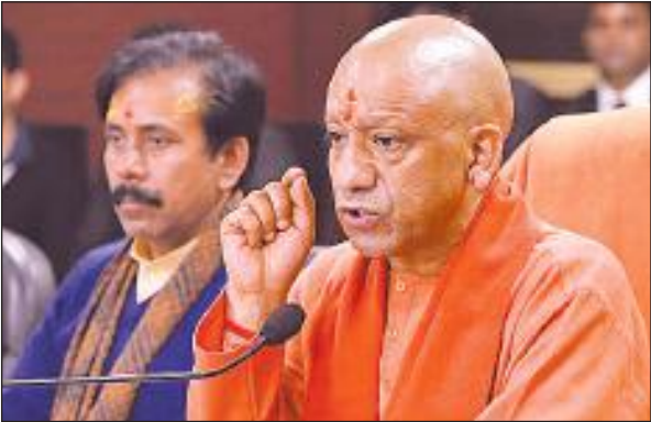
वाराणसी में पत्रकारों से वार्ता करते मुख्यमंत्री योगी आदित्यनाथ।