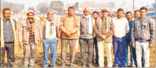
गोला की बजाज चीनी मिल के गन्ना याई में खड़े चिंतित किसान।

अमृत विचार: गन्ना बुवाई का समय आ गया है, लेकिन बजाज चीनी मिल ने पिछली सीजन का भी भुगतान नहीं किया है, जिसे गन्ना किसानों को बच्चों की पढ़ाई, दवाई, घरेलू खर्च और गन्ने की बुवाई में खाद, बीज आदि की चिंता सता रही है। इस सत्र का गन्ना भुगतान शुरू होने की किसानों को कम उम्मीद है। गन्ना किसान आर्थिक तंगी के दौर से गुजर रहा है। अपने मजदूरों को गन्ना छिलाई का पैसा नहीं दे पा रहा है। मजबूरन किसान कम कीमत पर कोल्हू और क्रेशर पर गन्ना बेचकर अपना काम चला रहे हैं, जिससे चीनी मिल को पर्याप्त मात्रा में गन्ना नहीं मिल पा रहा है। किसानों ने जैसे जैसे गेहूं और लाही की बुवाई तो कर ली, लेकिन गन्ने की बुवाई के लिए खाद, बीज, दवाओं में अधिक धन की जरूरत पड़ती है। किसानों का