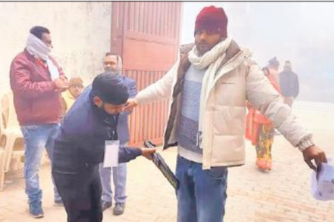
परीक्षार्थी की सघन तलाशी लेता कर्मचारी।

वही प्रथम पाली में 2260 और द्वितीय पाली में 1789 अभ्यर्थी अनुपस्थित रहे। सभी परीक्षा केंद्रों पर सीसीटीवी कैमरों की कड़ी