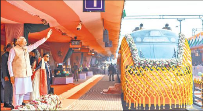
पश्चिम बंगाल के मालदा में हावड़ा और गुवाहाटी (कामाख्या) के बीच चलने वाली देश की पहली वंदे भारत स्लीपर ट्रेन को हरी झंडी दिखाते प्रधानमंत्री नरेंद्र मोदी।

मोदी ने मुस्लिम बहुल जिले मालदा में रैली को संबोधित करते हुए कहा कि घुसपैठ पश्चिम बंगाल के सामने एक बहुत बड़ी चुनौती है। उन्होंने कहा कि भाजपा सत्ता में आने पर पश्चिम बंगाल में घुसपैठियों पर नकेल कसने और अवैध प्रवासन को रोकने के लिए ठोस कदम उठाएगी। उन्होंने कहा, दुनिया में ऐसे विकसित और समृद्ध देश हैं जिनके पास धन की कोई कमी नहीं है, फिर भी वे घुसपैठियों को बाहर निकाल रहे हैं। पश्चिम बंगाल से घुसपैठियों को निकालना