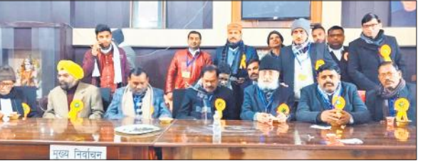
मतदान की जानकारी देती निर्वाचन समिति।