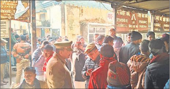
कचहरी परिसर में तैनात पुलिस बल।

हुए चुनाव में 788 अधिवक्ताओं ने मतदान कर 29 प्रत्याशियों के भाग्य का फैसला मतपेटियों में बंद कर दिया। आज रविवार को मतगणना के बाद परिणाम घोषित किया जाएगा। मतदान को लेकर सुबह से ही कचहरी परिसर में भारी गहमा-हमी रही। मतदान के लिए ब्रह्मादीन मिश्र स्मारक हॉल में 10 मतदान बुथ बनाए गए थे। मतपत्र लेने के लिए 10 टेबल लगाई गई थीं, जबकि सेंट्रल टेबल पर सभी मतपत्रिकाएं रखी गई थीं, जिससे मतदान व्यवस्था सुचारू बनी रही। वोट डालने के लिए जिला अधिवक्ता