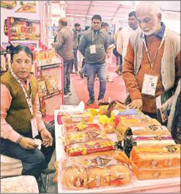
फूड एक्सपो में लगे स्टाल पर उत्पाद देखते लोग।