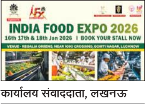
कार्यालय संवाददाता, लखनऊ

अमृत विचार: बरेली विकास प्राधिकरण राज्य का ऐसा पहला विकास प्राधिकरण है, जो विश्वस्तरीय इंडस्ट्रियल टाउनशिप डेवलप करने की दिशा में बढ़ चला है। इस टाउनशिप में उद्यमियों को फ्री होल्ड प्लॉट के साथ-साथ पानी, बिजली, सीवर, पार्किंग, सोलर और पाइप के जरिए गैस कनेक्शन उपलब्ध होंगे। यह पहली टाउनशिप होगी, जिसमें उद्यमी को एनओसी के लिए किसी भी विभाग के चक्कर नहीं लगाने होंगे।