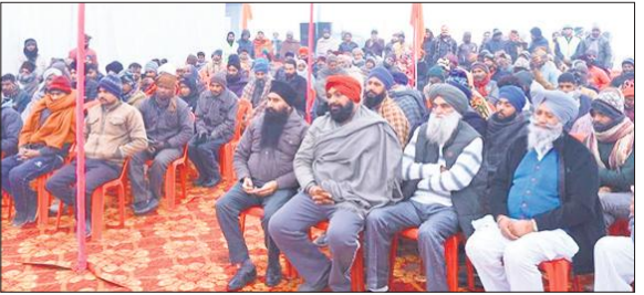
गोष्ठी में मौजूद किसान।

मशीनों पर जोर दिया जाए। उन्होंने कहा कि कुंभी चीनी मिल द्वारा किसानों को सीएसआर मद के तहत कृषि यंत्रों पर अनुदान उपलब्ध कराए जाने की व्यवस्था की है। साथ ही किसानों में आधुनिक एवं वैज्ञानिक गन्ना खेती के प्रति जागरूकता बढ़ाने तथा उनकी आय में वृद्धि के लिए महत्वपूर्ण जानकारीयां बताईं।