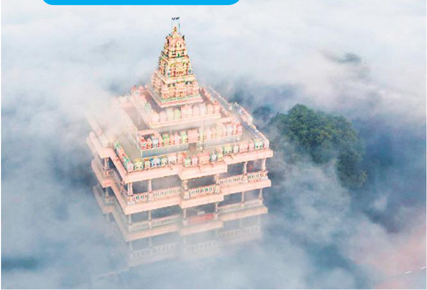
प्रयागराज में शनिवार सुबह घने कोहरे से घिरा श्री आदि शंकर विमान मंडपम।