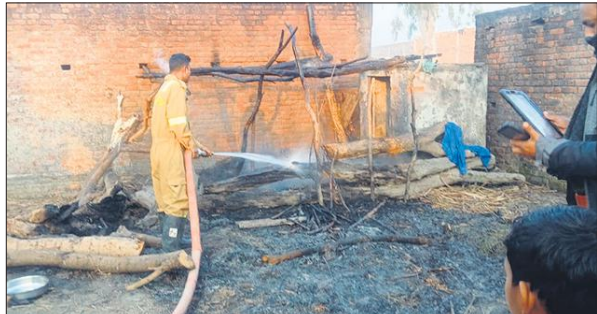
आग बुझाता फायर ब्रिगेड कर्मचारी।