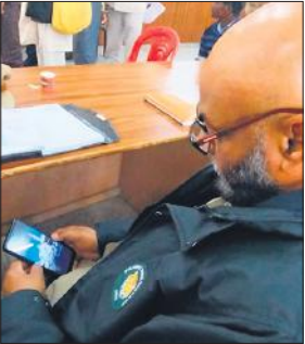
निघासन में मोबाइल देखता कर्मचारी।

पीड़ित व परेशान व्यक्ति की मनोदशा को समझें, उसकी भावना का सम्मान करें और पूरी संवेदनशीलता के साथ उसकी समस्या का समाधान कराएं। डीएम ने कहा कि जनसमस्याओं का निस्तारण शासन की प्राथमिकताओं में है, इसलिए सभी अधिकारी रुचि लेकर निस्तारण करें। इस कार्य में किसी भी स्तर पर लापरवाही क्षम्य नहीं होगी। डीएम की अध्यक्षता में आयोजित सम्पूर्ण समाधान दिवस में कुल 51 शिकायतें प्रार्थना पत्र पंजीकृत किये, जिसमें 05 शिकायतों का मौके पर निस्तारण हुआ। सम्पूर्ण समाधान दिवस में राजस्व 22, पुलिस 13, विकास 04, नगर निकाय 05, आपूर्ति 02, विद्युत- 03, कृषि विभाग के 02 शिकायती प्रार्थना पत्र प्राप्त हुए, जिन्हें पृष्ठांकित कर संबंधित अधिकारियों को निस्तारण हेतु उपलब्ध करा दिया गया।