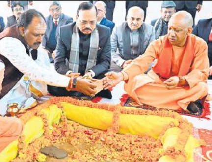
चंदौली में एकीकृत न्यायालय परिसर के शिलान्यास अवसर पर भूमि पूजन करने सीजेआई सूर्यकांत और मुख्यमंत्री योगी।

सीजेआई ने कहा कि यूपी का एकीकृत कोर्ट मॉडल आम आदमी के संवैधानिक सपनों को