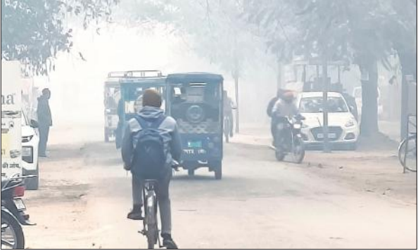
घने कोहरे की चादर से ढका शहर।

अमृत विचार: शनिवार को जनपद में सुबह तड़के से ही घना कोहरा छाया रहा, जिससे पूरा इलाका सफेद चादर में लिपटा नजर आया। कोहरे के साथ चल रही सर्द हवाओं और गलन ने ठंड का असर और बढ़ा दिया। सुबह के समय दृश्यता बेहद कम होने के कारण सड़कों पर चलना मुश्किल हो गया और जनजीवन बुरी तरह प्रभावित रहा। ग्रामीण अंचलों से शहर की ओर मजदूरी की तलाश में आने वाले श्रमिकों को सबसे अधिक परेशानी का सामना करना पड़ा। ठंड और कोहरे के चलते कई मजदूर समय से अपने गंतव्य तक नहीं पहुंच सके। बस स्टैंड, चौराहों और निर्माण