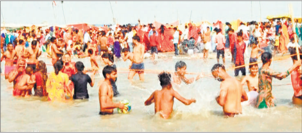
मौनी अमावस्या पर ढाई घाट गंगा में ब्रह्म मुहूर्त में स्नान करते श्रद्धालु।

श्रृंगी ऋषि की तपोस्थली ढाई घाट गंगा पर आयोजित माघ मेला रामनगरिया में मौनी अमावस्या के अवसर पर श्रद्धालुओं का रेला उमड़ पड़ा। माघ माह के प्रमुख स्नान पर्व को लेकर पवित्र गंगा में डुबकी लगाने के लिए पड़ोसी जिलों से भी श्रद्धालु शनिवार शाम से ही गंगा तट पर पहुंचने लगे थे। सर्द हवाओं और गलन के बीच गंगा तट पर कल्प वास कर रहे संतों के अखाड़ों में श्रद्धालुओं ने पूरी रात भजन-कीर्तन किया। ब्रह्म मुहूर्त में