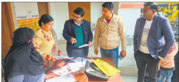
तिलहर में बूथ पर बीएलओ कार्यों का निरीक्षण करते एडीएम प्रशासन।