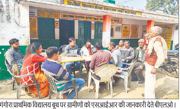
गंगोरा प्राथमिक विद्यालय बूथ पर ग्रामीणों को एसआईआर की जानकारी देते बीएलओ।

प्रशासन की ओर से जिले की सभी छह विधानसभाओं में