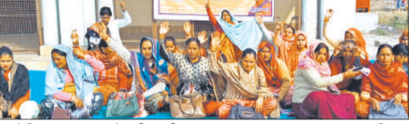
35 वें दिन हड़ताल पर नारेबाजी करती आशाएं

आधुनिक तकनीक से जोड़ने की दिशा में सरकार ने यह अहम कदम उठाया गया है। लैब के माध्यम से विद्यार्थी आधुनिक तकनीक से जुड सकेंगे।