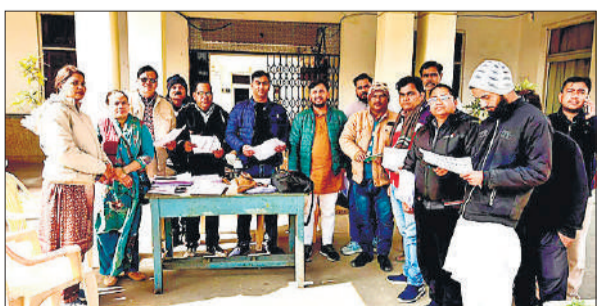
लोगों को जागरूक करते बीएलओ।