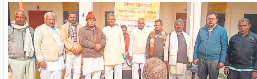
मीरानपुर कटरा में जिला आर्य प्रतिनिधि सभा का वार्षिक अधिवेशन में नव मनोनीत पदाधिकारी।