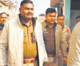
गांव में पूछताछ करते पुलिसकर्मी।

जिसकी वजह से सांड की जान का खतरा बना हुआ है। ग्रामीणों का कहना है कि अगर चिकित्सक पहुंचें और इलाज करें तो सांड की जान बच जाएगी। वहीं ग्रामीणों ने सरिया मारने वाले की जानकारी करके उसके खिलाफ पशु क्रूरता अधिनियम के अंतर्गत कार्रवाई की मांग की है।