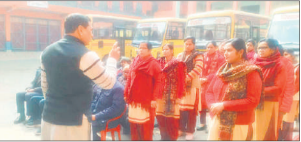
शिक्षिकाओं को जानकारी देते विद्या भारती ब्रज प्रांत के जिला समन्वयक।