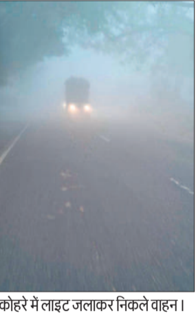
कोहरे में लाइट जलाकर निकले वाहन।

भयंकर कोहरे के कारण ओरछी चौहाना और आसपास का क्षेत्र पूरी तरह सफेद चादर में लिपटा रहा। विजिबिलिटी इतनी कम थी कि चंद कदम की दूरी पर भी कुछ नजर नहीं आ रहा था। इसका सीधा असर यातायात पर पड़ा, मुरादाबाद-फर्रुखाबाद हाईवे पर वाहनों की रफ्तार पूरी तरह धीमी