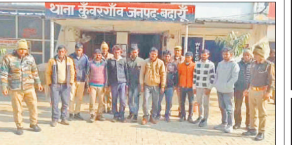
पुलिस की गिरफ्त में शांतिभंग के आरोपी।

है। जिससे पूरे दिन आवागमन बाधित रहता है। संडे की बाजार में किसी रोड पर पुलिस नहीं रहती है जिससे दुकानदार बेखौफ होकर दुकानें सड़कों पर लगाते हैं और मनमानी के साथ बिक्री करते हैं।