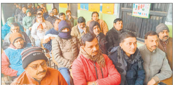
रविवार को हुई संयुक्त शिक्षक संघर्ष समिति की बैठक में उपस्थित शिक्षक।