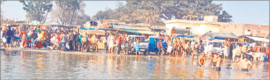
कछला गंगा घाट पर गंगा में स्नान करते श्रद्धालु

अन्य दिनों की अपेक्षा रविवार को भी जनपद भर में घना कोहरा छाया रहा। इसी कोहरे के बीच कछला गंगा घाट पर श्रद्धालुओं के पहुंचने का सिलसिला भोर से शुरू हो गया था। सुबह तक हजारों की संख्या में जुटे श्रद्धालु महिला-पुरुषों