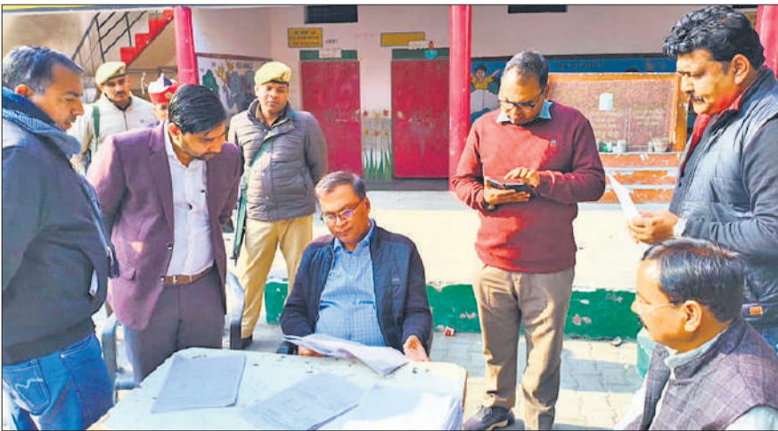
मिश्रीपुर द्वितीय बूथ पर निरीक्षण के दौरान जिला निर्वाचन अधिकारी और उप जिलाधिकारी सदर।

खंड विकास अधिकारी भावलखेड़ा ने अवगत कराया कि तमाम बीएलओ ड्यूटी पर उपस्थित नहीं हैं। इस पर जिलाधिकारी ने निर्देश दिए कि अनुपस्थित बीएलओ की सूची तत्काल उपलब्ध कराई जाए, ताकि उनके विरुद्ध निलंबन की कार्रवाई की जा सके। भारत निर्वाचन आयोग के निर्धारित कार्यक्रम के अनुसार विधानसभा निर्वाचन क्षेत्रों की मतदाता सूचियों के प्रगाढ़ पुनरीक्षण कार्य के अंतर्गत