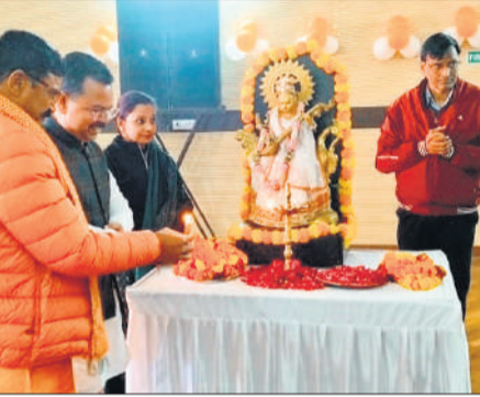
मां सरस्वती प्रतिमा के समक्ष दीप प्रज्जित करते भाजपा नेता।

अमृत विचार: शहरी क्षेत्र के गरीबों को पक्के आवास का सपना साकार करने की दिशा में प्रदेश सरकार ने ऐतिहासिक पहल की है। मुख्यमंत्री योगी आदित्य नाथ ने पीएम शहरी आवास योजना (शहरी) 2.0 के अंतर्गत प्रदेश के 2 लाख से अधिक लाभार्थियों के बैंक खातों में सीधे 2000 करोड़ रुपये से अधिक की अनुदान राशि का बटन दबाकर अंतरण किया। जिसमें जनपद की 21 नगरीय निकायों में चयनित 4521 लाभार्थियों के बैंक खातों में आवास निर्माण की प्रथम किस्त पहुंची। लखनऊ में आयोजित कार्यक्रम में उपस्थित रहे केन्द्रीय राज्यमंत्री बीएल वर्मा ने कहा कि प्रधानमंत्री ने जब अपना पदभार ग्रहण किया तब कहा था कि उनकी सरकार गरीबों, महिलाओं, किसानों व युवाओं को समर्पित है। आज