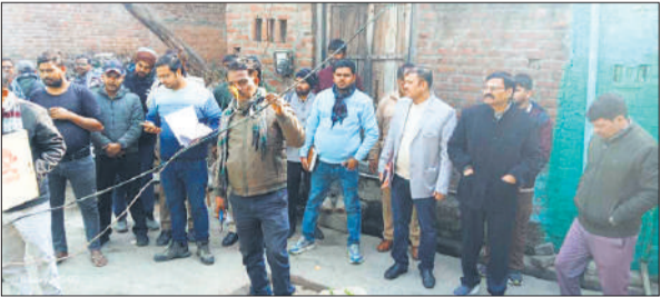
विरोध करने वालों को समझाते अधिकारी

अफसरों ने बताया कि स्मार्ट मीटर उपभोक्ताओं के लिए पारदर्शिता का माध्यम है, जिसके जरिए वे स्वयं यह देख सकेंगे कि उन्होंने कितनी बिजली की खपत की है। इसके साथ ही हर माह की पहली तारीख को स्वतः बिजली बिल जनरेट