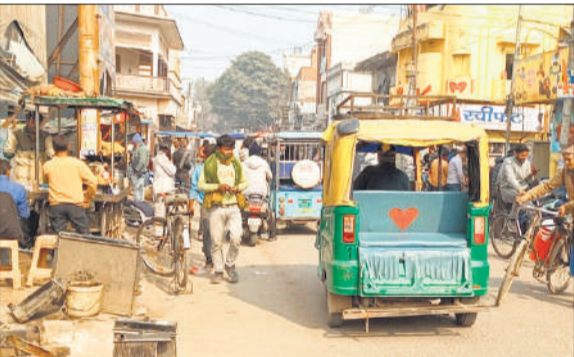
शम्बीर गेट रोड पर लगा जाम

शहर के बीचों बीच प्रत्येक रविवार को बाजार लगता है। इस बाजार में शहर व आसपास के लोग अपनी जरूरत की चीजें खरीदने पहुंचते हैं। दूर दराज के दुकानदार यहां पर दुकान लगाते हैं। गांधी ग्राउंड के अंदर पूरा मैदान खचाखच भर जाता है। इसके बाद दुकानदार गांधी ग्राउंड के बाहर सड़कों पर