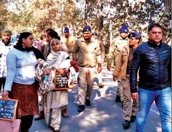
पीड़ित परिवार को डीएम कार्यालय ले जाती पुलिस ।