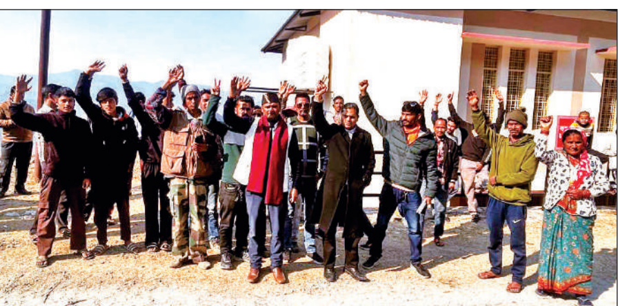
हवालबाग के खूंट-धामस में भू-माफिया के खिलाफ प्रदर्शन करते ग्रामीण।

अमृत विचार: हवालबाग ब्लॉक के खूंट-धामस में ग्रामीणों ने कुल लोगों पर जबरन जमीन खरीद फरोख्त का आरोप लगाया है। रविवार को मामले को लेकर ग्रामीणों ने बैठक की। इस दौरान ग्रामीणों ने प्रशासन से भू-माफिया पर कार्रवाई करने की मांग उठाई। ग्राम पंचायत में आयोजित बैठक में ग्रामीणों ने गंभीर आरोप लगाते हुए बताया कि भू-माफियाओं द्वारा स्थानीय लोगों पर दबाव बनाया जा रहा है। वहीं, वृद्ध ग्रामीणों के साथ मारपीट, छाती पर लात मारने जैसे अमानवीय कृत्य किए गए हैं। कहा कि इस प्रकार की घटनाएं न केवल