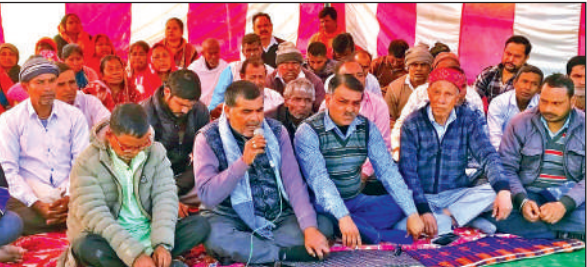
मिल्क प्लांट के विरोध में धरना देते प्रभावित परिवार व ग्रामीण । ● अमृत विचार

ग्राम सभा राजनगर में मिल्क एवं आइसक्रीम प्लांट लगाने की कवायद चल रही है। डेयरी विभाग ने जमीन पर तारबाड़ लगाकर उद्योग स्थापित करने का कार्य भी प्रारंभ कर दिया था। इस बीच प्रभावित परिवार ने उद्योग को अन्य जमीन पर स्थानांतरित करने की मांग को लेकर धरना प्रदर्शन आरंभ कर दिया। विभाग के अधिकारियों ने परिवार को समझाने का प्रयास किया लेकिन बात