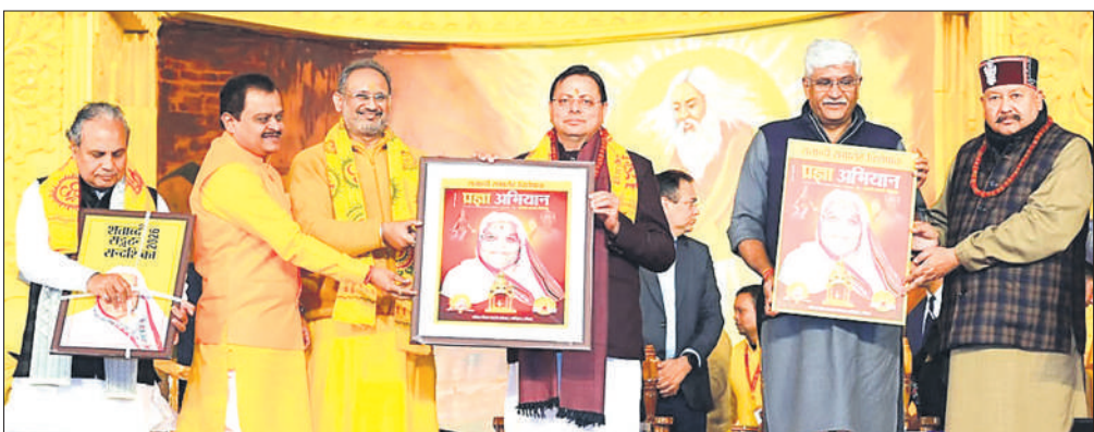
ध्वज वंदन समारोह में मौजूद पुष्कर सिंह धामी एवं केंद्रीय मंत्री गजेन्द्र सिंह शेखावत ।

मुख्यमंत्री धामी ने देवभूमि उत्तराखंड की आध्यात्मिक चेतना का स्मरण करते हुए कहा कि गंगोत्री, यमुनोत्री, केदारनाथ, बद्रीनाथ और आदि कैलाश जैसे तीर्थस्थल भारत की आत्मा की धड़कन हैं। ऐसे पावन परिवेश में आयोजित यह शताब्दी समारोह भारतीय संस्कृति, संस्कार और साधना परंपरा के नवजागरण का संदेश देता है। कहा कि राज्य सरकार देवभूमि उत्तराखंड के मूल स्वरूप को बचाए रखने के लिए निरंतर कार्य करने के साथ प्रतिबद्ध है। राज्य में समान नागरिक संहिता लागू किया गया है। सख्त दंगारोधी कानून एवं धर्मांतरण कानून भी लाया गया है। राज्य में 10 हजार एकड़ से अधिक अवैध अतिक्रमण को हटाया गया है।