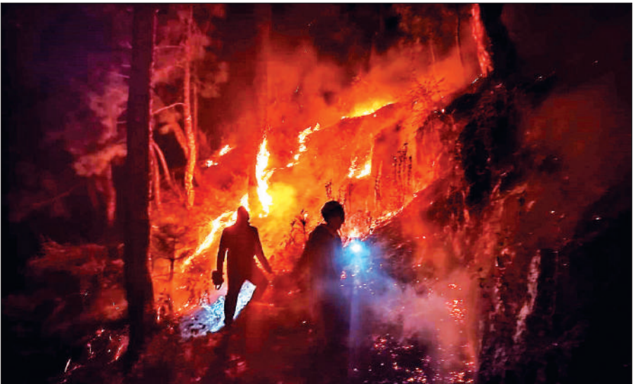
सोमेश्वर के जंगल में धधकी आग को बुझाने की कोशिश करते फायर कर्मी। ● अमृत विचार

दरअसल, इन दिनों जिला मुख्यालय समेत ग्रामीण क्षेत्रों से लगे जंगलों में आग की घटनाएं आम हो गई हैं। शनिवार देर शाम सोमेश्वर तहसील परिसर से लगे जंगल में आग धधक उठी। विकराल हो चुकी आग तहसील के परिसर तक पहुंची पहुंच गई। इससे वहां मौजूद लोगों में हड़कंप मच गया। आनन फानन में लोगों ने फायर सर्विस की टीम को सूचना दी। मौके पर पहुंचे फायर सर्विस की टीम ने जंगल में धधकी आग पर काबू पाने में जुट गए। करीब दो घंटे की कड़ी मशकत