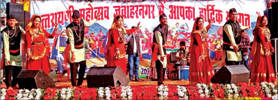
उत्तरायणी महोत्सव में मंच पर कुमाउनी लोकगीत कश्मीरा बॉर्डर प्यारी गीत पर नृत्य प्रस्तुत करते लोककलाकार ।