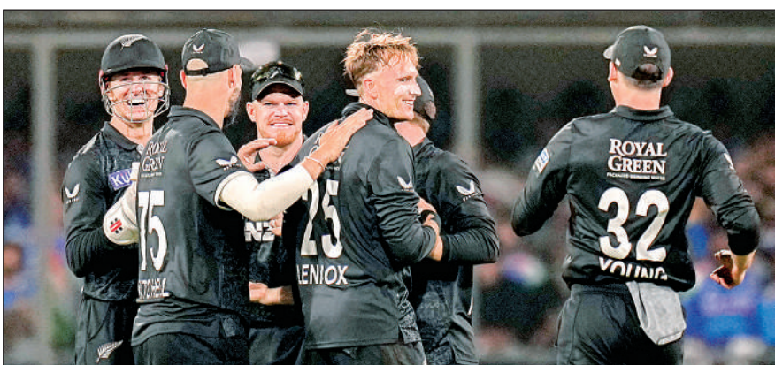
जीत का जश्न मनाते न्यूजीलैंड के खिलाड़ी।

न्यूजीलैंड के लिए यह मैच काफी महत्वपूर्ण था क्योंकि उसने 1989 से द्विपक्षीय वनडे मुकाबलों के लिए भारत का दौरा शुरू किया था लेकिन यहां कभी भी श्रृंखला नहीं जीती थी। इस जीत से उसने 37 साल बाद भारत में श्रृंखला जीतने का इंतजार खत्म किया। भारत के तेज गेंदबाजों के शुरुआती झटकों के बावजूद न्यूजीलैंड ने मिचेल के