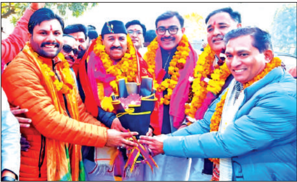
काशीपुर में रोड शो निकालते भाजपा पदाधिकारी ।