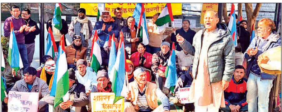
अल्मोड़ा में उप्पा के स्थापना दिवस पर प्रदर्शन करते कार्यकर्ता।