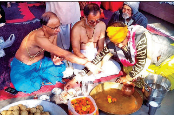
आश्रय सेवा समिति वृद्धाश्रम में मौनी अमावस्या पर अनुष्ठान का दृश्य।