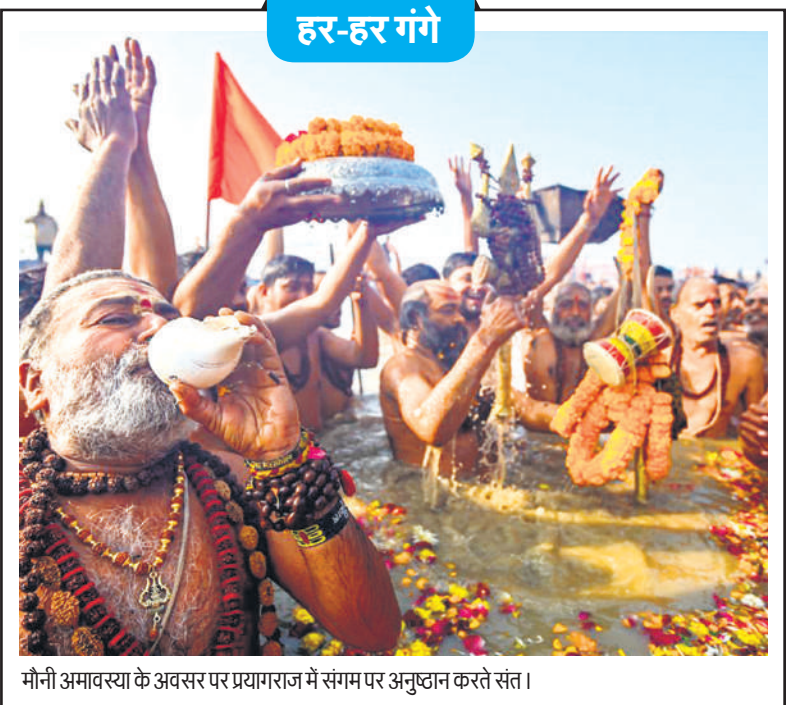
मौनी अमावस्या के अवसर पर प्रयागराज में संगम पर अनुष्ठान करते संत ।