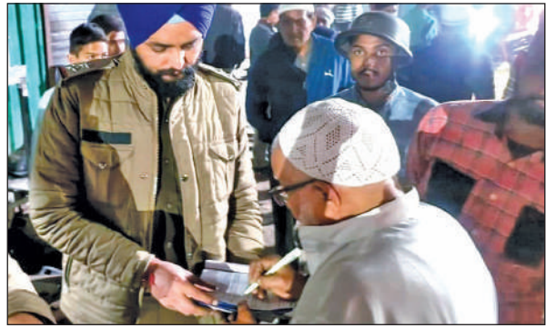
किराएदार का सत्यापन न कराने पर चालान करती पुलिस।