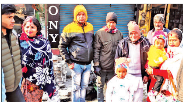
शक्तिफार्म में रोडवेज बस के इंतजार में खड़े यात्रीगण । ● अमृत विचार

बताते चलें कि पिछले 25 साल से शक्तिफार्म से दिल्ली तक सीधी रोडवेज बस सेवा का संचालन किया जा रहा है। इस मार्ग पर यात्रियों की संख्या भी काफी अधिक है। लेकिन पिछले एक साल से रोडवेज बसों का संचालन अनियमित चल रहा