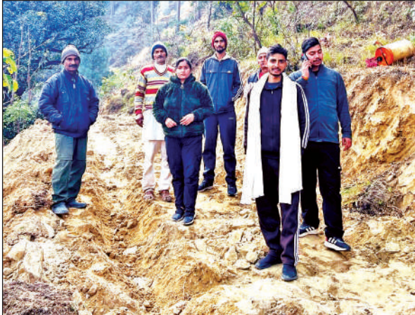
पहाड़ काटकर तैयार की जा रही सड़क और निर्माणाधीन सड़क पर खड़े ग्रामीण।

अमृत विचार : जिला पंचायत क्षेत्र के ग्राम सभा स्यूड़ा के तोक बनियां से मोरसेली तक लगभग 3 किलोमीटर लंबे बहुप्रतीक्षित मोटर मार्ग कटिंग कार्य का शुभारम्भ हो चुका है। यह मार्ग वर्षों से क्षेत्रवासियों की एक प्रमुख मांग रही है, जिसके पूर्ण होने से ग्रामीणों को आवागमन की बड़ी सुविधा मिलेगी। इसके साथ ही शिक्षा, स्वास्थ्य, कृषि और आपातकालीन सेवाओं तक पहुंच सुलभ होगी। यह मार्ग केवल सड़क नहीं, बल्कि ग्राम सभा स्यूड़ा और आसपास के तोकों के विकास, प्रगति और भविष्य का मजबूत आधार है। इस कार्य से क्षेत्र के सामाजिक-आर्थिक विकास को नई गति मिलेगी और ग्रामीण जीवन