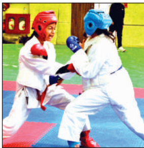
ट्रायल में प्रतिभाग करती खिलाड़ी।