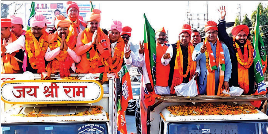
मुख्य बाजार में रैली के दौरान उत्तराखंड ओबीसी मोर्चा के पदाधिकारी ।

रविवार को रैली के बाद ट्रांजिट कैंप में आयोजित सभा में भाजपा ओबीसी मोर्चा के प्रदेश अध्यक्ष नेत्रपाल मौर्य ने कहा कि पूरे प्रदेश में भाजपा का जनाधार लगातार बढ़ता जा रहा है। भाजपा समाज के सभी लोगों को इस्थान के नेतृत्व, निरंतर प्रयासरत है जिसको लेकर सर्व समाज के लोगों की आस्था लगातार भाजपा में बढ़ती जा रही है। उन्होंने कहा कि मुख्यमंत्री पुष्कर सिंह धामी के नेतृत्व में 2027 का चुनाव पूरे दमखम से लड़ा जाएगा और उत्तराखंड में भाजपा ऐतिहासिक जीत हासिल कर तीसरी बार अपनी सरकार बनाएगी। उन्होंने कहा की ओबीसी मोर्चा पूरे प्रदेश में आने वाले चुनाव को लेकर रणनीति तैयार करेगा और समाज के हर वर्ग को साथ लेकर चलेगा। उन्होंने कहा कि शीघ्र ही ओबीसी मोर्चा के मंडल