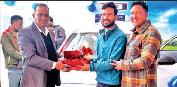
रामपुर रोड स्थित हुंडई शो रूम में ओरा टैक्सी कार की लांचिंग करते अतिथि।