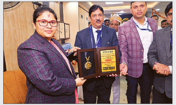
डीएम को सम्मानित करते इंडियन बैंक के आंचलिक प्रबंधक।