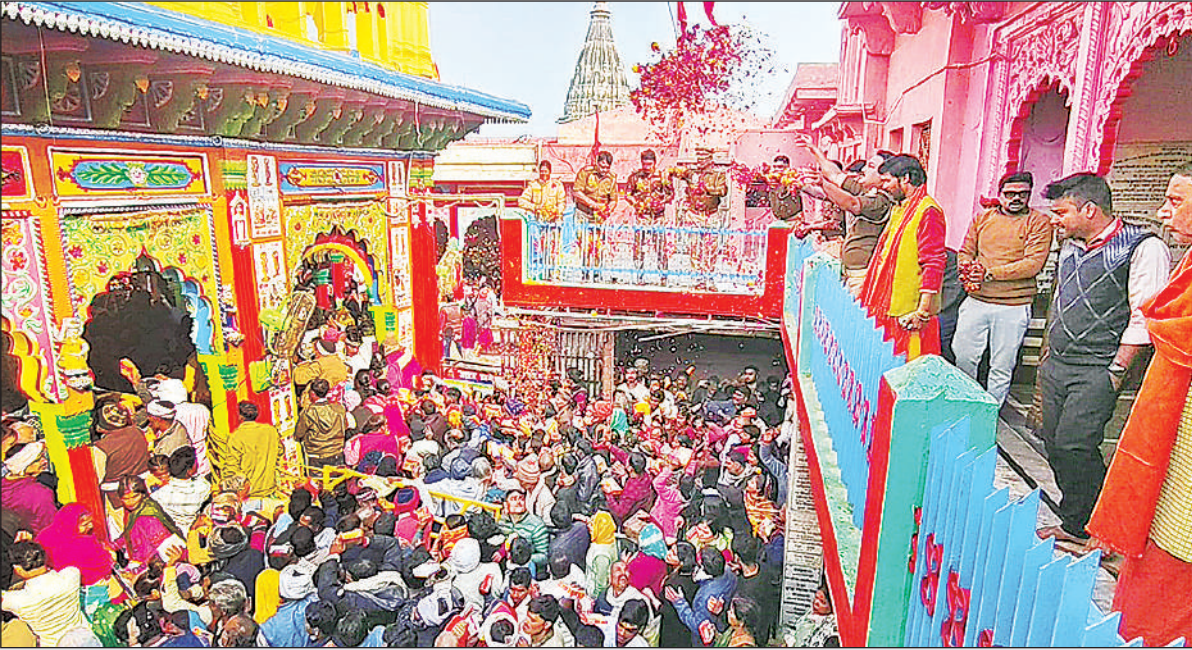
हनुमानगढ़ी मंदिर में दर्शन करने पहुंचे श्रद्धालुओं पर पुलिसकर्मियों ने बरसाया फूल।