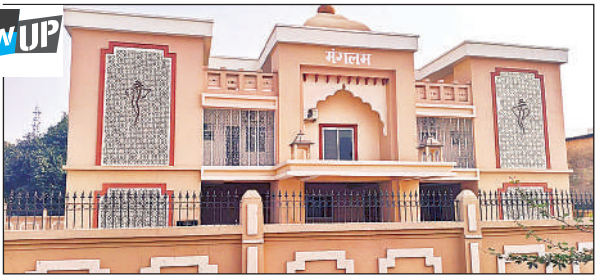
रायबरेली रोड पर बना कल्याण मंगलम।