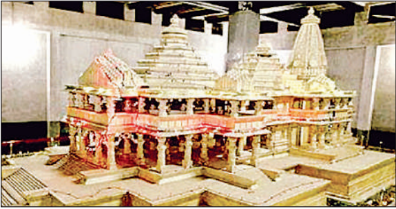
कारसेवकपुरम में रखा राम मंदिर का पुराना मॉडल।

अमृत विचार : राम जन्मभूमि पर भव्य मंदिर के निर्माण का कार्य संपन्न हो चुका है। जहां प्रतिदिन लाखों भक्त दर्शन कर रहे हैं। वहीं विश्व हिंदू परिषद मुख्यालय कारसेवकपुरम में 25 साल पहले रखे गये राम मंदिर मॉडल का दर्शन करने अब श्रद्धालु नहीं पहुंच रहे हैं। संतों की माने तो मंदिर के संकल्प सिद्धि के लिए ही इस मॉडल को तैयार किया गया था। इसी को लेकर दशकों से संघर्ष किया गया। जो आज भी सुरक्षित रखा हुआ है। राम मंदिर आंदोलन के दौरान 90 के दशक में मंदिर निर्माण