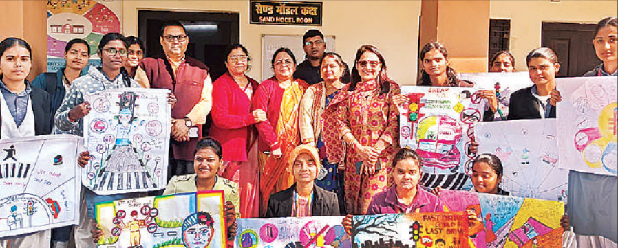
पोस्टर बनाकर जागरूक करते कालेज के विद्यार्थी।

जिलाधिकारी ने कहा कि टेढ़ी नदियां जनपद की महत्वपूर्ण प्राकृतिक धरोहर हैं, जिनका संरक्षण व संवर्धन आवश्यक है। उन्होंने नदियों की नियमित सफाई, जल प्रवाह बाधित न होने देने तथा अतिक्रमण को चिन्हित कर तत्काल कार्रवाई के निर्देश दिए।