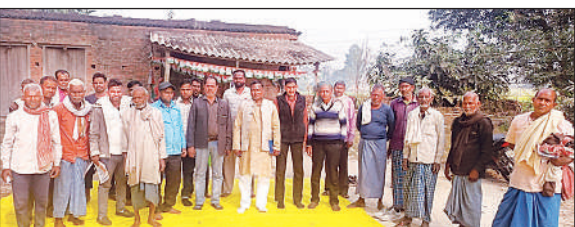
चौपाल में शामिल ग्रामीण व कांग्रेस नेता।

जंगल, विवेक नगर कस्बा लंभुआ के पास संदिग्ध व्यक्तियों व वाहनों की चेकिंग कर रही थी। इसी दौरान दो संदिग्धों को रोका गया। तलाशी लेने पर प्लास्टिक की बोरी में रखा 38