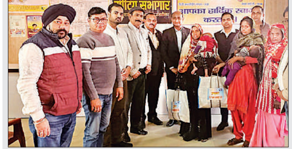
कुपोषित बच्चों व उनकी मां को दवाएं व पोषण किट देते रोटरी क्लब के सदस्य।