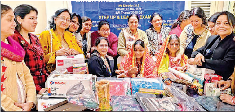
जरूरतमंद कन्याओं को सामग्री भेंट करती इनरहली क्लब की पदाधिकारी।