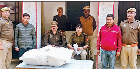
पुलिस की गिरफ्त में गांजा तस्कर।