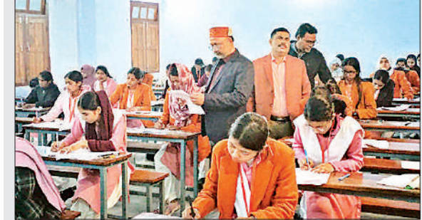
एमएलके पीजी कॉलेज में परीक्षा का निरीक्षण करते कुलपति व अन्य।