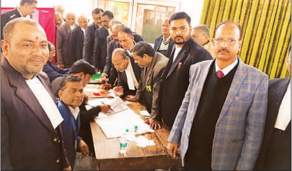
वोट डालने के लिए नामावली में अपना नाम दूढ़ते अधिवक्ता।