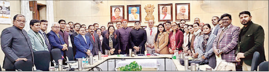
नैक मूल्यांकन को लेकर राजभवन में प्रस्तुतिकरण करते अवध विवि टीम के शिक्षक।

डीजल/पेट्रोल पम्प के प्रोपराइटर को निर्देश दिए हैं। चालक और सहायत्री का हेलमेट पहना जरूरी है। नौ जनवरी को जोनल परिवहन अधिकारी की अध्यक्षता में आयोजित बैठक में भी निर्देश दिया गया कि अपने डीजल / पेट्रोल पम्प के प्रांगण में बड़े-बड़े होर्डिंग लगवाने का निर्देश दिया गया कि ऐसे बिना हेलमेट के दो पहिए वाहनों को पेट्रोल की बिक्री नहीं की जाएगी। जिसके चालक और सहायत्री हेल्मेट नहीं पहने होंगे।