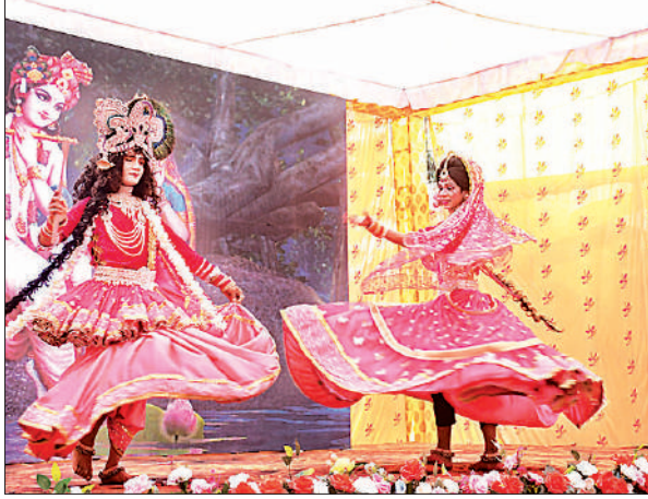
संस्कृति उत्सव में कार्यक्रम प्रस्तुत करते कलाकार।