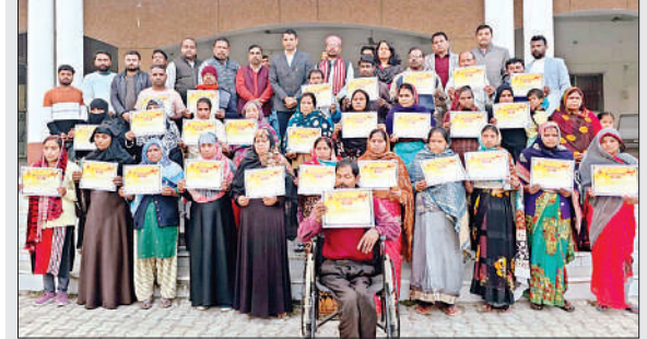
डीबीटी प्रमाणपत्र पाने वाले आवास योजना के लाभार्थी।