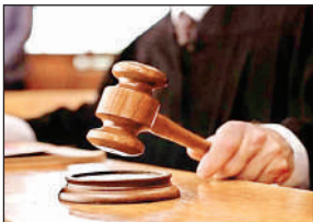
विधि संवाददाता, सुलतानपुर