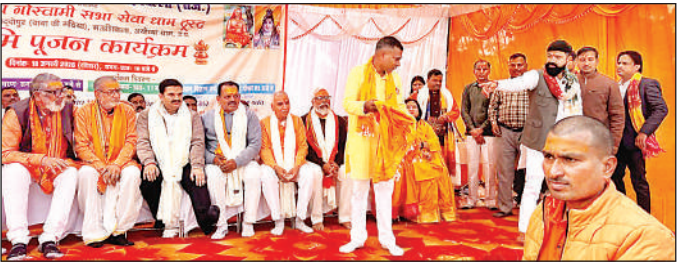
भारतीय गोस्वामी सभा सेवा धाम ट्रस्ट के भूमि पूजन समारोह में अंग वरुन से सम्मानित किये गए गोस्वामी बन्धु।

जनपद में लॉगेंगे 3 लाख 50 हजार स्मार्ट मीटर जिला संवाददाता, अंबेडकरनगर। जनपद में बिजली विभाग लगभग 3.5 लाख बिजली उपभोक्ताओं के घरों और प्रतिष्ठानों पर लगे सिंगल फेस साधारण मीटरों को हटाकर स्मार्ट मीटर लगाए जाएंगे। इस अभियान से मीटर रीडिंग का कार्य करने वाले कर्मचारियों की सेवाएं समाप्त हो जाएंगी, क्योंकि स्मार्ट मीटर स्वचालित प्रणाली पर काम करेंगे। बता दें कि स्मार्ट मीटर ऑटो बिलिंग सिस्टम पर आधारित होंगे। बिजली विभाग ने इस परियोजना के तहत अब तक 38 हजार स्मार्ट मीटर सफलतापूर्वक स्थापित किए हैं। उपभोक्ताओं पर पड़ने वाले वित्तीय बोझ को कम करने के लिए निगम ने स्मार्ट मीटर की मूल कीमत 6800 रुपए से घटाकर 2800 रुपए कर दी है, जिससे यह अधिक फायदाती हो गया है। अधीक्षण अभियंता रजनीश श्रीवास्तव ने बताया कि पुराने सामान्य मीटरों को चरखानुद्वरीकें से हटाकर स्मार्ट मीटर लगाए जा रहे हैं।