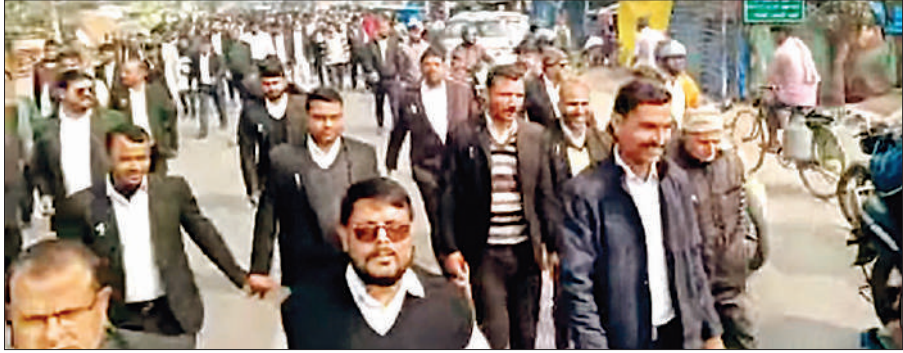
सड़क पर उतरकर पुलिस के खिलाफ प्रदर्शन करते अधिवक्ता।

बलरामपुर, अमृत विचार : नगर कोतवाली क्षेत्र के बड़े पुल चौराहे पर 15 जनवरी को वरिष्ठ अधिवक्ता के साथ हुई मारपीट एवं डकैती की घटना में अब तक आरोपियों की गिरफ्तारी न होने से अधिवक्ताओं में रोष व्याप्त है। पुलिस की निष्क्रिय कार्यशैली से नाराज अधिवक्ताओं ने मंगलवार को प्रदर्शन करते हुए न्यायालय परिसर से तहसील गेट तक पैदल मार्च निकाला। अप्रिय स्थिति से निपटने के लिए तहसील परिसर एवं आसपास के क्षेत्रों में पुलिस बल तैनात रहा। अधिवक्ताओं ने चेतावनी दी कि यदि शीघ्र गिरफ्तारी नहीं हुई तो आंदोलन को और व्यापक रूप दिया जाएगा। गौरतलब है कि इससे पूर्व अधिवक्ताओं ने प्रदेश बार कार्डसिल