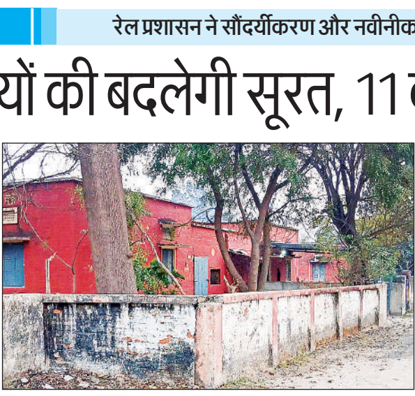
रेलवे कॉलोनी में बने जर्जर आवास।

अमृत विचार। पूर्वोत्तर रेलवे के महत्वपूर्ण जंक्शनों में शुमार स्थानीय रेलवे स्टेशन और यहां स्थित रेल कॉलोनियों में रहने वाले रेलकर्मियों के लिए राहत भरी खबर है। रेल प्रशासन ने कॉलोनियों की बुनियादी सुविधाओं में सुधार और वर्षों पुराने जर्जर हो चुके क्वार्टर्स की मरम्मत के लिए क़मर कस ली है। रेलवे बोर्ड ने गोंडा स्टेशन, गिरिजा कॉलोनी समेत अन्य रेल कॉलोनियों के सौंदर्यीकरण और नवीनीकरण से जुड़ी विभिन्न परियोजनाओं को हरी झंडी दे दी है। इन सभी कार्यों पर लगभग 11 करोड़ रुपये की भारी-भरकम