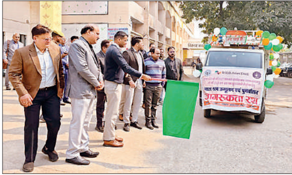
बाल श्रम उन्मूलन जागरूकता रथ को हरी झंडी दिखाई डीएम और अन्य।

इस अवसर पर विकास भवन सभागार में आयोजित बाल श्रम उन्मूलन एवं पुनर्वास विषयक कार्यशाला को संबोधित करते हुए जिलाधिकारी ने कहा कि बाल श्रम के उन्मूलन के लिए सभी संबंधित विभागों के बीच बेहतर आपसी समन्वय के साथ-साथ समाज में