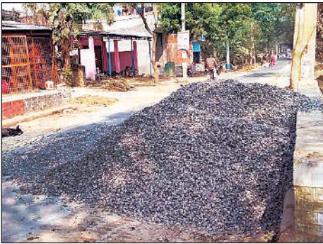
अलीगंज संपर्क मार्ग पर बिखरी गिद्धी।