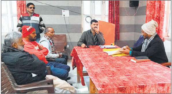
भूमि विकास बैंक के प्रतिनिधि के लिए नामांकन करते उम्मीदवार।