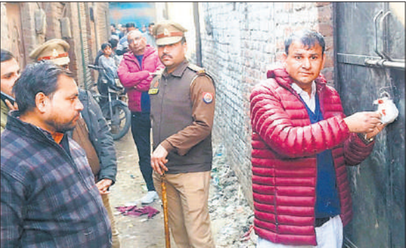
भट्टी के बाहर सील लगाते छापामरी टीम के सदस्य ।