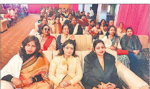
हिन्दू सम्मेलन में मौजूद लोग।