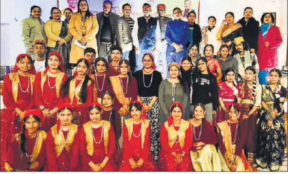
उत्सव में जनपदीय और मंडलीय प्रतियोगिताओं के दौरान मौजूद प्रतिभागी व अन्य ।

आयोजन में एकल गायन, समूह गायन, एकल नृत्य, समूह नृत्य, लोकगीत, बांसुरी वादन, तबला, सिंथेसाइजर, गिटार वादन, लोक नृत्य, नाटक, रामलीला मंचन आदि विधाओं में प्रतियोगिताएं हुईं। जनपद स्तरीय प्रतियोगिता में लोक नाट्य (रामलीला) में मंजरी लोक