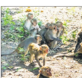
शाहबाद के एक्सचेंज में बंदरों का झुंड।

स्वार, बिलासपुर, मिलक, मसवासी सभी जगह बंदरों के झुंड लोगों को परेशान किए हुए हैं। स्वार के गांव में महिला छत पर कपड़े सुखा रही थी अचानक बंदरों का झुंड आ गया। बंदरों का झुंड देखकर महिला