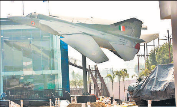
निर्माणधीन संग्रहालय में रखा फाइटर प्लेन का मॉडल ।

दो एकड़ से अधिक क्षेत्रफल में बने त्रिशूल संग्रहालय में फाइटर प्लेट मिग 27, एआरवी वीटी