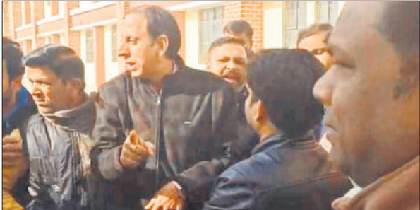
शिक्षकों से तीखी नोकझोंक करते अभिभावक।

सवाल पूछना हमारा अधिकार है। बताया कि सम्मेलन में सभी प्रधानों को बुलाया गया है ताकि पिछले 5 साल में किए विकास कार्य के विषय में भी चर्चा की जाए और आने वाले चुनाव को लेकर भी बातचीत हो। कहा कि सरकार ने 2021 में किसान आंदोलन के दौरान एमएसपी लागू करने की बात कही थी लेकिन अभी तक लागू नहीं हो पाई है। एमएसपी लागू होना उत्तर प्रदेश में बहुत जरूरी है। इस दौरान राकेश टिकैत का कई जगह जोरदार स्वागत भी किया गया।