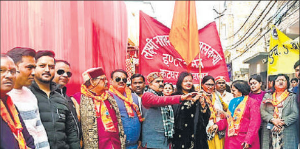
दौड़ के दौरान मौजूद मुख्य अतिथि जिपि अध्यक्ष डॉ. शेफाली चौहान व अन्य ।