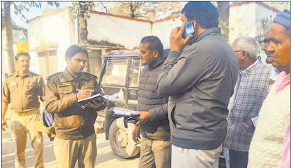
ब्लॉक परिसर में घटना के बारे में जानकारी करती पुलिस।