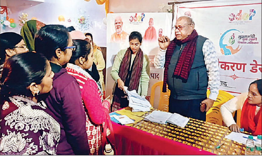
सीएम युवा हेल्प डेस्क में जानकारी लेते युवक और युवतियां।

इस व्यापक आयोजन के दौरान युवाओं को मुख्यमंत्री युवा उद्यमी विकास योजना (सीएम युवा योजना) के तहत उपलब्ध सुविधाओं, ऋण व्यवस्था और आवेदन प्रक्रिया की विस्तार से जानकारी दी गई। महज कुछ ही घंटों में 1072 इच्छुक प्रशिक्षार्थियों ने योजना के अंतर्गत आवेदन किया, जो यह दर्शाता है कि सरकार की नीतियों से प्रेरित होकर युवा अब स्वरोजगार और उद्यमिता की ओर तेजी से बढ़ रहे हैं।