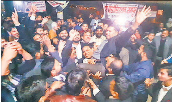
प्रत्याशियों की जीत पर खुशी मनाते अधिवक्ता।