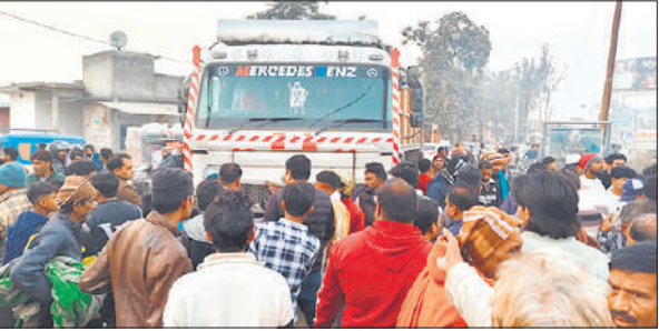
घटना स्थल पर लोगों की भीड़।