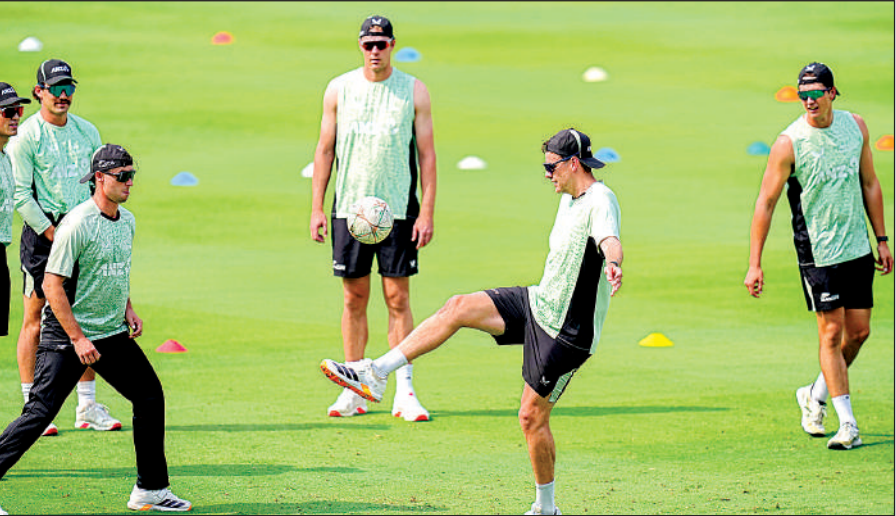
अश्यास सत्र के दौरान फुटबाल खेलते न्यूजीलैंड के खिलाड़ी।

भारतीय टीम पर हालांकि विश्व कप में अपने खिताब का बचाव करने और घरेलू धरती पर खेलने का दबाव होगा और सूर्यकुमार न्यूजीलैंड के खिलाफ श्रृंखला से पहले इन बातों पर जरूर गौर कर रहे होंगे। न्यूजीलैंड की टीम काफी