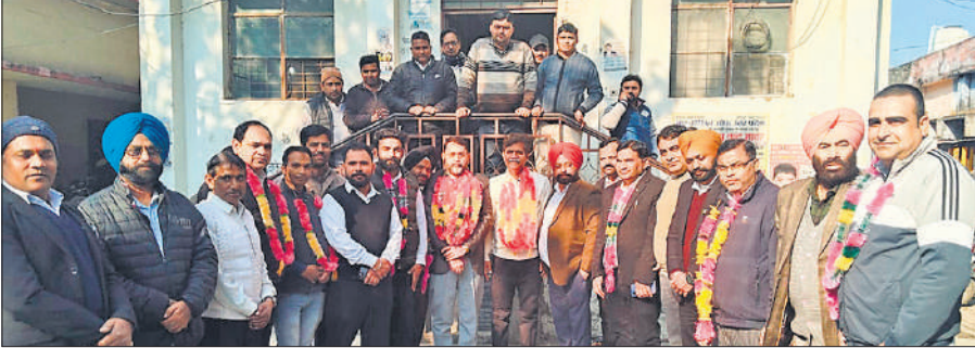
बिलासपुर में निर्वाचित कार्यकारिणी के साथ अधिवक्ता।