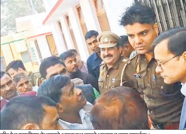
सीओ व एसडीएम के सामने अपना पक्ष रखते भाजपा व सपा समर्थक।