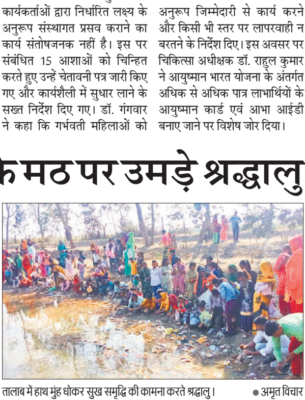
तालाब में हाथ मुंह धोकर सुख समृद्धि की कामना करते श्रद्धालु।

मठ के पुजारी ने बताया कि बूढ़े बाबा के मठ पर यह मेला अनेकों वर्षों से लगातार लगता चला आ रहा है। दूर-दराज के गांवों से आने वाले श्रद्धालु पहले मठ पर पहुंचकर बूढ़े बाबा के दरबार में प्रसाद चढ़ाते हैं और सुख-समृद्धि की कामना करते हैं। इसके बाद श्रद्धालु आनंद धाम आश्रम के तालाब में हाथ-मुंह