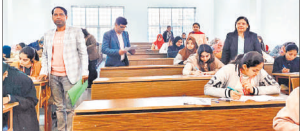
महाविद्यालय की परीक्षा में जांच पड़ताल करता उड़ाका दल के सदस्य । ● अमृत विचार