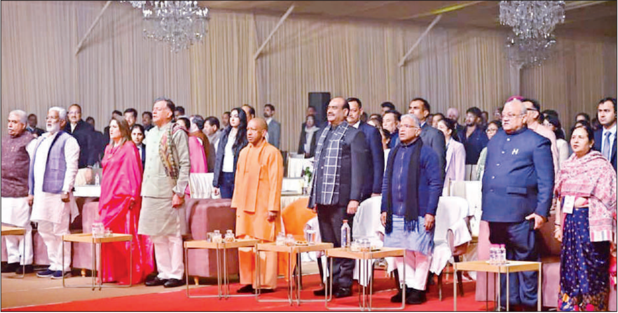
मुख्यमंत्री आवास पर आयोजित भोज के दौरान लोकसभा अध्यक्ष ओम बिरला, विधानसभा अध्यक्ष सतीश महाना, मुख्यमंत्री योगी आदित्यनाथ, मंत्री और अन्य पदाधिकारी।

■ सुप्रीम कोर्ट ने शिक्षक पात्रता परीक्षा (टीईटी) को लेकर स्पष्ट किया है कि बिना टीईटी उत्तीर्ण किए कोई भी शिक्षक योग्य नहीं माना जाएगा। अदालत ने कहा कि जिन शिक्षकों की सेवा में पांच वर्ष से अधिक समय शेष है, उनके लिए टीईटी पास करना अनिवार्य होगा। ऐसा न करने पर उन्हें इस्तीफा या अनिवार्य सेवानिवृत्ति का सामना करना पड़ सकता है। हालांकि, जिन शिक्षकों की सेवा में पांच वर्ष से कम समय बचा है, उन्हें इस शर्त से राहत दी गई है। अल्पसंख्यक शिक्षण संस्थानों पर यह आदेश लागू होगा या नहीं, इस पर निर्णय बड़ी पीठ करेगी। इस फैसले का असर देशभर में करीब 10 लाख और अकेले यूपी में लगभग 2 लाख शिक्षकों पर पड़ने का अनुमान है।