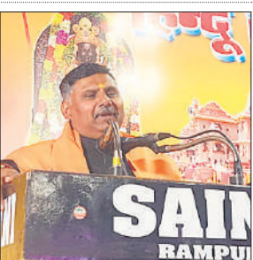
हिन्दू सम्मेलन में बोलते प्रांत प्रचारक।