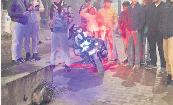
हयातनगर में पाँकियो पाइन मिलने के बाद पुलिस व अन्य लोग। ●अमृत विचार

और साथ ही वन विभाग को भी जानकारी दी गई, लेकिन तीन घंटे बाद भी वन विभाग की टीम मौके पर नहीं पहुंच सकी। घायल होने के कारण पाँकियो पाइन चलने की स्थिति में नहीं था। नाले में गिरने की आशंका को देखते हुए लोगों ने बांस लगाकर उसे सुरक्षित किया।