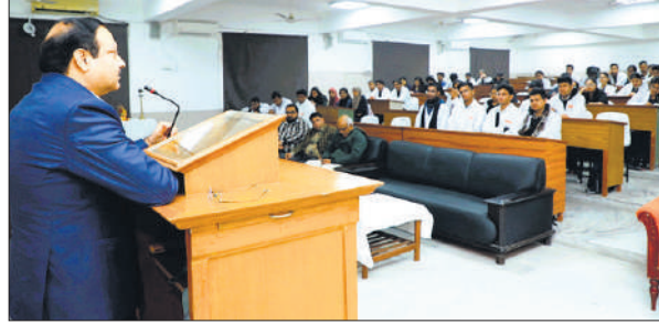
कार्यशाला में यातायात नियमों की जानकारी देते विशेषज्ञ।