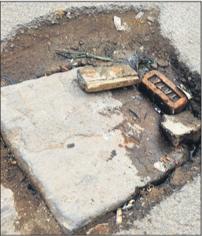
डिप की स्थिति खराब।

पर भी असर पड़ रहा है। कुछ लोगों ने बताया कि सड़क पर गंदा पानी भरा रहता है। इससे राहगीरों, स्कूली बच्चों, बुजुर्गों और महिलाओं को आने-जाने में भारी