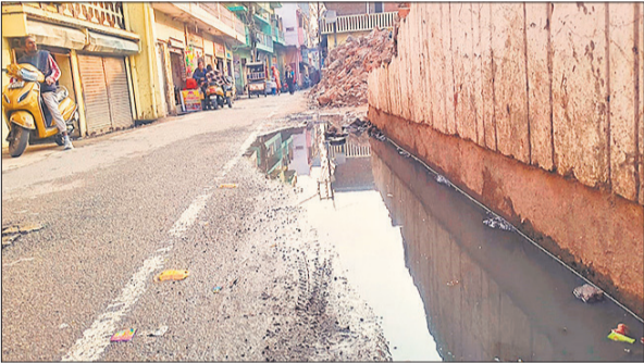
सड़क पर पानी भरे रहने से लोगों को आवाजाही में होती है परेशानी।

पुराना शहर सैलानी रोड मोहल्ला सूफी टोला बारादरी मस्जिद के समीप रहने वाले लोगों ने बताया कि कुछ दिनों पूर्व मोहल्ले में ही प्रशासन ने अवैध अतिक्रमण को बुलडोजर से तोड़ दिया था। मलबा नालियों में भर