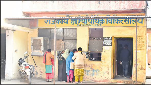
बदहाल स्थिति में राजकीय होम्योपैथिक चिकित्सालय।

चिकित्सालय के एक कमरे में अचमारी रखी है। दवाओं को भी इसी कमरे में स्टोर किया जाता है। उसी कमरे में डॉक्टर भी ओपीडी करते हैं। दूसरा कमरा फार्मासिस्ट