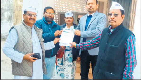
ज्ञापन सौंपते आम आदमी पार्टी के पदाधिकारी।

परेशानी का सामना करना पड़ रहा है। दोपहिया वाहन चालकों को फिसलन का खतरा बना रहता है, वहीं पैदल चलने वालों के कपड़े और जूते खराब हो रहे हैं।