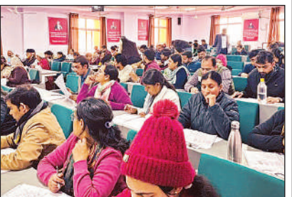
संविदा शिक्षण कार्य के लिए परीक्षा देते अभ्यर्थी।

अमृत विचार, लखनऊ : खाजा मुईनुद्दीन चिश्ती भाषा विश्वविद्यालय में स्वचिंतपोषित योजना के तहत विभिन्न पाठ्यक्रमों में 16 संविदा पदों पर भर्ती हेतु लिखित परीक्षा आयोजित की गई। परीक्षा के लिए कुल 142 अभ्यर्थियों ने आवेदन किया था, जिनमें से 103 अभ्यर्थी परीक्षा में सम्मिलित हुए। यह परीक्षा अंग्रेजी, हिंदी, इतिहास, संस्कृत, फ्रेंच, अर्थशास्त्र तथा कंप्यूटर साईंस एवं आईटी विषयों के लिए आयोजित की गई। विश्वविद्यालय ने परीक्षा परिणाम मंगलवार को घोषित करते हुए आधिकारिक वेबसाइट पर अपलोड कर दिया। अभ्यर्थियों से तीन दिनों के भीतर आपत्तियां आमंत्रित की गई हैं।