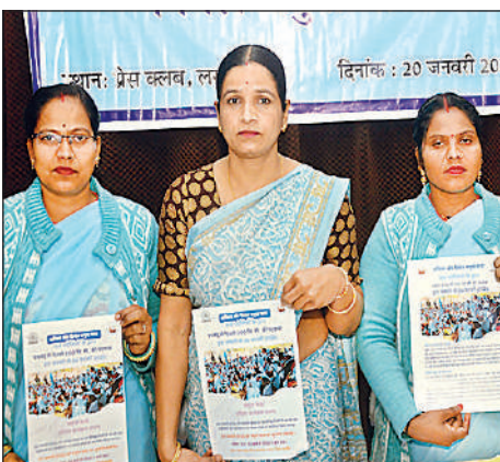
प्रेस वलब में पत्रकारों को जानकारी देती जल सहेलियां।

नॉकआउट राउंड में पहुंचने के लिए यूपी को पहले झारखंड फिर विदर्भ पर सीधी जीत दर्ज करनी होगी।