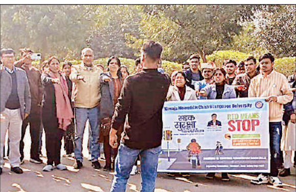
नुकड़ नाटक के माध्यम से सड़क सुरक्षा की शायश लेते छात्र व शिक्षक।