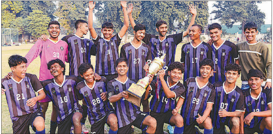
विजेता ट्राफी के साथ लखनऊ फॉल्कंस के खिलाड़ी।