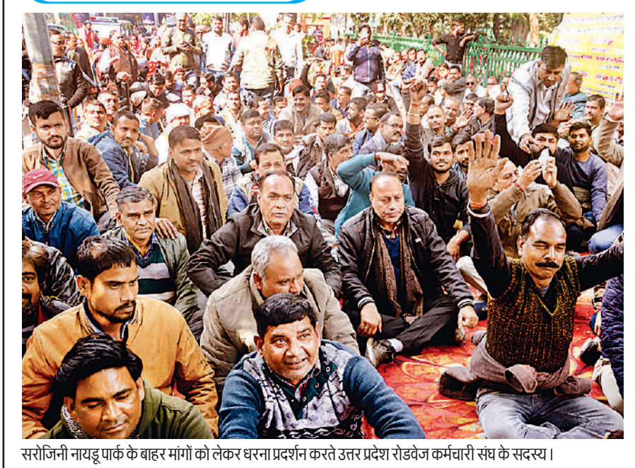
सरोजिनी नाथडू पार्क के बाहर मांगों को लेकर धरना प्रदर्शन करते उत्तर प्रदेश रोडवेज कर्मचारी संघ के सदस्य।