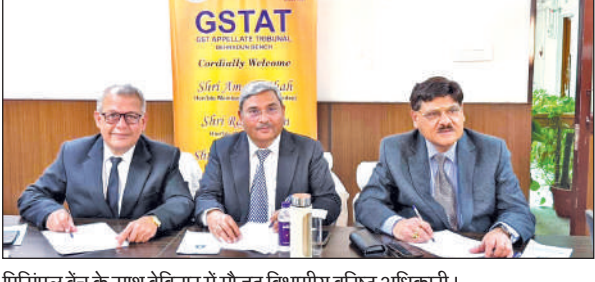
प्रिंसिपल बेंच के साथ वेबिनार में मौजूद विभागीय वरिष्ठ अधिकारी।

अधिकारियों के अनुसार, यह कदम जीएसटी व्यवस्था में विवाद