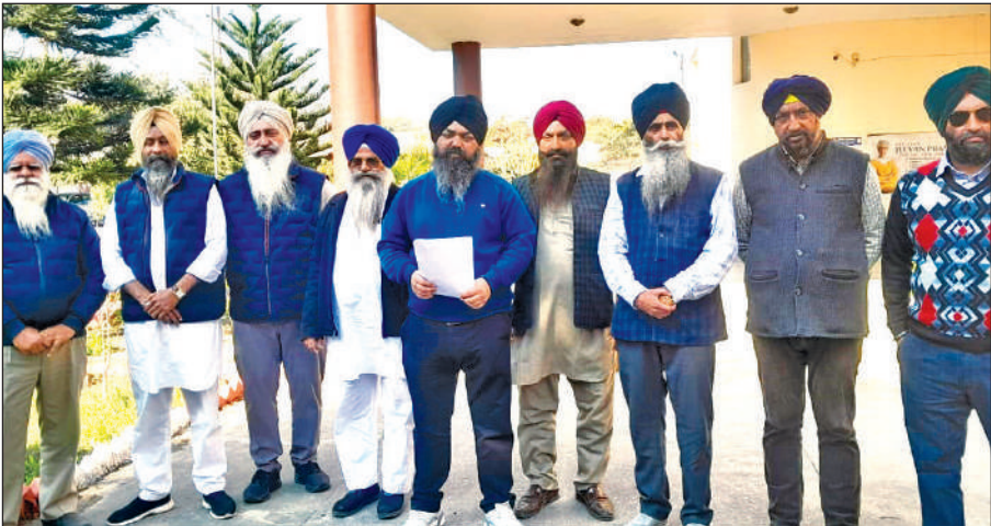
सब रजिस्ट्रार कार्यालय पहुंचे नोटिस प्राप्त डॉयरेक्टर। ● अमृत विचार

अमृत विचार: नानकमत्ता गुरुद्वारा प्रबंधक कमेटी में एक बार फिर विवाद की स्थिति पैदा होती जा रही है। जहां कमेटी के महासचिव ने कमेटी के 14 डॉयरेक्टरों को नोटिस देकर मीटिंग में नहीं आने का हवाला देते हुए स्पष्टीकरण मांगा है। जिससे भड़के डॉयरेक्टरों ने डीएम को संबोधित ज्ञापन उपनिबंधक रजिस्ट्रार को देकर प्रकरण की जांच कर निस्तारण करने का मुद्दा उठाया। आगाह किया कि यदि प्रशासन ने कोई कार्रवाई नहीं की तो सीएम से मुलाकात कर मुद्दा उठाया जाएगा। बुधवार को नोटिस प्राप्त 14 डॉयरेक्टर सब रजिस्ट्रार कार्यालय पहुंचे और सांकेतिक प्रदर्शन करते हुए डीएम को संबोधित ज्ञापन सब रजिस्ट्रार को सौंपा। उनका कहना था कि गुरुद्वारा प्रबंधक कमेटी में 24