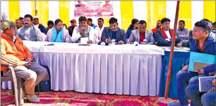
हवालबाग में आयोजित शिविर में ग्रामीणों की समस्याएं सुनते जलागम परिषद के उपाध्यक्ष।