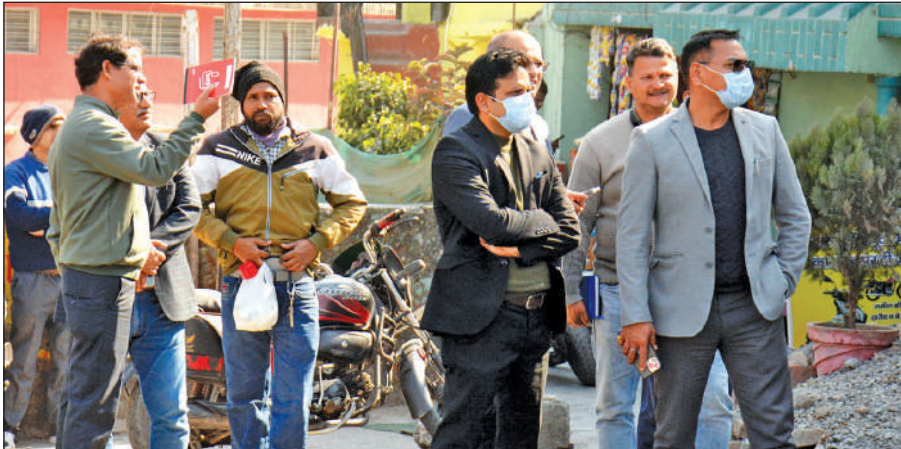
काठगोदाम में अतिक्रमण हटाने की कार्रवाई के दौरान मौजूद प्रशासन के अधिकारी।

अमृत विचार : जिला प्रशासन ने बुधवार को काठगोदाम में सड़क चौड़ीकरण की जद में आ रहे अतिक्रमण को ध्वस्त किया। ध्वस्तीकरण को देखते हुए कुछ अतिक्रमणकारियों ने खुद ही इमारतों पर घन चलाना शुरू कर दिया। इस पर प्रशासन ने स्वयं ही अतिक्रमण हटाने को 24 घंटे की मोहलत दी है। जिला प्रशासन की ओर से काठगोदाम तिराहे से गौला पुल तक सड़क चौड़ीकरण प्रस्तावित है। इसमें 4 करोड़ की लागत से लगभग 250 मीटर तक सड़क के बीचोबीच से दोनों तरफ 12-12 मीटर चौड़ीकरण किया जाएगा। इसमें ड्रेनेज सिस्टम, लाइटिंग के साथ ही मीडियन बनाई जाएगी। इसी क्रम में प्रशासन, लोनिवि, नगर निगम की संयुक्त टीम ने सर्वे किया जिसमें अधिकांश भवन नजूल भूमि, रेलवे भूमि पर खड़े किए गए थे। संयुक्त टीम ने सड़क के दोनों तरफ दो दर्जन से अधिक अतिक्रमण चिन्हित किए थे। इस पर प्रशासन ने सभी को नियमानुसार अतिक्रमण हटाने के नोटिस जारी किए। नोटिसों