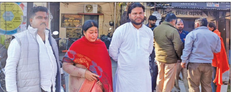
थाने में गुहार लगाने पहुंची लापता युवक की मां। ● अमृत विचार

की गिरफ्तारी का कोई इशारा नहीं मिला। जिसके बाद जहां कार्यकर्ता सोशल मीडिया पर बेहड़ के ऐलान का इंतजार कर रहे हैं, वहीं पुलिस की एलआईयू ने भी सोशल मीडिया पर उग्र आंदोलन को लेकर नजर बनानी शुरू कर दी है। बुधवार की शाम या फिर गुरुवार की सुबह विधायक बेहड़ क्या फैसला लेते हैं, हर किसी के जहन में यही सवाल उठ रहे हैं और पुलिस प्रशासन भी संजीदा हो गया है।