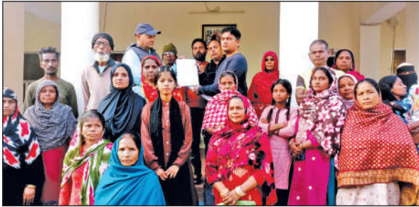
टनकपुर स्थित सीएम कैप कार्यालय में ज्ञापन सौंपते लोग। ● अमृत विचार

स्थानीय लोगों का कहना है कि यह मामला वर्तमान में उच्च न्यायालय में लंबित है। इसके बावजूद रेलवे द्वारा नोटिस चस्पा कर लोगों का मानसिक उल्टीड़न किया जा रहा है। मंगलवार को