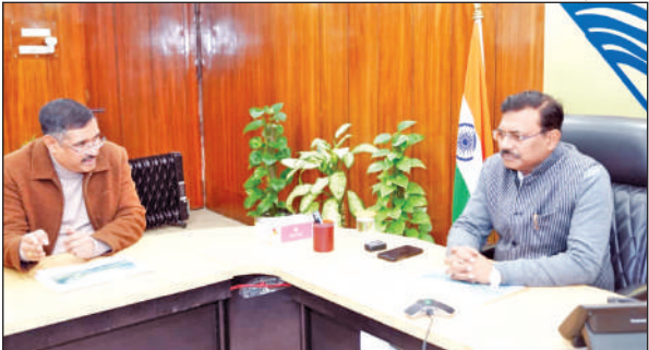
जमरानी बांध परियोजना की समीक्षा करते मुख्य सचिव आनंद बर्द्धन।

सिंचाई विभाग द्वारा निर्माणाधीन जमरानी एवं सौंग बांध परियोजनाओं की सीएस बर्द्धन बुधवार को सचिवालय में समीक्षा कर रहे थे। उन्होंने उत्तराखंड राज्य के लिए इन दोनों महत्वपूर्ण प्रोजेक्ट्स पर विस्तार से चर्चा की और दिशा-निर्देश दिए। कहा कि दोनों प्रोजेक्ट्स को समय पर पूर्ण किया जाना सुनिश्चित किया जाए। उन्होंने कहा कि इस सम्बन्ध में सभी निविदा एवं आवश्यक अन्य प्रक्रियाएं समय पर पूर्ण कर लिए जाएं। सम्पूर्ण परियोजना का फ्लो चार्ट तैयार कर तत्पक्ष चरण को निर्धारित समय पर पूर्ण कराया