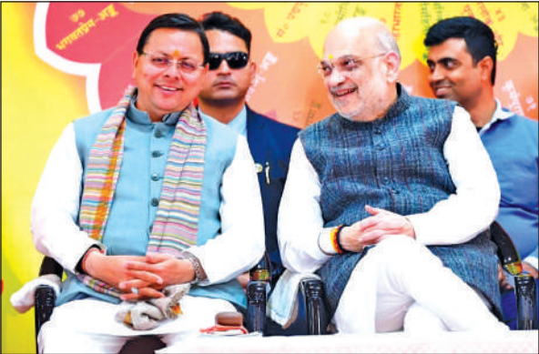
शताब्दी समारोह में केंद्रीय गृह मंत्री अमित शाह के साथ सीएम पुष्कर सिंह धामी।