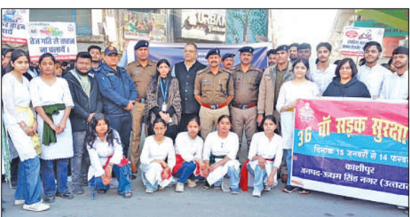
काशीपुर में नुककड़ नाटक टीम के साथ पुलिस अधिकारी।