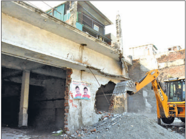
अतिक्रमण ध्वस्त करती जेसीबी।