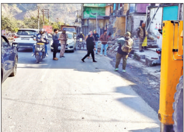
अतिक्रमण हटाने से पूर्व नपाई करते कर्मचारी। ● अमृत विचार