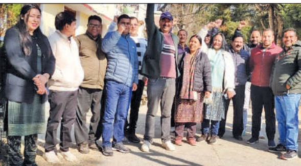
हवालबाग ब्लॉक कार्यालय में बुधवार को गेट मीटिंग कर विरोध जताते कर्मचारी।

गेट मीटिंग में विभिन्न विभागों के कर्मचारियों ने भाग लिया। कर्मचारियों का कहना था कि बार-बार मांग उठाने के बावजूद अब तक गोल्डन कार्ड से संबंधित विसंगतियां दूर नहीं की गई हैं। इसी प्रकार वेतन विसंगति की समस्या भी यथावत