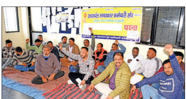
नगर निगम परिसर में धरना देते उत्तरांचल स्वच्छकार कर्मचारी संघ के सदस्य।