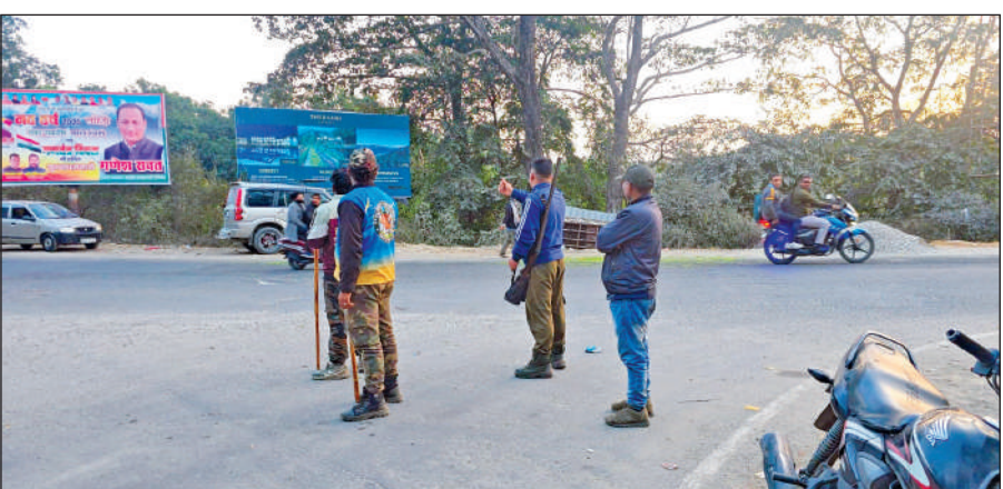
सायंकालीन भ्रमण पर निकलने वाले लोगों को रोकने के लिए तैनात किए गए वन कर्मी।