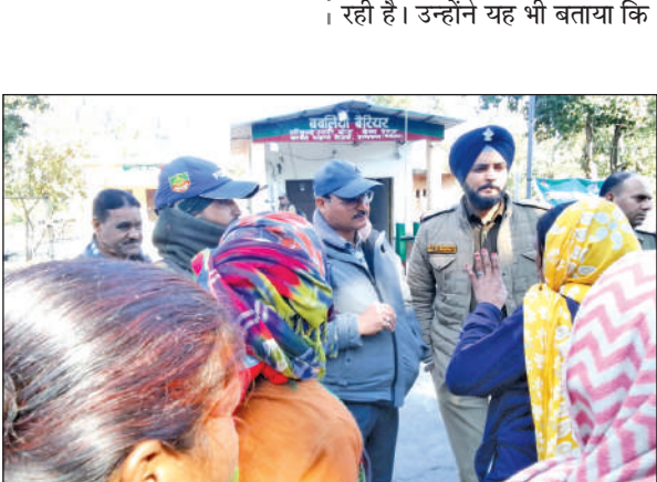
वन कर्मियों और पुलिस से उलझती महिलाएं।