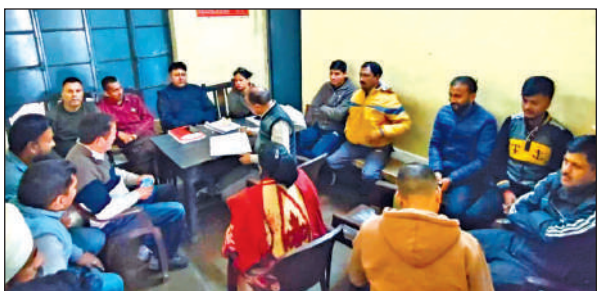
रोडवेज कर्मचारी संयुक्त परिषद हल्द्वानी ट्रैफिक शाखा की बैठक में मौजूद कर्मचारी।

अमृत विचार : रोडवेज कार्मिकों को लंबे समय से अनियमित वेतन का भुगतान किया जा रहा है। समय पर वेतन नहीं दिए जाने से रोडवेज कार्मिकों में आक्रोश है। उत्तरांचल रोडवेज कर्मचारी संयुक्त परिषद हल्द्वानी की ट्रैफिक शाखा ने बुधवार को बैठक में प्रमुख समस्याएं रखीं। कर्मचारियों ने समय पर वेतन नहीं दिए जाने को लेकर आक्रोश जताया। संगठन के पदाधिकारियों ने कहा कि कर्मचारियों को दिसंबर माह का वेतन नहीं दिया गया है, जबकि नवंबर का वेतन भी देरी के साथ बीते मंगलवार को जारी किया गया। कार्मिकों ने कहा कि वेतन नहीं मिलने से उन्हें आर्थिक परेशानियों का सामना करना पड़ रहा है। बताया कि परिवहन निगम की