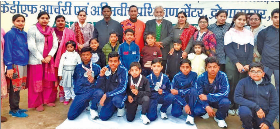
काशीपुर में विजेता खिलाड़ियों के साथ अतिथि।