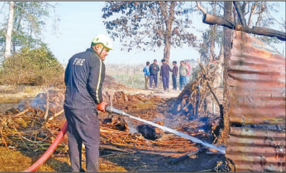
किच्छा में आग बुझाता दमकल कर्मी।