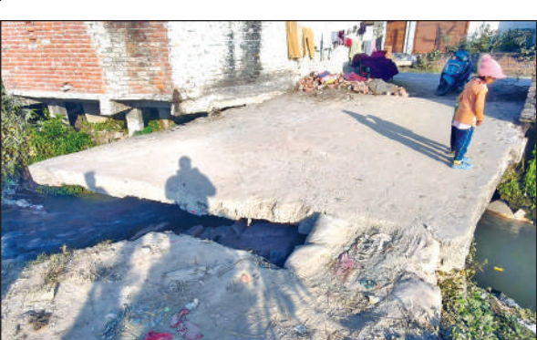
गदरपुर के वार्ड एक में क्षतिग्रस्त पुलिया।