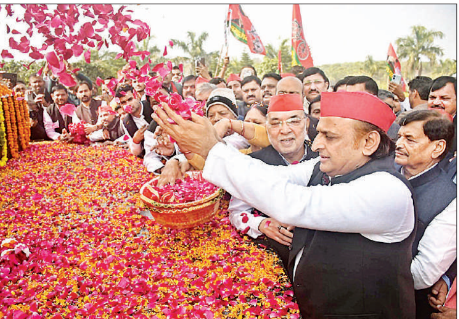
'छोटे लोहिया' के नाम से प्रसिद्ध स्व. जनेश्वर मिश्र की पुण्यतिथि पर लखनऊ स्थित जनेश्वर मिश्र पार्क में स्थापित आदमकद प्रतिमा पर सप्ताह प्रमुख अखिलेश यादव ने पुष्पांजलि अर्पित कर नमन किया, साथ में पार्टी के वरिष्ठ नेता शिवपाल व अन्य।

है। मुख्यमंत्री ने निर्देश दिए कि सभी विभाग अपनी-अपनी प्रक्रियाओं को एकीकृत डिजिटल प्लेटफॉर्म पर लाएं, स्पष्ट समयसीमा तय करें और ऑनलाइन व ऑटो-अप्रूवल सिस्टम को प्राथमिकता दें। उन्होंने कहा कि निरीक्षणों की संख्या घटाई जाए, पुराने व अप्रासंगिक नियम हटाए जाएं और हर सुधार की नियमित मॉनिटरिंग सुनिश्चित हो।