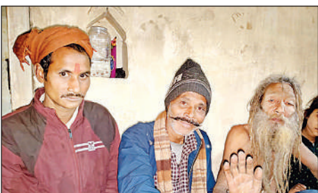
कार्यक्रम के बारे में जानकारी देते आयोजक।