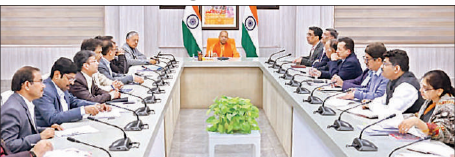
कमप्लायंस रिडक्शन और डी-रेगुलेशन फेज-II के तहत चल रहे सुधारों की उच्चस्तरीय समीक्षा करते मुख्यमंत्री योगी।

अमृत विचार: मुख्यमंत्री योगी आदित्यनाथ ने गुरुवार को प्रदेश में कमप्लायंस रिडक्शन और डी-रेगुलेशन फेज-II के तहत चल रहे सुधारों की उच्चस्तरीय समीक्षा की। उन्होंने स्पष्ट किया कि शासन का उद्देश्य आम नागरिकों और उद्यमियों को अनावश्यक प्रक्रियाओं, अनुमतियों और निरीक्षणों से राहत देकर भरोसे पर आधारित, पारदर्शी और समयबद्ध प्रशासन उपलब्ध कराना है। मुख्यमंत्री ने दो टुक कहा कि सुधारों का असर फाइलों में नहीं, बल्कि जमीन पर दिखना चाहिए और नागरिकों को यह अनुभव होना चाहिए कि व्यवस्था उनके लिए आसान हुई है। मुख्यमंत्री ने कहा कि कमप्लायंस रिफॉर्म के फेज-I में उत्तर प्रदेश ने