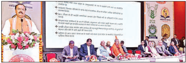
अंतरराष्ट्रीय संगोष्ठी को संबोधित करतेडिप्टी सीएम केशव मौर्य ।

अमृत विचार : स्वदेशी, विकास और विरासत के मुद्दे पर उप मुख्यमंत्री केशव प्रसाद मौर्य ने गुरुवार को आजमगढ़ की धरती से बड़ा संदेश दिया। जनपद दौरे पर पहुंचे डिप्टी सीएम का पुलिस लाइन में भाजपा नेताओं व कार्यकर्ताओं ने जोरदार स्वागत किया। इसके बाद वे नगर के हरिऔध कला भवन पहुंचे, जहां आयोजित अंतरराष्ट्रीय संगोष्ठी में शिरकत कर उन्होंने सरकार की उपलब्धियों के साथ 2047 के विकसित भारत का विजन साझा किया। प्रदेश के उप मुख्यमंत्री केशव प्रसाद मौर्य गुरुवार को नगर के हरिऔध कला केंद्र में आयोजित ब्रह्मर्षि स्वामी सहजानंद सेवा न्यास एवं महाराजा सुहेलदेव विश्वविद्यालय की ओर से आयोजित