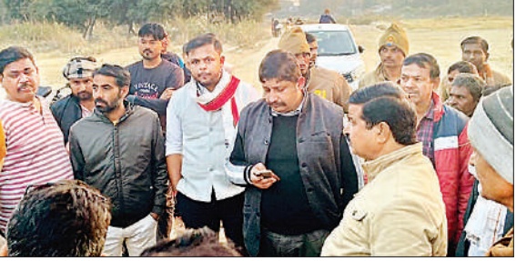
रेलवे पुल के नीचे का रास्ता बंद करने का विरोध करती ग्रामीणों के भीड़।