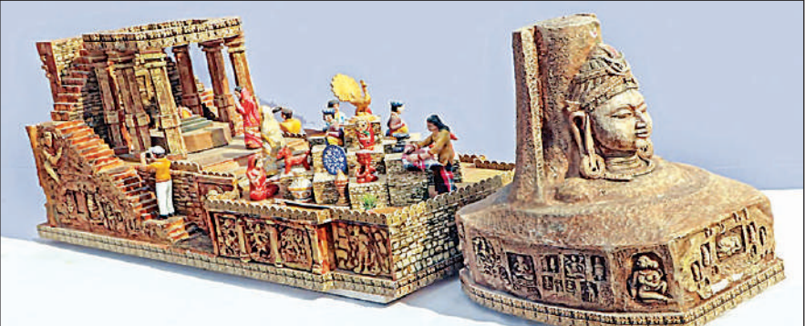
गणतंत्र दिवस पर नई दिल्ली में निकलने वाली परेड में यूपी के बुंदेलखंड की सांस्कृतिक विरासत की झांकी का मॉडल।

अमृत विचार: गणतंत्र दिवस के अवसर पर दिल्ली के कर्तव्य पथ पर आयोजित राष्ट्रीय परेड में उत्तर प्रदेश की झांकी इस वर्ष भी दर्शकों के आकर्षण का केंद्र बनेगी। मुख्यमंत्री योगी आदित्यनाथ के निर्देश पर तैयार यह झांकी बुंदेलखंड की गौरवशाली सांस्कृतिक विरासत और आधुनिक उत्तर प्रदेश की तेज विकास यात्रा को एक साथ प्रस्तुत करेगी। झांकी के माध्यम से यह संदेश दिया जाएगा कि प्रदेश अपनी परंपराओं को सहेजते हुए विकास की नई ऊंचाइयों को छू रहा है। झांकी के अग्रभाग में बुंदेलखंड के ऐतिहासिक कालिंजर दुर्ग