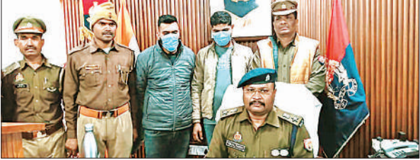
फर्जी फूड लाइसेंस के आरोप में गिरफ्तार आरोपियों के साथ पुलिस टीम।

अमृत विचार : कोतवाली उत्तरीला क्षेत्र में कूटरचित दस्तावेज तैयार कर फर्जी अनुज्ञापन (लाइसेंस) के सहारे मांस बिक्री कर धोखाधड़ी करने के मामले में पुलिस ने बड़ी कार्रवाई करते हुए दो अभियुक्तों को गिरफ्तार किया है। यह कार्रवाई हफीज फूड्स के नाम से अवैध रूप से संचालित मांस दुकान के प्रकरण में की गई है। प्रकरण में खाद्य सुरक्षा एवं मानक अधिनियम के अंतर्गत कराई गई जांच में यह तथ्य सामने आया कि हफीज फूड्स प्रोपराइटर के नाम से फर्जी अनुज्ञापन तैयार कर भैस के मांस