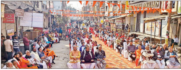
हिंदू सम्मेलन में उपस्थित लोग।

को सायंकाल पांच बजे एससीपीएम कॉलेज में महाराष्ट्र से आए 60 सदस्यीय कलाकारों द्वारा संघ की स्थापना से लेकर 100 वर्षों की यात्रा पर आधारित नाट्य मंचन प्रस्तुत किया जाएगा। वहीं 30 जनवरी को बभनजोत ब्लॉक में विशाल हिंदू सम्मेलन की रूपरेखा तय की गई है, जिसमें संघ के किसी वरिष्ठ अधिकारी के शामिल होने की संभावना है। जिला संयोजक ने बताया कि शताब्दी वर्ष के अवसर पर संघ ने पंच परिवर्तन का संकल्प लिया है, जिसमें पर्यावरण संरक्षण, कुटुंब प्रबोधन, सामाजिक समरसता, नागरिक कर्तव्य एवं स्वदेशी के विचारों को जन-जन तक पहुंचाने पर विशेष जोर दिया जा रहा है।