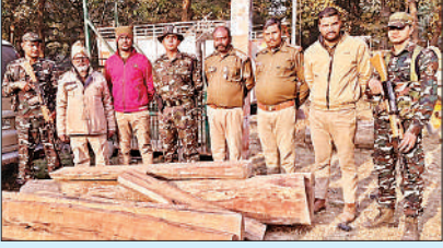
अवैध कटान की लकड़ी के साथ आरोपी।

बलरामपुर, अमृत विचार : नंदमहरा आरक्षित वन क्षेत्र में अवैध रूप से यूकेलिप्टस वृक्षों की कटान कर बिक्री के लिए बाहर ले जाने की साजिश का वन विभाग और पुलिस ने खुलासा