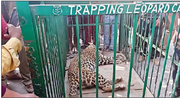
वन विभाग के पिंजरे में कैद पकड़ा गया तेंदुआ।