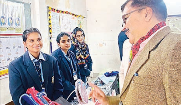
फपीएस में आयोजित विज्ञान प्रदर्शनी का अवलोकन करते निर्णायक व अतिथि।