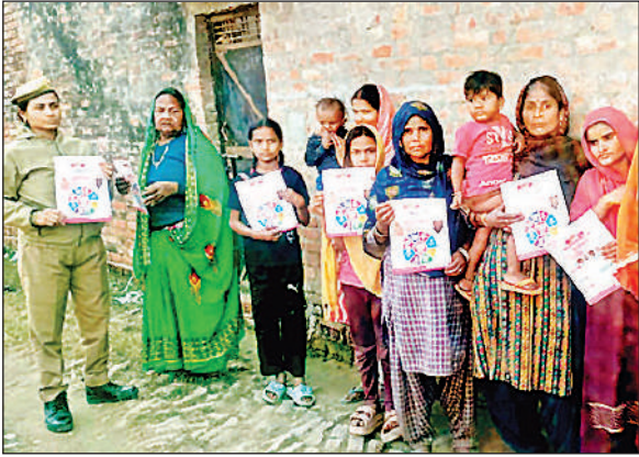
महिलाओं व किशोरियों को जागरूक करती महिला पुलिस।