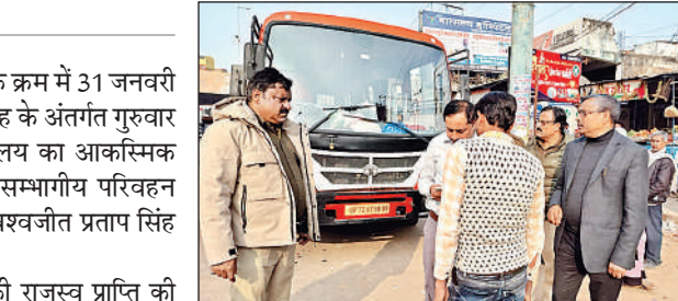
कार्यालय का निरीक्षण करते आरटीओ अयोध्या