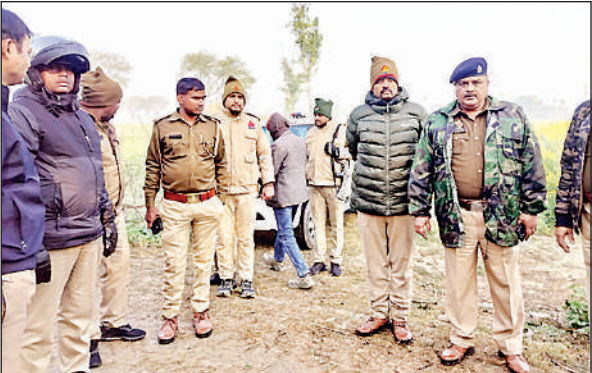
मुठभेड़ में शामिल पुलिस टीम।