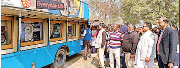
बस में लगी प्रदर्शनी देखते बच्चे व विद्यालय स्टॉफ।

अमृत विचार : बल्दीराय तहसील क्षेत्र के पुरुषोत्तम सिंह इंटर कॉलेज, सिंहनी में संस्कृति मंत्रालय भारत सरकार द्वारा संचालित आंचलिक विज्ञान नगरी तथा राष्ट्रीय संग्रहालय परिषद की इकाई के तत्वावधान में लखनऊ से आई सचल विज्ञान बस प्रदर्शनी का आयोजन किया गया। प्रदर्शनी का विषय 'दैनिक जीवन में मशीनें' रहा, जिसके अंतर्गत बस में लगाए गए 20 स्वचालित एवं हस्तचालित यंत्रों के माध्यम से विद्यार्थियों को बताया कि बच्चों में भ्रम की स्थिति कैसे उत्पन्न होती है और उसे विज्ञान के माध्यम से कैसे दूर किया जा सकता है। उन्होंने अम्लदृक्षार सूचक जैसे