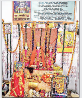
प्रभु श्रीराम का किया गया पुष्पाभिषेक।