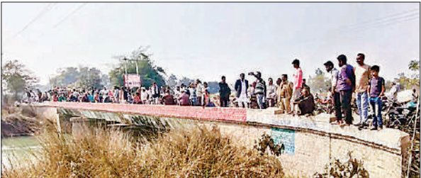
घटना के बाद नहर के पुल पर जुटी लोगों की भीड़।