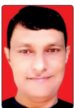
जयदेव राठी भराण खतर्त लेखक

की तलाश और भारतीय पौराणिक कथाओं में अमृत मंथन की कहानियां इस बात की गवाह हैं कि अमरता मानव की सबसे पुरानी आकांक्षाओं में से एक रही है। 21 वीं सदी में यह खोज पौराणिक कथाओं से निकलकर अत्याधुनिक प्रयोगशालाओं तक पहुंच चुकी है, जहां अरबों डॉलर की पूंजी और विश्व के श्रेष्ठ वैज्ञानिक इस प्रश्न से जूझ रहे हैं, क्या मनुष्य वास्तव में मृत्यु के विधान को बदल सकता है?