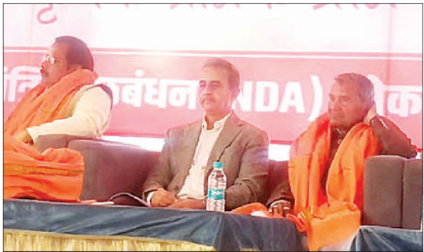
चौपाल में मौजूद केंद्रीय विदेश राज्य मंत्री कीर्तिवर्धन सिंह व अन्य जनप्रतिनिधि।

कीर्तिवर्धन सिंह ने कहा कि जिस कांग्रेस ने मनरेगा योजना में सिर्फ लूटने का काम किया उन्हे सुधार का मतलब नहीं समझ आ रहा है। केंद्रीय विदेश राज्यमंत्री ने कहा कि कांग्रेस का काम केवल झूठ बोलना और अड़ंगा लगाना है। उन्होंने वित्तीय व्यवस्था खत्म करने के कांग्रेस के आरोप को निराधार बताया और कहा कि पार्टी के कार्यकर्ताओं को जनता के बीच जाकर कांग्रेस के इस झूठ का जवाब देना है। उन्होंने कहा कि आवश्यकता के अनुरूप इस योजना में बदलाव किया गया है और नई