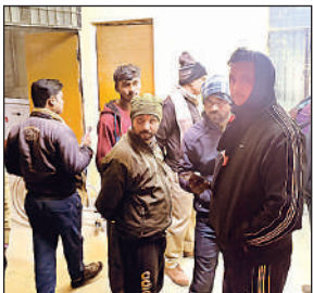
घटना के बाद सीएचसी पर मौजूद मृतक के परिजन व साथी।

घटना के बाद सीएचसी पर मौजूद मृतक के परिजन व साथी। अमृत विचार