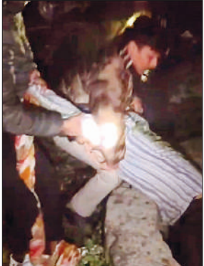
युवक को कुएं से निकालते सिपाही।