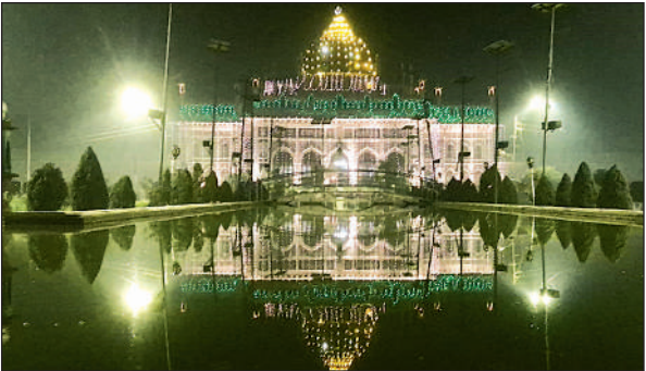
हजरत इमाम हुसैन के जन्मदिन पर रौशनी से नहाया छोटा इमामबाड़ा।

हजरत इमाम हुसैन के जन्मदिन पर रोजा-ए-काजमैन में जश्न-ए- फातेह कर्बला शीर्षक से आयोजित महफिल