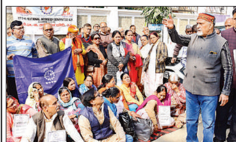
ईपीएफओ कार्यालय पर प्रदर्शन करते पेंशनर।