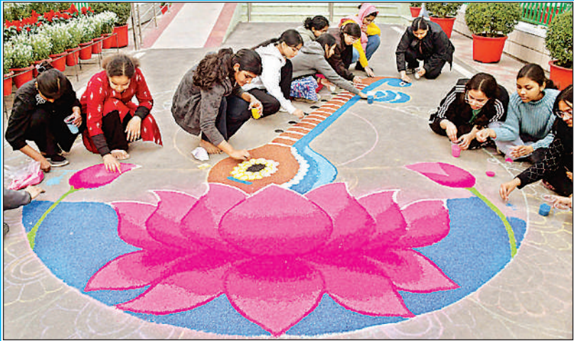
केजीएमयू में शुक्रवार को बसंत का उत्सव धूमधाम से मनाया जाएगा। इस दौरान सरस्वती का पूजन किया जाएगा। गुरुवार को प्रशानिक भवन के समक्ष पार्क में मेडिकल की छात्राओं ने फूलों से तरह-तरह की रंगोली सजाई और फिर रंगोली के साथ सेल्फी भी ली।