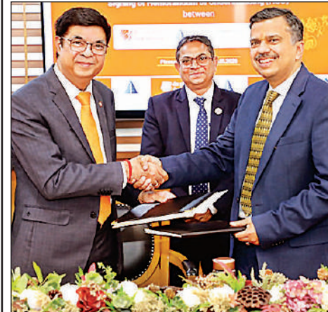
एमओयू का आदान प्रदान करते बैंक अधिकारी।