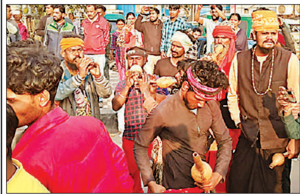
बीन बजाकर प्रदर्शन करते सपेरे।