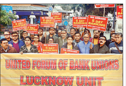
प्रदर्शन करते बैंक कर्मचारी।