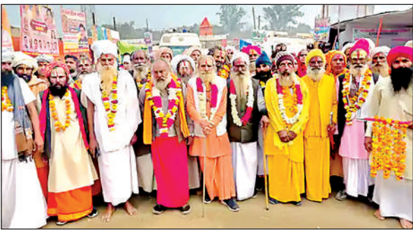
वैष्णव सम्प्रदाय की शोभायात्रा में शामिल संत।