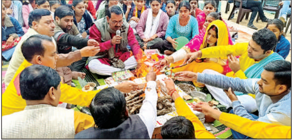
पीएम श्री राजकीय इंटर कॉलेज में हवन-पूजन करते शिक्षक। अमृत विचार

ऋतु के आगमन का प्रतीक भी है। जिसमें पीले वस्त्र पहनकर मां की पूजा की जाती है। उधर कुरारा कस्बे के पीएम श्री राजकीय इंटर कॉलेज में बसंत पंचमी के पावन अवसर पर शिक्षा, ज्ञान एवं कला की अधिष्ठात्री देवी मां सरस्वती की नवीन प्रतिमा का विधिवत