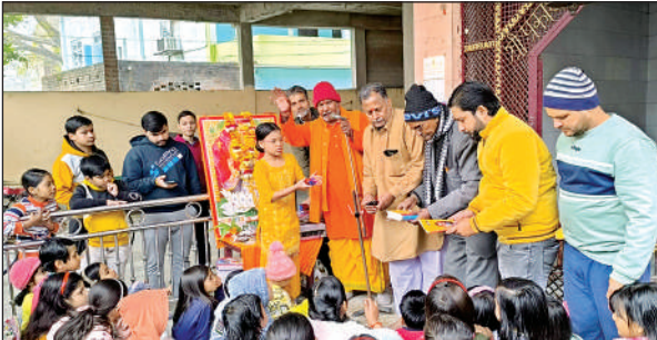
बच्चों को गिफ्ट देते लोग।

विद्यार्थी पीले वस्त्र पहने थे। उधर गुरसहायगंज में नगर के मोहल्ला अफसरी जीटी रोड स्थित बालाजी धाम हनुमान मंदिर में