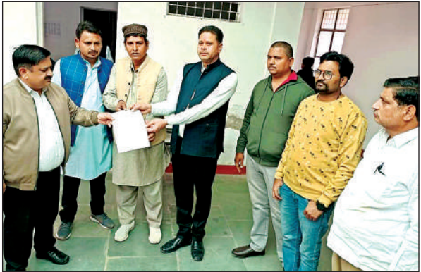
मौदहा एसडीएम को ज्ञापन देते नगर पालिका के ठेकेदार। अमृत विचार

● ठेकेदारों ने अधिकारियों पर लगाया सांठगांठ का आरोप