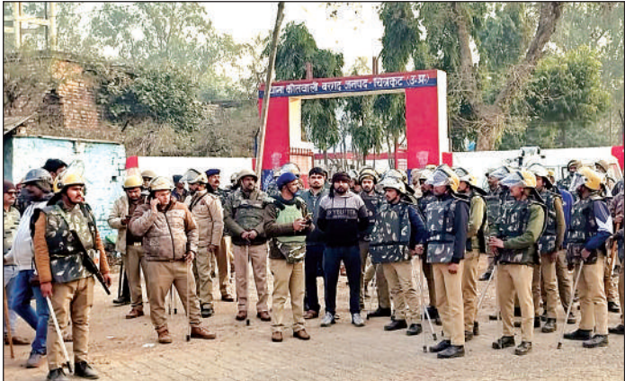
थाने के बाहर किसी भी घटना के लिए मुस्तैद पुलिस बल।