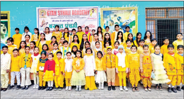
वसंत पंचमी पर पीले वस्त्रों में बच्चे।