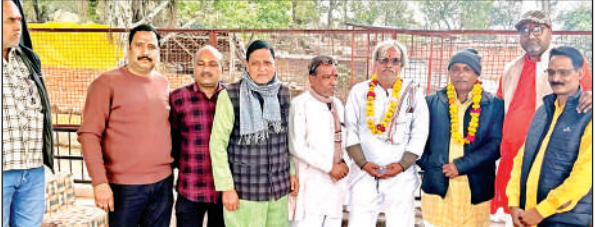
ब्राह्मण महासभा की बैठक में चुने गए पदाधिकारी।