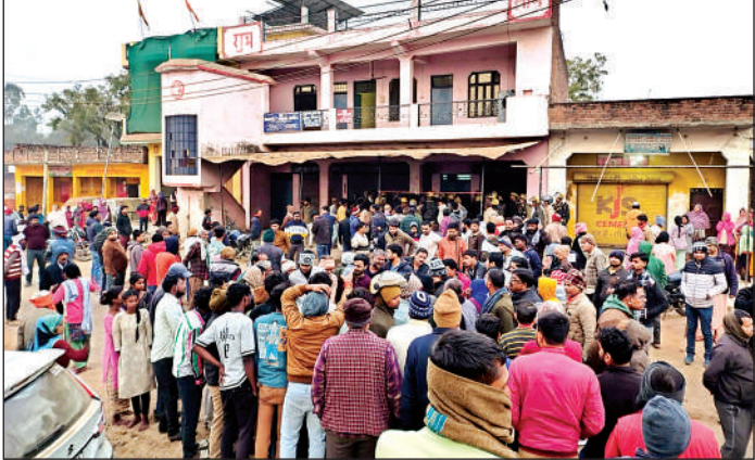
घटनास्थल पर लगी लोगों की भीड़।