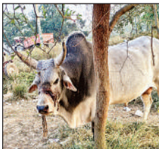
उन्नाव में नंदी के जबड़े में बंधी रस्सी और घाव।

उन्नाव के मियागंज ब्लॉक अंतर्गत राजबाग में क्रूरता से एक नंदी के मुंह में बांधी गई रस्सी खाल चीरते अंदर घुस गई। ब्लॉक व पंचायत को जानकारी हुई तो संसाधनों का अभाव बताया। अफसरों ने निर्देशित किया तो टीम बनी लेकिन पकड़ने का प्रयास किया तो विफल हो गए। इसके बाद प्रयास ही नहीं किया, न ही जिम्मेदारों ने दर्द से कराह रहे नंदी की सुध ली।