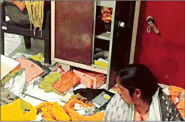
कमरे में खुली अलमारी और पास में फैला पड़ा सामान।

● घर में ताला लगाकर इलाज कराने कानपुर गया था पूरा परिवार