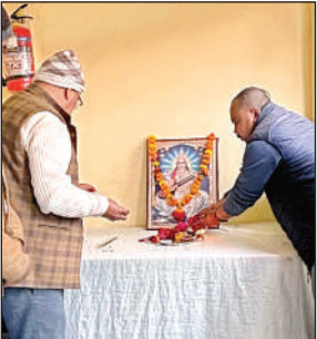
पूजा अर्चना करते प्रधानाचार्य व अन्य।