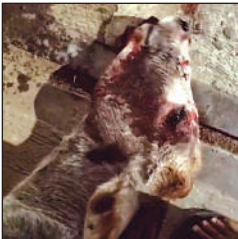
लखनऊ में हादसे में घायल गोवंश।

28 दिसंबर की रात करीब एक बजे लखनऊ के बलिंगटन में हादसे में घायल गोवंश तड़पता रहा। बराबर खून बहा। राहगीर करीब 45 मिनट तक नगर निगम और पशुपालन विभाग को फोन मिलाते रहे, लेकिन नहीं उठे। डीएम आवास पर भी जानकारी दी। रात ने उपचार सेवा न होने की वजह से कोई नहीं पहुंचा और कुछ देर बाद मौत हो गई।