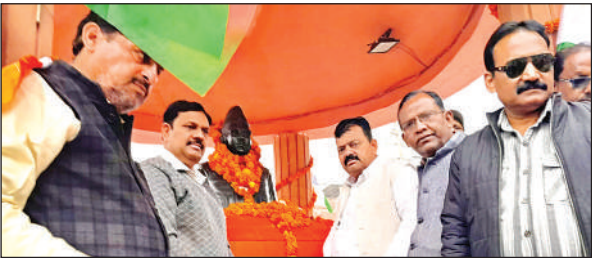
सुभाषचंद्र बोस की प्रतिमा पर पुष्प अर्पित करते डीएम व अन्य अधिकारी।

इस मौके पर जिलाधिकारी ने कहा कि नेता सुभाषचंद्र बोस का त्याग और बलिदान देश के इतिहास में स्वर्णिम अक्षरों में दर्ज है। नेताजी ने आजाद हिंद फौज की स्थापना कर देश के स्वाधीनता संग्राम को एक नई दिशा दी थी। आजादी के