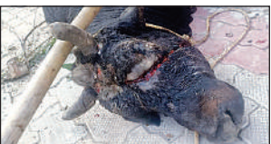
पीलीभीत में घायल सांड।

पीलीभीत के गांव नारायनपुर में आंख के पास धारदार हाथियार से घायल और गर्दन में कसी रस्सी से घाव व खून से लथपथ सांड को संसाधनों के अभाव में ग्रामीण स्तर से रेस्क्यू नहीं हो पाया। बराबर आनाकानी की। डीएम को जैसे ही सूचना मिली तो सीबीओ को निर्देशित करके 13 दिसंबर को नगर पालिका की टीम लगा दी। सांड को पकड़कर गोशाला भेजा गया और रस्सी काटकर उपचार किया गया।