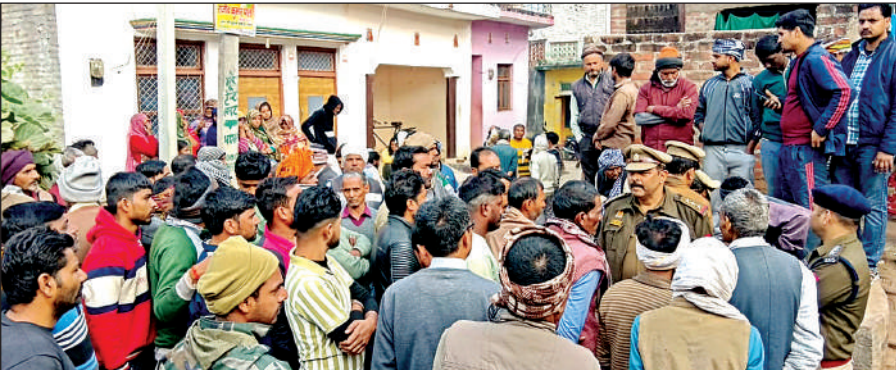
घटना के बाद मौके पर जमा लोगों की भीड़।