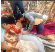
प्रयागराज में गाय के पेट में फंसा बच्चा निकालती टीम।

21 जनवरी को ग्राम बारा खास में निराश्रित गाय के पेट में बच्चा फंसा होने की सूचना पर संबंधित चिकित्सक मौके पर पहुंचे। टीम ने प्रयास किए, लेकिन बच्चा नहीं निकाल पाए। जिले स्तर पर सर्जरी की व्यवस्था नहीं थी। हालात बिगड़ने पर दूसरे दिन रात में डीएम के निर्देश पर टीम पहुंची। प्राथमिक उपचार दिया पर सर्जरी की व्यवस्था नहीं हो पाई। कुछ देर बाद मौत हो गई।