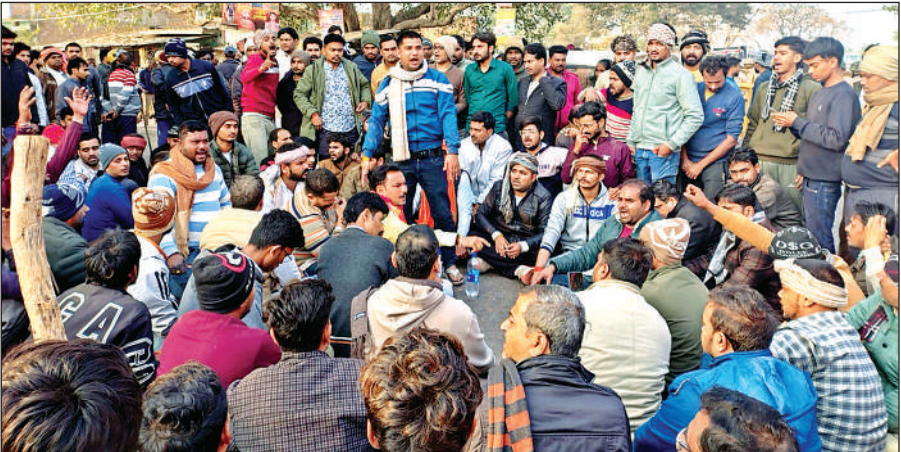
हाईवे पर जाम लगाकर बैठे आक्रोशित लोग।