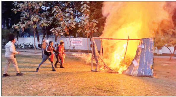
मॉकड्रिल के दौरान आग बुझाने का अभ्यास करती फायर ब्रिगेड टीम।