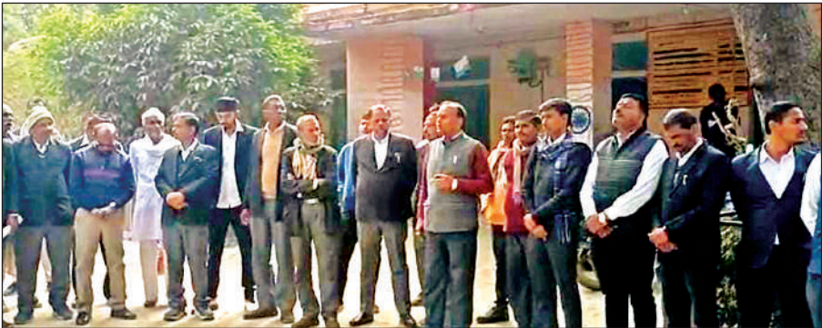
मासूम की मौत पर शोक व्यक्त करते अधिवक्ता।