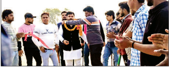
मुख्या अतिथि को सम्मानित करते आयोजक।