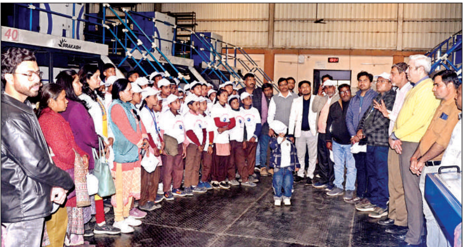
बरेली के भुता ब्लॉक से शैक्षिक भ्रमण पर आए छात्र-छात्राओं को अमृत विचार प्रिंटिंग प्रेस में अखबार छपने की प्रक्रिया समझाते हुए।

● बरेली के भुता ब्लॉक के जूनियर हाईस्कूल के 100 से अधिक छात्र-शिक्षक एक्सपोजर विजिट पर अमृत विचार कार्यालय पहुंचे