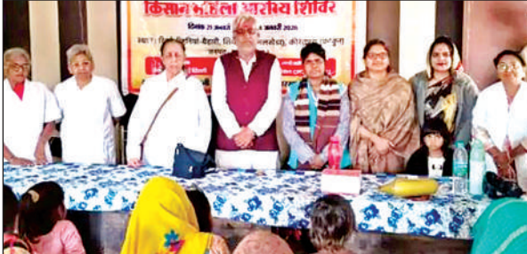
शिविर में जानकारी देती स्वास्थ्य टीम।

परेड रिहर्सल में सुबह से ही पुलिस प्रशासन परेड अभ्यास की तैयारियों में जुटा रहा। इस दौरान सशस्त्र पुलिसकर्मियों ने बैंड की धुन के साथ अभ्यास किया। एसपी ने बताया कि विगत वर्षों की भांति इस वर्ष भी गणतंत्र दिवस समारोह के अवसर पर पुलिस लाइन मैदान में परेड का आयोजन किया जाएगा।परेड को भव्य बनाने के लिए अधीनस्थों को निर्देश दिए गए हैं। यहां सीओ, प्रतिसार निरीक्षक, परेड में सम्मिलित पुलिस बल एवं अन्य अधिकारी, कर्मचारी उपस्थित रहे।