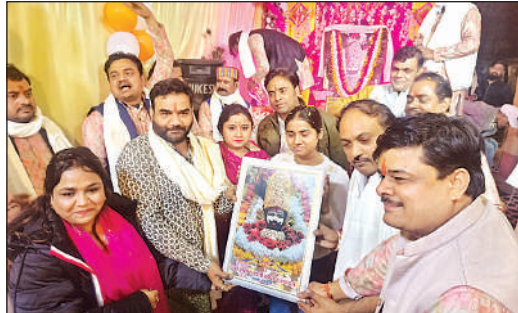
खाटू श्याम बाबा गुणगान कार्यक्रम में स्मृति चिह्न भेंट करते अतिथि।