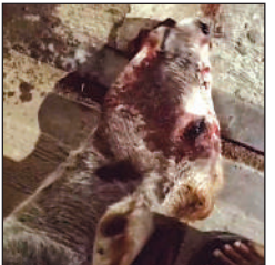
लखनऊ में हादसे में घायल गोवंश।

28 दिसंबर की रात करीब एक बजे लखनऊ के बलिंगटन में हादसे में घायल गोवंश तड़पता रहा। बराबर खून बहा। राहगीर करीब 45 मिनट तक नगर निगम और पशुपालन विभाग को फोन मिलते रहे, लेकिन नहीं उठे। डीएम आवास पर भी जानकारी दी। रात ने उपचार सेवा न होने की वजह से कोई नहीं पहुंचा और कुछ देर बाद मौत हो गई।