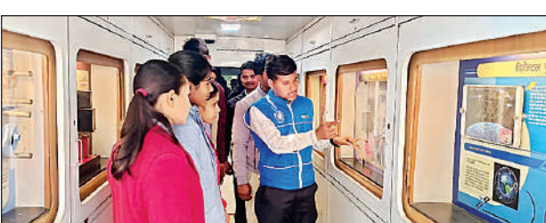
छात्र-छात्राओं को जानकारी देते तकनीकी सहायक।