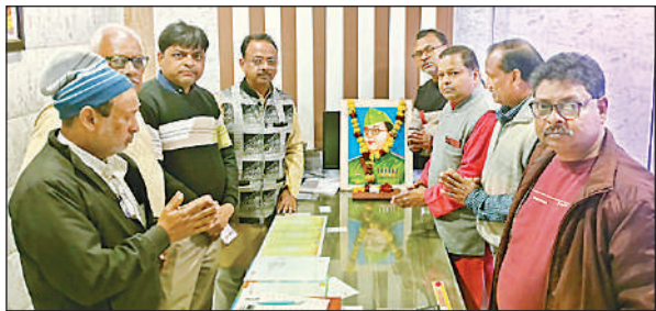
अयोध्या कायस्थ विकास संस्थान के जिला कार्यालय सोलापुरी सहभागज पर नेताजी सुभाष चंद्र बोस को नमन करते संगठन के पदाधिकारी।