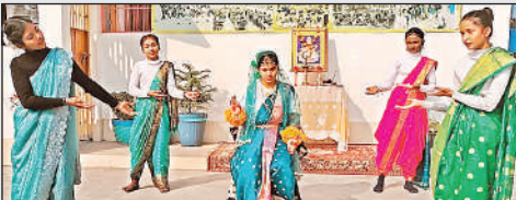
देवा पब्लिक स्कूल व देवा इंटर कॉलेज में बसंत पंचमी पर्व पर सांस्कृतिक कार्यक्रम प्रस्तुत करती छात्राएं।