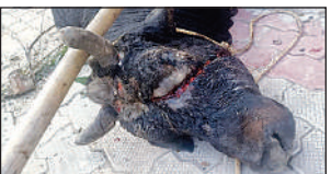
पीलीभीत में घायल सांड।

पीलीभीत के गांव नारायनपुर में आंख के पास धारदार हाथियार से घायल और गर्दन में कसी रस्सी से घाव व खून से लथपथ सांड को संसाधनों के अभाव में ग्रामीण स्तर से रेस्क्यू नहीं हो पाया। बराबर आनाकानी की। डीएम को जैसे ही सूचना मिली तो सीबीओ को निर्देशित करके 13 दिसंबर को नगर पालिका की टीम लगा दी। सांड को पकड़कर गोशाला भेजा गया और रस्सी काटकर उपचार किया गया।