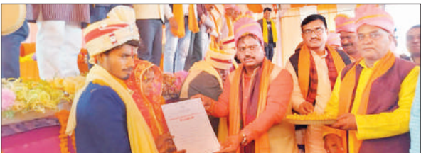
नवविवाहित जोड़ों के साथ विधायक चंद्रभानु पासवान।

कुल 190 जोड़ों के लक्ष्य के मुकाबले 180 जोड़ों का विवाह संपन्न हुआ, जबकि 780 जोड़ों ने ऑनलाइन आवेदन किया है।