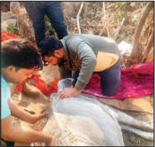
प्रयागराज में गाय के पेट में फंसा बच्चा निकालती टीम।

21 जनवरी को ग्राम बारा खास में निराश्रित गाय के पेट में बच्चा फंसा होने की सूचना पर संबंधित चिकित्सक मौके पर पहुंचे। टीम ने प्रयास किए, लेकिन बच्चा नहीं निकाल पाए। जिले स्तर पर सर्जरी की व्यवस्था नहीं थी। हालात बिगड़ने पर दूसरे दिन रात में डीएम के निर्देश पर टीम पहुंची। प्राथमिक उपचार दिया पर सर्जरी की व्यवस्था नहीं हो पाई। कुछ देर बाद मौत हो गई।