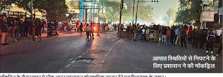
मॉकड्रिल के दौरान शहर में ब्लैक आउट एवं धायल को प्राथमिक उपचार देते एसडीआरएफ के जवान।