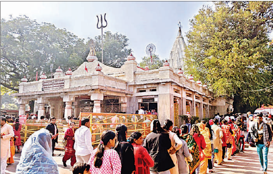
बसंत पंचमी के अवसर पर देवीपाटन शक्तिपीठ में लगी श्रद्धालुओं की कतार।