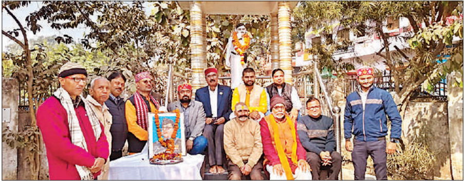
जयंती पर नेताजी सुभाष चंद्र बोस की याद करते क्रांतिकारी विचार मोर्चा के पदाधिकारी।