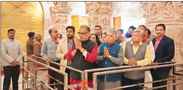
श्री राम मंदिर में दर्शन-पूजन करते रक्षा मंत्रालय की संसदीय समिति।