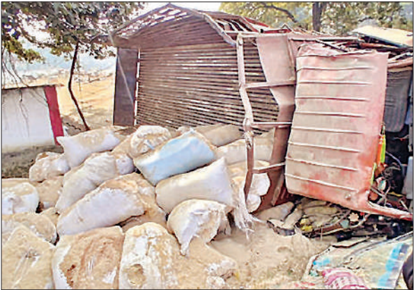
दुर्घटना स्थल पर पलटा वाहन व बिखरा सामान।