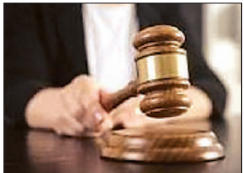
विधि संवाददाता, सुलतानपुर

10 हजार रुपये अर्थदंड की संपूर्ण राशि बतौर क्षतिपूर्ति पीड़िता को देने का आदेश