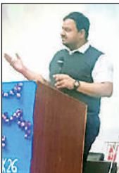
मेडिकल कॉलेज सदरपुर में आयुष्मान योजना को लेकर बैठक को संबोधित करते जिलाधिकारी।

बैठक में जनपद के समस्त संबंधित विभागों के अधिकारी, ग्राम प्रधान, रोजगार सेवक, कोटेदार, एएनएम तथा सीएचओ उपस्थित रहे। डीएम ने कहा कि शासन द्वारा निर्धारित तिथियों में विशेष आयुष्मान कार्ड शिविर का आयोजन करते हुए पात्र लाभार्थियों को शत-प्रतिशत कार्ड बनाए जाएं। ग्राम पंचायत स्तर पर पंचायत भवन, आयुष्मान आरोग्य मंदिर में शिविर