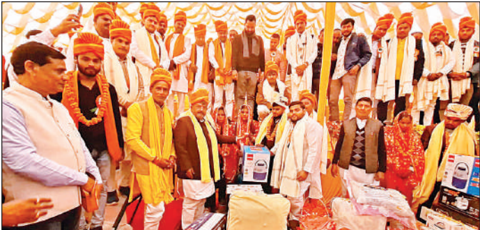
मवई में आयोजित सामूहिक विवाह समारोह में जोड़ों को आशीर्वाद देते विधायक रामचंद्र यादव।

अमृत विचार : मुख्यमंत्री सामूहिक विवाह योजना के अंतर्गत शुक्रवार को मवई ब्लॉक क्षेत्र के राजकीय आयुर्वेदिक मेडिकल कॉलेज परिसर मांजनपुर में सामूहिक विवाह समारोह का आयोजन किया गया। वैदिक मंत्रोच्चार, शहनाइयों की गूंज और पारंपरिक रीति-रिवाजों के बीच 126 जोड़े परिणय सूत्र में बंधे और नए जीवन की शुरुआत की। मुख्य अतिथि रुदौली विधायक रामचंद्र यादव ने नवविवाहित जोड़ों को आशीर्वाद देते हुए कहा कि मुख्यमंत्री सामूहिक विवाह योजना