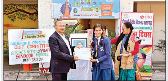
प्रतियोगिता में बेहतर प्रदर्शन करने वाली छात्रा को सम्मानित करते प्रधानाचार्य।