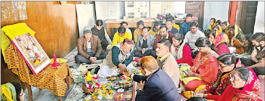
एमएलके पीजी कॉलेज में सरस्वती पूजन करते प्राचार्य, शिक्षक व अन्य।