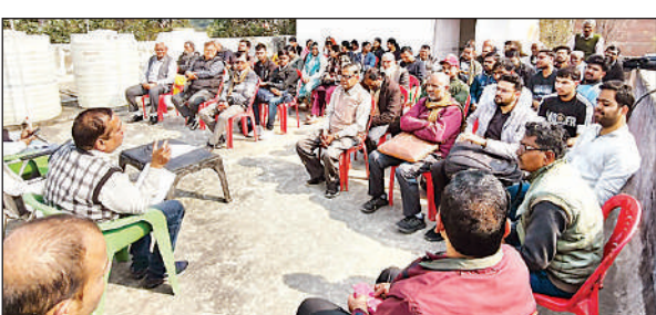
डाक अधीक्षक कार्यालय प्रांगण में आयोजित बैठक में शामिल कर्मचारी।