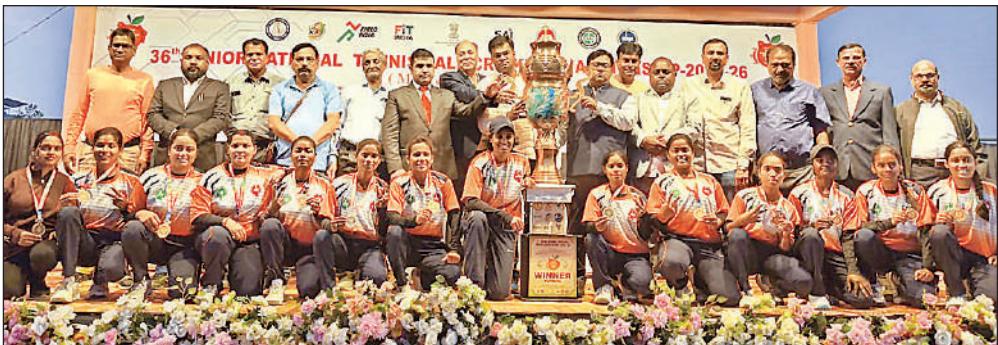
सीनियर नेशनल टेनिस बॉल क्रिकेट प्रतियोगिता की विजेता रही बालिका उग्र टीम ट्रॉफी के साथ।