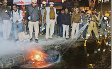
अयोध्या, अमृत विचार। शहर में शुक्रवार शाम ठीक छह बजे हूटर बजा और शहर अंधेरे में डूब गया। सड़क पर चार-पांच लोग घायलवस्था में पड़े हुए थे। मौके पर पहुंचे एसडीआरएफ व पुलिस के जवानों ने सभी का प्राथमिक उपचार शुरू किया। कॉल होते ही पांच मिम्ट के अंदर ही एंबुलेंस व फायरब्रिगेड के वाहन पहुंचे। घायलों को अस्पताल पहुंचाया गया व मौके पर लगी आग को बुझाया गया। इसके बाद ब्लैक आउट समाप्त हुआ। यह सीन सिविल लाइंस स्थित तहसील तिराहा का था। जहां युद्ध, हवाई हमले व आपातकालीन