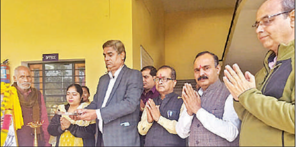
बसंतोत्सव कार्यक्रम के दौरान पूजन करते अतिथि ।