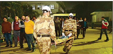
एनटीपीसी टांडा में मॉक ड्रिल करते सीआईएसएफ के जवान ।

सायरन बजाकर हवाई हमले की चेतावनी का अभ्यास किया गया, तत्पश्चात जनपद के विभिन्न क्षेत्रों में ब्लैकआउट की स्थिति उत्पन्न कर नागरिकों को सुरक्षित स्थानों पर शरण लेने, आग लगने की स्थिति में निर्यंजन, घायलों के प्राथमिक उपचार और सुरक्षित निकासी की कार्यवाही का प्रदर्शन किया गया।