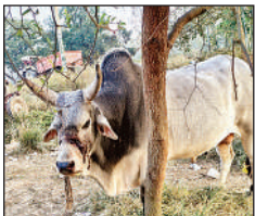
उन्नाव में नंदी के जबड़े में बंधी रस्सी और घाव।

उन्नाव के मियागंज ब्लॉक अंतर्गत राजबाग में क्रूरता से एक नंदी के मुंह में बांधी गई रस्सी खाल चीरते अंदर घुस गई। ब्लॉक व पंचायत को जानकारी हुई तो संसाधनों का अभाव बताया। अफसरों ने निर्देशित किया तो टीम बनी लेकिन पकड़ने का प्रयास किया तो विफल हो गए। इसके बाद प्रयास ही नहीं किया, न ही जिम्मेदारों ने दर्द से कराह रहे नंदी की सुध ली।