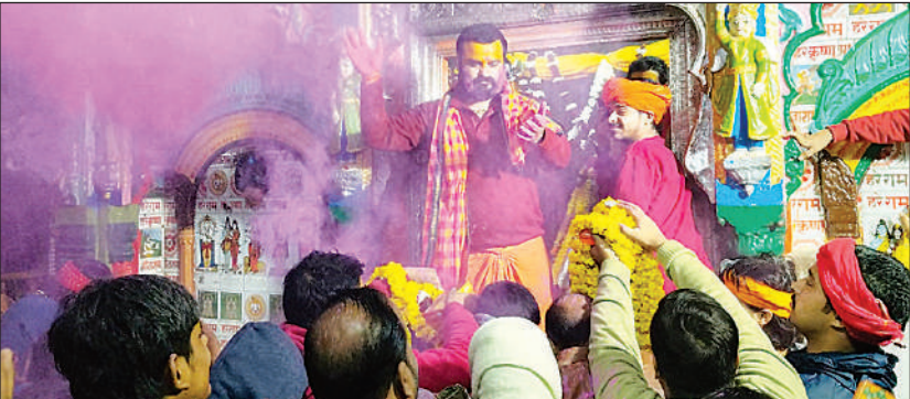
हनुमानगढ़ी मंदिर में श्रद्धालुओं पर अबीर उड़ाने पुजारी।

बसंत उत्सव पर अयोध्या के प्राचीन नागेश्वर नाथ, कनक भवन, राम वल्लभा कुंज, 5000 मंदिरों में भी धार्मिक