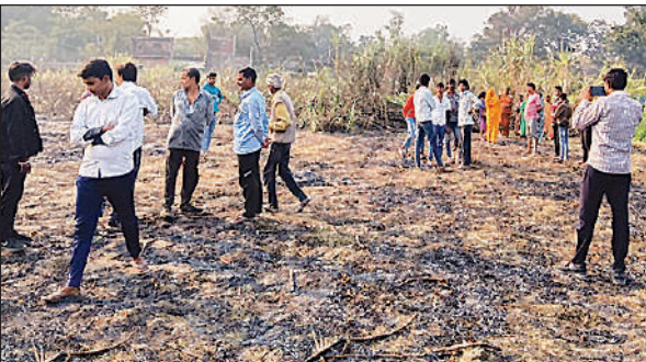
आग लगने से जलकर राख हुई गन्ने की फसल।