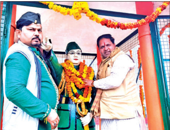
नेताजी सुभाष चंद्र बोस की प्रतिमा पर माल्यार्पण करते मेयर।