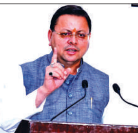
मुख्यमंत्री पुष्कर सिंह धामी।

अमृत विचार: मुख्यमंत्री पुष्कर सिंह धामी के नेतृत्व में राज्य सरकार ग्रामीण क्षेत्रों के समग्र विकास को प्राथमिकता दे रही है। इसी क्रम में जनपद चम्पावत के लोहाघाट विधानसभा क्षेत्र अंतर्गत विकासखंड पाटी में स्थित धूनाघाट-बसौट मोटर मार्ग के नवनिर्माण (द्वितीय चरण, स्टेज-1) के लिए प्रशासकीय एवं वित्तीय स्वीकृति प्रदान की गई है। मुख्य अभियंता क्षेत्रीय कार्यालय, लोक निर्माण विभाग अल्मोड़ा द्वारा प्रस्तुत विस्तृत आगणन के आधार पर तीन किलोमीटर लंबे इस मोटर मार्ग के निर्माण हेतु 83.46 लाख