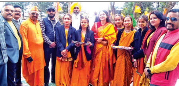
सरस्वती शिशु विद्या मंदिर लामाचौड़ में आयोजित कार्यक्रम के दौरान मौजूद लोग।