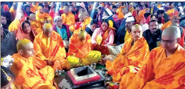
बसंत पंचमी पर गायत्री शक्तिपीठ, हल्द्वौड़ में उपनयन संस्कार में मौजूद बटुक।