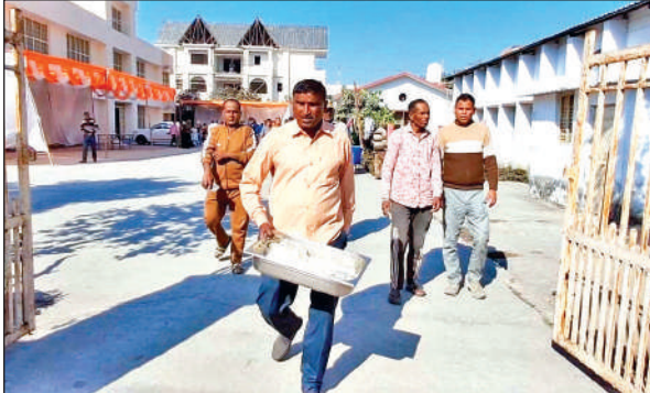
गुस्से में बासी चावल फेंकने जाता पीआरडी जवान ।● अमृत विचार

26 जनवरी परेड की तैयारियों को लेकर जिले की सात तहसील से करीब 50 पीआरडी जवानों के रहने और खाने की व्यवस्था जिला युवा कल्याण विभाग द्वारा पुलिस लाइन के सामने स्थित युवा भवन में रखी गई है। सुबह उठते ही पीआरडी के जवान पुलिस लाइन जाते हैं और परेड की तैयारी करते हैं। गुरुवार की दोपहर को उस वक्त बखेड़ा खड़ा हो गया, जब जवानों ने दोपहर के खाने का बहिष्कार करते हुए गुणवत्ता पर ही सवाल खड़ा कर दिया। आरोप था कि खाने में जिस चावल को खिलाया जा रहा है, वह दो से दिन पुराना है। चावलों से बदबू आ रही है। यही नहीं सुबह का नाश्ता हो या फिर दोपहर व रात का खाना, गुणवत्तायुक्त नहीं है। जिसे