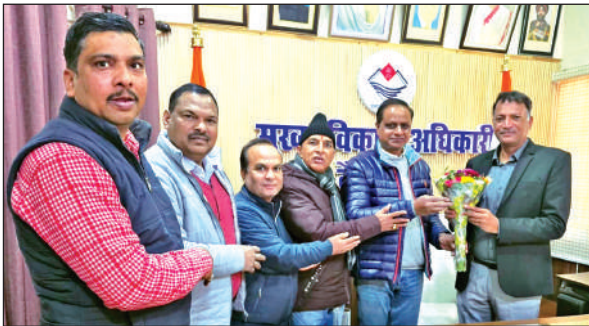
सीडीओ से मुलाकात करते कर्मचारी। ● अमृत विचार

● मांगों के निस्तारण में की जा रही हीलाहवाली पर किया रोष व्यक्त संवाददाता, भीमताल