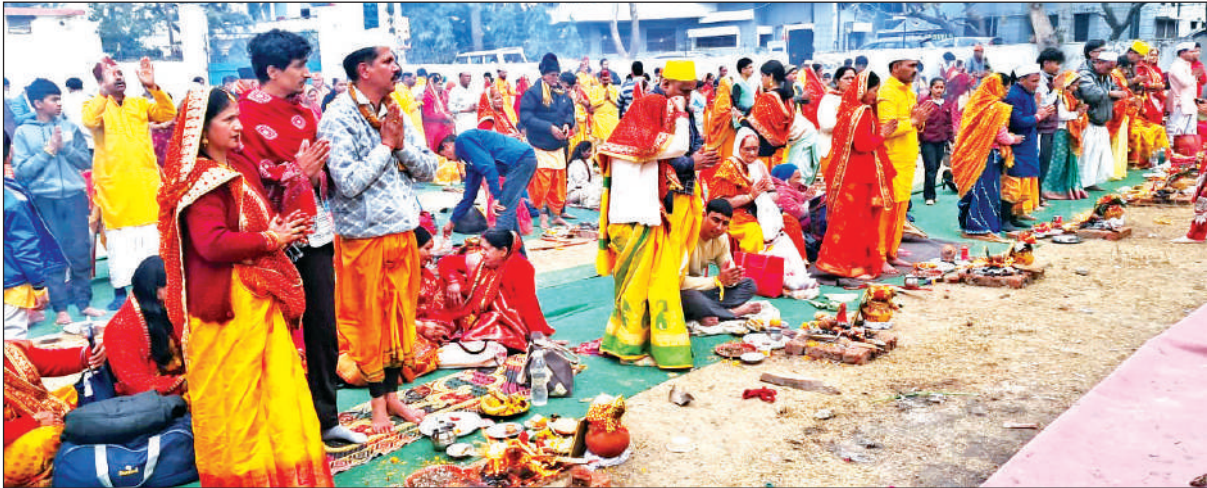
हल्द्वानी के हीरा नगर स्थित गोल्ज्यू मंदिर में बसंत पंचमी पर पूजा अर्चना करते श्रद्धालु। ● अमृत विचार

कार्यक्रम में पंद्रह स्थानीय स्कूलों की टीमों ने लोक नृत्य प्रतियोगिता में