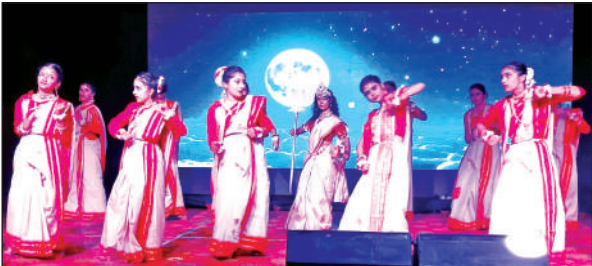
मंच पर उत्तराखंड की संस्कृति पर आधारित लोक गीत प्रस्तुत करते कलाकार।