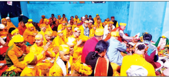
संस्कृत विद्यापीठ रामनगर में बटुकों का सामूहिक यज्ञोपवीत कराते आचार्य।

कार्यक्रम में विभिन्न राज्यों से अभिभावक अपने पाल्यों के यज्ञोपवीत संस्कार को विद्यापीठ पहुंचे थे। वैदिक अनुष्ठानों का