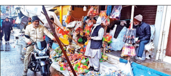
बारिश के दौरान मेले में दुकान पर खड़ा माथूस दुकानदार।