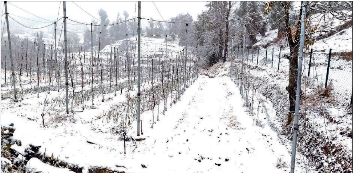
शुक्रवार को धारी के मनाघेर क्षेत्र में हुई बर्फबारी का नजारा। ● अमृत विचार

हल्द्वानी : शुक्रवार को मौसम बदलते ही शहर की बिजली व्यवस्था प्रभावित हो गई। बारिश और ठंडी हवाओं के बीच कहीं केबल बॉक्स फट गया तो कहीं बिजली के तार टूट गए, जिससे बसंत पंचमी के दिन कड़ाके की ठंड में दिनभर बिजली आपूर्ति ठप होती रही।