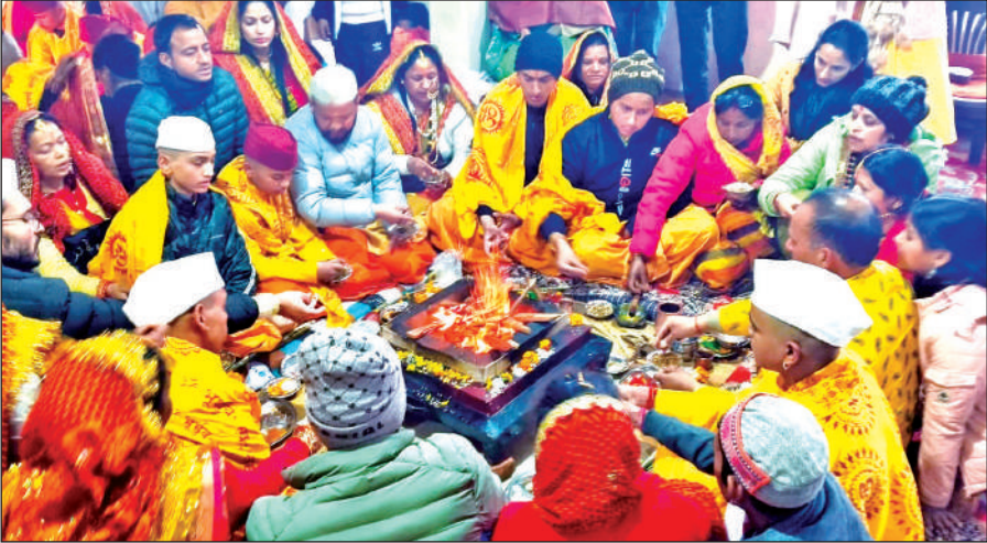
अल्मोड़ा में शुक्रवार को गायत्री प्रज्ञा पीठ में जनेऊ संस्कार कराते बटुक।