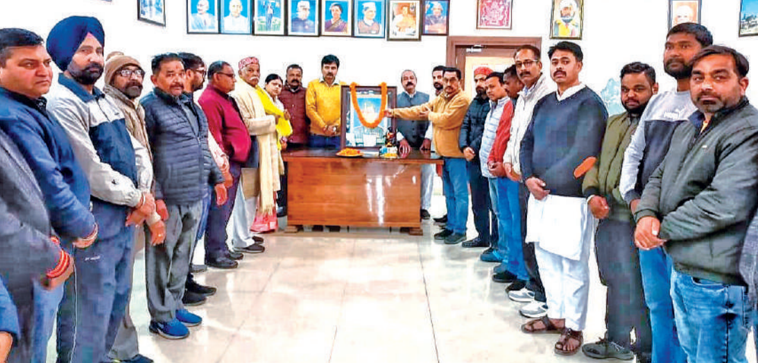
किच्छा में नेताजी सुभाष चंद्र बोस की जयंती मनाते कांग्रेस कार्यकर्ता।