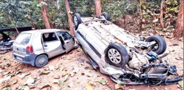
कालाढूंगी – बाजपुर हाईवे पर भिड़ंत के बाद क्षतिग्रस्त हुई कारें