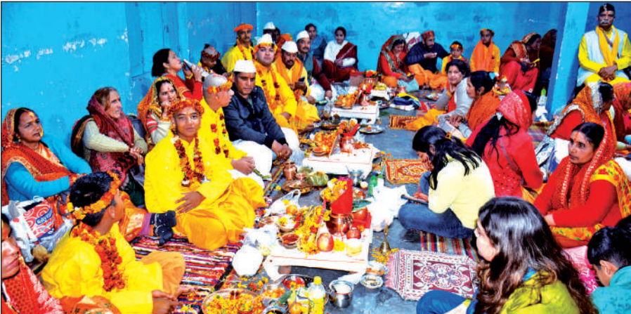
रेलवे बाजार स्थित संस्कृत महाविद्यालय में बसंत पंचमी पर पूजा पर बैठे बटुक व उनके परिजन।