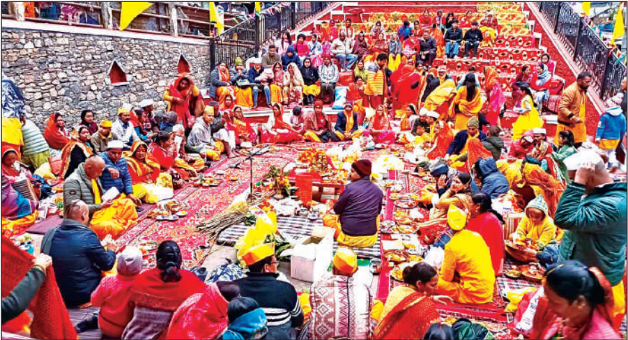
नैनीताल में बसंत पंचमी पर उपनयन संस्कार में शामिल बटुक व अभिभावक। ● अमृत विचार

पिछले कुछ दिनों में बैलपड़ाव, बन्नाखेड़ा और कालाहूंगी रेंज से गुलदारों की गतिविधियों से जुड़े कई मामलों सामने आए हैं। गन्ने के खेत गुलदारों के लिए छिपने और अपने शावकों की देखरेख के लिए सुरक्षित