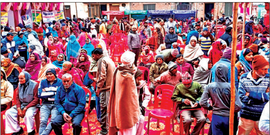
जन जन की सरकार जन जन के द्वार कार्यक्रम में लाभ उठाने पहुंचे लोग। ● अमृत विचार