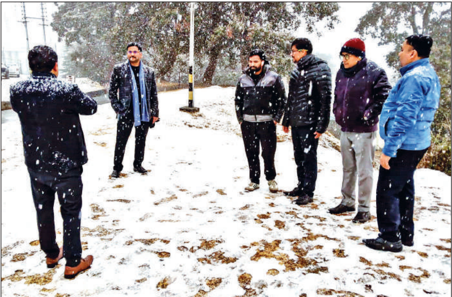
रानीखेत के चौबटिया में शुक्रवार को बर्फबारी का आनंद लेते पर्यटक और स्थानीय लोग।