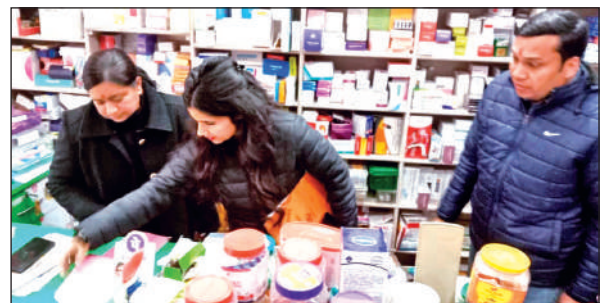
सोमेश्वर क्षेत्र में मेडिकल स्टोर का निरीक्षण करते अधिकारी।