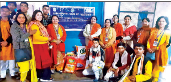
बसंत पंचमी पर संस्कृत विद्यालय में मौजूद इनरक्ली क्लब की पदाधिकारी।

वहीं दूसरी ओर, अवलेश्वर महादेव मंदिर में भी धार्मिक अनुष्ठानों की धूम रही। यहां 12 बटुकों का यज्ञोपवीत संस्कार सुंदरकांड पाठ और हवन यज्ञ के बीच कराया गया। सुबह से ही मंदिर परिसर वेद मंत्रों और हवन की सुगंध से भक्तिमय हो उठा। यहां भी कर्णभेद और पद संचालन जैसे संस्कारों के साथ शिक्षा ग्रहण की परंपरा निभाई गई।