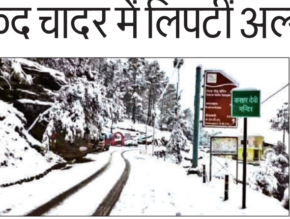
अल्मोड़ा के कसारदेवी में हिमपात का नजारा। ● अमृत विचार

जिले में शुक्रवार दोपहर बाद ऊंची पहाड़ियां बर्फ की सफेद चादर में लिपट गईं, जिससे क्षेत्र का नजारा बेहद मनोरम हो गया। बर्फबारी के कारण पूरे इलाके में शीतलहर तेज हो गई है, जिससे