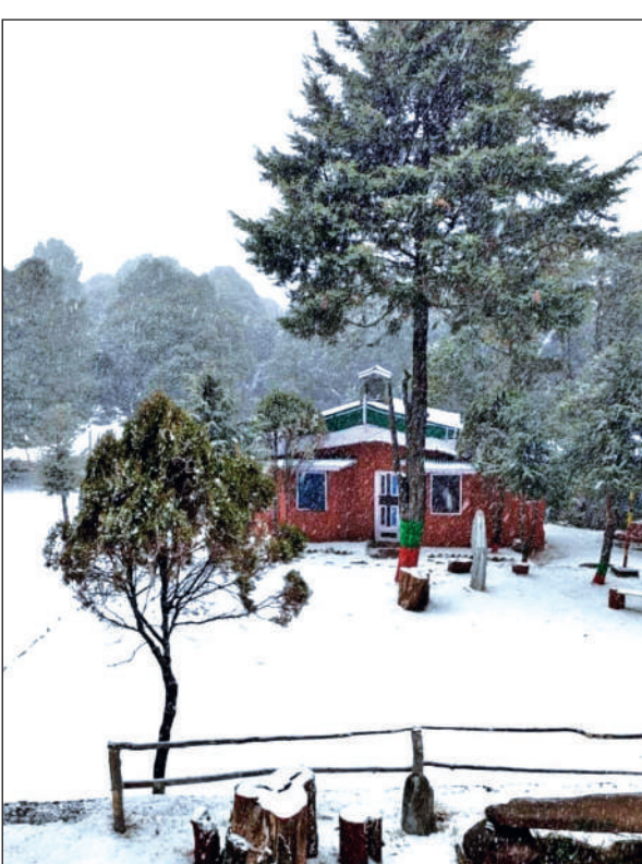
द्वाराहाट के पांडवखोली आश्रम में गिरी बर्फ का नजारा।

मौसम विभाग के पूर्वानुमान के अनुरूप सुबह कुछ समय के लिए धूप खिली, लेकिन बाद में बादलों ने आसमान को पूरी तरह ढक लिया। दोपहर बाद अचानक मौसम बदला और बारिश व बर्फबारी का दौर शुरू हो गया। इस बीच दोपहर बाद क्षेत्र में बिजली गुल हो जाने से लोगों की परेशानियां और बढ़ गईं। ठंड बढ़ने के कारण बाजारों की रौनक भी प्रभावित रही। सामान्य दिनों की तुलना में बाजारों में आवाजाही कम रही और लोग जरूरी काम निपटाकर जल्दी घर लौटते दिखाई दिए। वहीं किसानों का कहना है कि यह बारिश अभी फसलों के लिए पर्याप्त नहीं है। किसान और बागवान अच्छी बारिश और अधिक बर्फबारी को आस लगाए हुए हैं, ताकि फसलों को आवश्यक नमी मिल सके। देर शाम तक क्षेत्र में बूंदाबांदी जारी थी और ठंड का असर लगातार बना हुआ था।