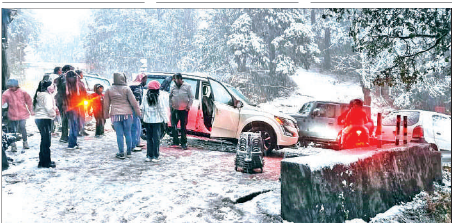
नैनीताल के हिमालय दर्शन में शुक्रवार को हुई बर्फबारी के दौरान फंसे पर्यटकों के वाहन।

मौसम विज्ञान केंद्र देहरादून ने पूर्व में ही अनुमान जताया था कि इस बार तीव्र और मजबूत पश्चिमी विक्षोभ सक्रिय होगा। अनुमान एकदम सही साबित हुआ और बसंती पंचमी के दिन शुक्रवार की सुबह तो धूप निकली लेकिन पूर्वान्ह में मौसम एकदम से बदल गया। आसमान में बादल छा गए और तेज हवा चलने लगी। गढ़वाल मंडल में सुबह के समय से ही बारिश और बर्फबारी का दौर शुरू हो गया था लेकिन कुमाऊं मंडल में ऐसा नहीं हुआ। दोपहर बाद यहां भी बारिश और बर्फबारी का दौर शुरू हो गया। 1800 मीटर से ज्यादा ऊंचाई वाले सभी स्थानों नैनीताल, मुक्तेश्वर, अल्मोड़ा, मुनस्यारी आदि में बर्फबारी शुरू हुई। मैदानी इलाकों में भी मौसम पूरी तरह से मेहरमान हो गया। अपरान्ह बाद एकदम से अंधेरा