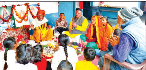
सरस्वती शिशु मंदिर चकलुवा में हवन यज्ञ करते शिक्षक व छात्र।