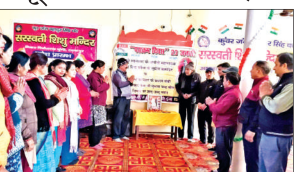
टनकपुर में नेताजी सुभाष चंद्र बोस के चित्र पर पुष्प अर्पित कर नमन किया गया।