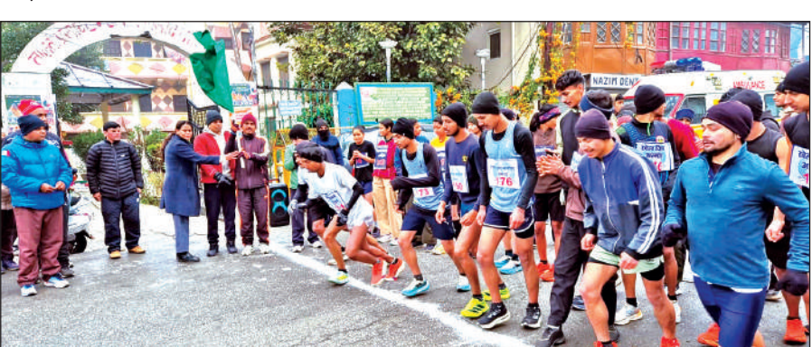
क्रॉस कंट्री दौड़ को हरी झंडी दिखाकर रवाना करते अतिथि।