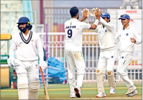
यूपी के बल्लेबाज को आउट करने के बाद खुशी मनाते झारखंड के खिलाड़ी।

उत्तर प्रदेश के लिए यह मुकाबला जीतना बेहद जरूरी था, क्योंकि सिर्फ सीधी जीत ही उसे नॉकआउट का टिकट दिला सकती थी। लेकिन बल्लेबाजी और गेंदबाजी, दोनों ही विभागों में टीम औसत से भी नीचे रही। इकाना स्टेडियम की पिच पर जहां झारखंड के बल्लेबाजों ने जमकर रन बरसाए, वहीं यूपी के बल्लेबाज क्रीज पर टिकने के लिए संघर्ष करते नजर आए। अब चौथे