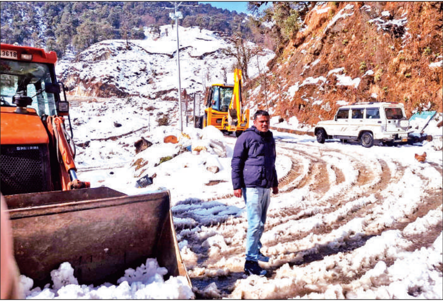
बाछम मोटर मार्ग से बर्फ हटाती जेसीबी। ● अमृत विचार

शुक्रवार दोपहर बाद मौसम ने करवट बदली और विभिन्न स्थानों पर तेज बारिश हुई। वहीं कपकोट के ऊंचाई वाले गांवों समेत गिरेछीना, कौसानी, कंधार, मजकोट, देवनाई, कमेडीदेवी आदि क्षेत्रों में मौसम का पहला हिमपात हुआ। हिमपात व बारिश के चलते बागेश्वर-गिरेछीना मोटर मार्ग बंद हो गया, जिससे हल्द्वानी और अल्मोड़ा का आवागमन ठप हो गया। बाद में मार्ग खुलने पर यातायात सुचारू हो सका। इसके अलावा कपकोट के एक दर्जन से अधिक गांवों को जोड़ने वाले मोटर मार्ग भी बंद हो गए। इनमें से कुछ मार्ग आज खोल दिए गए हैं, जबकि कुछ पर कार्य जारी है। आपदा प्रबंधन अधिकारी कार्यालय से मिली जानकारी के अनुसार सायं तक अधिकांश मोटर मार्ग खुलने की उम्मीद है।