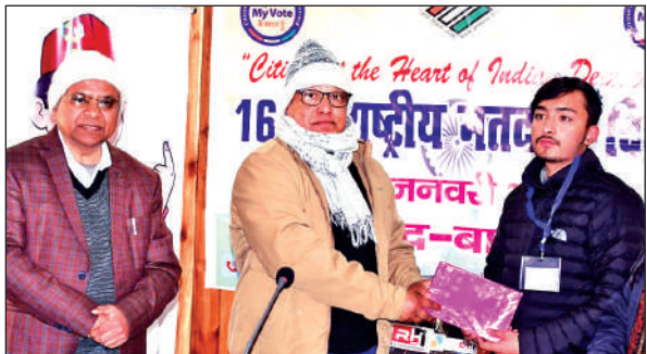
मतदाता जागरूकता के लिए उत्कृष्ट कार्य करने पर सम्मानित करते सीडीओ।

तहसील परिसर में आयोजित कार्यक्रम के दौरान नए मतदाताओं, उत्कृष्ट कार्य करने वाले बीएलओ, स्वीप गतिविधियों सहित अन्य संबंधित क्रियाकलापों में भाग लेने वाले प्रतिभागियों को सम्मानित किया गया। सीडीओ आरसी तिवारी ने कहा कि निर्वाचन प्रक्रिया में बीएलओ की भूमिका अत्यंत