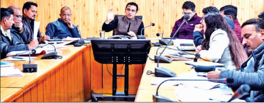
अधिकारियों को निर्देश देते सीडीओ ।

शनिवार को विकास भवन सभागार में आयोजित समीक्षा बैठक के दौरान मुख्य विकास अधिकारी ने सभी खंड विकास अधिकारियों को अपने-अपने विकास खंडों में कूड़ा निस्तारण के लिए जिला पंचायतराज अधिकारी एवं अपर मुख्य अधिकारी