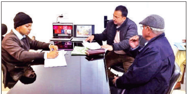
अल्मोड़ा में बैठक के दौरान अधिकारियों को निर्देशित करते जिलाधिकारी।

जिलाधिकारी ने वन विभाग को फायर लाइन निर्माण, संवेदनशील क्षेत्रों की नियमित निगरानी, फायर