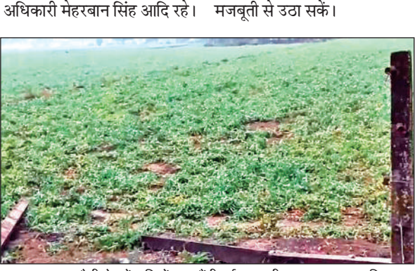
बाजपुर, ग्राम बरहैनी क्षेत्र में हाथियों द्वारा राँदी गई मटर की फसल।