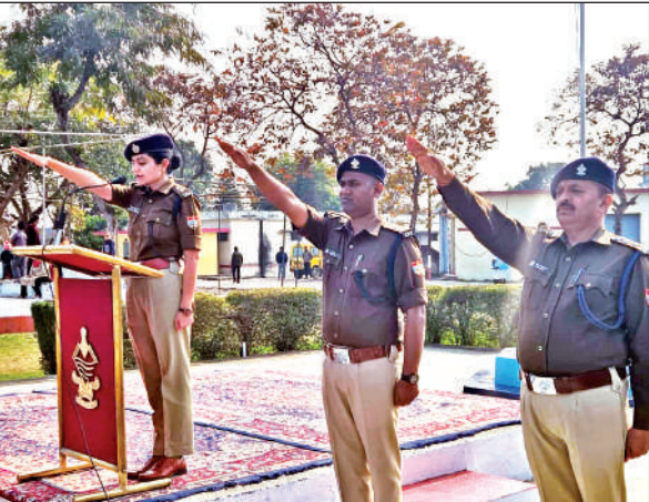
पुलिस कर्मियों को शपथ दिलाती एसपी क्राइम । ● अमृत विचार

जिला विधिक सेवा प्राधिकरण ने मतदाता दिवस पर आधारित पम्पलेट, पोस्टर वितरित कर जागरूक किया गया। इस दौरान