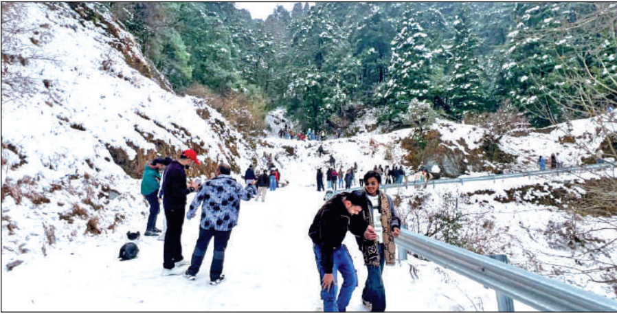
नैनीताल में शनिवार को बर्फबारी का आनंद लेते पर्यटक।

तापमान में भारी गिरावट, बड़ी कड़ाके की ठंड: बर्फबारी के बाद नैनीताल के तापमान में भारी गिरावट दर्ज की गई है। रात का तापमान शून्य के करीब पहुंच गया है, जबकि दिन में भी कड़ाके की ठंड का असर साफ महसूस किया जा रहा है। ठंड से बचने के लिए स्थानीय लोग और पर्यटक अलाव का सहारा लेते दिखाई दिए।