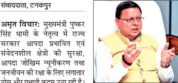
मुख्यमंत्री पुष्कर सिंह धामी।

की मदद से युवक को अस्पताल ले जाया गया, जहां डॉक्टरों ने उसे मृत घोषित कर दिया। युवक की रानीखेत रोडवेज स्टेशन के पास पान की दुकान थी। पुलिस ने आरोपी डंपर चालक को गिरफ्तार कर लिया है, जो रामनगर का निवासी बताया जा रहा है।