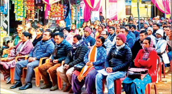
खत्याड़ी में बहुउद्देशीय शिविर में के दौरान मौजूद लोग। ● अमृत विचार

न्याय पंचायत के रामलीला मैदान में आयोजित शिविर के माध्यम से समाज कल्याण, महिला एवं बाल विकास, चिकित्सा विभाग, पंचायतीराज विभाग, कृषि, उद्यान, विद्युत, पेयजल समेत अनेक विभागों