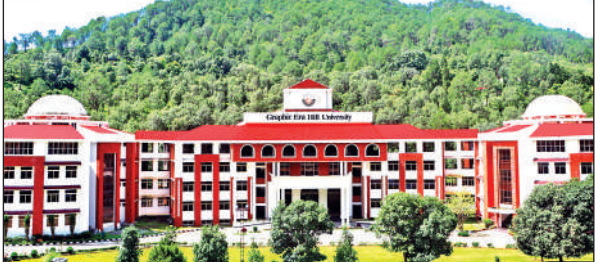
ग्राफिक एरा हिल यूनिवर्सिटी भीमताल। ● अमृत विचार

अमृत विचार: ग्राफिक एरा हिल यूनिवर्सिटी, भीमताल परिसर ने एक बार फिर अपनी उत्कृष्ट प्लेसमेंट परंपरा को कायम रखते हुए नया कीर्तिमान स्थापित किया है। वर्ष 2026 बैच के 300 से अधिक छात्रों का चयन पासआउट होने से करीब आठ महीने पहले ही देश-विदेश की प्रतिष्ठित मल्टीनेशनल कंपनियों में आकर्षक पैकेज पर हो चुका है।