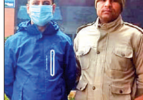
पुलिस हिरासत दहेज उत्पीड़न का आरोपी।