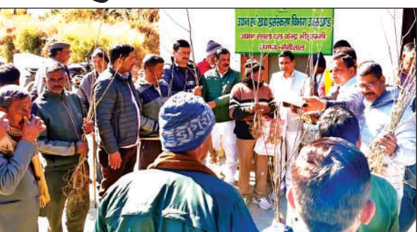
फल के पौधे वितरण कार्यक्रम।