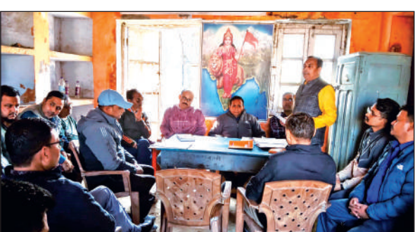
टनकपुर में परिवहन मजदूर संघ की बैठक में विचार विमर्श करते पदाधिकारी।

पुलिस चौकी बरहैनी क्षेत्रांतर्गत एक गांव निवासी पीड़िता ने पुलिस को दी गई तहरीर में बताया कि 23 जनवरी को वह घर में अकेली थी। आरोप है कि इसी दौरान पुलिस चौकी दोराहा क्षेत्रांतर्गत ग्राम महेशपुरा निवासी दूसरे समुदाय का युवक उसके घर में जबरन घुस आया। आरोपी ने महिला के साथ जबरदस्ती दुष्कर्म किया। पीड़िता ने बताया कि घटना के बाद वह बेहोश हो गई। होश में आने पर वह कोतवाली बाजपुर पहुंची।