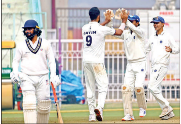
यूपी के बल्लेबाज को आउट करने के बाद खुशी मनाते झारखंड के खिलाड़ी।