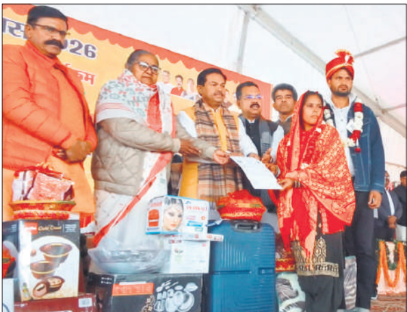
नवविवाहित जोड़े को उपहार और प्रमाण पत्र देते केंद्रीय मंत्री व प्रभारी मंत्री।

शहर के पूनम लॉन में हुए सामूहिक विवाह, जनप्रतिनिधियों ने नव विवाहित जोड़ों को दिया आशीर्वाद