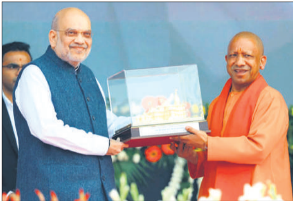
राष्ट्र प्रेरणा स्थल, लखनऊ में आयोजित समारोह में अमित शाह को स्मृति चिह्न देते योगी ।

अमृत विचार : केंद्रीय गृह एवं सहकारिता मंत्री अमित शाह ने शनिवार को लखनऊ से विधानसभा चुनाव-2027 का औपचारिक शंखनाद कर दिया । उन्होंने विपक्ष पर तीखा हमला बोलते हुए कहा कि सपा, बसपा व कांग्रेस जातिवादी-परिवारवादी दल हैं, जो प्रदेश का कल्याण नहीं कर सकते । उन्होंने जनता से अपील की कि जात-पात से ऊपर उठ वंशवादी पार्टियों को नकार दें, यूपी में कमल फिर खिलएं । शाह ने तीन दिवसीय उप्र दिवस की शुरुआत करते हुए राष्ट्र प्रेरणा स्थल से विकास, राष्ट्रवाद और सुशासन के साथ-साथ चुनावी संदेश दिए । उन्होंने कहा कि जिस स्थान पर आज भव्य प्रेरणा स्थल खड़ा है, वहां कभी 65 एकड़ में कूड़े का पहाड़ था । मुख्यमंत्री योगी ने उसे संकल्प और कर्तव्य के