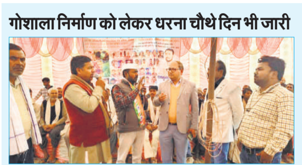
गोशाला निर्माण को लेकर धरना चौथे दिन भी जारी

धरना जारी है। आशा कार्यकर्ताओं ने चेतावनी दी है कि मांगों पूरी न होने तक धरना जारी रहेगा। वहीं कलान में गोशाला निर्माण को लेकर ग्रामीणों का धरना जारी है। लोगों ने खमरिया गांव में गोशाला निर्माण की मांग कई दिन से चल रही है, लेकिन प्रशासन अब तक निर्माण कराने का निर्णय नहीं ले सका है। इससे स्थानीय लोगों लोगों में रोष व्याप्त है।