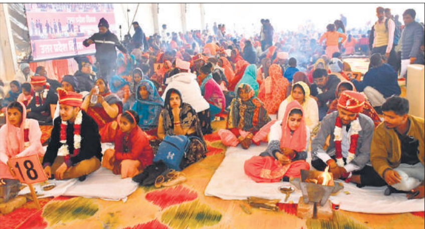
पूनम लॉन में बैठे जोड़े।

सबसे अधिक प्रधानमंत्री दिए हैं। मुख्यमंत्री सामूहिक विवाह योजना में सरकार ने धनराशि को बढ़ाकर एक लाख रुपये प्रति जोड़ा कर दिया गया है। कहा कि उपभोक्ता मामले खाद्य और सार्वजनिक वितरण मंत्रालय द्वारा सार्वजनिक वितरण के अंतर्गत देश के लोगों को खाद्यान्न का वितरण किया जाता है। जो गरीबों के लिए बिना किसी भेदभाव के पूरी पारदर्शिता के साथ दिया जाता है। प्रभारी मंत्री ने कहा कि गरीब पिता का इतनी भव्यता के साथ विवाह कराना एक सपना था जो सरकार ने साकार किया है। लोग सोचते हैं कि