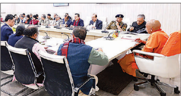
बजट प्रस्तावों की समीक्षा करते मुख्यमंत्री योगी आदित्यनाथ।

वे अपने आवास पर शनिवार को एक महत्वपूर्ण बैठक में आगामी वित्तीय वर्ष 2026-27 के बजट प्रस्तावों की समीक्षा कर रहे थे। मुख्यमंत्री ने कहा कि आगामी वित्तीय वर्ष का बजट लोककल्याण, सुरासन और वित्तीय समृद्धि के माध्यम से प्रदेश की जनता के सपनों और अपेक्षाओं को पूरा करने की दिशा में एक मजबूत कदम साबित होगा। मुख्यमंत्री ने कहा कि पिछले लगभग नौ वर्षों में उत्तर प्रदेश ने विकास, सुरक्षा और समृद्धि की जिस दिशा में ठोस प्रगति की है, उससे प्रदेश की जनता को सरकार से बड़ी आशा है और जन-अपेक्षाओं