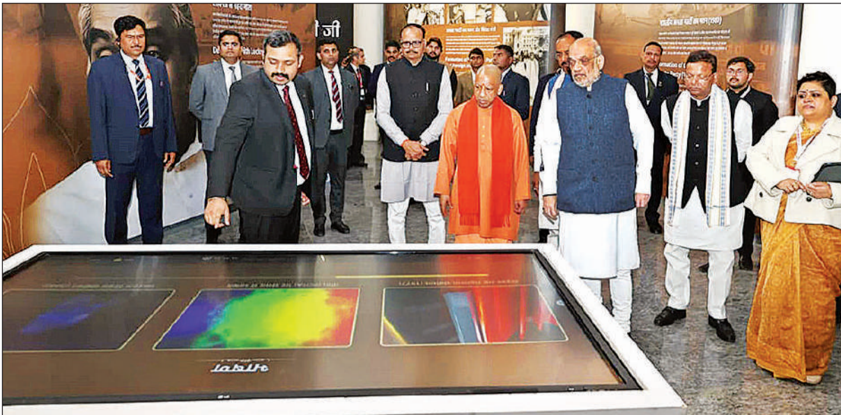
यूपी दिवस पर लखनऊ के राष्ट्र प्रेरणा स्थल में संग्रहालय का अवलोकन करते गृह मंत्री अमित शाह, साथ में मुख्यमंत्री योगी आदित्यनाथ व अन्य।

त्योहार, पूजा-पाठ और स्नान जैसे आयोजनों में राजनीतिक लोगों का प्रभाव पिछले कुछ वर्षों में काफी बढ़ा है, जो नए-नए विवाद, तनाव और संघर्ष का कारण बन रहा है। साथ ही उम्मीद जताई कि प्रयागराज में स्नान को लेकर चल रहा विवाद आपसी सहमति से जल्द सुलझेगा, जो सभी के हित में होगा। सोशल मीडिया एक्स पर बसपा प्रमुख ने शनिवार को कहा कि संकीर्ण राजनीतिक स्वार्थ के लिए धर्म को राजनीति से और राजनीति को धर्म से जोड़ने के कई खतरे हमेशा बने रहते हैं। प्रयागराज में स्नान को लेकर चल रहा विवाद, आपसी अनादर और आरोप-प्रत्यारोप इसका ताजा उदाहरण है।