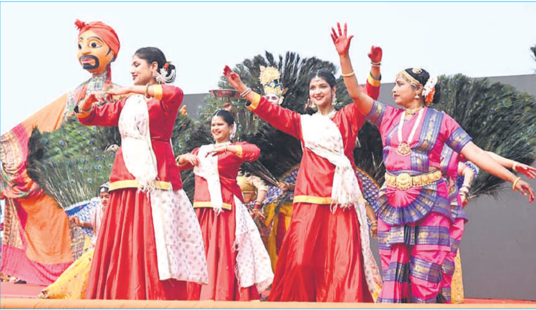
लखनऊ: राष्ट्र प्रेरणा स्थल में उत्तर प्रदेश दिवस पर आयोजित कार्यक्रम में सांस्कृतिक प्रस्तुति देते कलाकार ।

■ ऑस्ट्रेलियाई ओपन: जोकोविच ने गैंडस्लेम में दर्ज की रिकॉर्ड 400वीं जीत - 14