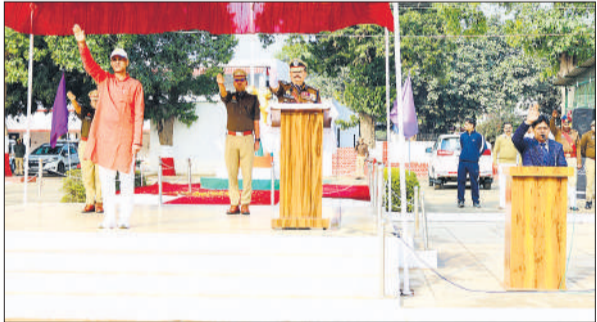
गणतंत्र दिवस की रिहर्सल परेड का निरीक्षण करते एसपी।

एसपी ने परेड की प्रत्येक गतिविधि को गंभीरता से परखा तथा उसे और अधिक सुसंगठित, आकर्षक व अनुशासित बनाने के दिशा निर्देश दिए। उन्होंने निर्देश दिए कि गणतंत्र दिवस परेड में शत प्रतिशत अनुशासन व तालमेल