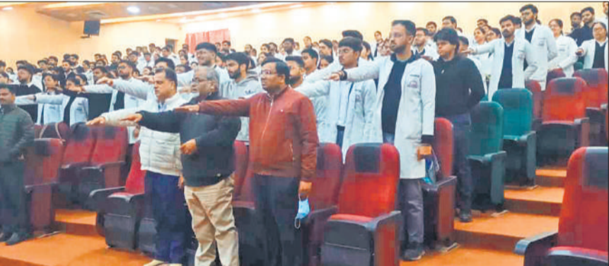
वरुण-अर्जुन विश्वविद्यालय में राष्ट्रीय मतदाता दिवस पर शपथ लेते छात्र और संकाय सदस्य।

भारतीय चुनाव आयोग के स्थापना दिवस के उपलक्ष्य में हर वर्ष 25 जनवरी को राष्ट्रीय मतदाता दिवस मनाया जाता है। इसका उद्देश्य विशेष रूप से युवाओं और पहली बार मतदान करने वाले मतदाताओं को लोकतांत्रिक प्रक्रिया में सूचित, नैतिक और समावेशी सहभागिता के लिए प्रेरित करना है। कार्यक्रम के दौरान मतदान को लोकतंत्र का आधार स्तंभ बताते हुए