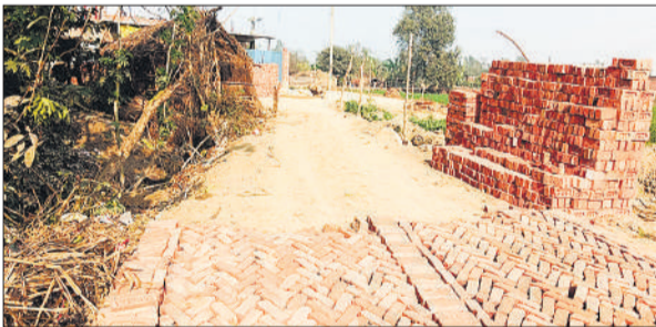
इसी स्थान पर खड़ंगा निर्माण को लेकर विवाद है।