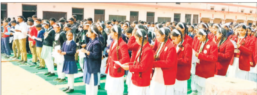
एनए इंटर कॉलेज में मतदान की शपथ लेते बच्चे।