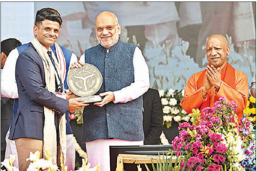
अंतरिक्ष यात्री सुधांशु शुक्ला को उत्तर प्रदेश गौरव सम्मान से सम्मानित करते गृहमंत्री अमित शाह।