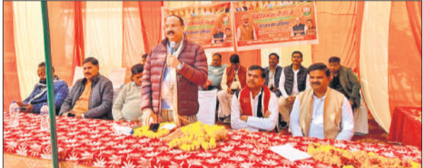
गांव में आयोजित चौपाल को संबोधित करते भाजपा सांसद अरुण सागर।

अमृत विचार : तिलहर विधानसभा के बिलहारा गांव और कटरा विधानसभा के कपूरापुर व कपूरनगला में विकसित भारत-रोजगार व आजीविका गारंटी मिशन-ग्रामीण विकसित भारत जी राम जी के तहत कार्यक्रम आयोजित किए गए। कार्यक्रम में मुख्य अतिथि भाजपा सांसद अरुण सागर का पदाधिकारियों की ओर से स्वागत किया गया। इसके बाद उन्होंने चौपाल में मौजूद ग्रामीणों को योजना की जानकारी दी। सांसद ने कहा कि इस योजना के तहत ग्रामीण परिवारों के लिए रोजगार के दिन 100 से बढ़ाकर 125 कर दिए गए हैं। उन्होंने कहा कि यह योजना मनरेगा से अधिक प्रभावी है, जिससे ग्रामीणों को गांव में ही रोजगार मिलेगा और पलायन रुकेगा। उन्होंने बताया कि योजना का उद्देश्य ग्रामीण मजदूरी,