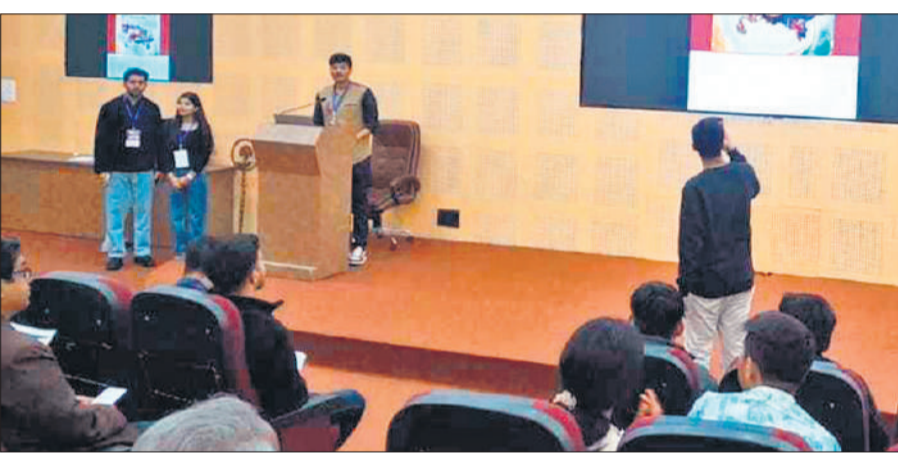
वरुण-अर्जुन विश्वविद्यालय में यूपी दिवस के मौके पर बोलते प्रतिभागी।

शैक्षणिक सहभागिता के अंतर्गत 24 जनवरी 2026 को यूपी दिवस प्रश्नोत्तरी का आयोजन किया गया। प्रश्नोत्तरी में उत्तर प्रदेश के इतिहास, स्वतंत्रता आंदोलन, राष्ट्रीय नेताओं, भूगोल, संस्कृति, परंपराओं, लोक कलाओं, प्रमुख त्योहारों, पर्यटन, अर्थव्यवस्था,