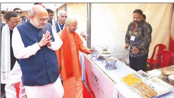
ओडीओसी योजना की शुरुआत के मौके पर लगाई गई प्रदर्शनी में लगे एक स्टाल पर व्यंजन देखते गृहमंत्री अमित शाह व मुख्यमंत्री योगी।