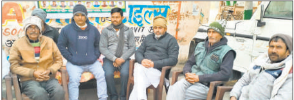
तिलहर में मांगों को लेकर जारी सत्याग्रह स्थल पर बैठे जनसेवक और समर्थक।