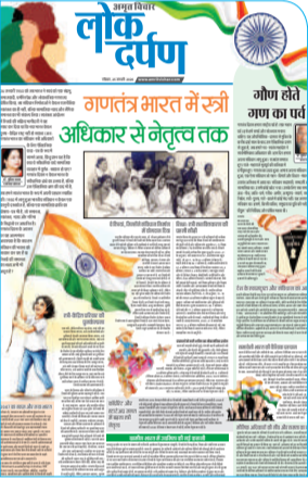
इस बार के रविवारीय संस्करण 'लोक दर्पण' में, गणतंत्र भारत में स्त्री अधिकार से नेतृत्व तक व अन्य विषयों पर विशेष सामग्री दी जा रही है ।