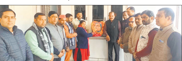
सपा कार्यालय पर गोष्ठी में मौजूद महानगर अध्यक्ष व अन्य।