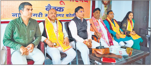
बैठक में मंवासीन पदाधिकारी।