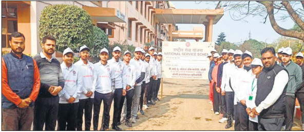
कार्यक्रम के दौरान मौजूद शिक्षक एवं विद्यार्थी।