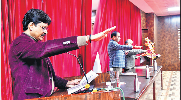
कार्यक्रम में मतदान करने की शपथ लेते शिक्षक।