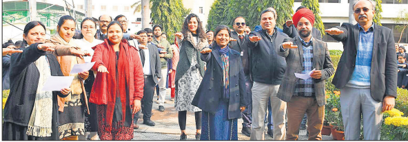
मतदान करने की शपथ लेते डॉक्टर्स, स्टाफ और विद्यार्थी।