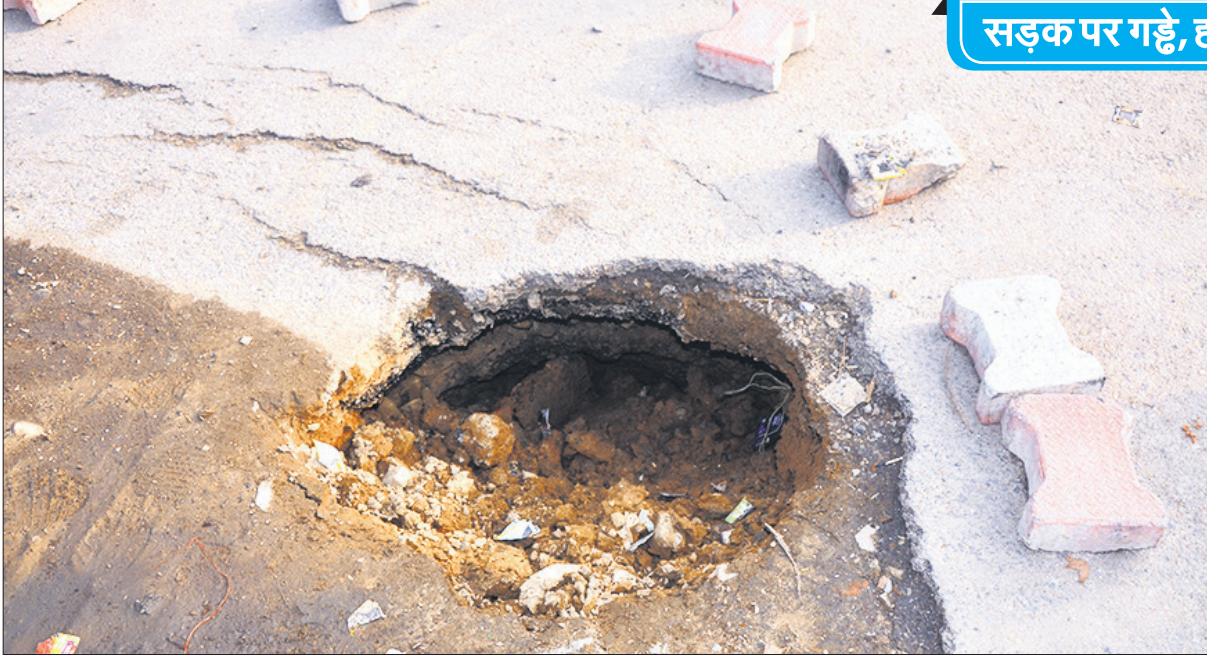
शुक्रवार हुई बरसात में नगर निगम शौचालय के पास सड़क फिर घंस गई। करीब दो महीने पहले इसी जगह सीवर लाइन पड़ी थी। वहीं, पीलीभीत बाईपास रोड पर भी गड्ढे हो गए हैं। इसकी वजह से हादसे का डर बना हुआ है।