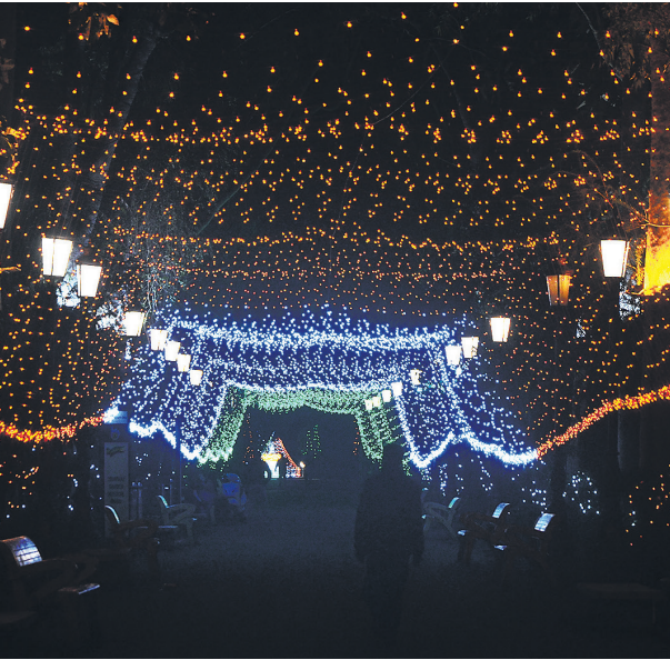
● अमृत विचार