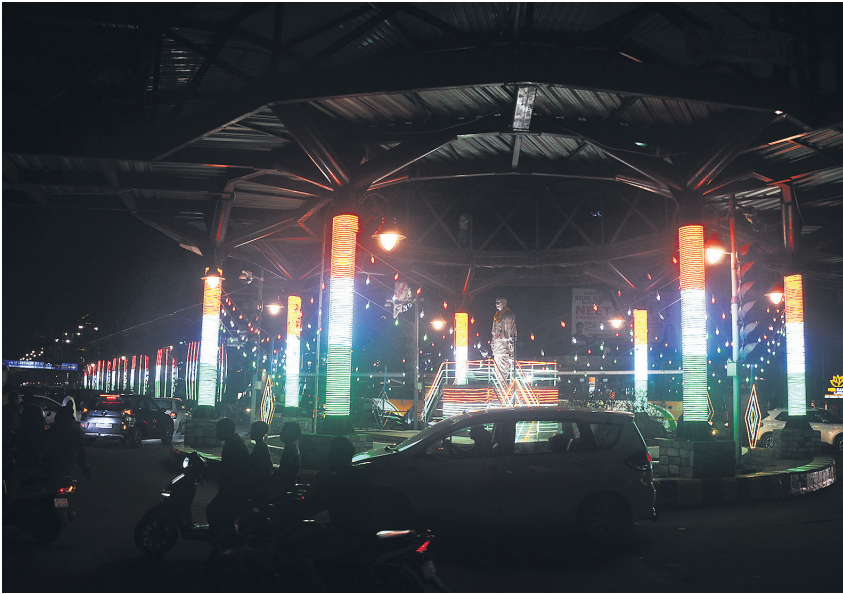
गणतंत्र दिवस को लेकर महापुरुषों के स्थल और पार्कों को सजाया गया। शनिवार रात पटेल चौक और गांधी उद्यान पार्क रंग बिरंगी रोशनी से जगमगा नजर आए।

आयु के प्रमाण के लिए जन्म प्रमाण पत्र, आधार, पैन कार्ड, ड्राइविंग लाइसेंस, हाईस्कूल व इंटर का प्रमाण-पत्र, पासपोर्ट में से कोई एक अभिलेख दिया जा सकता है। जन्म तारीख के सबूत के लिए उपरोक्त में से कोई अभिलेख उपलब्ध न होने पर 18 से 21 आयु वर्ग के आवेदकों को माता-पिता या गुरु (तृतीय लिंग के संदर्भ) के हस्ताक्षर से शपथ पत्र के साथ बृथ लेवल अधिकारी, सहायक निर्वाचक रजिस्ट्रीकरण अधिकारी व निर्वाचक रजिस्ट्रीकरण अधिकारी के समक्ष उपस्थित होना होगा।