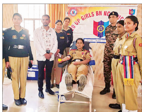
शिविर में रक्तदान करते एनसीसी कैडेट्स।