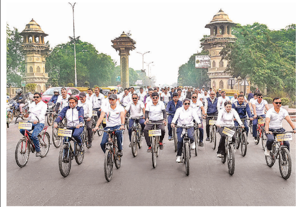
उत्तर प्रदेश राज्य स्थापना दिवस के अवसर पर नशा मुक्ति जागरुकता साइकिल रैली में शामिल लोग।