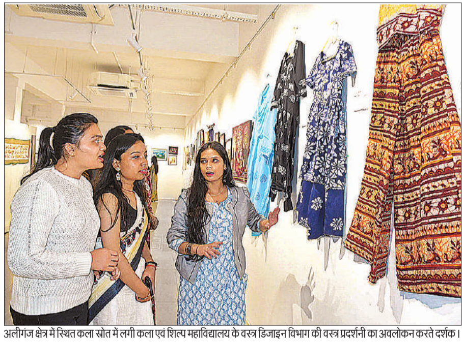
अलीगंज क्षेत्र में स्थित कला स्रोत में लगी कला एवं शिल्प महाविद्यालय के वस्त्र डिजाइन विभाग की वस्त्र प्रदर्शनी का अवलोकन करते दर्शक।