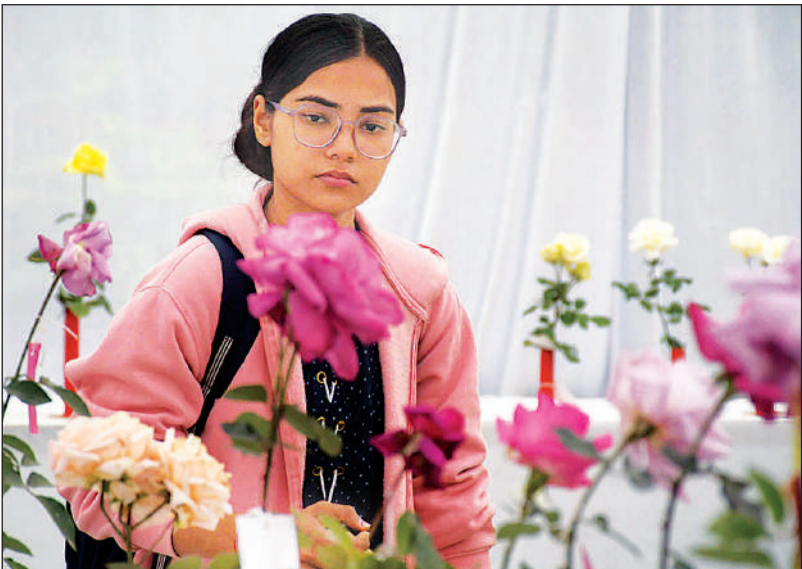
शहर के सीएसआईआर-राष्ट्रीय वनस्पति अनुसंधान संस्थान के वनस्पति उद्यान में लगी प्रदर्शनी में गुलाबों की खूबसूरती को निहारती युवती और पीले गुलाब देखकर प्रफुल्लित युवतियों के चेहरे। ग्लैडियोलस की खूबसूरती को अपने मोबाइल में कैद करती महिला।