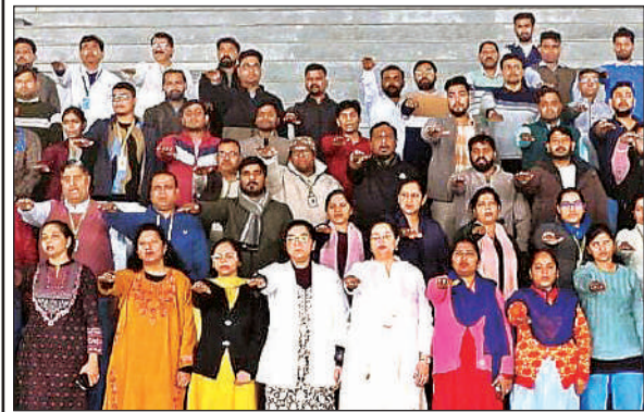
मतदाता जागरूकता की शपथ लेते हुए चिकित्सक और कर्मचारी।