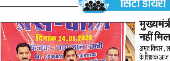
कार्यालय संवाददाता, लखनऊ

● तीन प्रमुख संस्थानों के साथ हुआ समझौता