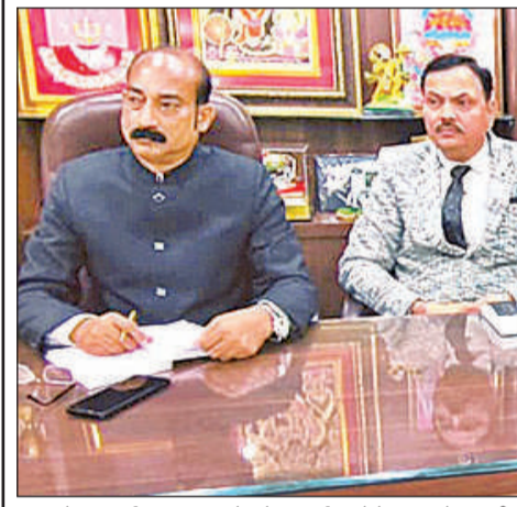
उत्तर प्रदेश आदर्श व्यापार मंडल के प्रदेश कार्यालय में बैठक करते व्यापारी।