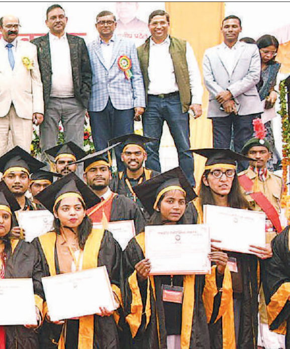
राजकीय पॉलीटेक्निक में दीक्षांत समारोह में डिग्री प्राप्त छात्र-छात्राएं।