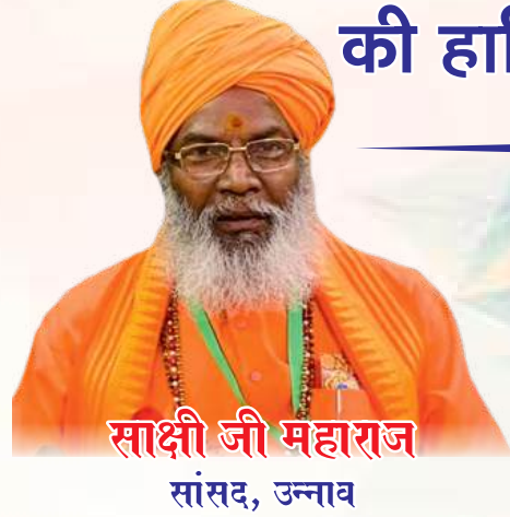
साक्षी जी महाराज सांसद, उन्नाव