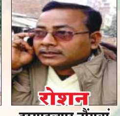
रोशन इस्माइलपुर नौगांवां