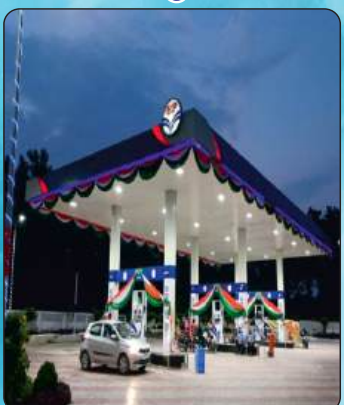
मिनी पेट्रोल पंप लखनऊ बांगरमऊ रोड हसनगंज