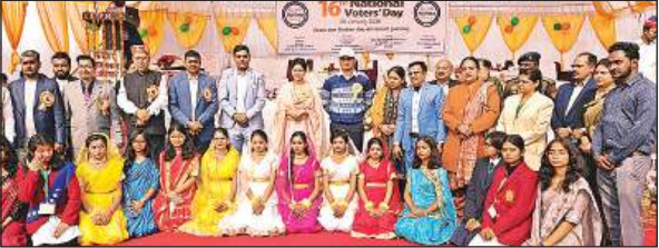
राष्ट्रीय मतदाता दिवस कार्यक्रम में मौजूद डीएम-एसपी, अन्य अधिकारी व बच्चे।