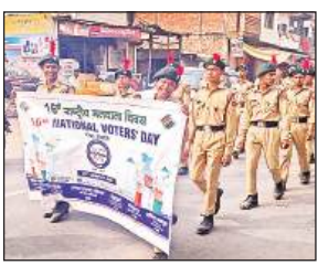
रैली निकालते स्कूलाट गाइड।

सलोन में निकाली गई राष्ट्रीय मतदाता जागरूकता रैली, सलोन: राष्ट्रीय मतदाता दिवस के अवसर पर सलोन नगर में मतदाता जागरूकता