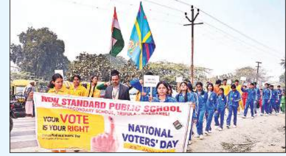
जागरूकता रैली निकालते एनएसपीएस के बच्चे।