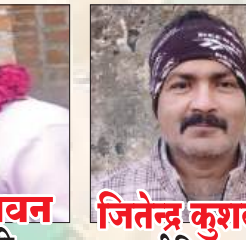
रामखेलावन प्र. पतौली