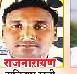
राजनारायण तालिबपुर रहली