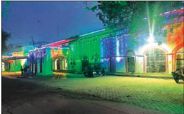
गणतंत्र दिवस की पूर्व संध्या पर रंग-बिरंगी विद्युत झालरों से सजा कलेक्ट्रेट व सदर तहसील परिसर।