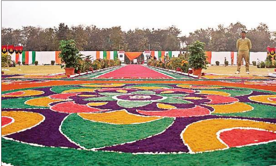
पुलिस लाइन में सजायी गयी आकर्षक रंगोली।