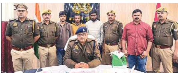
पुलिस की गिरफ्त में पकड़े गए चोर।