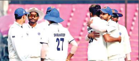
जीत का जश्न मनाते झारखंड के खिलाड़ी ।