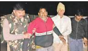
मुठभेड़ में पकड़े गए आरोपी।