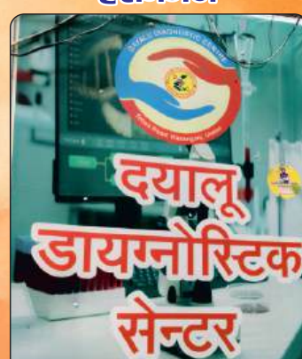
दयालू डायग्नोस्टिक सेन्टर हसनगंज