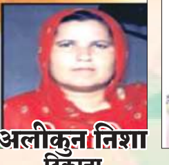
अलीकुन जिशा टिकाना