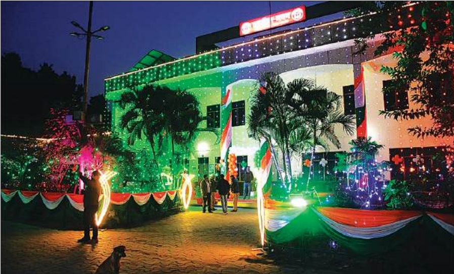
गणतंत्र दिवस की पूर्व संध्या पर रोशनी से नहाया तहसील भवन।