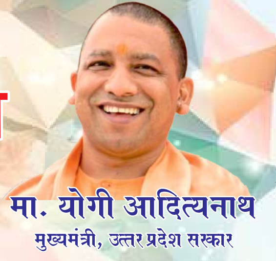
मा. योगी आदित्यनाथ मुख्यमंत्री, उत्तर प्रदेश सरकार