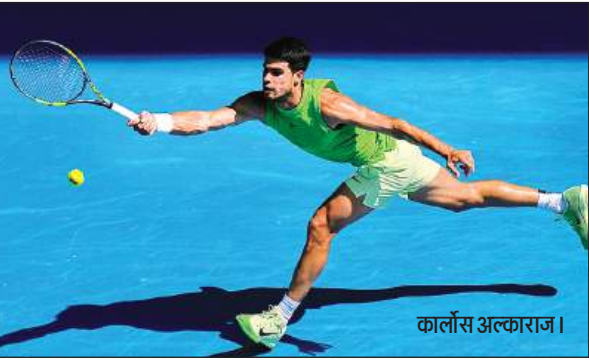
कार्लोस अल्काराज ।

रिकॉर्ड 10 बार के विजेता नोवाक जोकोविच कोर्ट पर उतरे बिना ही ऑस्ट्रेलियाई ओपन टेनिस टूर्नामेंट के क्वार्टर फाइनल में पहुंच गए हैं जबकि विश्व के नंबर एक खिलाड़ी कार्लोस अल्काराज और एरिना सबालेंका ने सीधे सेटों में जीत दर्ज करके अंतिम आठ में जगह बनाई । अपना 25वां ग्रैंड स्लैम एकल खिताब जीतने की कवायद में लगे जोकोविच को चौथे दौर में उनके प्रतिद्वंद्वी जैकब मेनसिक के पेट की मांसपेशियों में खिंचाव कारण 24 घंटे पहले ही टूर्नामेंट से हट जाने कारण वाकओवर मिला । आयोजकों ने रविवार देर रात मेनसिक के नाम वापस लेने की पुष्टि की । यह मैच सोमवार रात को रॉड लेवर एरिना में खेला जाना था । आयोजकों की तरफ से जारी बयान में मेनसिक ने कहा पिछले कुछ मैचों