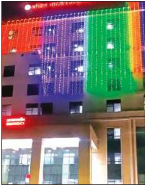
झालरों से सजाया गया एम्स।