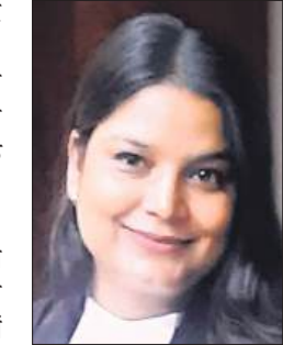
नुसरत जहां एजीए, हाईकोर्ट लखनऊ बैच LIM(LU)

कहा, मतदाता हमारी विकास यात्रा का भाग्य विधाता है। मतदान के अवसर पर उंगली पर लगने वाली अमिट स्याही बताती है कि हमारा लोकतंत्र बहुत जीवंत है और इसका उद्देश्य काफ़ी बड़ा है। मोदी ने कहा, आपके मित्रों या रिश्तेदारों में कई ऐसे युवा हो सकते हैं जो पहली बार मतदान बन रहे हैं। उनके जीवन के लिए यह अत्यंत महत्वपूर्ण क्षण है। पहली बार मतदाता बनने वालों का लोकतंत्र में इसलिए भरपूर स्वागत होना चाहिए क्योंकि उनके पास देश के भाग्य को बदलने की क्षमता है।