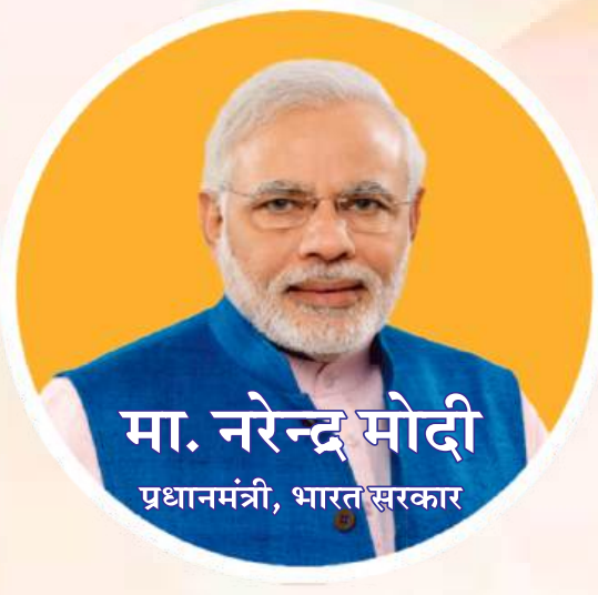
मा. नरेन्द्र मोदी प्रधानमंत्री, भारत सरकार

समस्त जनपद वासियों को 77वें गणतंत्र दिवस