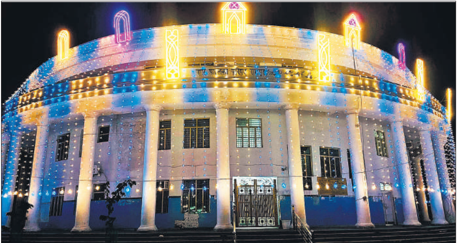
गणतंत्र दिवस की पूर्व संध्या पर सजाया नगर पालिका कार्यालय।

सुबह 9 बजे गांधी समाधि पर ध्वजारोहण एवं राष्ट्रीय गान होगा। जबकि 9:30 बजे पुलिस लाइन में ध्वजारोहण, परेड, परेड की सलामी, स्कूली बच्चों द्वारा सांस्कृतिक कार्यक्रम तथा झांकियों का प्रदर्शन किया जाएगा। जिसमें प्रदेश व जनपद के विकास कार्यों की छवियों का समावेश होगा। प्रातः 10 बजे सभी शिक्षण संस्थानों में ध्वजारोहण, राष्ट्रीय गान एवं सांस्कृतिक