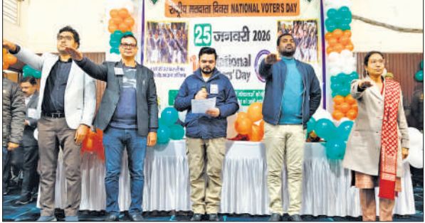
सभागार में लोगों को शपथ दिलाते जिलाधिकारी।