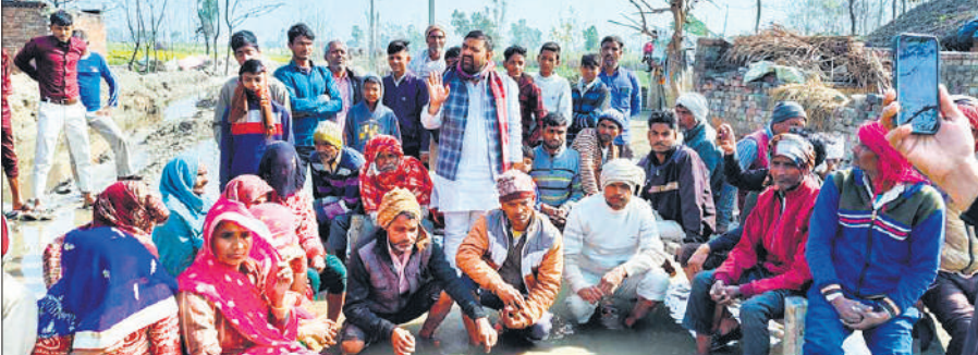
जल भराव के बीच बैठकर प्रदर्शन करते किसान।