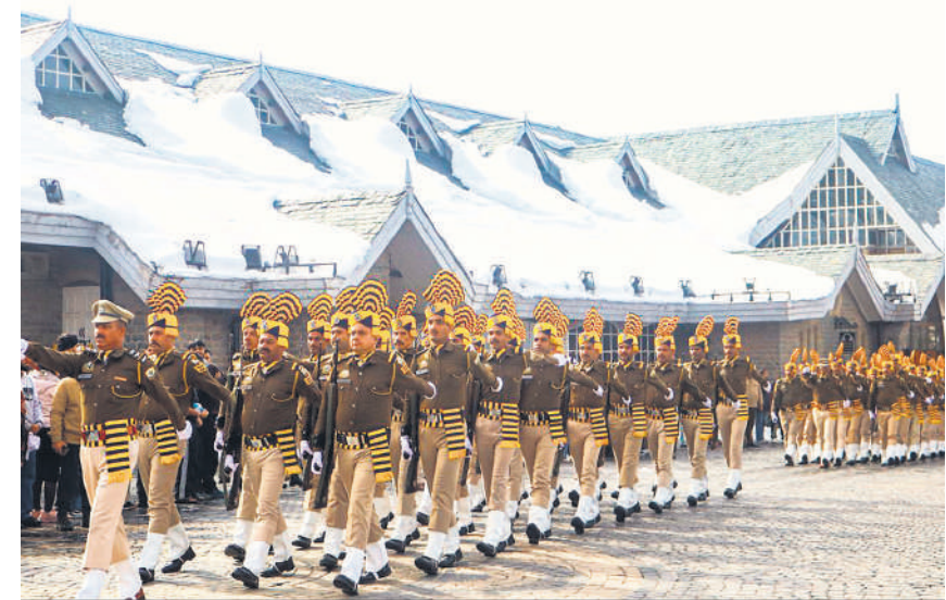
हिमाचल प्रदेश में खूब बर्फबारी हुई है। बर्फ पर्यटकों को भी आकर्षित कर रही है। इसी के बीच गणतंत्र दिवस की तैयारियां भी चल रही हैं। रविवार को शिमला पहाड़ी पर गणतंत्र दिवस परेड के पूर्वार्ध्यास के दौरान मार्च पास्ट करते सुरक्षाबल के जवान।