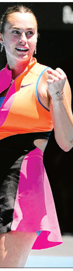
जश्न मनाती बेलासुस की एरिना सबालैंका।

खेल दिखाया वह अद्वितीय था। मुझे लगता है उसने अविश्वसनीय खेल का प्रदर्शन किया। ऑस्ट्रेलियाई ओपन में पिछले चार साल में तीसरा खिताब जीतने की कोशिश में लगी सबालैंका ने अच्छी शुरुआत की और पहले सेट में 3-0 से बढ़त बनाकर 29वीं बार इस प्रतियोगिता के सेमीफाइनल में पहुंची है। तीसरी वरीयता प्राप्त ज्वेरेव ने बंद छत के नीचे खेलने का फायदा उठाया और 20 वर्षीय टिएन के खिलाफ 24 ऐस लगाए और केवल एक डबल फाल्ट किया। उन्होंने किसी ग्रैंड स्लैम टूर्नामेंट में दसवीं बार सेमीफाइनल में प्रवेश किया। ज्वेरेव ने मैच के बाद कहावह बेहतरीन खिलाड़ी है। पिछले साल की तुलना में अपने खेल में काफी सुधार हुआ है। उसने बेसलाइन से जिस तरह का