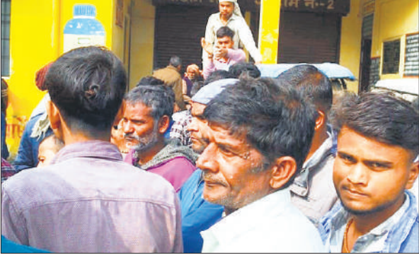
समिति पर हंगामा करते किसान।

यूरिया लेने के लिए सुबह से ही बड़ी संख्या में किसान समिति परिसर में जमा थे। किसानों का आरोप है कि वितरण व्यवस्था में भारी अव्यवस्था रही और कुछ लोगों को प्राथमिकता दी गई, जबकि कतार में खड़े कई किसानों को खाद नहीं मिल सकी। इसी को लेकर किसानों में आक्रोश