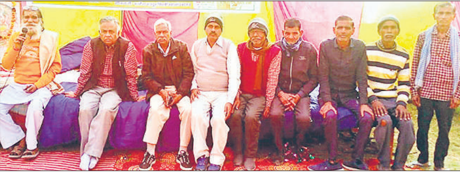
सकेशू के मनरेगा मेला में मंचासीन अतिथि।