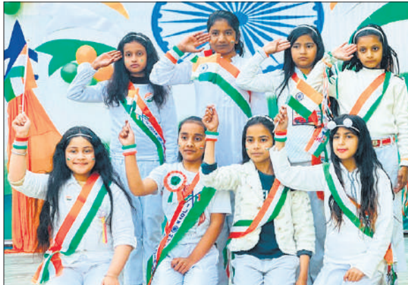
सिंगडेल पब्लिक स्कूल में सांस्कृतिक कार्यक्रम की प्रस्तुति देते बच्चे।