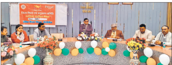
बैठक में मौजूद डीएम व अन्य अधिकारी।

अधिकांशी अभियंता विद्युत को निर्देश दिए कि दस दिन के अंदर स्कूलों के ऊपर से गुजरने वाली लाइटेशन लाइन हटवा दी जाए। डीएम ने बेसिक शिक्षा विभाग में चलाई जा रही योजनाओं की बिंदुवार समीक्षा की। इस दौरान