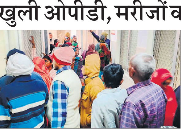
ओपीडी में डॉक्टरों के चैबर के बाहर लगी मरीजों की लाइन।