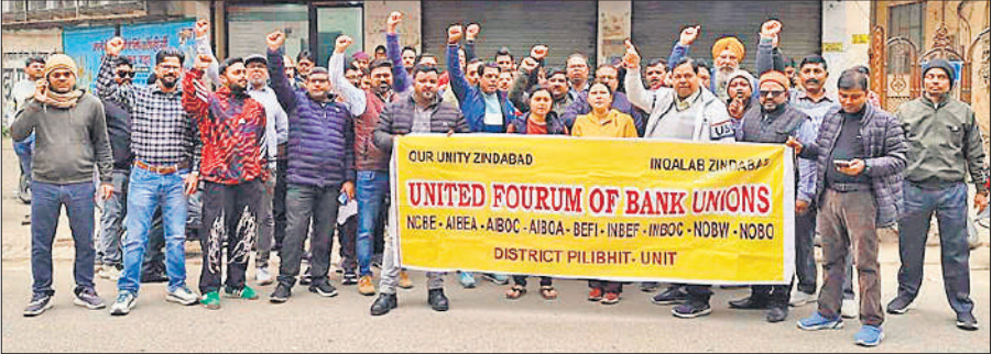
पांच दिवसीय बैंकिंग लागू करने की मांग को लेकर प्रदर्शन करते अधिकारी व बैंककर्मों।