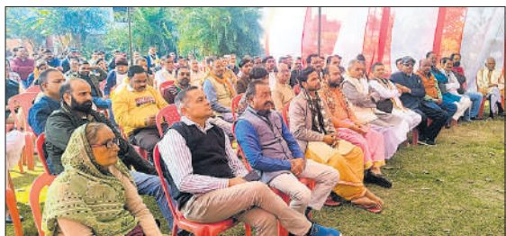
बैठक में मौजूद ब्राह्मण समाज के लोग।