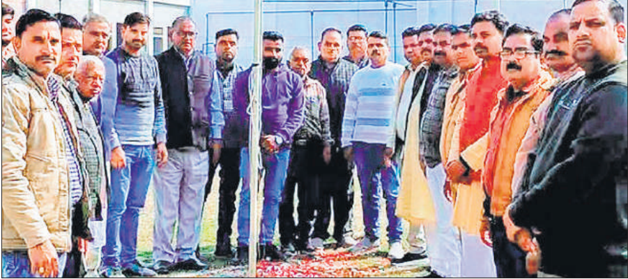
बैठक के दौरान मौजूद ब्राह्मण महासभा के सदस्य।

जिसमें लिखा है कि वह भाजपा में बूथ अध्यक्ष के पद पर कार्यरत हैं। पार्टी द्वारा वर्तमान में यूजीसी एवं एससी एसटी जैसे कानूनों के समर्थन एवं लागू किए जाने की नीति से वह पूरी तरह से असहमत हैं। ये कानून समाज में विभाजन पैदा करते हैं। उनके वैचारिक, सामाजिक एवं नैतिक सिद्धांतों के विरुद्ध हैं। ऐसे निर्णय के साथ जुड़े रहना उनके वैचारिक सामाजिक एवं नैतिक सिद्धांतों के विरुद्ध है। इस निर्णय के साथ जुड़े रहना उनके आत्मसम्मान और