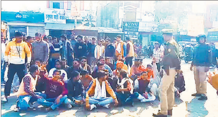
खमरिया चौराहा पर प्रदर्शन करते लोग।

बिड़ीली, अमृत विचार : बंगोला उपकेंद्र के अलीगंज फीडर से करीब 40 गांवों को बिजली दी जाती है। इस फीडर पर चार कर्मचारी तैनात हैं, फिर भी गांव वासियों को 10 से 12 घंटे बिजली मिलती है। जर्जर तारों के बार बार टूटने, कम झमता के ट्रांसफार्मर के खराब होने से दिन में कई बार घंटों बिजली की कटौती की जाती है। परेशान लोग शिकायत करने के लिए जब बिजली विभाग के जेई के सरकारी नम्बर फोन लगाते हैं तो घंटी बजती रहती है, कोई फोन नहीं उठता है। एसडीओ अजय यादव ने बताया कि फोन उठाना चाहिए, अगर नहीं उठा रहे हैं तो मैं उनसे बात करूंगा कि सभी के फोन उठाएं।