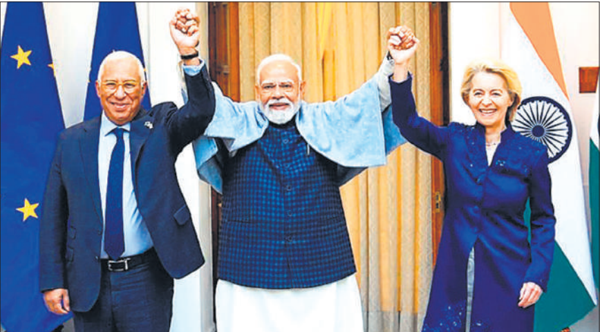
नई दिल्ली में प्रधानमंत्री मोदी, यूरोपीय परिषद के अध्यक्ष एंटोनियो कोस्टा और ईयू की अध्यक्ष उर्सुला वॉन एकजुटता दिखाते हुए।

प्रधानमंत्री ने यूरोपीय संघ के नेताओं उर्सुला वॉन डेर लेयेन और एंटोनियो कोस्टा की मेजबानी की। इसके बाद दोनों पक्षों ने सुरक्षा व रक्षा सहयोग और यूरोप में भारतीय प्रतिभाओं की आवाजाही से जुड़े दो महत्वपूर्ण समझौतों पर हस्ताक्षर किए। नियम-आधारित वैश्विक व्यवस्था के अपने दृष्टिकोण के अनुरूप, भारत और 27 देशों के समूह ने अगले पांच वर्षों के लिए एक संयुक्त व्यापक रणनीतिक एजेंडा पेश किया। एफटीए के लिए वार्ता के समापन सहित कुल 13 समझौतों को अंतिम रूप दिया। व्यापार समझौते को अंतिम रूप देने में दोनों पक्षों के बीच बातचीत शुरू होने के बाद से 18 साल लग गए। समझौते पर