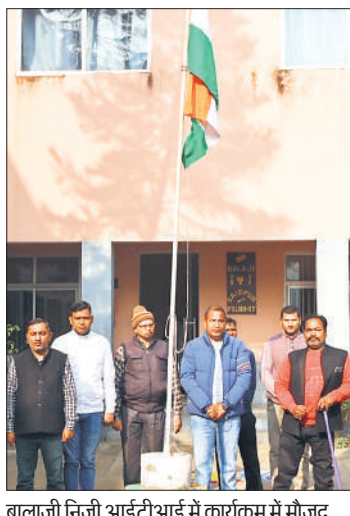
बालाजी निजी आईटीआई में कार्यक्रम में मौजूद अतिथि, संरक्षक व अन्य।