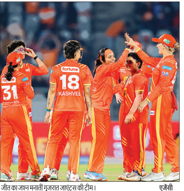
जीत का जश्न मनाती गुजरात जाएंट्स की टीम।

और फिर दिल्ली को 20 ओवर में आठ विकेट पर 171 रन पर रोक दिया। दिल्ली इस हार के बाद छह अंकों के साथ चौथे स्थान पर है। 175 रनों के लक्ष्य का पीछा करते हुए, दिल्ली कैपिटल्स ने शेफाली वर्मा की बदौलत तेज शुरुआत की, लेकिन तीसरे ओवर में आउट हो गईं। बीच के ओवरों में दिल्ली की कुछ बल्लेबाजों ने अच्छा प्रदर्शन किया, पर लक्ष्य हासिल नहीं हुआ।