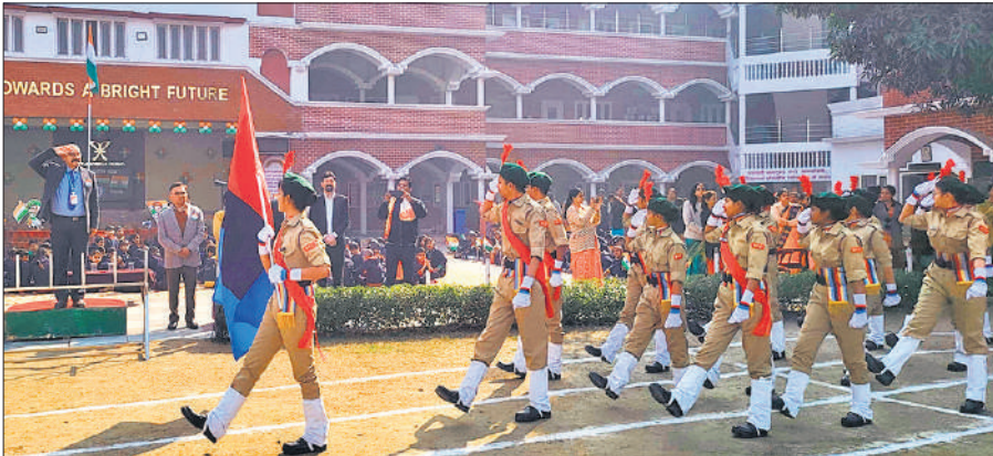
लिटिल एंजल्स स्कूल में परेड करते एनसीसी कैडेट्स।