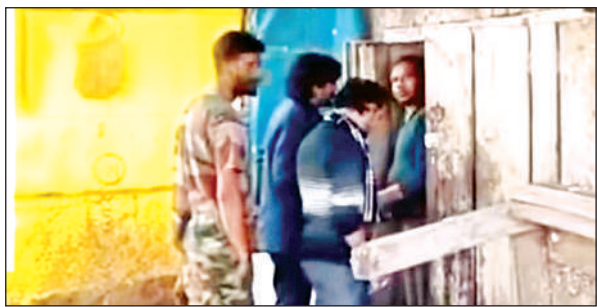
तिर्वा के गांधी नगर देशी शराब ठेके पर लोगों को शराब का व्वाटर देता सेल्समैन।

● तिर्वा के गांधी नगर देशी शराब ठेके पर खुलेआम बिक्री