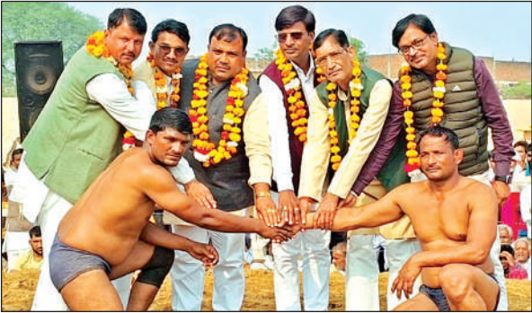
पहलवानों का हाथ मिलाकर कुश्ती शुरू कराते मुख्य अतिथि।