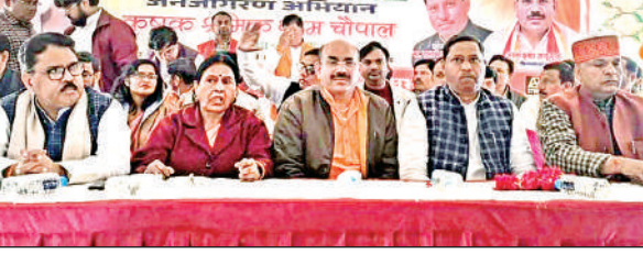
चौपाल में मंचासीन पूर्व सांसद रामशंकर कठेरिया व अन्य ।

मुख्य अतिथि पूर्व केंद्रीय राज्यमंत्री डॉ रामशंकर कठेरिया ने कहा कि कृषक, मजदूर, गांव की तरक्की से ही भारत विकसित होगा। स्वच्छता कि दृष्टि से ग्राम समिति को ही तय करना है कि स्वच्छता पर कितना बजट खर्च हो। ग्राम को सशक्त बनाकर सबसे पहले पानी निकासी के लिए नाली तथा कच्ची गलियों को पक्का किया जाएगा। विपक्ष ने लोकसभा चुनाव से पहले भ्रम फैलाया था कि भाजपा सरकार आयी तो संविधान बदल देगी। कांग्रेस सरकार ने बाबा साहब को दो बार चुनाव हराने का काम