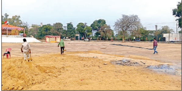
शहर के बोर्डिंग मैदान की गीली पिच को आग जला कर सुखाते कर्मचारी व पानी भरे मैदान में डाली जा रही मिट्टी।