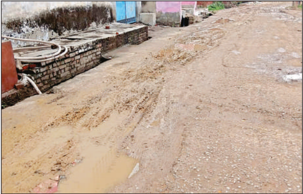
बरसात के बाद कुछ ऐसा हाल हो गया गदनपुर बहू मोहल्ले की सड़क का।

दो से तीन दिन रहेंगे बादल, अधिकतम तापमान में 6 डिग्री की गिरावट दर्ज की गई