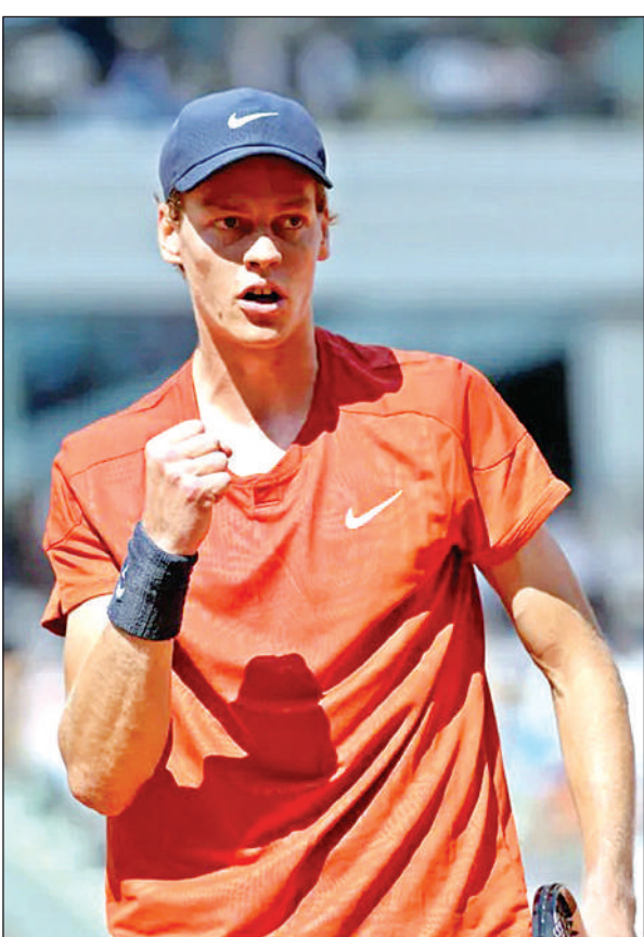
विश्व के दूसरे नंबर के टेनिस खिलाड़ी यानिक सिनर।