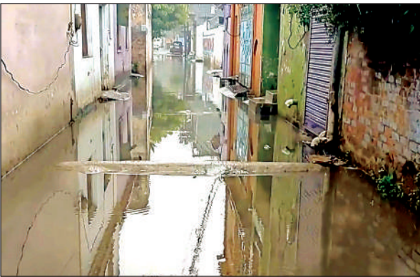
फर्रुखाबाद के मोहल्ला हरभगत में जलभराव का नजारा।

मंगलवार शाम को तेज हवाओं के साथ आसमान में बादल छा गए थे और हल्की बूंदवांदी शुरू हुई। रात में गरज के साथ तेज बारिश हुई, जो बुधवार सुबह तक रुक-रुक कर जारी रही। इस बारिश ने शहर की सफाई व्यवस्था की पोल खोल दी। शहर के मोहल्ला नेकपुर चौरासी, हरभगत, सधवाड़ा, तलैया और फतेहगढ़ के कई मोहल्लों की गलियों में पानी भर गया। स्थानीय निवासियों ने बताया कि नालियों के चोक होने के कारण जलभराव हुआ,