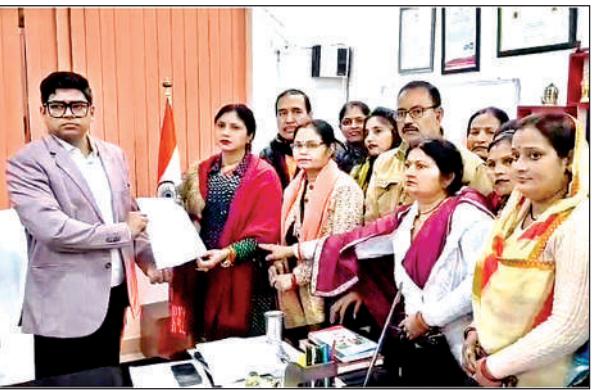
डीएम को ज्ञापन सौंपते ब्राह्मण एकता परिषद के पदाधिकारी।

● काला कानून की संज्ञा देते हुए पुनः समीक्षा करने की मांग