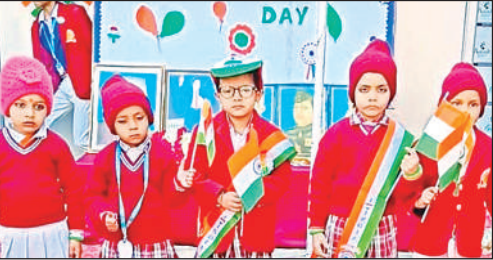
सांस्कृतिक कार्यक्रम पेश करते बच्चे ।