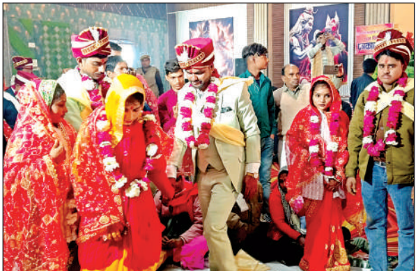
कार्यक्रम के तहत फेरे लेते नवदंपति जोड़े ।

सदर विधायक गुड्डिया कठेरिया ने कहा कि प्रदेश के मुख्यमंत्री योगी आदित्यनाथ ने देहेज रहित शादी के लिए मुख्यमंत्री सामूहिक विवाह योजना चलाई है। यह योजना आर्थिक रूप से कमजोर लोगों के लिए बहुत ही उपयोगी साबित हो रही है। उन्होंने कहा कि जो जोड़े आज दाम्पत्य सूत्र में बंध रहे हैं वह भविष्य में सुखमय जीवन व्यतीत करेंगे, यह मेरा आशीर्वाद है। उन्होंने नव दम्पति को वस्त्र व उपहार आदि भेंट करते हुए