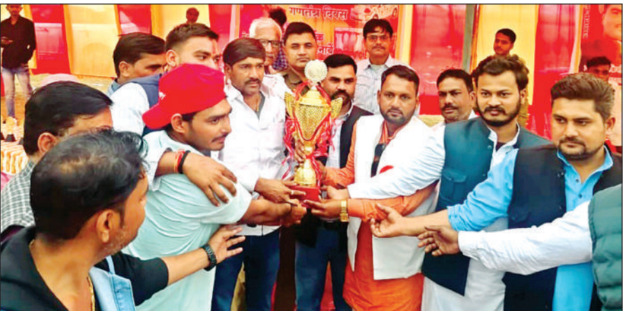
फाइनल मुकाबला जीतने के बाद ट्रॉफी के साथ खड़ी विजेता टीम के कप्तान और मुख्य अतिथि।

फाइनल मुकाबले का अम्पायरों ने दोनों टीमों के कप्तानों के मध्य सिक्का उछाकर टॉस कराया, जिससे टीला क्लब ने जीतकर पहले फील्डिंग करने का निर्णय लिया। टीला क्लब के खिलाड़ियों के फील्डिंग सजाने के बाद बेलाताल