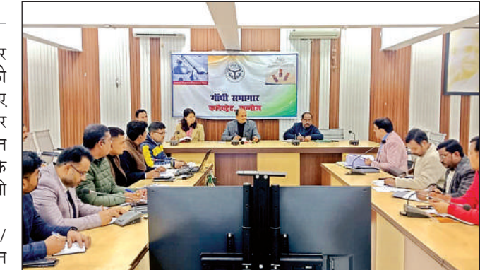
सभागार में बैठक लेते जिला निर्वाचन अधिकारी आशुतोष मोहन अग्निहोत्री व मौजूद अधिकारी।

जिला निर्वाचन अधिकारी/जिलाधिकारी आशुतोष मोहन अग्निहोत्री ने बुधवार को कलेक्ट्रेट गांधी सभागार में आयोजित बैठक में निर्देश दिए कि जिन बीएलओ द्वारा अब तक किसी भी प्रकार का कार्य नहीं किया गया है, उनकी गहनता से निगरानी की जाए। बीएलओ द्वारा की जा रही कार्यवाही की निर्यामित समीक्षा की जाए। कार्य में शिथिलता किसी भी दशा में स्वीकार्य नहीं होगी। कहा कि शून्य