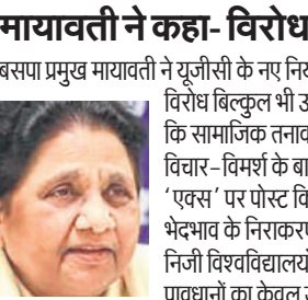
लोग ही विरोध कर रहे हैं, इसे भेदभाव और भ्रष्टांत्र मानना कर्तई उचित नहीं है।