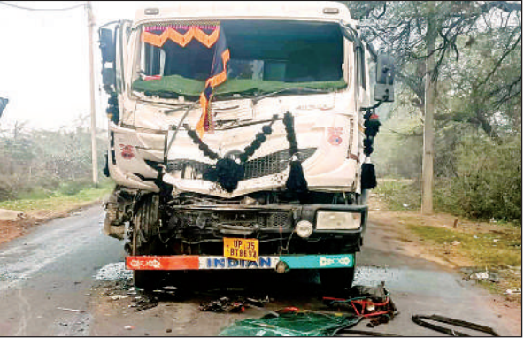
हादसे के बाद सड़क पर खड़ा क्षतिग्रस्त डंपर।

अमृत विचार। क्षेत्र के भेड़ी घाट से मोरंग लेकर आ रहे डंपर की विपरीत दिशा से आ रहे दूसरे डंपर से आमने-सामने सीधी हुई भिड़ंत हो गई। घटना में दोनों डंपर के चालक घायल हो गए। जिन्हें छानी सीएचसी में भर्ती कराया। जहां हालत गंभीर होने पर एक चालक को जिला अस्पताल रेफर कर दिया। थाना क्षेत्र के बिंवार-बांधुर मार्ग में मंगलवार की रात करीब साढ़े 12 बजे भेड़ी घाट से मोरंग लेकर कस्बे की ओर डंपर यूपी 35 बीटी 8694 आ रहा था। तभी विपरीत दिशा से भेड़ी घाट मोरंग खदान जा रहे डंपर यूपी 92 बीटी 9120 से आमने-सामने सीधी भिड़ंत हो गई है। जिससे दोनों डंपर चालक केबिन में फंसकर घायल हो गए हैं। घटना के बाद सड़क मार्ग बंद हो