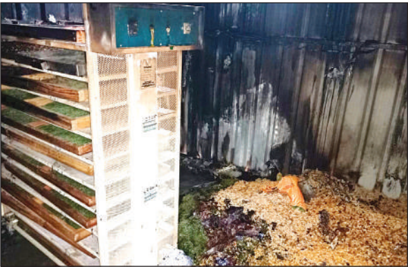
बिजली लाइन की स्पार्किंग से लगी आग से जला माल व मशीनें।