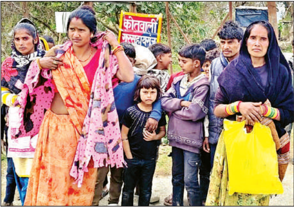
कोतवाली के बाहर खड़ी पीड़ित बालक के परिवार की महिलाएं व बच्चे।