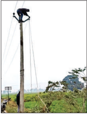
मानपुर उपकेंद्र से संबंधित टूटे तार को ठीक करते लाइनमैन।