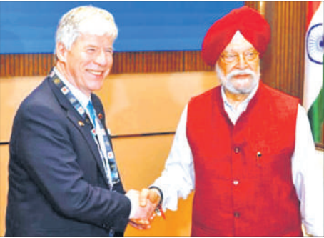
भारत ऊर्जा सप्ताह में भारत के पेट्रोलियम एवं प्राकृतिक गैस मंत्री हरदीप पुरी तथा कनाडा के ऊर्जा मंत्री टिओमी हाजसन।

दोनों देश हरित हाइड्रोजन व सौर की उत्पादकता और वितरण के संदर्भ में भी मिलकर कार्य करने पर सहमति जताई। विश्व का दूसरा सर्वाधिक क्षेत्रफल वाले देश कनाडा और विश्व की सर्वाधिक जनसंख्या वाले देश भारत के बीच ऊर्जा क्षेत्र में हुआ पहल उत्तरी अटलांटिक तथा पैसिफिक--एशिया के देशों को भी एक नई दिशा प्रदान करेंगे। समझौते के पश्चात भारत के पेट्रोलियम एवं प्राकृतिक गैस मंत्री हरदीप सिंह पुरी ने कहा कि ऊर्जा क्षेत्र में हमारा देश एक उभरती शक्ति बन चुका है। उन्होंने यह भी कहा कि भविष्य में ऊर्जा क्षेत्र की चुनौतियों का सामना