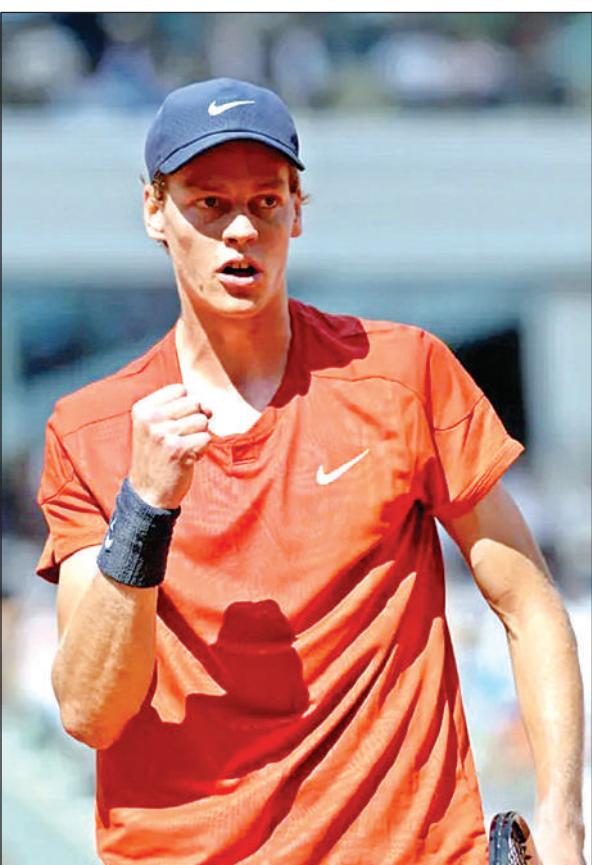
विश्व के दूसरे नंबर के टेनिस खिलाड़ी यानिक सिनर।