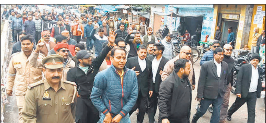
यूजीसी के विरोध में जुलूस के रूप में नारेबाजी करते हुए कलेक्ट्रेट जाते लोग।

जिले में यूजीसी के विरोध में सवर्ण समाज की ओर से बीते दिनों ही बुधवार का दिन तय कर दिया गया था। इसके तहत सुबह बारिश के बीच टनकपुर हाईवे पर नकटादाना चौराहा पर लोग जमा होना शुरू हो गए। इसमें किसी संगठन का कोई बैनर न लगाकर सिर्फ सवर्ण समाज की एकजुटता का संदेश देने का काम किया गया। एकत्र होने के बाद पहले चौराहा पर ही नारेबाजी की गई। चूंकि प्रदर्शन का एलान पहले ही