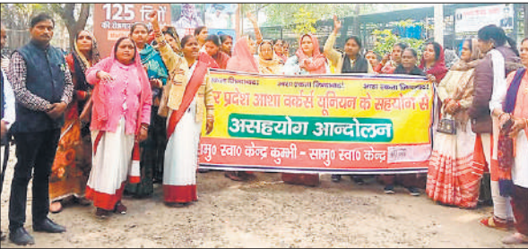
गोला तहसील में प्रदर्शन करती आशा वर्कर्स।