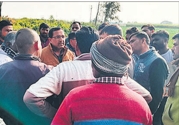
जगदेवपुर सेंटर पर मिल कर्मचारी व सचिव व ग्रामीण मौजूद।