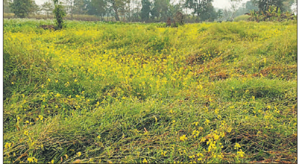
तेज हवा और बारिश में गिरी सरसों की फसल।

मौसम विभाग के अनुसार मंगलवार को जिले का अधिकतम तापमान 23 डिग्री सेल्सियस और न्यूनतम तापमान 13 डिग्री सेल्सियस दर्ज किया गया था। वहीं बुधवार को हल्की बारिश और तेज हवाओं के चलते तापमान में करीब तीन डिग्री सेल्सियस की गिरावट आई। बुधवार को अधिकतम तापमान 20 डिग्री