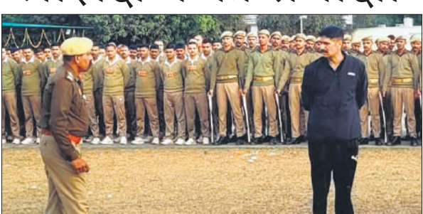
पुलिस लाइन में समीक्षा करते डीआईजी/एसपी अभिषेक यादव।