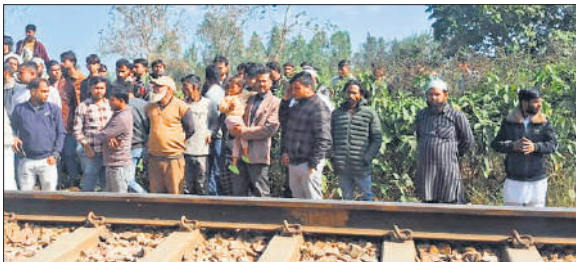
हादसे के बाद रेलवे लाइन किनारे जुटी भीड़।

आंखों की कमजोर रोशनी के चलते ट्रेन का अंदाजा न लगा पाने का जताया अंदेशा