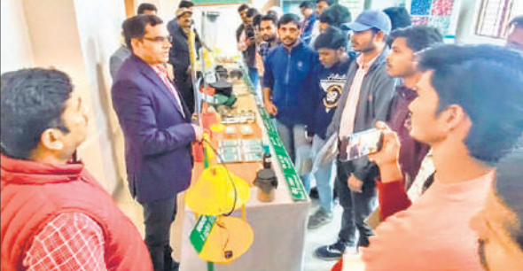
कृषि महाविद्यालय में नाशीजीव प्रबंधन की जानकारी देते कृषि अधिकारी एवं मौजूद विद्यार्थी।