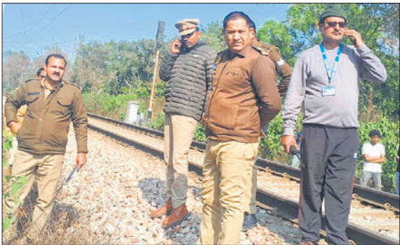
हादसे की सूचना पर पहुंची न्यूरिया पुलिस।