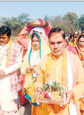
कलश यात्रा निकालते भक्त।