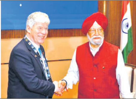
भारत ऊर्जा सप्ताह में भारत के पेट्रोलियम एवं प्राकृतिक गैस मंत्री हरदीप पुरी तथा कनाडा के ऊर्जा मंत्री टिओमी हाजसन।

उन्होंने यह भी कहा कि भविष्य में ऊर्जा क्षेत्र की चुनौतियों का सामना