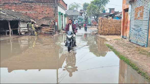
पड़रिया तुला में भरा पानी।

व्यवस्था बदहाल रही। बहादुर नगर, महाराजनगर और रोडवेज क्षेत्र में पूरी रात बिजली गुल रही, जिससे लोगों को गर्मी और उमस में जागकर रात गुजारनी पड़ी। कई जगहों पर केवल जलने और पोल से तार टूटने