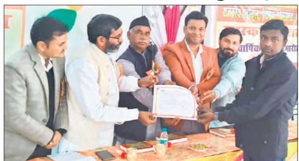
मेधावी बच्चे को पुरस्कृत करते अतिथि।