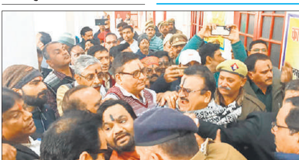
भीड़ को डीएम कार्यालय के गेट पर रोकती पुलिस।