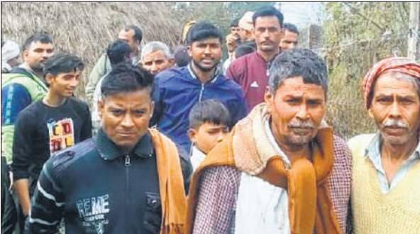
चांदपुर में तेंदुआ को भागते देख मौके पर लगी भीड़।

ब्रह्मा जी ने दक्ष को प्रजापतियों का नायक बनाया, जिससे दक्ष को अभियान आया और अभियान में आकर के दक्ष ने शंकर जी का अपमान किया, जिससे शंकर जी के गणों ने दक्ष के सिर को उखाड़ करके हवन कुंड में डाल दिया। तब शंकर जी ने दक्ष के बकरे का सिर लगा दिया। श्रीमद् भागवत कथा में आए तमाम श्रोतागण ब्रह्मा जी द्वारा सृष्टि की उत्पत्ति का प्रसंग सुन मंत्र मुग्ध हो गए।