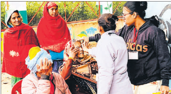
आंखों की जांच करता प्रशिक्षित स्टाफ।