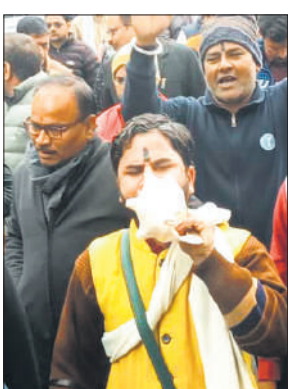
विरोध प्रदर्शन के दौरान शंख ध्वनि करता चल रहा युवक।