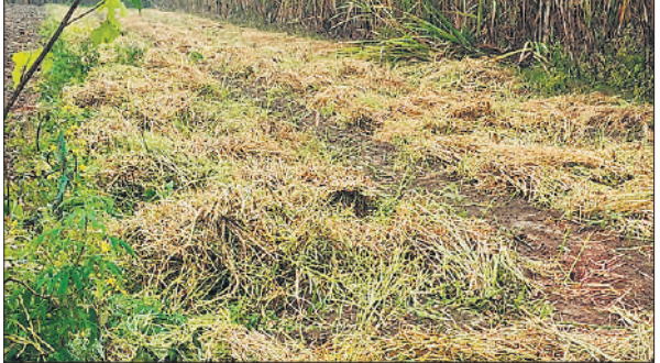
मझगई क्षेत्र में बारिश में भीगी खेत में कटी पड़ी सरसों की फसल।