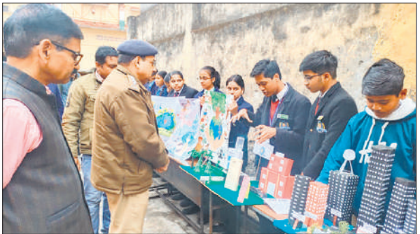
मॉडल व पोस्टर प्रदर्शनी का अवलोकन करते अतिथि।