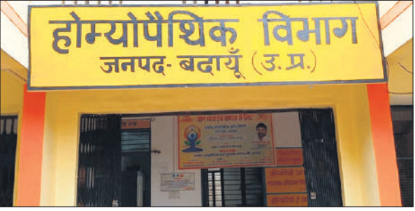
होम्योपैथिक अस्पताल भवन

होम्योपैथी के जनपद में 12 अस्पताल हैं, जिला अस्पताल स्थित होम्योपैथिक भवन को छोड़कर अन्य सभी अस्पताल दो साल से पहले किराए के मकान में चल रहे थे। किराए के मकान के बजाए अपनी गह खरीदकर अस्पताल बनाने के निर्देश दिए गए थे। लेकिन कहीं पर भी विभाग को