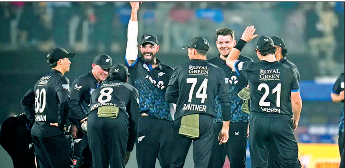
जीत का जश्न मनाती न्यूजीलैंड की टीम।

216 रनों के लक्ष्य का पीछा करने उतरी भारत की शुरुआत खराब रही और उसने नौ रन के स्कोर पर अपने दो विकेट गंवा दिये। अभिषेक शर्मा (शून्य) और सूर्यकुमार यादव (आठ) रन बना कर आउट हुये। इसके बाद संजू सैमसन ने रिकू सिंह के साथ तीसरे विकेट के लिए 46रन जोड़े। सातवें ओवर में मिचेल सैंटनर ने संजू सैमसन 16 गेंदों में 24 रन को आउटकर भारत को तीसरा झटका दिया। हार्दिक पंड्या (दो) को भी सैंटनर ने आउट किया। रिकू सिंह 30 गेंदों में 39 रन बनाकर पांचवें विकेट के रुप में आउट हुये। इसके बाद शिवम दुबे ने हर्षित राणा के साथ छठे विकेट के लिए 63 रन जोड़कर कुछ उम्मीद जगाई थी कि इसी दौरान 15वें ओवर की आखिरी गेंद पर मेट हेनरी ने शिवम दुबे को रनआउट कर पवेलियन भेज दिया। शिवम दुबे ने 23 गेंदों में सात छक्के और