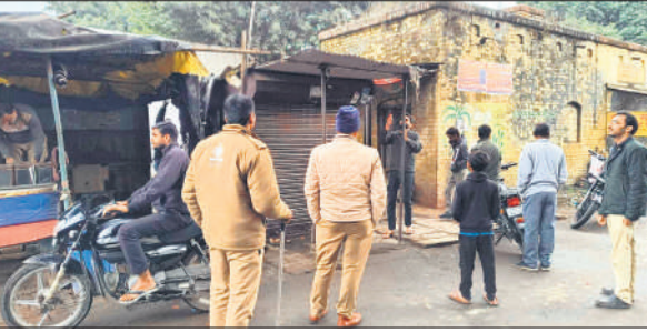
रोजा में रेलवे की जमीन से अतिक्रमण हटवाते रेलवे अधिकारी और आरपीएफ ।

था, लेकिन बाद में उसकी गली से ईंटें हटाकर काम अधूरा छोड़ दिया गया। इस संबंध में उसने उच्च अधिकारियों से शिकायत की थी, जिसके बाद एक जांच समिति बनाई गई थी। आरोप है कि जांच समिति में शामिल कुछ अधिकारियों ने शिकायत वापस लेने पर गंभीर परिणाम भुगतने और झूठे मुकदमे दर्ज कराने की धमकी दी थी। महिला ने पूरे प्रकरण में रिश्तत मांगने और धमकी देने वाले अधिकारियों के खिलाफ एफआईआर दर्ज कर कार्रवाई की मांग की है।