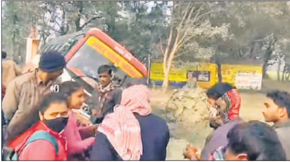
सड़क से नीचे उतरी बस व मौके पर खड़े यात्री ।

लोगों से शिनाख्त कराने का प्रयास किया, लेकिन पहचान नहीं हो सकी। सूचना पर पुलिस लाइन से फोरेंसिक टीम भी मौके पर पहुंची और जांच के बाद आवश्यक नमूने एकत्र किए।