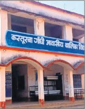
कस्तूरबा गांधी आवासीय विद्यालय।

फरवरी माह में शैक्षिक भ्रमण पर जाने वाली बालिकाओं वाहन को डीएम हरी झंडी दिखाकर रवाना करेंगे। जिले में 18 कस्तूरबा गांधी आवासीय विद्यालय संचालित हैं।