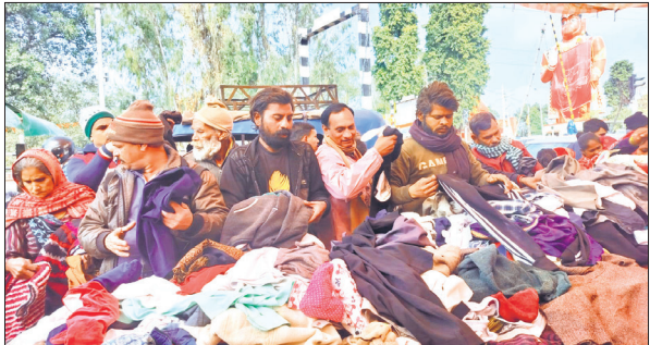
कपड़ा वितरण के दौरान मौजूद लोग।