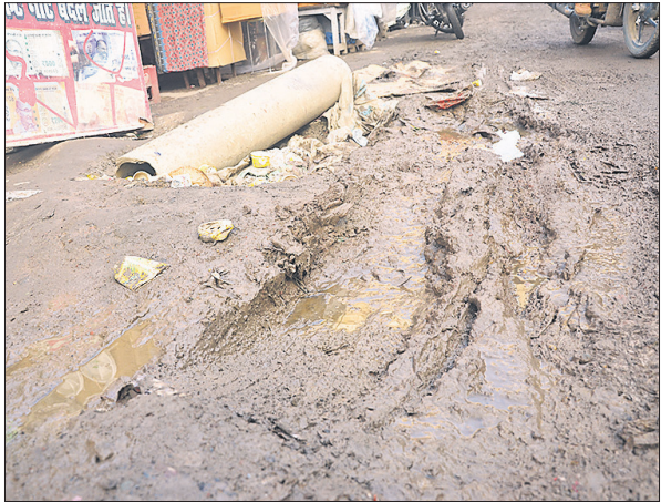
सड़क पर कीचड़ की वजह से आवाजाही में हो रही दिक्कत।

जाए या कोई वाहन गड्ढे में फंसकर हादसे का शिकार न हो जाए। दुकानदारों का कहना है कि इंदौर हर गुजरते शब्द के लिए खतरे की घंटी बज गई है। हालात ऐसे हैं कि पैदल चलना तक दुभर है, वाहन चालकों को भी जोखिम उठाना पड़ रहा है। श्यामगंज में किराना, अनाज, दाल, मसाले समेत कई तरह की थोक और फुटकर दुकानें हैं। इन पर पूरे इलाके की निर्भरता है। सुबह से देर रात तक यहां आवाजाही रहती है, लेकिन अब व्यापारी दुकान खोलते वक्त भी सहमे रहते हैं कि कहीं कोई ग्राहक फिसल न