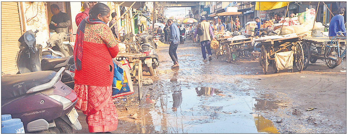
पाइप लाइन की खुदाई के बाद भंगलवार रात बारिश से श्यामगंज दाल मंडी में सड़क पर फिसलन बन गई। लोगों को आवाजाही में परेशानी हुई।

श्यामगंज में किराना, अनाज, दाल, मसाले समेत कई तरह की थोक और फुटकर दुकानें हैं। इन पर पूरे इलाके की निर्भरता है। सुबह से देर रात तक यहां आवाजाही रहती है, लेकिन अब व्यापारी दुकान खोलते वक्त भी सहमे रहते हैं कि कहीं कोई ग्राहक फिसल न