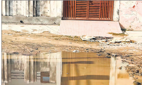
कई घरों के चोतरो के सामने भरा पानी।