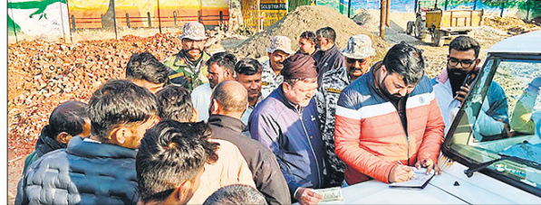
पीलीभीत रोड पर अतिक्रमण हटाने के अभियान के दौरान नगर निगम की टीम।