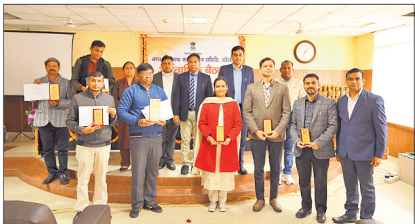
पत्रिका विमोचन के दौरान अधिकारी व कर्मचारी।

प्रधान आयकर आयुक्त ने राजभाषा कार्यान्वयन में उत्कृष्ट योगदान के लिए कुल नौ पुरस्कार प्रदान किए। इनमें केंद्रीय कार्यालयों की श्रेणी में मंडल रेल प्रबंधक, पूर्वोत्तर रेलवे को प्रथम, वेनन लेखा कार्यालय (अ.श्रे.) जाट रेजीमेंट केंद्र को द्वितीय और पासपोर्ट कार्यालय को तृतीय पुरस्कार मिला। निगम, उपक्रम एवं विद्यालय श्रेणी में केंद्रीय विद्यालय इफको आंवला को प्रथम, कर्मचारी भविष्य निधि संगठन को द्वितीय और केंद्रीय विद्यालय, पूर्वोत्तर रेलवे को तृतीय पुरस्कार