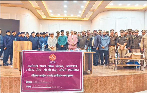
प्रशिक्षण के दौरान पुलिस अफसर व कर्मी।