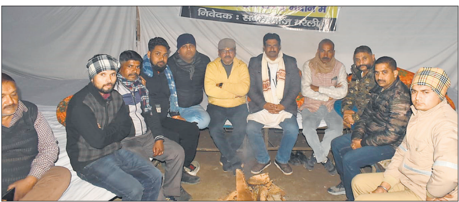
यूजीसी बिल के विरोध में सेठ दामोदर स्वरूप पार्क में रात में धरने पर बैठे सर्व समाज के लोग।

बरेली पुरुरन्थान समिति के वरिष्ठ नेताओं ने एकजुटता का परिचय देते हुए पार्क में बड़ा टेंट लगवाया है, सर्दी