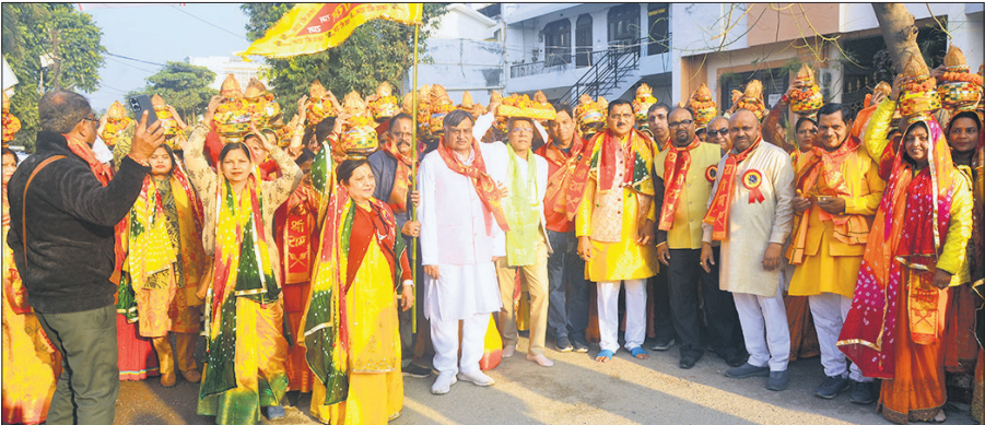
कलश यात्रा में बड़ी संख्या में श्रद्धालुओं ने भाग लिया।