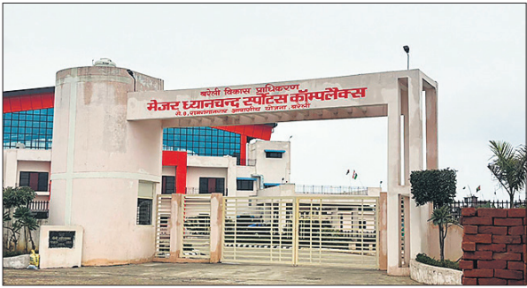
मेजर ध्यानचंद स्पोर्ट्स कॉम्पलेक्स।

अमृत विचार : शहर के खिलाड़ियों के लिए खुशखबरी है। रामगंगा आवासीय योजना में करीब 17 करोड़ रुपये से निर्मित मेजर ध्यानचंद स्पोर्ट्स कॉम्पलेक्स का निर्माण पूरा हो चुका है। बीडीए ने इसके संचालन के लिए टेंडर निकालने की तैयारी तेज कर दी है। योजना है इसे थर्ड पार्टी फर्म के माध्यम से चलाया जाएगा। बीडीए का दावा है यह कॉम्पलेक्स शहर के युवा खिलाड़ियों को न केवल प्रशिक्षण के बेहतर अवसर देगा, बल्कि राष्ट्रीय और अंतरराष्ट्रीय स्तर पर पहचान बनाने में भी मदद