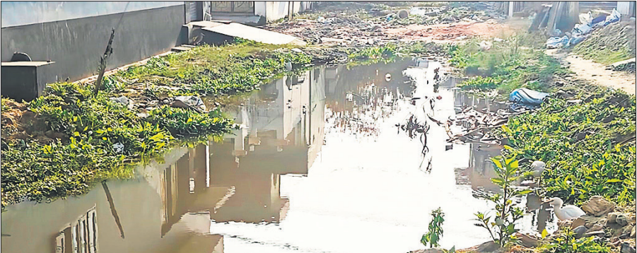
गली में जलभराव के कारण लोगों की आवाजाही में हो रही परेशानी।

घरों से निकलने वाला पानी कच्चे मार्ग पर भर जाता है और पूरी गली तालाब का रूप ले लेती है। हालात इतने बिगड़ गए कि पानी की निकासी के लिए स्थानीय लोगों ने खुद ही जेसीबी से गड्ढा खुदवाकर पानी उसमें मोड़ दिया। लेकिन यह जुगाड़ उलटा पड़ गया। गड्ढा भरने