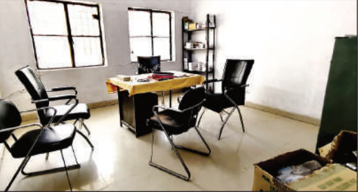
सलेमपुर सीएचसी में खाली पड़ी डॉक्टरों की कुर्सियां।