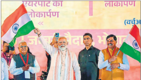
कार्यक्रम के दौरान राष्ट्रीय ध्वज लहराते प्रधानमंत्री मोदी, मप्र के सीएम मोहन यादव।

लोकमता देवी अहिल्याबाई की 300वीं जयंती पर आयोजित महिला सशक्तीकरण महासम्मेलन में मोदी ने सिंदूर को वीरता का प्रतीक करार दिया और पहलगाम हमले के बाद पाकिस्तान में आतंकवादियों के खिलाफ चलाए गए ऑपरेशन सिंदूर को देश के इतिहास का सबसे बड़ा और सबसे सफल आतंकवाद विरोधी अभियान बताया। कहा कि आतंकवादियों ने भारत की नारी शक्ति को चुनौती दी है, यही आतंकवादियों और उनके आकाओं के लिए काल बन गई है।