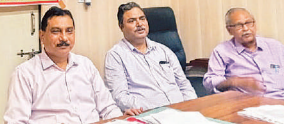
विश्व तंबाकू निषेध दिवस पर जानकारी देते कार्यवाहक सीएमओ व अन्य।

देते हैं। बताया कि तंबाकू के सेवन से ओरल, फेफड़ों के कैंसर, हृदय रोग सहित नपुंसकता व बांझपन आदि गंभीर बीमारी होती है। बताया कि सभी सीपचसी, पीपचसी में इसके निकोटिन चिक्चन उपलब्ध हैं। जिसके प्रयोग से लोग तंबाकू सेवन