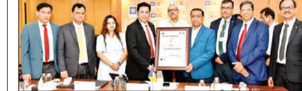
प्रमाणपत्र प्राप्त करते एलआईसी के अधिकारी।