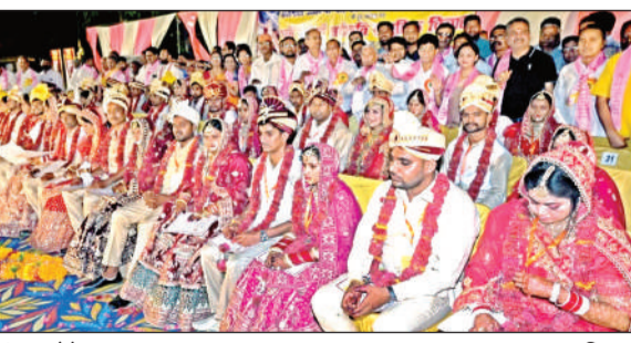
मंच पर बैठे वर-वधु।

सर्वधर्म सर्व जातीय का 15वां सामूहिक विवाह समारोह राष्ट्रीय इंटर कालेज किदवाईनगर में हुआ। जिसमें जोड़ों ने जीवन भर का साथ निभाने का संकल्प लिया। सर्वप्रथम अहिल्याबाई होल्कर की जयंती पर उनकी प्रतिमा पर माल्यार्पण किया गया। इसके बाद जोड़ों का जयमाल कार्यक्रम हुआ। विधायक, सांसद ने वर-वधुओं को आशीर्वाद दिया। वर-वधुओं को बेड, रजाई, गद्दा, अटैची, अलमारी