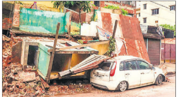
असम के गुवाहाटी में एक स्कूल की चारदीवारी ढह जाने के बाद सड़क किनारे क्षतिग्रस्त कार।