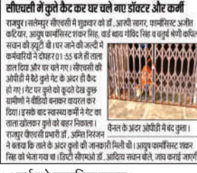
सीएचसी में कुत्ते केर कर घर चले गए डॉक्टर और कर्मियों का चर्चा कर रहे हैं।