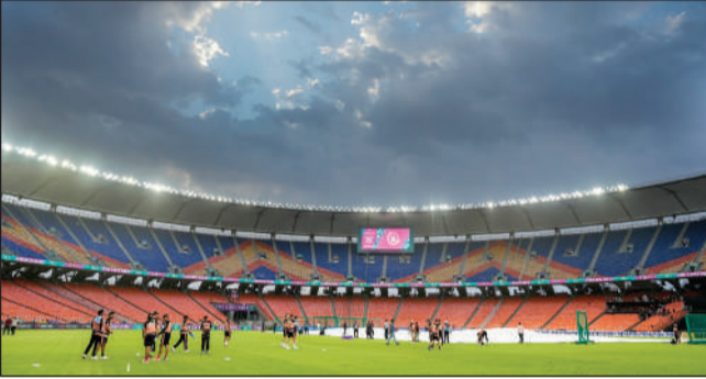
अहमदाबाद में नरेंद्र मोदी स्टेडियम में अभ्यास करते पंजाब किंग्स के खिलाड़ी।

मौसम का हाल : पंजाब किंग्स और मुंबई इंडियंस के मैच के दौरान अहमदाबाद में बारिश की संभावना न के बराबर है। तापमान 35 डिग्री सेल्सियस से लेकर 33 डिग्री सेल्सियस के आस-पास रह सकता है।