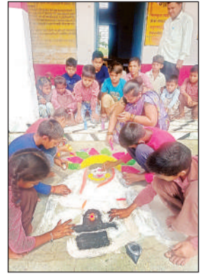
अहिल्या बाई के चित्र की रंगोली बनाते छात्र-छात्राएं।