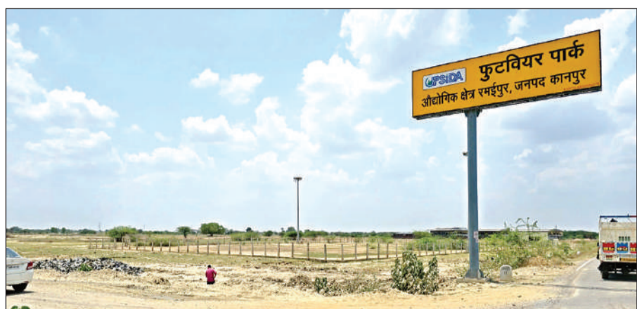
रमईपुर में फुटवेयर पार्क विकसित किया जा रहा है।

यूपीसीडा की ओर से यह फुटवेयर पार्क सूक्ष्म, लघु एवं मध्यम उद्यमों (एमएसएमई) को एकीकृत एवं आधुनिक सुविधाएं प्रदान करने के लिए विकसित किया जा रहा है। पार्क के पहले चरण में प्रस्तावित 75 औद्योगिक भूखंडों में से 26 भूखंड 4600 रुपये प्रति वर्ग मीटर की दर से उपलब्ध कराए गए हैं। आवंटन प्रक्रिया के तहत निवेशकों को आवेदन के साथ भूमि मूल्य का 5 फीसदी अग्रिम भुगतान करना होगा। इसके बाद आवंटन पत्र जारी होने के 60 दिनों के भीतर