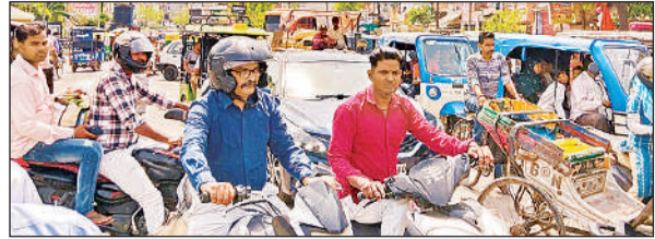
नवीन पुल के रास्ते में जाम में फंसे वाहन सवार।