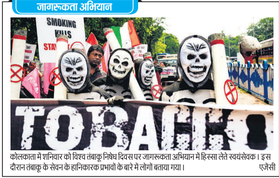
कोलकाता में शनिवार को विश्व तंबाकू निषेध दिवस पर जागरूकता अभियान में हिस्सा लेते स्वयंसेवक। इस दौरान तंबाकू के सेवन के हानिकारक प्रभावों के बारे में लोगों को बताया गया।

ने देखा है। हम अगर आपके पास आते हैं तो या तो कोई योजना देकर जाते हैं, बटन दबाकर आपके खाते में कुछ देकर जाते हैं और आपका सशक्तीकरण करने का काम करते हैं, यह हमारे काम करने का तरीका है।