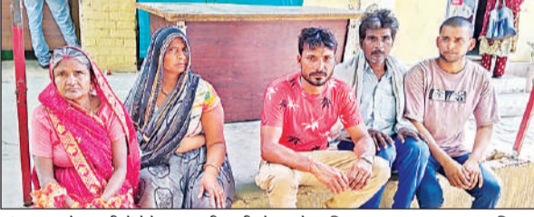
गंगाघाट कोतवाली में बेटे मृतक की पत्नी, बेटा और परिजन। अमृत विचार

▶ शुक्रवार को चारपाई पर मिला था किसान का शव