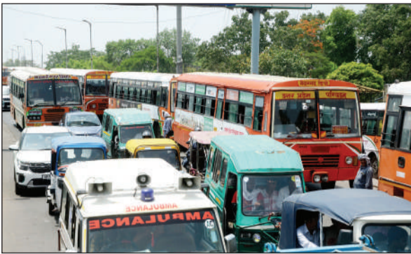
झकरकटी बस अड्डे के बाहर सड़क जाम किए बसें।