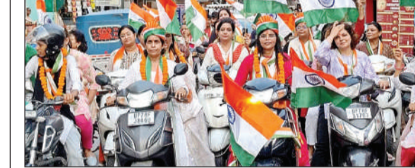
बीएनएसडी शिक्षा निकेतन से निकली तिरंगा यात्रा।