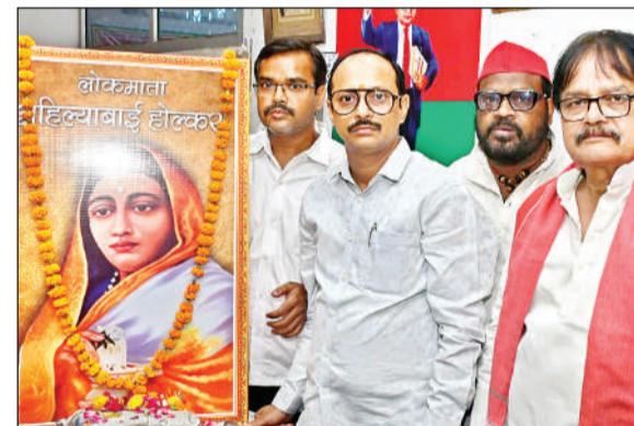
अहिल्याबाई जयंती पर मौजूद सपा नेता।