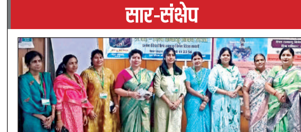
जेके कैंसर संस्थान में मौजूद विशेषज्ञ।

मिलने पर वह स्मोकिंग करने लगा। जांचों से पता चला कि बच्चे के सिर की वह नस ब्लॉक हो गई है, जो हाथ, पैर, आवाज, कान आदि को कंट्रोल करती है और याददास्त मजबूत करती है।