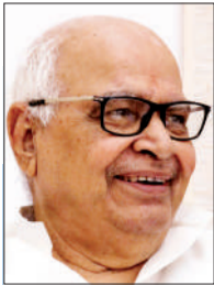
हृदय नारायण दीक्षित पूर्व विधानसभा अध्यक्ष उ.प्र.

भारतीय साहित्य और इतिहास ऐसी कथाओं से भरा पूरा है। सामान्यतया राष्ट्र जीवन के उद्देश्यों के लिए काम करने वाले महानुभावों की कथाएं हम सबको प्रेरित करती हैं। उनके गीत गाए जाते हैं। चारों तरफ उनकी कीर्ति फैलती है। वे यशस्वी होते हैं। वे इतिहास की सीमाओं को लांघकर समकालीनता का अतिक्रमण करते हैं। अमर हो जाते हैं। इतिहास उनका अनुसरण करता है। अपने अंतःस्थल में जगह देता है। स्त्री अपने संपूर्ण वैभव में माता है। माता प्रकृति की आदि और अनादि अनुभूति है। इसके बावजूद दुनिया के अनेक देशों में मानव इतिहास के दीर्घकाल तक स्त्रियों की स्थिति अच्छी नहीं रही। यूरोप में पुनर्जागरण (रेनेसांस) के पहले लखों महिलाओं को डायन बताकर मार दिया जाता था, लेकिन भारत में महिलाओं की स्थिति इससे भिन्न रही है। यहां सामाजिक विकास के साथ-साथ पुरुष और स्त्री में समानता का अधिकार और सहकार रहा है। ऋग्वेद के रचनाकाल के पहले तक