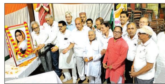
कांग्रेस ने रानी अहिल्याबाई को नमन किया।