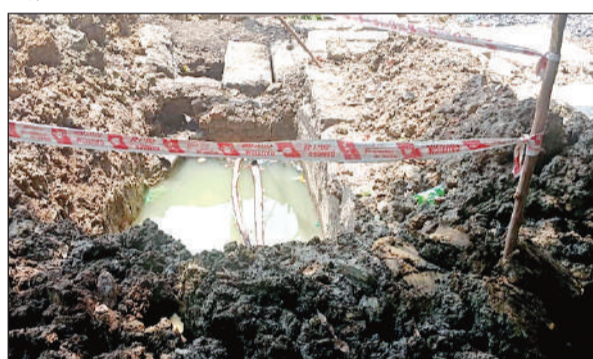
जूही लाल मंदिर चौराहा पर टूटी पेयजल-सीवरलाइन।

जूही लाल कालोनी और आस-पास के 50,000 लोग प्रभावित, अमी 3,4 दिन रहेगी दिक्कत