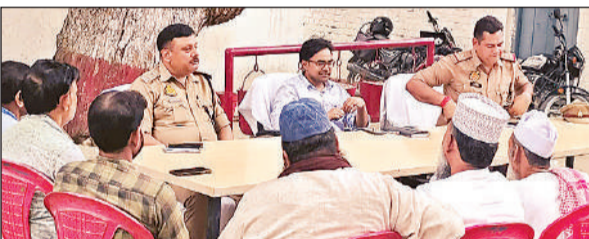
सफ़ीपुर कोतवाली में आयोजित पीस कमेट्री की बैठक में मौजूद अधिकारी व अन्य।