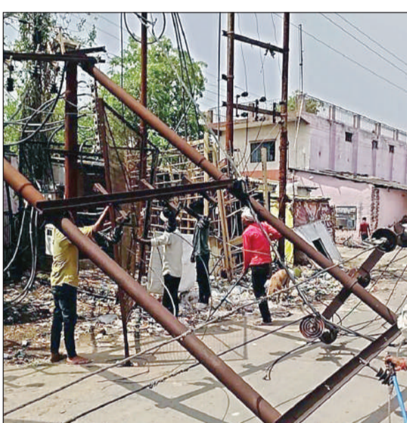
जाजमऊ में आंधी से पोल उखड़ गए थे जिससे कई इलाकों की बिजली गुल हो गई थी। शनिवार को यहां मरम्मत का काम चलता रहा।

शहर और ग्रामीण क्षेत्रों में आंधी और पानी की वजह से एक दर्जन से अधिक क्षेत्रों के पोल क्षतिग्रस्त हो गए थे और कई जगहों पर पेड़ व पेड़ की डाल गिरने से तार टूट गए थे। जिसकी वजह से कई इलाकों की बिजली गुल हो गई थी। कई इलाकों