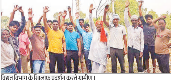
विद्युत विभाग के खिलाफ प्रदर्शन करते ग्रामीण।

अमृत विचार। ट्रांसफार्मर खराब होने से भीषण गर्मी में पांच दिनों से ग्रामीण परेशान हो गए। शनिवार को ग्रामीणों ने प्रदर्शन किया। बताते चले कि विकास खण्ड भरावन भरावन के पत्थरताली गांव में पांच दिन पूर्व ट्रांसफार्मर शाट सर्किट से खराब हो गया था। ग्रामीणों द्वारा टोल फ्री 1912 पर भी शिकायत दर्ज कराई गई और एसडीओ को भी फोन पर अवगत कराया गया। लेकिन कोई लाइन नैन अभी तक नहीं आया न ही कोई सुनवाई हुई है। ग्रामीणों ने बताया जेई को फोन किया गया