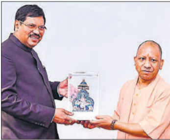
सीजेआई को प्रतीक चिह्न देते मुख्यमंत्री योगी।

में सामाजिक और आर्थिक समानता लाने के लिए बड़ा योगदान दिया है। जमींदारों से जमीन लेकर लोगों को दी गई है। खेती करने वालों को जमीन का मालिक बनाया