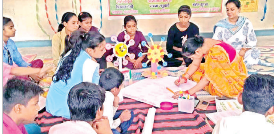
समर कैंप में गतिविधियों में भाग लेते छात्र-छात्राएं।

स्वास्थ्य विभाग द्वारा अस्पताल के आगे के हिस्से में तो सफाई करा दी जाती है, लेकिन इमरजेंसी वार्ड के पीछे व शवघर के आस-पास सफाई पर कोई ध्यान नहीं दिया जाता है। इससे अस्पताल आने जाने वाले लोगों को दंगी से जूझना पड़ता है। इतना ही नहीं स्वास्थ्य विभाग सफाई व्यवस्था के प्रति कोई ध्यान नहीं देता है। जिससे लोगों में आक्रोश दिखाई दे रहा है।