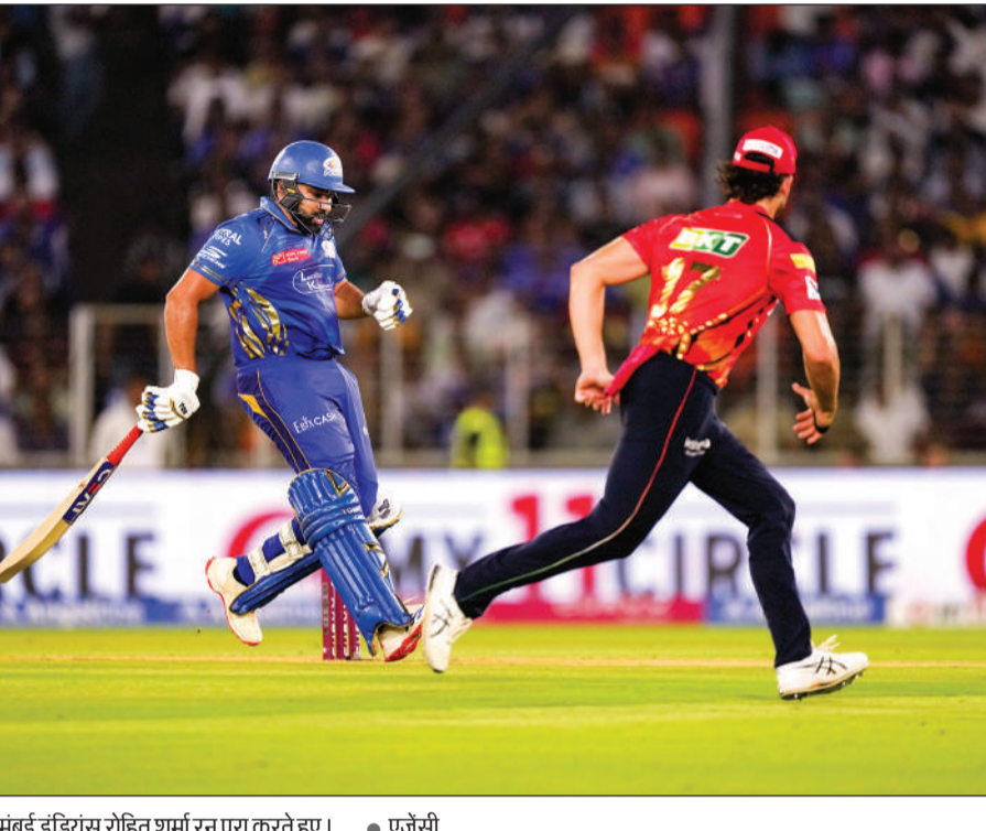
मुंबई इंडियंस रोहित शर्मा रन पूरा करते हुए।