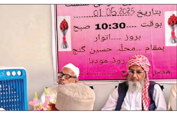
मुशायरे में कलाम पेश करते शायर।