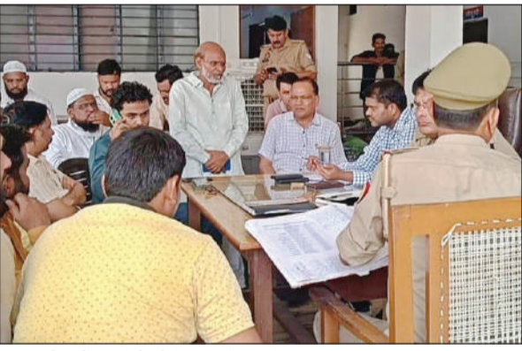
कोतवाली में पीस कमेटी की बैठक में मौजूद लोग। अमृत विचार

अमृत विचार। आगामी बकरीद के त्योहार को लेकर कोतवाली परिसर में पीस कमेटी की बैठक हुई। बैठक में कस्बे के विभिन्न वर्गों के लोगों के साथ प्रशासनिक अधिकारियों ने सहभागिता की। बैठक के दौरान एसडीएम, सीओ व कोतवाली सहित विभिन्न विभागों के अधिकारी, व्यापारी व कर्मचारी मौजूद रहे। इस दौरान नगर के लोगों ने बकरीद पर्व को लेकर तमाम सुझाव प्रशासनिक अधिकारियों के समक्ष रखे। कुर्बानी वाली जगहों पर साफ सफाई की व्यवस्था और नगर पालिका की ओर से कूड़ा उठाने वाली गाड़ी की व्यवस्था सुनिश्चित करवा जाने की मांग की। बता दें कि कस्बे में तीन जगह जिसमें बजरिया में कसौड़ा व फरसौलियाना में बड़ा कसौड़ा सहित बड़ी जुल्हैटी में यतीमखाने में कुर्बानी दी जाती