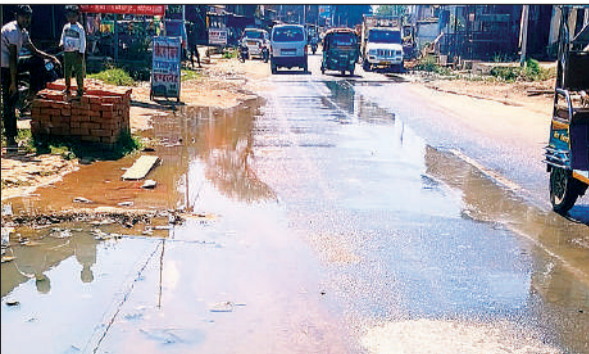
जलनिकासी की व्यवस्था न होने की वजह से सड़क पर भरा पानी।

स्थानीय लोगों की शिकायत के बाद भी जलनिकासी की कोई व्यवस्था नहीं हो पा रही है। नेशनल हाईवे से सटा हुआ भीखेपुर कस्बा है। वैसे तो यह कस्बा ब्लाक क्षेत्र की दो ग्राम पंचायत रतनीपुर