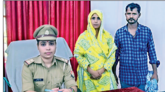
महिला थाना में मौजूद दंपति।