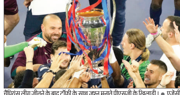
चैंपियंस लीग जीतने के बाद ट्रॉफी के साथ जश्न मनाते पीएसजी के खिलाड़ी।

पेरिस सेंट जर्में (पीएसजी) ने डिजायर डोए के दो गोल की मदद से शनिवार को यहां खेले गए एकतरफा फाइनल में इंटर मिलान को 5-0 से करारी शिकस्त देकर पहली बार यूरोपीय क्लब फुटबॉल की सबसे बड़ी प्रतियोगिता चैंपियंस लीग का खिताब जीता। पीएसजी ने दर्शकों के अपार समर्थन के बीच बेहतरीन खेल का नजारा पेश किया और इंटर के समर्थकों को आखिरी सिटी बजने से पहले ही स्टेडियम छोड़ने के लिए मजबूर किया। पीएसजी की तरफ से डोए ने 20वें और 63वें मिनट में गोल किए। उनके अलावा अचरफ हकीमी (12वें), ख्विचा क्वारारसेखेलिया (73वें) और स्थानापन्न सेनी मायुलु (86वें) ने