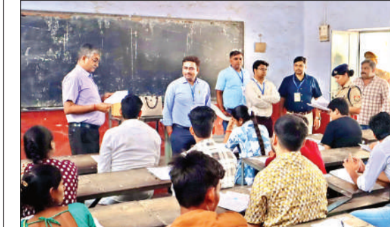
परीक्षार्थियों की कॉपी का अवलोकन करते जिला अधिकारी ।

कड़ी सुरक्षा व्यवस्था में हुई बीएड की परीक्षा