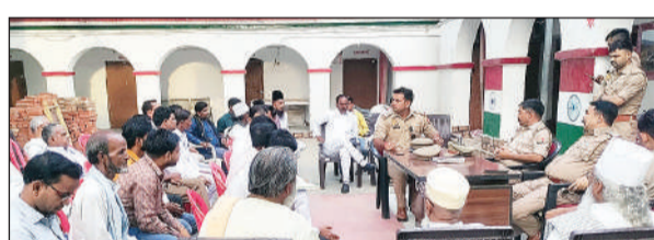
कोतवाली में बैठक के दौरान मौजूद कोतवाल व नागरिक।

एनडीआरफ टीम ने रविवार को कई घंटे तलाशी अभियान चलाया लेकिन सफलता नहीं मिली। आखिरकार एनडीआरफ की टीम लौट गई। युवक का कोई भी सुराग नहीं लगा।