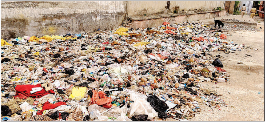
अस्पताल परिसर में लगा गंदगी का अंबार।

अमृत विचार। जिला अस्पताल के इमरजेंसी वार्ड के पीछे गंदगी का अंबार लगा है। बावजूद इसके स्वास्थ्य विभाग के अधिकारी कोई ध्यान नहीं दे रहे हैं, जिससे अस्पताल के एक हिस्से में पड़ा कूड़ा करकट और गंदगी संक्रामक बीमारियों को दवात दे रहा है। इतना ही नहीं पोस्टमार्टम के लिए आने वाले शवों को भी इसी गंदगी के पास बने शवघर में रखा जाता है, जिससे मृतक के परिजन शवों के नजदीक इसी गंदगी के आस पास बैठे रहते हैं। गौरतलब है कि जिला अस्पताल