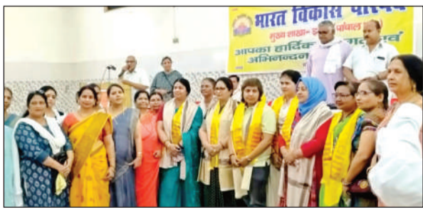
विभिन्न क्षेत्रों में काम करने वाली सम्मानित महिलाओं के साथ परिषद के पदाधिकारी।

मुख्य अतिथि सहित सभी ने भारत माता, स्वामी विवेकानन्द और लोक माता अहिल्याबाई के चित्रों पर पुष्प भेंट कर दीप प्रज्वलित किया। इस अवसर पर विशिष्ट अतिथि व मुख्य