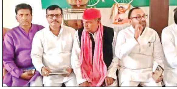
चुनाव की तैयारियों में जुटने की अपील करते पूर्व एमएलसी।

उन्होंने बताया कि जिले के सभी वर्ग के लाभार्थी को 10 प्रतिशत स्वयं का अंशदान जमा करना होगा। उन्होंने कहा कि परियोजना लागत में भूमि भवन द्वारा सम्मिलित नहीं किया जाएगा, तथा न्यूनतम 10 प्रतिशत टर्म लोन के रूप होना अनिवार्य होगा। लोन लेने के बाद लोगों को रोजगार मिल सकेगा।