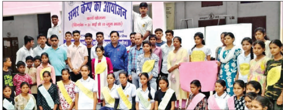
समर कैंप में शामिल छात्र-छात्राएं व स्टाफ।

उन्होंने बताया कि कुछ कहानियां वास्तविक घटना से प्रेरित होकर लिखी जाती हैं, तो कुछ कल्पनाओं पर आधारित होती हैं। उन्होंने बताया कि 'उसने कहा था' कहानी चंद्रधर शर्मा 'गुलेरी' द्वारा लिखित एक प्रसिद्ध रचना है, जिसमें प्रेम, त्याग और कर्तव्यनिष्ठा का समग्र दशांश बताया है। कहानी एक बहुत