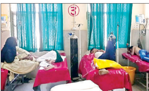
जिला अस्पताल की इमरजेंसी में भर्ती उल्टी दस्त के मरीज।

इन दिनों तेज धूप के चलते मुख्य कारणा पर दोषधर के समय सन्नाटा पसर जाता है। वही लोग निकल रहे जिन्हें जरूरी काम है। तीन दिन से जिला अस्पताल की इमरजेंसी में उल्टी दस्त के मरीजों की भीड़ लगने लगी है। कुछ भर्ती हो रहे को कुछ ओपीडी में उपचार ले रहे हैं।