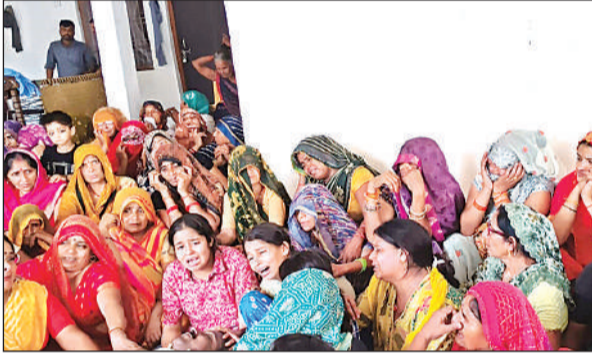
प्रधान संघ के जिलाध्यक्ष की मौत के बाद रोते-बिलखते परिजन।