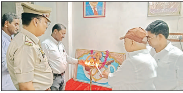
मां सरस्वती के चित्र के समक्ष दीप प्रज्वलित करते अतिथिगण।