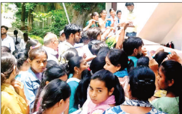
परीक्षा देने के बाद पीएसएम पीजी कॉलेज में जमा बैग मांगते अभ्यर्थी।