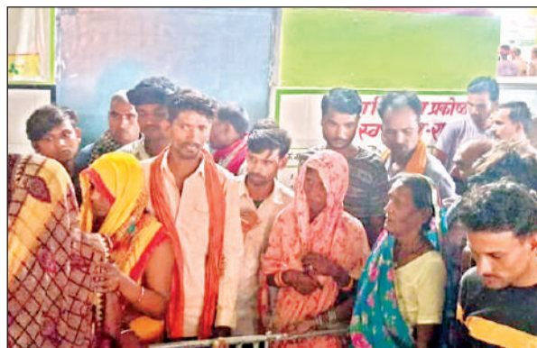
अस्पताल में परिजनों का हाल जानने को लगी लोगों की भीड़। अमृत विचार

पिकअप और डीसीएम की टक्कर में पांच लोगों की मौत का मामला, परिजनों की चीख पुकार से नम हुई लोगों की आंखें