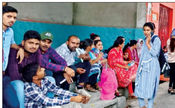
केके इंटर कॉलेज के बाहर बैठे बीएड प्रवेश परीक्षा के अभ्यर्थी।