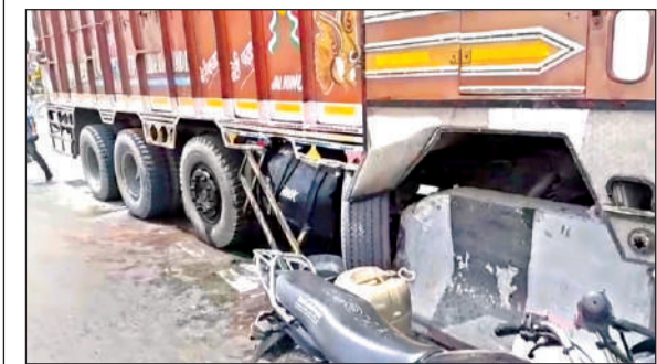
डिवाइडर से टकराया ट्रक।