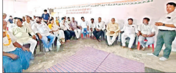
संविधान बचाओ सम्मेलन में मौजूद कांग्रेसी नेता।