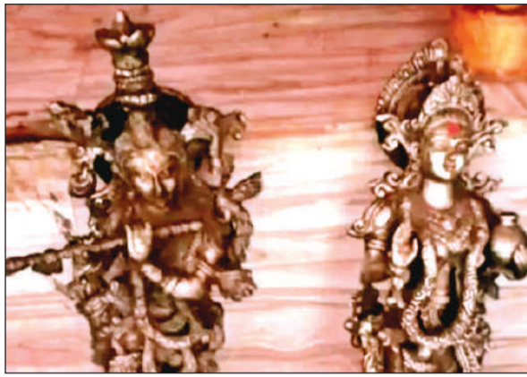
मंदिर में रखी राधा-कृष्ण की मूर्तियां

अमृत विचार। राजकीय बालिका इंटर कालेज विद्यालय के समीप स्थित मां शारदा माता मंदिर गेट पर रविवार को एक बोरी में राधा-कृष्ण की मूर्तियां मिलने की अनोखी घटना लोगों में चर्चा का विषय बनी हुई है। मंदिर गेट पर दो युवकों ने मूर्तियों को एक बोरी में साफ तरीके से एक कपड़े में लपेट कर रखने और हाथ जोड़कर प्रणाम करते हुए जाने की बात बताई जा रही है। स्थानीय लोगों की सूचना पर पहुंची पुलिस ने जांच शुरू कर दी है।