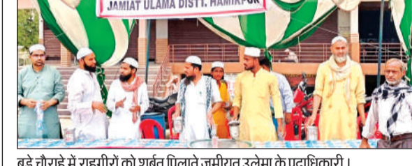
बड़े चौराहे में राहगीरों को शर्बत पिलाते जमीयत उलेमा के पदाधिकारी।