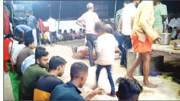
भंडार का प्रसाद छकते श्रद्धालु।