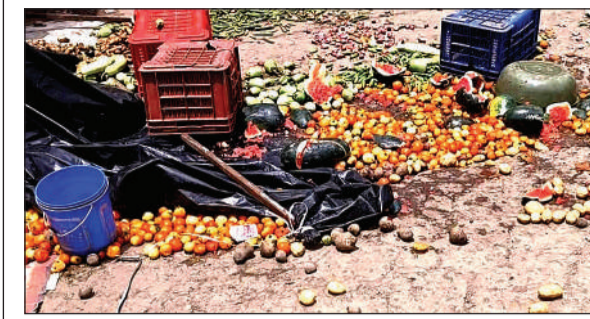
सड़क पर लोगों द्वारा फेंका गया सामान।