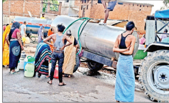
पानी की आपूर्ति करता टैंकर।

शहर में मदन सागर सरोवर, उर्मिल बांध और ट्यूबवेलों से पानी की आपूर्ति की जाती है, लेकिन आसमान से बरस रही आग और भीषण गर्मी के चलते पानी तेजी से सूख रहा है जिसके चलते बांध और सरोवर ने जवाब दे दिया है। बामुश्किल 24 घंटे में मात्र एक बार