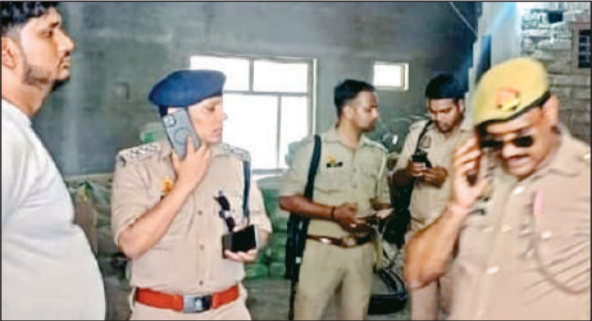
घटना की पड़ताल करते क्षेत्राधिकारी और थाना अध्यक्ष।