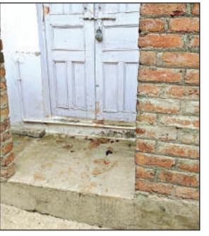
कमरे में लगी ताला। अमृत विचार

अमृत विचार। कानपुर में भर्ती बहन को लखनऊ रेफर करवाकर घर लौटे प्राइवेट शिक्षक ने आपसी कहासुनी के बाद स्वयं का चाकू से गला रेत लिया। गंभीर हालत में परिजन व मकान मालिक उसे जिला अस्पताल लेकर पहुंचे, जहां चिकित्सक ने उसे मृत घोषित कर दिया। बिना पुलिस को सूचित दिए परिजन उसे पैतृक गांव ले गए, जहां शव का अंतिम संस्कार कर दिया गया।