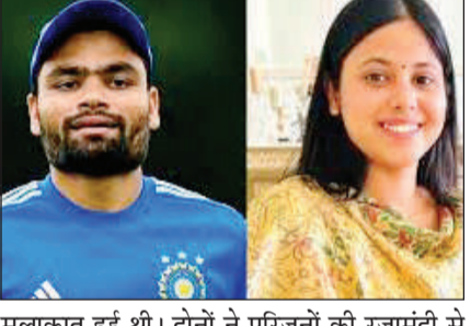
मुलाकात हुई थी। दोनों ने परिजनों की रजामंदी से शादी का फैसला लिया। पेशे से अधिवक्ता 26 साल की प्रिया सरोज पहली बार सांसद बनी हैं। 27 साल के रिंकू सिंह ने भारत के लिए एकदिवसीय और 33 टी20 अंतरराष्ट्रीय मैच खेले हैं। आक्रामक बल्लेबाजी से पहचान बनाने वाले रिंकू इंडियन प्रीमियर लीग (आईपीएल) में कोलकाता नाइट राइडर्स के लिए खेलते हैं। सपा विधायक के करीबियों के अनुसार, शादी पारंपरिक रिस्-रिवाजों के साथ होगी। दोनों ने एक-दूसरे को समझने के लिए पर्याप्त समय लिया और अब एक नयी शुरुआत के लिए तैयार हैं।