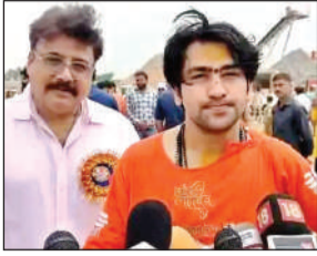
पत्रकारों से बातचीत करते धीरेन्द्र कृष्ण शास्त्री।

अमृत विचार। बागेश्वर धाम के पीठाधीश्वर पंडित धीरेन्द्र कृष्ण शास्त्री रविवार को हेलीकॉप्टर से महोबा पहुंचे। उन्होंने पसवारा गांव में वैदिक मंत्रोच्चार और विधि विधान के साथ प्रेम इंटर प्राइजेज क्लेशर प्लांट का शुभारंभ कराया। इस मौके पर क्षेत्र के संतों, व्यापारियों और ग्रामीणों की भारी भीड़ जुटी।