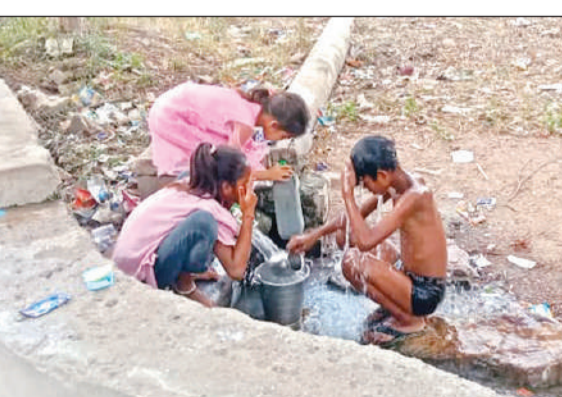
इस तरह पाइपलाइन के पानी से नहाते धोते हैं लोग। अमृत विचार

अमृत विचार। विकासखंड की ग्राम पंचायत सरैया के मजरे विनय नगर घाटी कोलान के लोग आज भी मूलभूत सुविधाओं से वंचित हैं। यहां के बाशिंदों की मानें तो लगभग दो सौ घरों की कोल आदिवासी बस्ती में न तो हैंडपंप हैं और न यहां जल जीवन मिशन पहुंचा है। वे मानिकपुर कस्बे को जाने वाली मेन स्पलाईन की पाइपलाइन की लीकेज से निकलने वाले पानी पर निर्भर हैं। इस पानी के उपयोग करने से इन लोगों में बीमारियों का भी खतरा बढ़ा है। ग्रामीण बताते हैं कि इस मजरे में लगभग 800 वोटर हैं लेकिन ग्राम पंचायत स्तर से न तो जरूरत के मुताबिक हैंडपंप लगाए गए हैं और न ही जल जीवन मिशन की ओर से इस मजरे में पाइप लाइन डाली गई है। बताया जाता