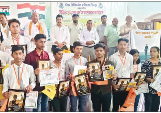
सांसद कृष्णा पटेल और अन्य अतिथियों व शिक्षकों के साथ मेधा सम्मान समारोह में सम्मानित बच्चे।

। आयुष्मान वानप्रस्थ विश्वविद्यालय सामाजिक संस्थान ने चित्रकूट इंटर कालेज में मेधा सम्मान समारोह का आयोजन किया। इस मौके पर सपा सांसद कृष्णा पटेल ने विद्यार्थियों की हौसलाफाजी की। उन्होंने कहा कि शिक्षा से ही सब कुछ हासिल किया जा सकता है। कार्यक्रम का शुभारंभ अतिथियों ने मां सरस्वती पूजन से किया। छात्राओं ने सरस्वती वंदना की और स्वागत गीत गाया। सांसद ने कहा कि शिक्षा ही सब कुछ है। सभी बच्चे खूब मन लगाकर पढ़ाई करें, लक्ष्य प्राप्त करें, अपने माता पिता का सपना पूरा करो और चित्रकूट जिले का नाम रोशन करें। इस मौके पर यूपी बोर्ड एवं सीबीएससी बोर्ड के मेधावी छात्र-छात्राओं को स्मृति चिह्न और प्रशस्ति पत्र देकर