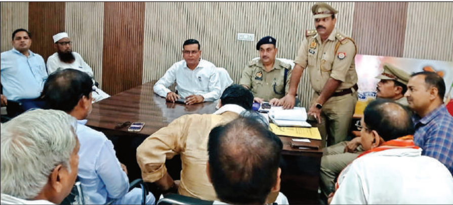
बैठक में लोगों को संबोधित करते पुलिस अधिकारी।

इस दौरान उन्होंने मौजूद धर्म विशेष के लोगों से बकरीद को