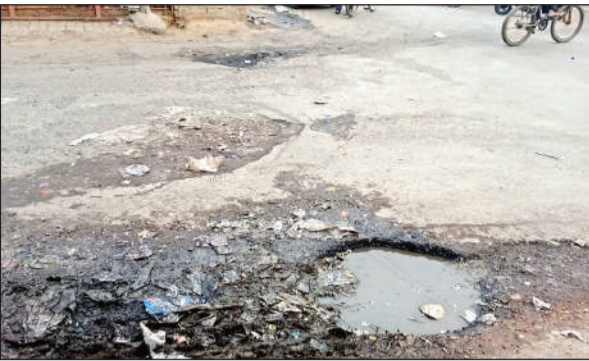
क्षतिग्रस्त सड़क में भरा गंदा पानी।

● चार साल बाद फिर से आवास विकास के ब्लॉक हस्तांतरण से पूर्व जागा विभाग