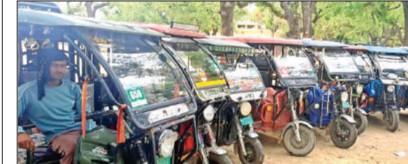
रेडियम युक्त रंगीन स्टीकर लगाए खड़े ई-रिक्शा।

सुमेरपुर (हमीरपुर)। नगर पंचायत अध्यक्ष की पहल पर राष्ट्रीय राजमार्ग प्राधिकरण कस्बे में जल निकासी के इंतजाम के लिए पटरी में हुए अतिक्रमण हटाकर नाला का निर्माण की राह प्रशस्त करारणा। रविवार को कस्बे में पहुंची एनएचआई की टीम ने मौका मुआयना किया है उम्मीद है कि जल्द ही इसका कार्य प्रारंभ होगा। जल निकासी के लिए कस्बे के मध्य से गुजरे हाईवे किनारे पुख्ता इंतजाम नहीं है। इससे बरसात में लोगों के सामने बड़ी समस्या खड़ी होती है। इसको मद्देनजर रखकर नगर पंचायत अध्यक्ष ने समस्या के समाधान के लिए नाला निर्माण करने का निर्णय लिया है लेकिन समस्या यह है कि हाईवे की पटरी में अतिक्रमण होने से निर्माण की राह में रोड़ा उत्पन्न हो रहा है। लिहाजा नगर पंचायत की पहल पर एन एच आई की टीम ने अतिक्रमण हटाने के लिए मौका मुआयना किया है। एन एच आई टीम ने नगर पंचायत अध्यक्ष को आश्चर्य किया है कि वह जल्द ही अतिक्रमण हटवा कर नाला निर्माण का मार्ग प्रशस्त करारेंगी।