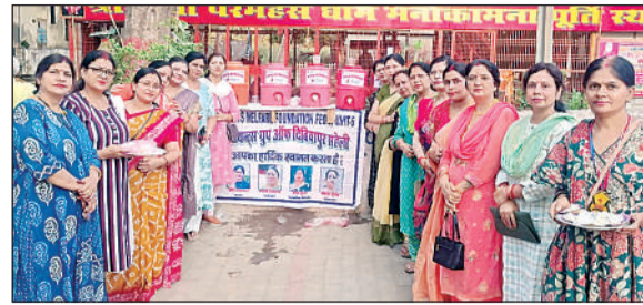
जायंट्स ग्रुप ऑफ सहेली संस्था की ओर से लगाया गया प्लाक।