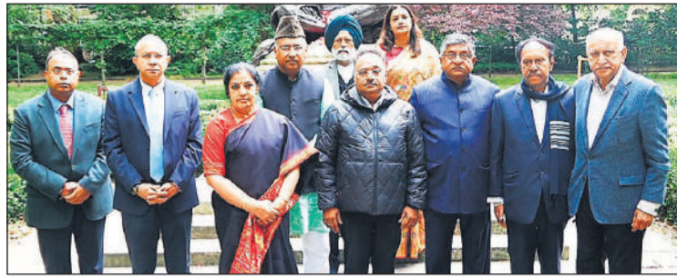
लंदन में भाजपा सांसद रविशंकर प्रसाद के नेतृत्व में सर्वदलीय प्रतिनिधिमंडल।

कैथरीन वेस्ट ने ब्रिटेन की ओर से एक बार फिर अप्रैल में हुए पहलगाम आतंकवादी हमले की निंदा की और हिंद-प्रशांत क्षेत्र में स्थिरता के लिए भारत के योगदान की सराहना की। बैठक के बाद सोशल मीडिया