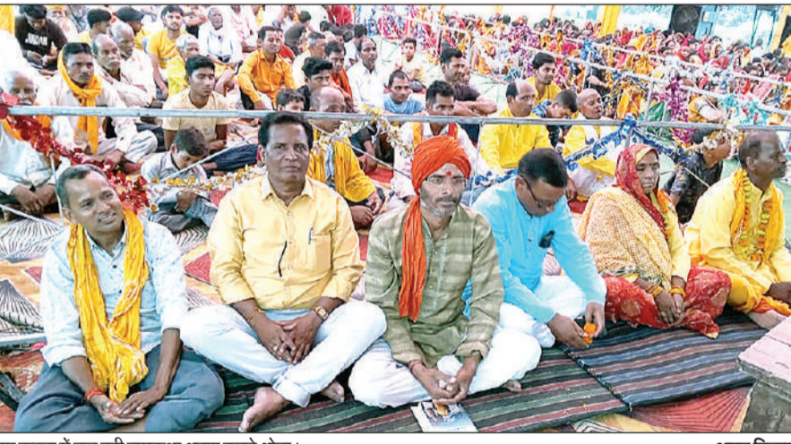
ग्राम कटरा में चल रही रामकथा श्रवण करते श्रोता।