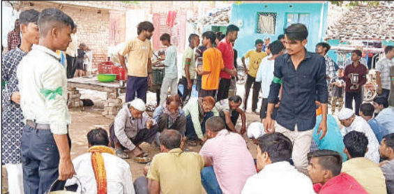
उर्स के मौके पर लंगर खाते अकीदतमंद।