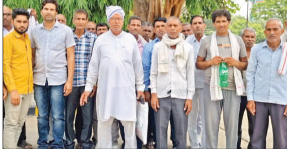
जिलाधिकारी से मिलने पहुंचे छिबरामऊ के किसान।

जांच हुई थी उस पर की गई कार्रवाई की प्रमाणित प्रति उपलब्ध कराई जाए। जांच में दिए गए सचिव के साक्ष्यों की कॉपी उपलब्ध कराई जाए। बताया गया है कि जांच कर्ताओं ने लाखों रुपये की गड़बड़ी की पुष्टि कर दी है उसके बाद भी जिम्मेदार विभाग आरोपियों पर कार्रवाई नहीं कर रहा है। www.amritvichar.com पर भी खबरें पढ़ें