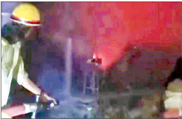
प्लांट में लगी आग पर काबू पाने का प्रयास करते दमकलकर्मी।