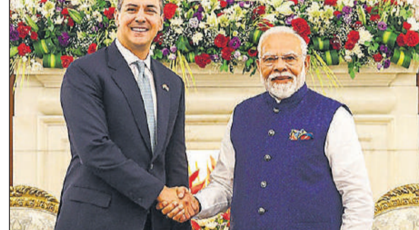
पराग्वे के राष्ट्रपति सैंटियागो पेना पालासियोस के साथ प्रधानमंत्री मोदी।

जैसे क्षेत्रों में सहयोग के नये अवसर देखते हैं। प्रधानमंत्री ने दक्षिण अमेरिकी व्यापार समूह मर्कोसुर के साथ भारत की तरजीही व्यापार व्यवस्था का भी उल्लेख किया। कहा, हम इसे आगे बढ़ाने के लिए मिलकर काम कर सकते हैं। मर्कोसुर या दक्षिण का साझा बाजार