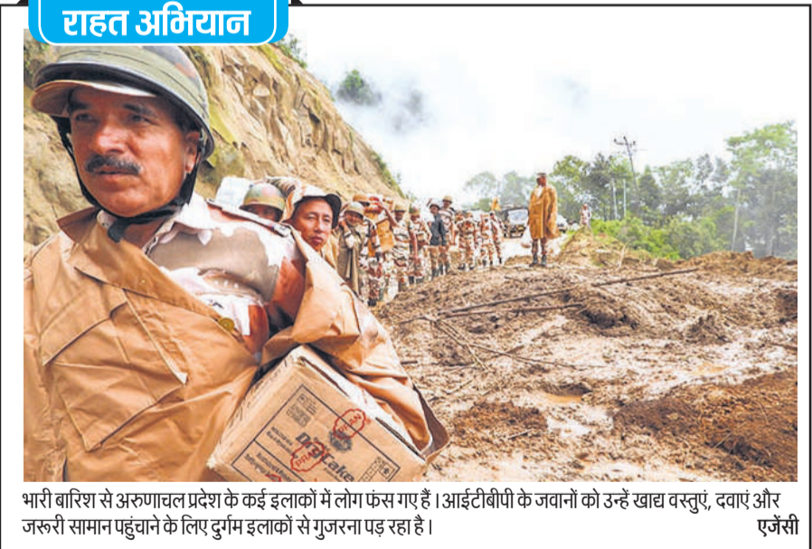
भारी बारिश से अरुणाचल प्रदेश के कई इलाकों में लोग फंस गए हैं। आईटीवीपी के जवानों को उन्हें खाद्य वस्तुएं, दवाएं और जरूरी सामान पहुंचाने के लिए दुर्यम इलाकों से गुजरना पड़ रहा है। एजेंसी

कन्नड़ तमिल से विकसित हुई है। कर्नाटक में फिल्म निर्माताओं, वितरकों-प्रदर्शकों का प्रतिनिधित्व करने वाली संस्था केएफसीसी ने पांच जून को सिनेमाघरों में प्रदर्शित होने वाली इस फिल्म के बहिष्कार की घोषणा की है। चैंबर ने हासन की टिप्पणी पर कड़ी आपत्ति जताई और कहा कि जब तक अभिनेता माफी नहीं मांगते, तब तक राज्य में फिल्म को प्रदर्शित नहीं होने दिया जाएगा। उसने दावा किया कि उसका रुख कर्नाटक के सांस्कृतिक गौरव और भाषाई विरासत की रक्षा के लिए है।