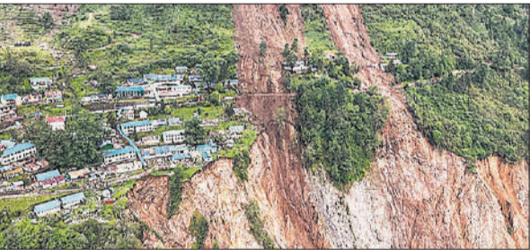
सिक्किम के लावेन नगर में भूस्खलन के बाद सैन्य शिविर क्षतिग्रस्त हो गया।