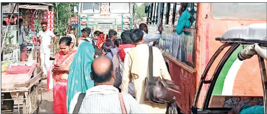
बस आते ही होने लगती है मारामारी।

के रुकने के चलते मऊ बस अड्डे के व्यापारियों के घरों का भरपूर पोषण होता था। जिसके चलते हुई आमदनी और यात्रियों के आवाजाही से मऊ बस अड्डे गुलजार रहता था वो अब सरकार के अनुबंध योजना के चलते समाप्त हो गया। मऊ बस अड्डे की रौनक जहां खत्म हो गई वहीं अब यात्रियों को भारी असुविधा का सामना करना पड़ रहा है। पहले बसें मऊ बस स्टैंड पर दस-पंद्रह मिनट खड़ी होती थीं, जिससे यात्री