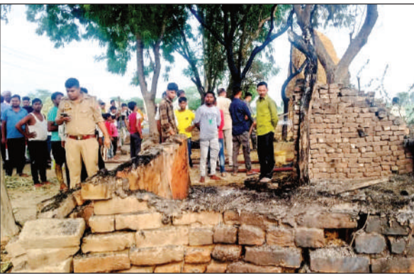
झोपड़ी में आग लगने के बाद जला सामान।