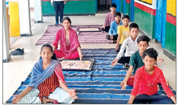
योगाभ्यास करते बच्चे

अमृत विचार। पूर्व माध्यमिक विद्यालय अकौना में गर्मी की छुट्टी में योगा शिक्षकों ने विद्यार्थियों को योगाभ्यास कराया जा रहा है, जिससे छात्र छात्राएं छुट्टियों का लाभ उठाते हुए स्वस्थ व सेहतमंद रहकर योगा कला सीख सकें। शिक्षकों ने विद्यार्थियों को योगाभ्यास कराते हुए प्राणायाम, अनुलोम कपालभाती सहित अन्य मुद्राएं कराई जा रही हैं साथ ही योगा के लाभ से भी रुबरु कराया जा रहा है। छात्रों को योगा के गुर सिखाने के बाद उनसे पहले अपने परिवारजनों और उसके बाद में गांव वालों को योग