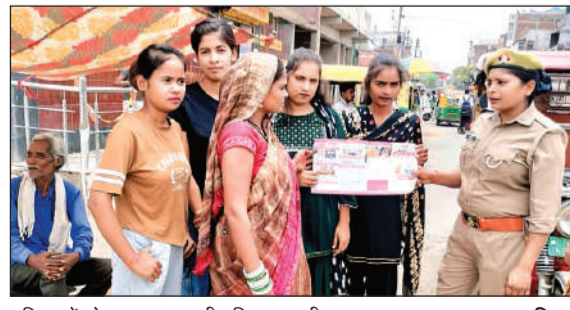
महिलाओं को जागरूक करती महिला आरक्षी।