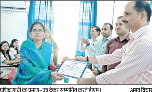
प्रशिक्षणार्थी को प्रमाण-पत्र देकर सम्मानित करते डीएम। अमृत विचार

सोमवार को कलेक्ट्रेट के गांधी सभागार में हुई गौशाला, मनरंगा, पीएम/ सीएम आवास, स्वच्छ भारत मिशन आदि की बैठक में जिलाधिकारी ने कहा कि गौशालाओं में पीपल, पाकड़, बरगद आदि