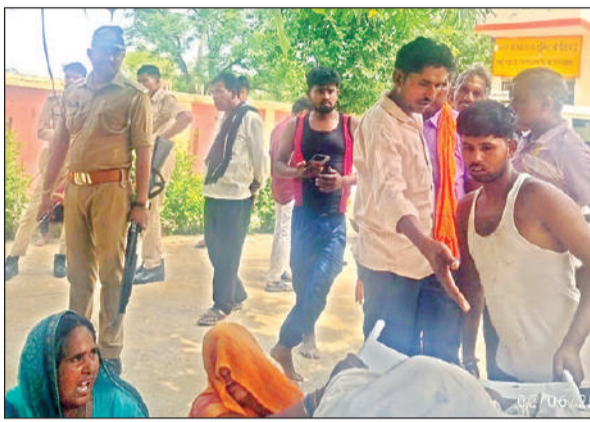
सीएचसी तालग्राम में मौजूद लोग व पुलिस।