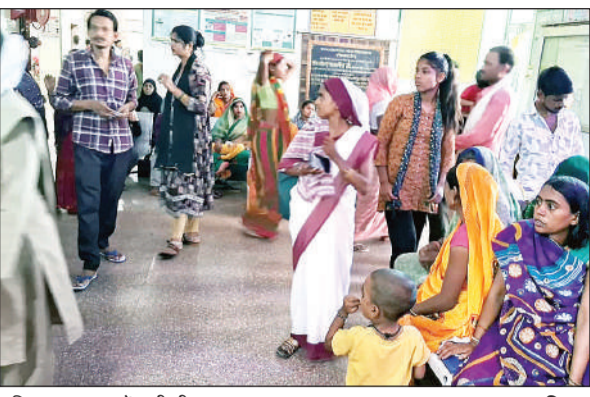
महिला अस्पताल में जुटी भीड़।

अमृत विचार। महिला जिला अस्पताल में पैरामेडिकल स्टाफ की भारी कमी के चलते मरीजों को स्वास्थ्य सुविधाओं का समुचित लाभ नहीं मिल पा रहा है। यहां पर सर्जन तो हैं लेकिन एनेस्थीसिया डॉक्टर नहीं होने से सर्जन का पूरा लाभ मरीजों को नहीं मिल रहा। हालात यह हैं कि महिला जिला अस्पताल दो डॉक्टरों के भरोसे चल रहा है। कमोवेश यही हाल नर्सों का भी है। यहां जिला स्तरीय महिला अस्पताल में मात्र चार नर्स हैं, जबकि यहां पर डिलेवरी वाले वार्ड प्रसूताओं से भरे हैं। ऐसे में