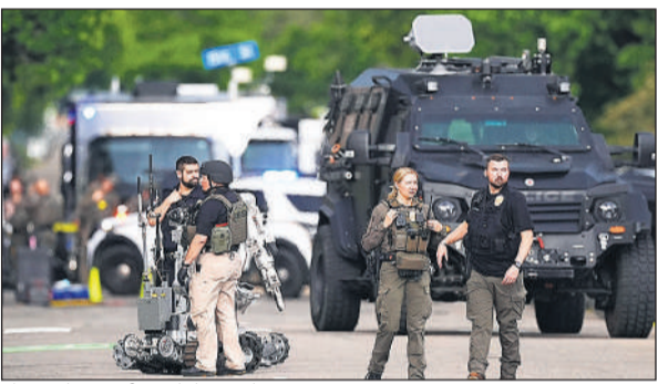
बोल्डर में आतंकी हमले के बाद तैनात सुरक्षाबल।

रिपब्लिकन सीनेटर लिंडसे ग्राहम और डेमोक्रेटिक सीनेटर रिचर्ड ब्लूमथेल ने यूक्रेनी राष्ट्रपति वोलोदिमीर जेलेन्स्की से मुलाकात करने तथा रूस की बमबारी से तबाह हुए इलाकों का दौरा करने के बाद पेरिस में एप्सोसिएटड प्रेस से बात की। पेरिस