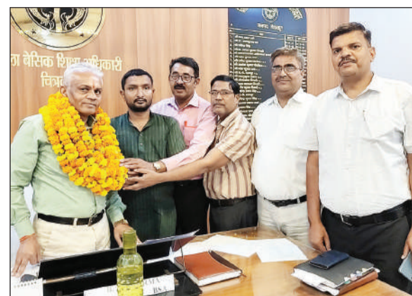
बीएसए बीके शर्मा का स्वागत कर बधाई देते युवा समाजसेवी और अधिकारी।

● मुख्यमंत्री योगी आदित्यनाथ ने भी की सराहना