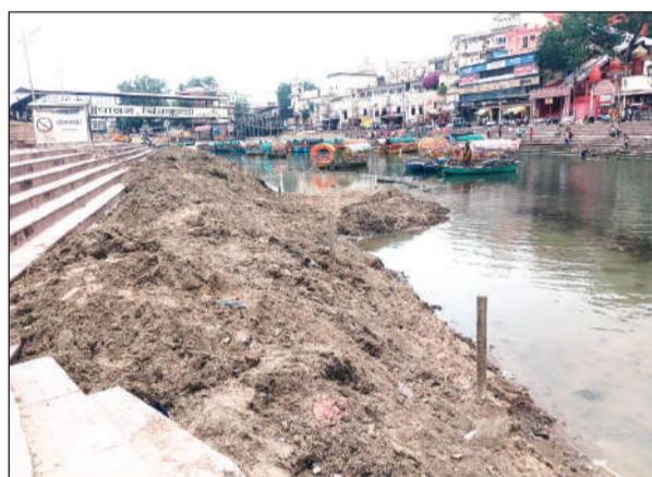
मंदाकिनी नदी से निकाली गई मंडगी।