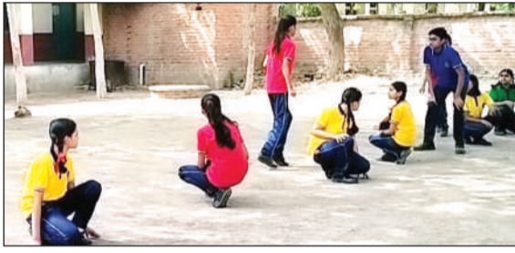
केंद्रीय विद्यालय के समर कैंप में खो-खो खेलती छात्राएं।