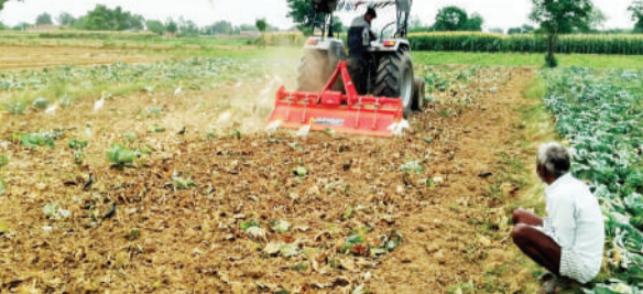
खेती किसानी के कामकाज में जुटे किसान।

पिछले सप्ताह की शुरुआत में भीषण गर्मी से लोग परेशान थे उमस भरी गर्मी बचाने कर रही थी और तापमान की 40 डिग्री के पर पहुंच गया था। शनिवार की शाम से अचानक मौसम बदला आसमान में बादल छा गए और ठंडी हवा चलने लगी। इससे लोगों को भीषण गर्मी से राहत मिली। उसके बाद से रविवार और सोमवार की भी ज्यादा गर्मी नहीं रही और बीच-बीच में बादल छाए रहे साथ ही हल्की बूँदा बंदी हुई। सोमवार को धूप तो निकली लेकिन