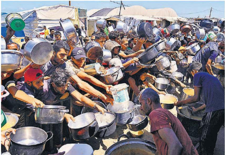
गाजा में दिन-प्रतिदिन हालात और बिगड़ते जा रहे हैं। सोमवार को दक्षिणी गाजा पट्टी के खान यूनिंस में सामुदायिक रसोई में दान में भोजन पाने के लिए संघर्ष करते फलस्तीनी।