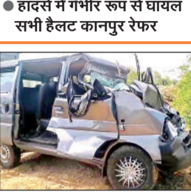
हादसे में क्षतिग्रस्त इको वैन।