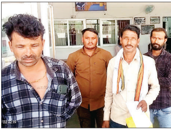
जिलाधिकारी को ज्ञापन देने पहुंचे बिहारा के ग्रामीण।

परिष्कार मार्ग क्षेत्र के पास भी प्लाटिंग की बातें: लोगों की मानें तो तीर्थक्षेत्र भी इन भूमिफायियों की नजर में है। बताते हैं कि परिष्कार मार्ग के आसपास के ग्रामीण इलाकों में इनकी सक्रियता लगातार बढ़ती जा रही है। कृषि योग्य जमीनों को प्लॉट में तब्दील कर बेचा जा रहा