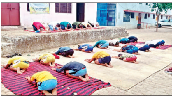
समर कैंप के दौरान योगाभ्यास करते छात्र-छात्राएं।