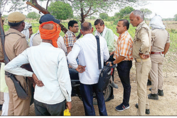
विवादित भूमि की नाप करने पहुंचे राजस्व विभाग के अधिकारी।