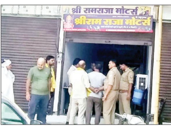
शोरूम में जांच करती पुलिस।

अमृत विचार। नगर के एक ई-स्कूटी शोरूम से दो अज्ञात बदमाशों ने डेढ़ लाख रुपये की टप्पेबाजी कर रफूचककर हो गये। शोरूम मालिक को जानकारी होने पर तत्काल पुलिस को सूचना दी गई, मौके पर पहुंची कोतवाली पुलिस जांच पड़ताल कर आसपास लगे सीसीटीवी कैमरों के फुटेज खंगालने में जुट गई।