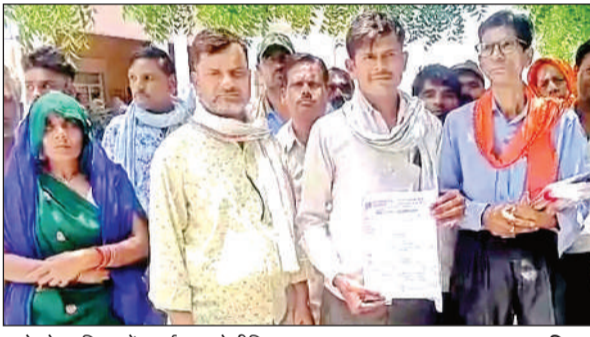
कलेक्ट्रेट परिसर में प्रदर्शन करते पीड़ित।