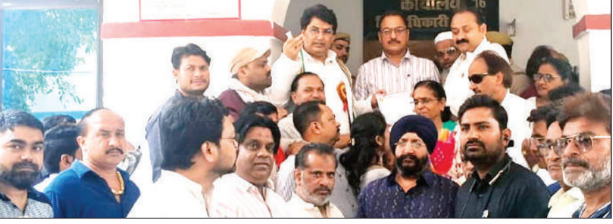
जिलाधिकारी कार्यालय पर ज्ञापन देते व्यापारी नेता।

प्रदेश नेतृत्व के निर्देश पर सौंपे गए इस ज्ञापन में व्यापारियों की मांग थी कि खाद्य सुरक्षा एवं मानक अधिनियम के अंतर्गत की जा रही कार्रवाही से व्यापारियों को आ रही परेशानियों को समय से दूर किया जाए। इनके साथ ही खाद्य सुरक्षा एवं मानक अधिनियम में रजिस्ट्रेशन के लिए 12 लाख तक के टर्न ओवर