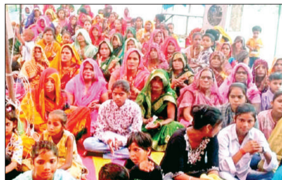
कथा के दौरान मौजूद लोग।