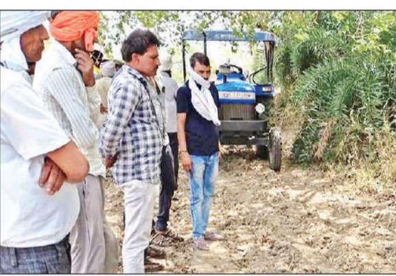
खेड़ा शिलाजीत गांव में शव मिलने पर एकत्र हुए गांव वाले।