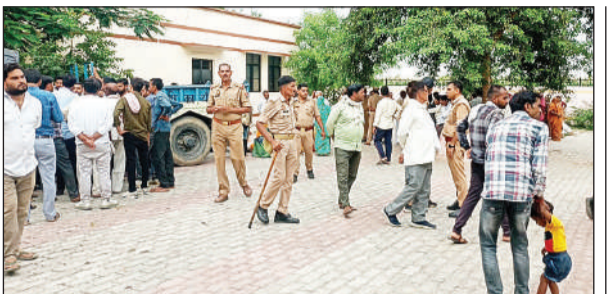
पोस्टमार्टम में तेनात पुलिस व मौजूद लोग।