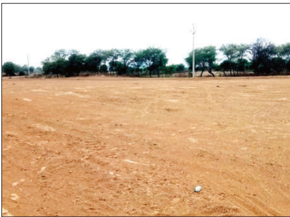
वह भूमि, जहां कब्जे कर प्लाटिंग की जा रही।

गौरतलब है कि मुख्यालय और तीर्थक्षेत्र में जमीन की बढ़ती कीमतों और रिहायशी मकानों की सिकुड़ती जगह को देखते हुए भूमाफिया सक्रिय हैं। ये किसानों की कृषि योग्य जमीन को औने पौने दाम पर खरीद कर इसे अच्छी खासी कीमत पर बेच देते हैं। ये दलाल पूरे जिले में तेजी से बढ़ रहे हैं। आरोप तो यहां तक लगते हैं कि इसमें रजिस्ट्री विभाग के कुछ लोग भी मदद करते हैं। इससे इस तरह की जमीन की लिखापट्टी भी बिना किसी को भनक लगे जल्द हो जाती है। कई बार तो जमीन कब्जाने के भी मामले सामने