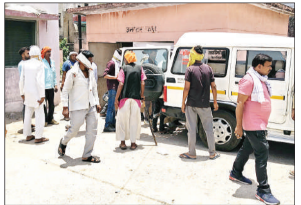
अस्पताल परिसर में जुटी मृतक के परिजनों की भीड़।

अमृत विचार। पनवाड़ी नजौरा मार्ग पर ग्राम मुढारी के पास सामने से आ रहे तेज रफ्तार ट्रेक्टर ने बाइक सवार तीन लोगों को टक्कर मार दी। जिससे बाइक चालक की घटना स्थल पर ही मौत हो गई। जबकि उसके दो साथी घायल हो गए, दुर्घटना के बाद मौके पर भारी भीड़ जमा हो गई। ग्रामीणों ने पुलिस को सूचना दी, सूचना पर पहुंची पुलिस ने दोनों घायलों को अस्पताल पहुंचाया और शव का पंचनामा भर कर पोस्टमार्टम के लिए भेज दिया।