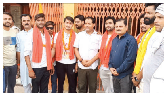
वृद्धावन के लिए रवाना होता जत्था।