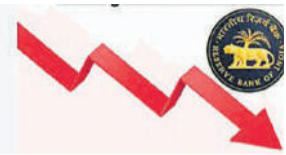
● क्रेडाई और नारेडको का दावा- रेपो रेट घटने कई क्षेत्रों पर पड़ेगा प्रत्यक्ष-अप्रत्यक्ष प्रभाव