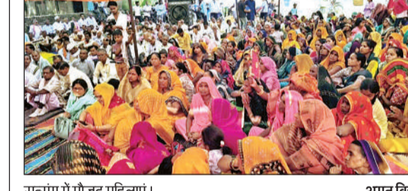
सत्संग में मौजूद महिलाएं। अमृत विचार