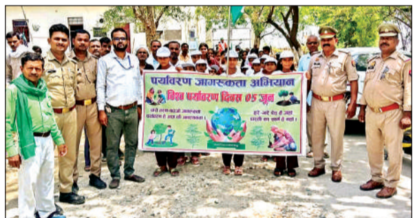
पर्यावरण संरक्षण के प्रति किया जागरूक।