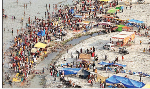
गंगा दशहरा पर स्नान को उमड़ी स्नानार्थियों की भीड़। अमृत विचार

तरफ से व्यवस्थाओं की निगरानी की जाती रही। जिले के आलाधिकारी सुबह से ही गंगा तट पर पहुंच गए और वस्तुस्थिति पर नजर रखते रहे। गंगा दशहरा का पर्व गुरुवार को पूरी श्रद्धा के साथ मनाया गया। इस दिन गंगा स्नान का महत्व होने से बुधवार की देर रात से ही आस्थावानों का गंगा तट पर पहुंचना शुरू हो गया था। ब्रह्ममुहूर्त से ही स्नान और दान का क्रम भी शुरू हो गया। बड़ी संख्या में श्रद्धालु दिन