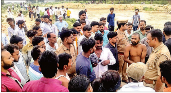
घटनास्थल पर मौजूद पुलिस व ग्रामीण ।