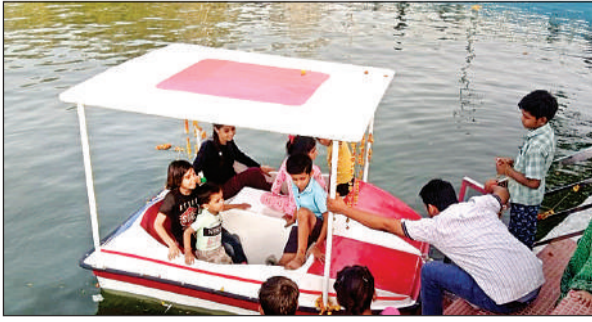
चौबे का तालाब तालाब में नौका में बैठकर लुफ्त उठाते बच्चे।

चौबे का तालाब, जो पहले उपेक्षित अवस्था में था। अब स्थानीय प्रशासन और नगर पालिका के प्रयासों से एक आकर्षक पर्यटन स्थल के रूप में तब्दील हो गया है। तालाब के आसपास महिलाओं