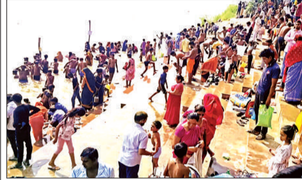
जलेसर स्थित गंगा तट पर स्नान करते श्रद्धालु।