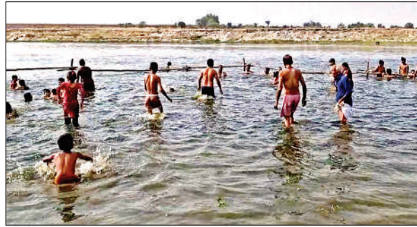
यमुना में स्नान करते श्रद्धालु ।

ज्येष्ठ मास के शुक्ल पक्ष की दशमी तिथि गंगा दशहरा के नाम से जानी जाती है। इस दिन स्नान और दान का विशेष महत्व होता है। मान्यता है कि इसी दिन मां गंगा स्वर्ग से पृथ्वी पर अवतरित हुई थी। गंगा दशहरा पर मां गंगा की पूजा अर्चना का विशेष विधान है। दशहरा पर देर शाम तक जगह-जगह धार्मिक कार्यक्रम आयोजित होते रहे। सुबह 5:00 बजे से श्रद्धालुओं का यमुना तट पर पहुंचना शुरू हो गया था। दोपहर 12:00 बजे तक स्नान का सिलसिला चला। श्रद्धालुओं