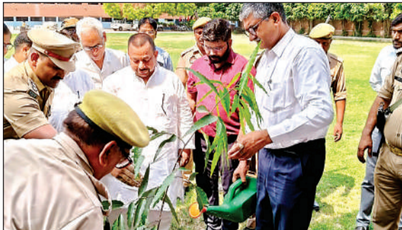
सांसद और डीएम पौधरोपण करते हुए।