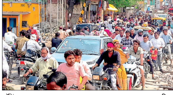
क्रॉसिंग पर लगा जाम।