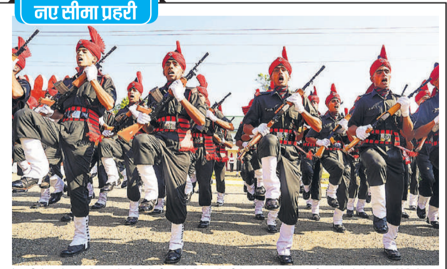
देश की सेना को बृहस्पतिवार को सीमाओं की रक्षा के लिए अग्निवीरों का नया बैच मिला। श्रीनगर के जेएकेएलआई रेजिमेंटल सेंटर में गुरुवार को हुई पांसिंग आउट परेड में शामिल अग्निवीर।

इनमें दो विदेशी शामिल हैं। सिक्किम राष्ट्रीयकृत परिवहन ने इन पर्यटकों को पश्चिम बंगाल के सिलीगुड़ी पहुंचाने के लिए बसें तैनात की हैं। जो लोग हवाई मार्ग से सिलीगुड़ी के निकट बागडोगरा जाना चाहते हैं, उनके लिए पाकयोग हवाई अड्डे पर अतिरिक्त हेलीकॉप्टर रखा गया है। दो हेलीकॉप्टर एनडीआरएफ और बिजली कर्मियों तथा एयरटेल के इंजीनियरों के साथ रवाना हुए। बिजली महकमे और एयरटेल के इंजीनियर आवश्यक सेवाओं को बहाल करने के लिए वर्षा प्रभावित क्षेत्र में काम करेंगे।