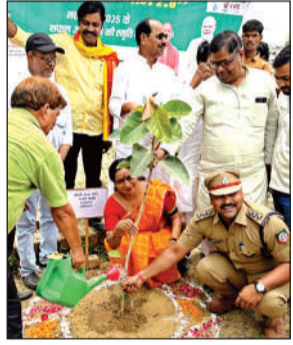
वृक्षारोपण करते भाजपा जिला अध्यक्ष।