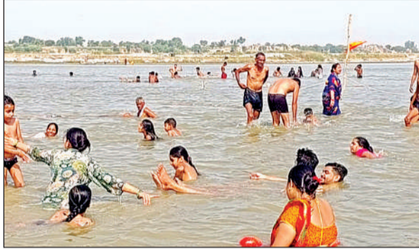
गंगा के मेहदीघाट पर आस्था की डुबकी लगाते श्रद्धालु। अमृत विचार

स्थानीय समेत आसपास के जिलों से पहुंचे लाखों लोगों ने किया दान-पुण्य, स्थान-स्थान पर लोगों ने शर्बत वितरण किया