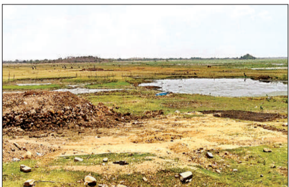
सूखा पड़ा बेलासागर सरोवर।

अमृत विचार। भीषण गर्मी और आसमान से बरस रही आग के चलते बेलासागर सरोवर के तेजी से सूख जाने से जल संस्थान ने अब प्रति दिन पेयजल आपूर्ति करने के मामले में हाथ खड़े कर दिए हैं। कारण, बेलासागर सरोवर में करीब 20 दिन का पानी शेष रह जाने से जल संस्थान ने अब एक दिन छोड़कर पानी की आपूर्ति करना शुरू कर दी है। जिससे बेलाताल कस्बे समेत आस पास के ग्रामीण अंचलों में भी पानी को लेकर हाथ लौबा मचने लगी है।