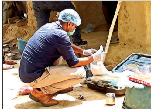
घटनास्थल से सबूत इकट्ठा करता जांच टीम का सदस्य।