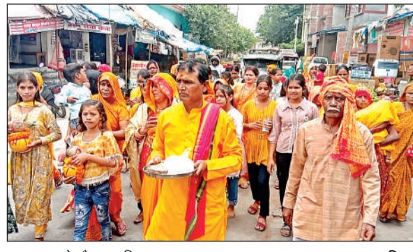
कलशयात्रा के दौरान शामिल श्रद्धालु।