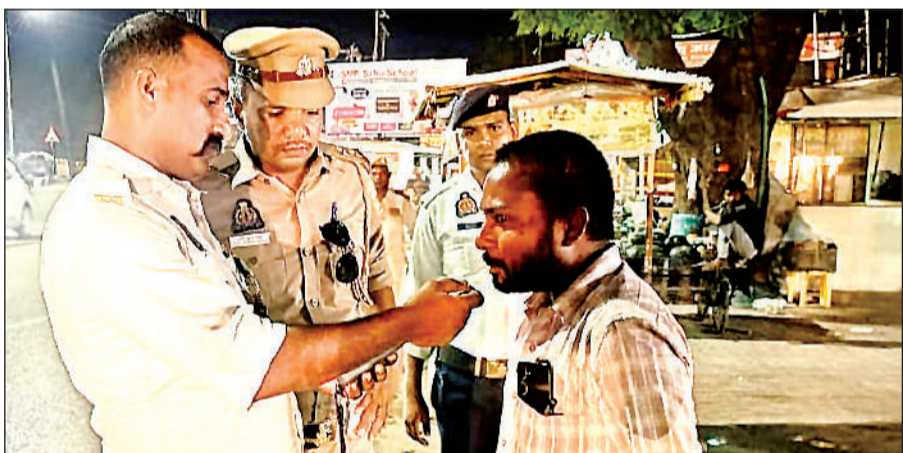
मशीन लगाकर चालक की जांच करते पुलिस कर्मी।