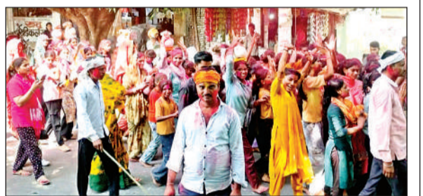
विसर्जन यात्रा में शामिल श्रद्धालु।