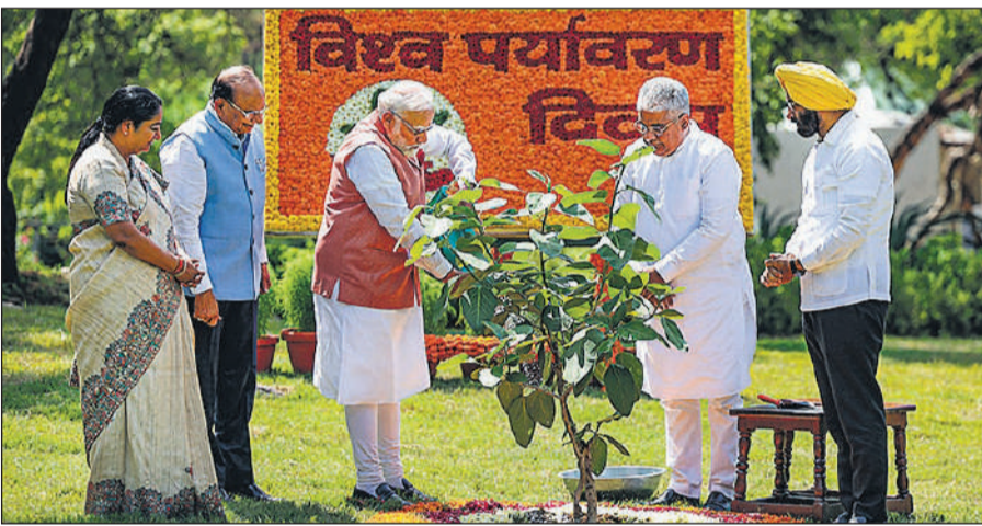
दिल्ली के भगवान महावीर वनस्थली उद्यान में पौधा लगाकर 'एक पेड़ मां के नाम' पहल को आगे बढ़ाते प्रधानमंत्री मोदी।

मोदी ने कहा, अरावली पर्वतमाला और उसके बाहर, पारंपरिक पौधरोपण विधियों के अलावा, हम नई तकनीकों को प्रोत्साहित करेंगे, विशेष रूप से शहरी और अर्ध-शहरी क्षेत्रों में जहां जगह की कमी है। पौधरोपण गतिविधियों को जियो-टैग किया जाएगा और मेरी लाइफ पोर्टल पर उनकी