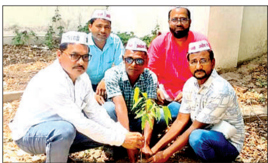
पीडब्ल्यूडी परिसर में पौधरोपण करते शिक्षक।