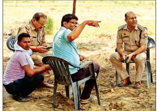
ग्राम प्रधान से जानकारी लेते सीओ। अमृत विचार