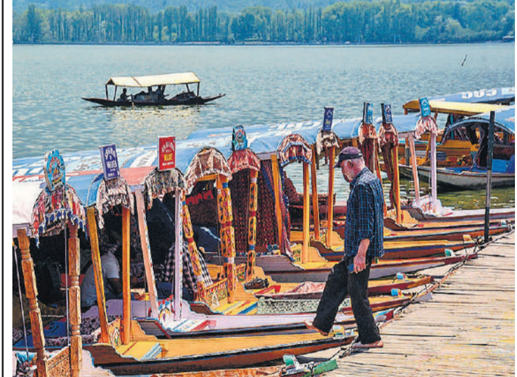
पहलामाम में आतंकी हमले के बाद कश्मीर में पार्यटकों की आवाजाही बहुत कम हो गई है। गुरुवार को डल झील में खाली खड़े शिकारे।