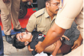
● भीड़ नियंत्रित करने को नहीं थी कोई तैयारी, मृतकों के परिवार को 50 लाख रुपये दे सरकार