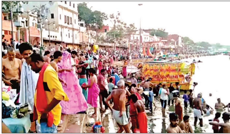
मंदाकिनी नदी में स्नान करते श्रद्धालु।