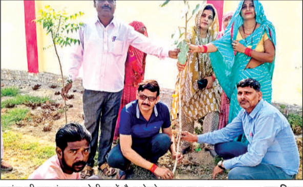
फफूद की ग्राम पंचायत कोटीपुर में पौधा रोपते ग्राम प्रधान व अन्य।