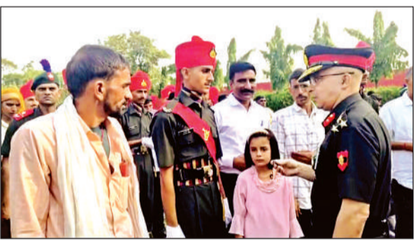
ब्रिगेडियर जवान के परिजनों से बात करते हुए।