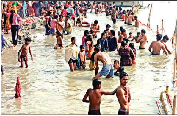
गंगा में आस्था की डुबकी लगाते हुए श्रद्धालु

अमृत विचार। गंगा दशहरा पर पांचाल घाट सहित सभी गंगा तटों पर आस्था का संगम उमड़ पड़ा। चारों तरफ श्रद्धालु हर-हर गंगे के जयकारों के साथ आस्था की डुबकी लगा रहे थे। स्नान करने के बाद श्रद्धालुओं ने विधि-विधान से गंगा मैया का पूजन कर दान-दक्षिणा दी गंगा दशहरा को देखते हुए देर रात से ही श्रद्धालुओं का पांचाल घाट पर पहुंचना शुरू हो गया कोई पैदल तो कोई टैपो व अन्य वाहनों से पांचाल घाट जाता दिखाई दिया भार से ही गंगा तटों पर श्रद्धालुओं का मेला उमड़ पड़ा। घाटों पर पैर रखने तक की जगह नहीं दिखाई दे रही थी। श्रद्धालुओं ने आस्था के साथ गंगा में डुबकी लगाई। भक्तों ने गंगा मैया को साड़ी की पहनावा भी