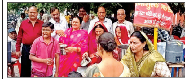
जिला अस्पताल में शर्वत वितरण करते धर्माथी शाखा के पदाधिकारी । अमृत विचार