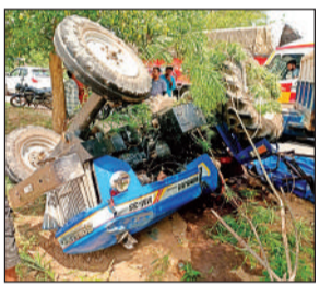
हाईवे पर पलटा ट्रैक्टर और ट्राली।