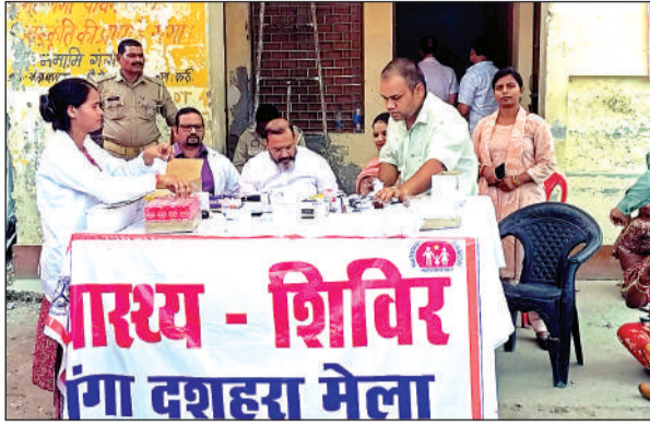
पांचाल घाट पर लगा स्वास्थ्य शिविर

गई थीं। यातायात प्रभारी ने बताया बेरोकड़िंग करारक भारी वाहनों को वहीं पर रोक दिया गया जिससे आने वाले श्रद्धालुओं के लिए पाकिंग की व्यवस्था की गई राष्ट्रीय स्वयंसेवक के सैकड़ों पदाधिकारी यातायात व्यवस्था को संभालते नजर आए