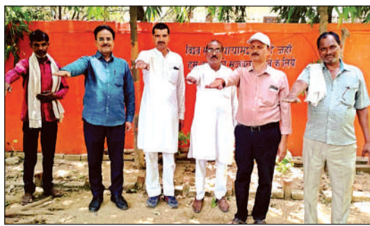
पर्यावरण की शपथ लेते शिक्षक।