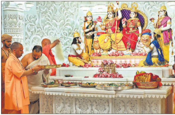
राम दरबार की आरती उतारते मुख्यमंत्री योगी आदित्यनाथ।

अमृत विचार : कभी अयोध्या आने वाले रामभक्तों पर गोलियां चला करती थीं। श्रद्धालुओं पर लाठी-डंडे बरसाकर प्रताड़ित किया जाता था। आज श्रद्धालुओं पर पुष्पवर्षा होती है। उन्हें आरओ का शुद्ध पानी पीने को मिलता है। अयोध्या आज पूरी दुनिया के सामने 'अतिथि देवो भवः' की नई परिभाषा गढ़ रही है। ये बातें गुरुवार को मुख्यमंत्री योगी आदित्यनाथ ने कहीं। वह राम कथा पार्क में अयोध्या नगर निगम के वर्तमान बोर्ड के दो वर्ष पूर्ण होने पर कार्यक्रम को संबोधित कर रहे थे। मुख्यमंत्री ने कहा कि आज अयोध्या की पहचान विश्व पटल पर बदल रही है। 22 जनवरी 2024 को प्रधानमंत्री नरेन्द्र मोदी के नेतृत्व में मयादा पुरुषोत्तम भगवान श्रीरामलला की प्राण प्रतिष्ठा ने 500 साल के लंबे इंतजार को समाप्त