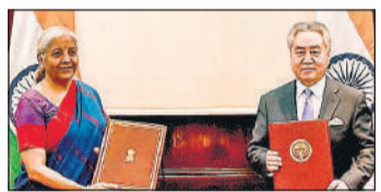
● नई संधि ने जून 2019 में विश्वेक में हुए बीआईटी की जगह ली

भारत सरकार और किर्गिज गणराज्य की सरकार के बीच 14 जून, 2019 को विश्वेक में द्विपक्षीय निवेश संधि (बीआईटी) पर हस्ताक्षर किए गए थे। अब यह संधि पांच जून, 2025 से प्रभावी हो गई है। वित्त मंत्रालय ने एक बयान में कहा कि नई