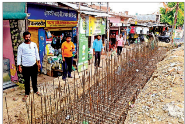
नाला निर्माण के लिए पड़ा सरियों का जाल।