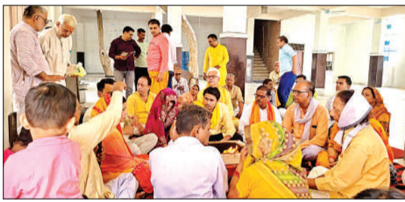
यज्ञ करते गायत्री परिवार के लोग ।