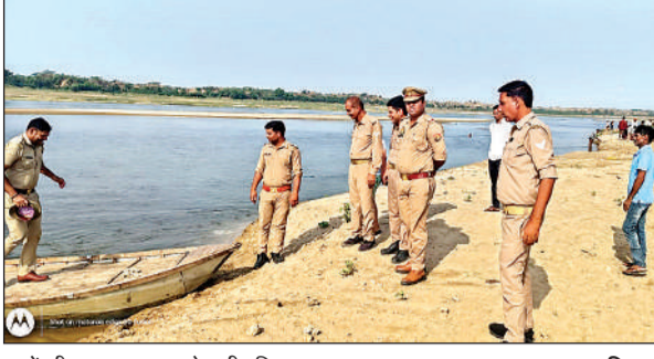
घाटों की सुरक्षा व्यवस्था देखती पुलिस।

गुरुवार को यमुना नदी के जुहीखा, बीड़लपुर, सेगनपुर, फरिहा घाट पर सूरज की पहली किरण के साथ ही श्रद्धालुओं का पहुंचना शुरू हो गया। इस दौरान श्रद्धालुओं ने यमुना नदी के घाटों पर आस्था की डुबकी लगाई। और पुण्य दान कर परिवार में सुख, शांति एवं समृद्धि की कामना की। श्रद्धालुओं ने यमुना नदी में पूजन और स्नान कर मन्तवें