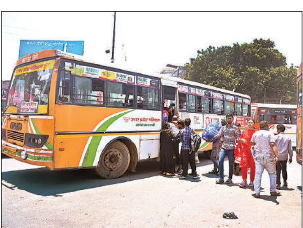
कैसरबाग बस अड्डा चौराहे पर सवारियां बैठाता रोडवेज बस का चालक।