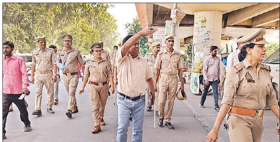
शहीद पथ ओवरफ्लोइड ब्रिज के नीचे अभियान के दौरान नगर निगम व पुलिस टीम।

जोन-1 में टीम ने नॉवेल्टी चौराहा से बेलदारी लेन होते हुए लोक भवन तक सड़कों से अतिक्रमण हटाया। इस दौरान एक लोहे का काउंटर एवं एक स्टील का काउंटर जब्त किया। साथ ही कालीदास 5 से 1090 चौराहा तक अस्थायी अतिक्रमण हटाया गया। इसी तरह जोन 4 में थाना विभूति खंड व गोमती नगर