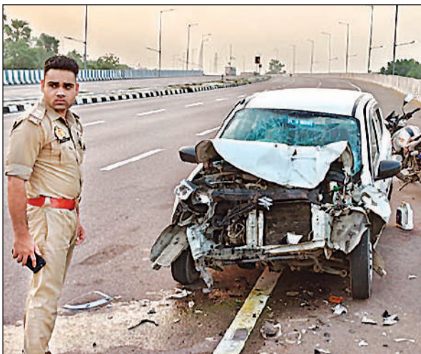
हादसे में क्षतिग्रस्त वाहन के पास खड़ा पुलिसकर्मी।