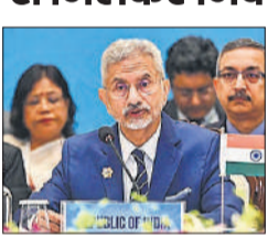
ने पहलगाम में आतंकवादी हमले की स्पष्ट रूप से निंदा की तथा सभी प्रकार के आतंकवाद के खिलाफ लड़ने का संकल्प लिया।

पांच मध्य एशियाई देशों ने भारत के साथ मिलकर पहलगाम हमले की कड़ी निंदा की तथा मांग की कि आतंकवादी कुलों के अपराधियों, वित्तपोषकों और प्रायोजकों को जवाबदेह ठहराया जाए तथा दंडित किया जाए। नयी दिल्ली में आयोजित भारत-मध्य एशिया वार्ता के चौथे संस्करण में आतंकवाद से निपटने की चुनौती पर प्रमुखता से चर्चा हुई, जिसमें कई प्रमुख विमर्श के अंत में जारी संयुक्त वक्तव्य में कहा गया कि मंत्रियों