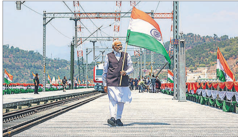
रियासी में चिनाब नदी पर दुनिया के सबसे ऊंचे रेलवे पुल का लोकार्पण करने के बाद तिरंगा लहराते हुए प्रधानमंत्री मोदी।

प्रधानमंत्री मोदी ने कश्मीर घाटी के लिए पहली रेल लाइन और चिनाब नदी पर निर्मित दुनिया के सबसे ऊंचे रेलवे पुल का किया लोकार्पण