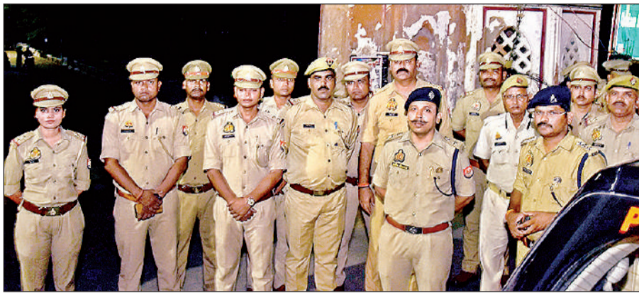
बकरीद के महेनजर शाहनाजफ इमामबाड़ा गेट पर गश्त करती पुलिस।

करने वालों को तत्काल गिरफ्तार कर कार्रवाई के निर्देश दिए गए हैं। जेसीपी ने बताया कि प्रतिबंधित पशुओं और खुले व सार्वजनिक स्थलों पर कुर्बानी करने वालों