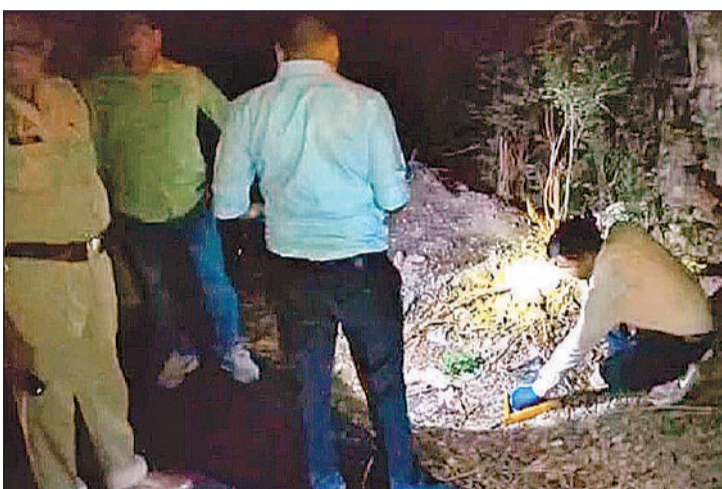
मुठभेड़ के बाद घटना स्थल पर जांच करते फोरेंसिक टीम के सदस्य और पाई आरोपी की स्कूटी।

अमृत विचार: आलमबाग मेट्रो स्टेशन के नीचे बच्चों से दुष्कर्म करने वाले दरिंदे पहले भी कई बच्चियों के साथ गलत काम कर चुका था। बदनामी के डर से किसी बच्ची के परिजन ने पुलिस में शिकायत नहीं की, इससे आरोपी की हिम्मत बढ़ती चली गई। आरोपी पर बलवा, मारपीट समेत दो और मामले दर्ज हैं।