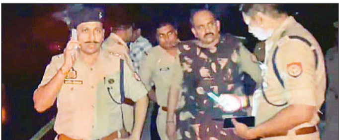
मुठभेड़ के बाद अधीनस्थों से जानकारी लेते पुलिस अधिकारी।

बच्चों के साथ दरिंदगी की आलमबाग मेट्रो स्टेशन के नीचे हुई। जबकि यहां अक्सर चहल-पहल रहती है। मासूम बच्चों को अगवा कर रेप की घटना ने पुलिस की पेट्रोलिंग पर सवाल खड़े कर दिए हैं। आरोपी ने बच्ची को जहां से अगवा किया, उसके आस-पास पिंक बूथ सहित तीनों चिकित्सो मौजूद हैं। लोगों का कहना है कि पुलिस वहीं से पेट्रोलिंग कर रही होती तो आरोपी ऐसी वारदात करने की हिम्मत नहीं उठा पाता।