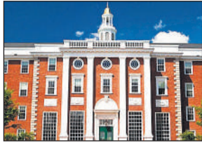
● विवि ने कहा- प्रतिशोध की भावना से किया गया कार्य

इससे कुछ समय पहले हार्वर्ड ने संघीय न्यायाधीश से ट्रंप के आदेश पर रोक लगाने का अनुरोध करते हुए एक याचिका दायर की थी। विवि ने इसे व्हाइट हाउस (अमेरिका के राष्ट्रपति का आधिकारिक आवास एवं कार्यालय) की मांगों को अस्वीकार करने के कारण हार्वर्ड के खिलाफ