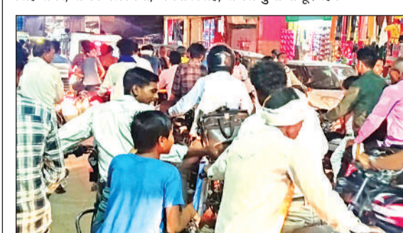
अछन्दा क्रॉसिंग पर लगा जाम।