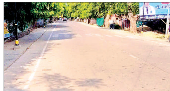
गर्मी के चलते सड़क पर पसरा सन्नाटा ।

इन दिनों स्कूलों की छुट्टी चल रही है इसलिए फिलहाल बच्चे इस भीषण गर्मी से बचे हुए हैं। पिछले दिनों की तरह मंगलवार को भी सुबह से ही धूप निकल आई और तापमान बढ़ने की शुरुआत हो गई। सोमवार की तरह मंगलवार को भी दोपहर को 2 बजे तापमान 44 डिग्री तक पहुंच गया। कुछ देर 44 डिग्री पर टिके रहने के बाद उसमें कमी