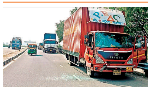
हाईवे के नो पार्किंग जोन में खड़ी डीसीएम व ट्रक।