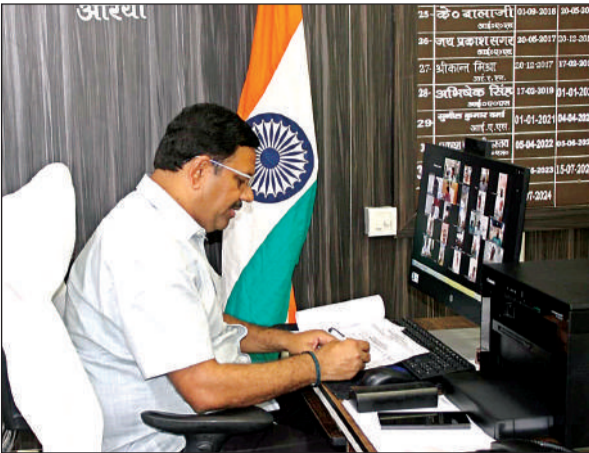
जूम मीटिंग के दौरान निर्देश देते डीएम डा. इंद्रमणि त्रिपाठी।

क्लेक्ट्रेट में जूम मीटिंग के जरिए कार्यों की समीक्षा करते हुए जिलाधिकारी डॉ. इंद्रमणि त्रिपाठी ने मुख्य चिकित्साधिकारी को निर्देश दिए कि वह अपने अधीनस्थों को निर्देशित करें कि हीटवेव व अन्य