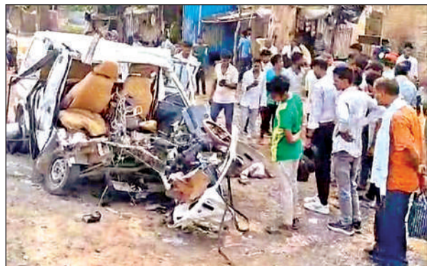
हादसे में बुरी तरह क्षतिग्रस्त हुई वैन की हालत देखते लोग। अमृत विचार