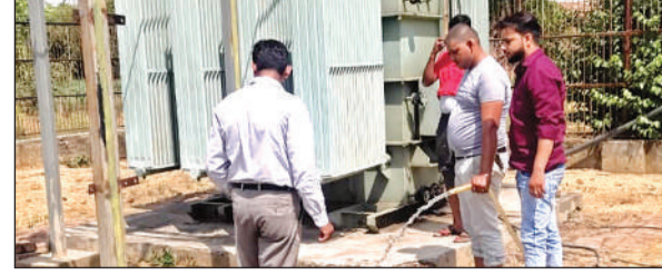
पानी डालकर ट्रांसफार्मरों को ठंडा करते बिजली कर्मी ।