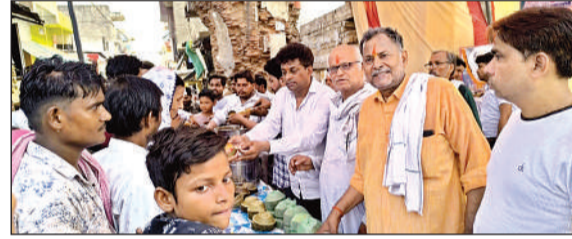
मंडी गेट पर भंडारा खिलाने व्यापार मंडल के पदाधिकारी।