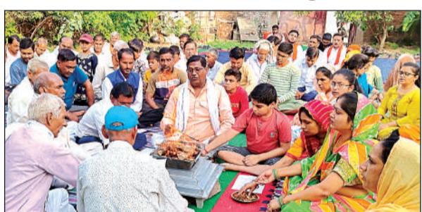
सत्संग भवन में हवन की आहुतियां देते लोग। अमृत विचार

उन्होंने बढ़ते पर्यावरण प्रदूषण पर चिंता व्यक्त करते हुए कहा कि प्रदूषण से मुक्ति के लिए यज्ञ के साथ पौधों का रोपण करना चाहिए। कार्यक्रम संचालन आर्य वीर दल के