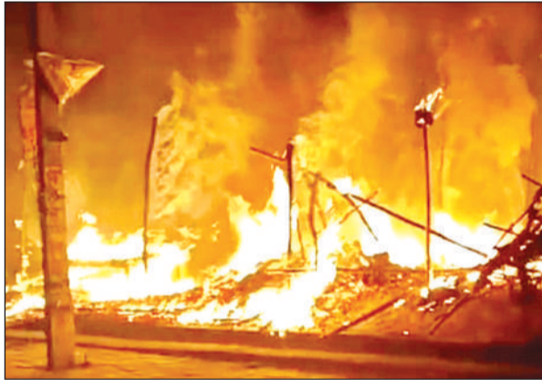
आग लगने से जलती सब्जी की दुकान ।