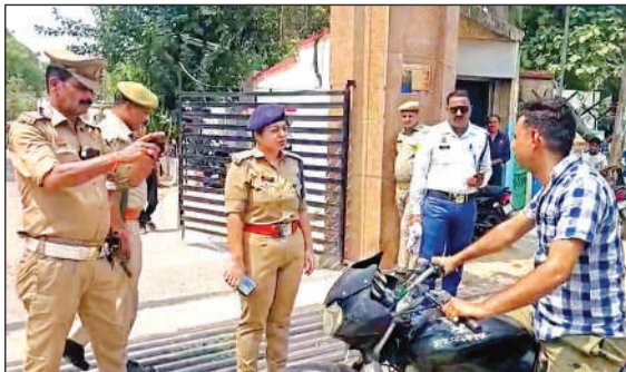
बाइक सवार पुलिस कर्मी का चालान कराते हुए सीओ सिटी।