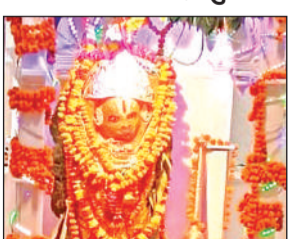
इटरा में स्थापित बजरंगबली की प्रतिमा।

सुमेरपुर। ज्येष्ठ मास के आखिरी मंगलवार को इटरा के बजरंगबली मंदिर में श्रद्धा का सैलाब उमड़ पड़ा। यहां पर पूरे दिन मेले जैसा नजारा रहा। लोगों ने तड़के से ही श्रद्धा भाव के साथ पूजन करके बजरंगबली को लहू का भोग अर्पित किया। इटरा के बजरंगबली की मूर्ति की ख्याति दूर-दूर तक है यहां वर्ष पर्यंत मंगलवार को भक्तों का ताता उमड़ता है। ज्येष्ठ मास के आखिरी मंगलवार को तड़के से श्रद्धा का सैलाब उमड़ा और पूरे दिन आश्रम में मेले जैसा नजारा रहा तमाम भक्तों ने पूजा अर्चना के बाद भक्तों के मध्य भंडारे का आयोजन किया।