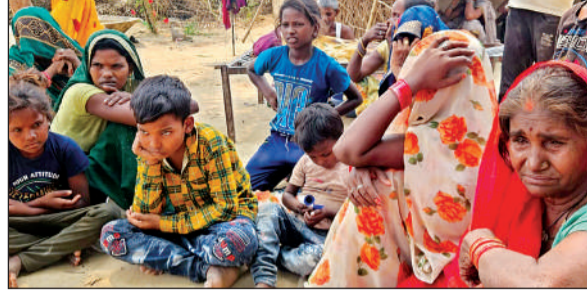
बच्चे की मौत पर रोते - बिलखते परिजन।