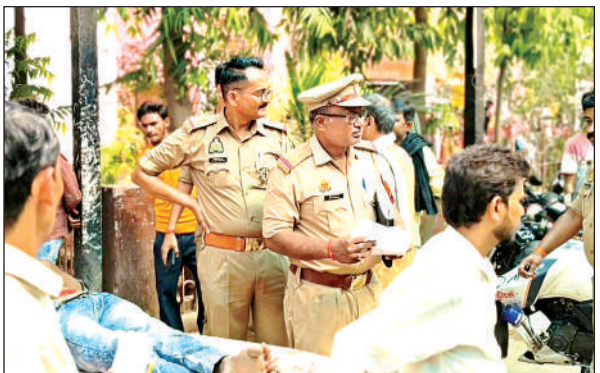
हादसे की सूचना पर सीएचसी पहुंची पुलिस। अमृत विचार