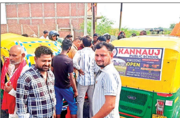
घटनास्थल पर मौजूद लोगों की भीड़।