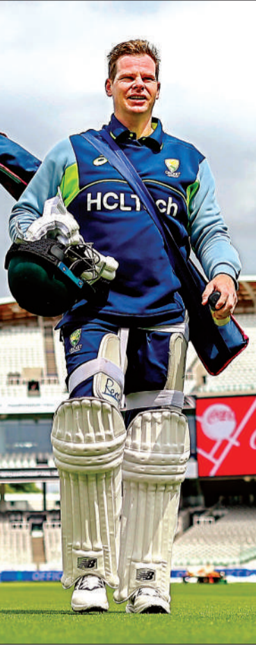
लंदन में दक्षिण अफ्रीका के खिलाफ विश्व टेस्ट चैंपियनशिप फाइनल की पूर्व संध्या पर अभ्यास सत्र के दौरान ऑस्ट्रेलिया के स्टीव स्मिथ।

सैंतीस वर्ष के लियोन उस आस्ट्रेलियाई टीम का हिस्सा हैं जो बुधवार से लॉर्ड्स पर दक्षिण अफ्रीका के खिलाफ विश्व टेस्ट चैंपियनशिप 2023-25 चक्र का फाइनल खेलेगी। आस्ट्रेलिया ने 2003 में भारत को 209 रन से हराकर खिताब जीता था। लियोन ने कहा हमने पिछले दो साल में शानदार प्रदर्शन किया है जिस पर हमें गर्व है। हम आस्ट्रेलिया की महान टीम बनने की राह पर हैं, लेकिन अभी वहां तक पहुंचने नहीं है। यह मैच उस मंजिल तक के सफर में अहम कदम होगा। आस्ट्रेलिया 2023-25 डब्ल्यूटीसी चक्र में दक्षिण अफ्रीका के बाद दूसरे स्थान पर रहा था। लियोन ने दक्षिण अफ्रीका के खिलाफ 18 मैचों में 56 विकेट लिये हैं।