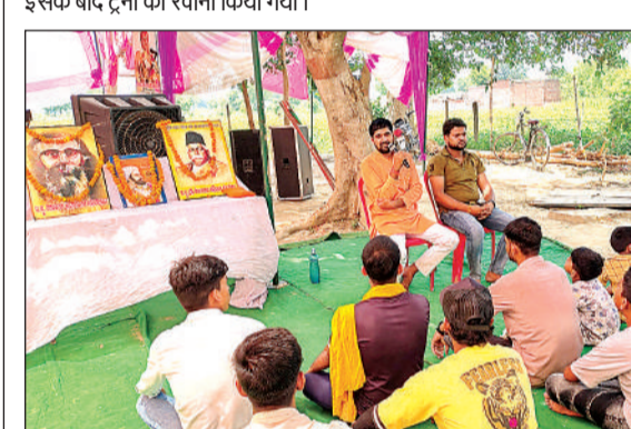
कार्यक्रम के दौरान मौजूद कार्यकर्ता।

अछन्दा। दिल्ली-हावाड़ा रेल मार्ग पर शाम को 13-बी फाटक पर भीषण जाम लग गया। जाम लगने से दो वंदे भारत ट्रेन को आडटर पर रोक दिया गया। वंदे भारत आडटर पर खड़े होने स्टेशन पर अफर-तफरी मच गई। आरपीएफ को भेजकर फाटक को बन्द कराया गया, जिसके बाद दोनों ट्रेनों को रवाना किया गया। क्रॉसिंग 13-बी पर शाम 7 बजे भीषण जाम लग गया। क्रॉसिंग पर जाम लगने से अयोध्या से नई दिल्ली जा रही वंदे भारत 22435 और वनारस से नई दिल्ली जा रही 22425 को आडटर पर खड़ा किया गया। आरपीएफ ने वहाँको हटाकर क्रॉसिंग बन्द कराई, इसके बाद ट्रेनों को रवाना किया गया।