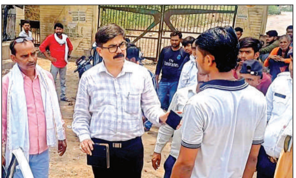
सड़क किनारे खड़े वाहनों का चालान करते एआरटीओ। अमृत विचार

अमृत विचार। अमरोहा से झांसी जा रही वैन हाईवे पर कस्बे के बड़ा चौराहा के पास खड़े डंपर में पीछे से जा घुसी, जिससे उसमें बैठे लोगों में चीख-पुकार मच गई। वैन में सवार सभी 10 लोग घायल हो गए। पुलिस ने घायलों को एंबुलेंस और ई-रिक्शा से अस्पताल पहुंचाया, जहां डॉक्टरों घायलों का प्राथमिक उपचार कर जिला अस्पताल रेफर कर दिया। जिला अस्पताल में दो लोगों की मौत हो गई। आठ घायलों की हालत गंभीर होने पर कानपुर रेफर कर दिया गया।