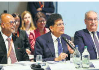
● उद्योग मंत्री ने कहा- भारत विशाल बाजार और कुशल पेशेवर कराता है उपलब्ध

दोनों पक्षों ने 10 मार्च 2024 को व्यापार एवं आर्थिक साझेदारी समझौते (टीईपीए) पर हस्ताक्षर किए थे। समझौते के तहत, भारत को समूह से 15 वर्ष में 100 अरब अमेरिकी डॉलर के निवेश की प्रतिबद्धता प्राप्त हुई है, जबकि स्विट्स चडियों, चॉकलेट्स और तराशे गए हीरों जैसे कई उत्पादों को कम