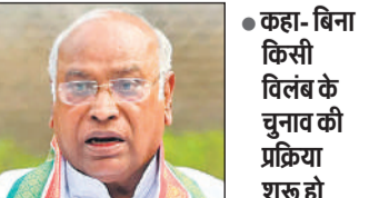
● कहा- बिना किसी विलंब के चुनाव की प्रक्रिया शुरू हो

कांग्रेस अध्यक्ष मल्लिकार्जुन खरगे ने प्रधानमंत्री नरेन्द्र मोदी को पत्र लिखकर आग्रह किया कि बिना किसी विलंब के लोकसभा उपाध्यक्ष के चुनाव की प्रक्रिया शुरू की जाए। राज्यसभा में नेता प्रतिपक्ष खरगे ने इस बात पर चिंता जताई कि पिछली लोकसभा में कोई उपाध्यक्ष नहीं था और वर्तमान लोकसभा में भी कोई उपाध्यक्ष नहीं है। उन्होंने कहा कि लोकतांत्रिक राजनीति के लिए अच्छा संकेत नहीं है और यह संविधान के निर्धारित प्रावधानों का उल्लंघन भी है।