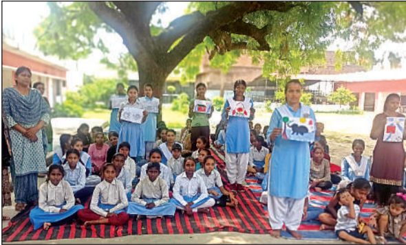
राजकीय बालिका इंटर कॉलेज राजापुर में चित्रकला प्रतियोगिता में भाग लेती छात्राएं।