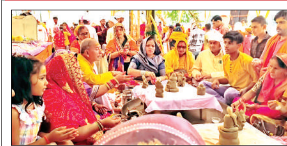
शिवलिंग पर रुद्राभिषेक करते श्रद्धालु।