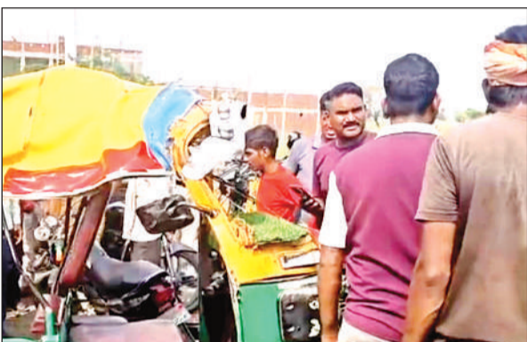
हादसे के बाद क्षतिग्रस्त आटो।