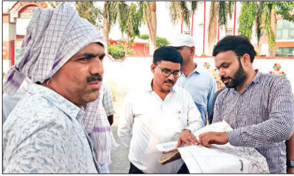
पैमाइश के लिए नक्शा देखते नायब तहसीलदार।