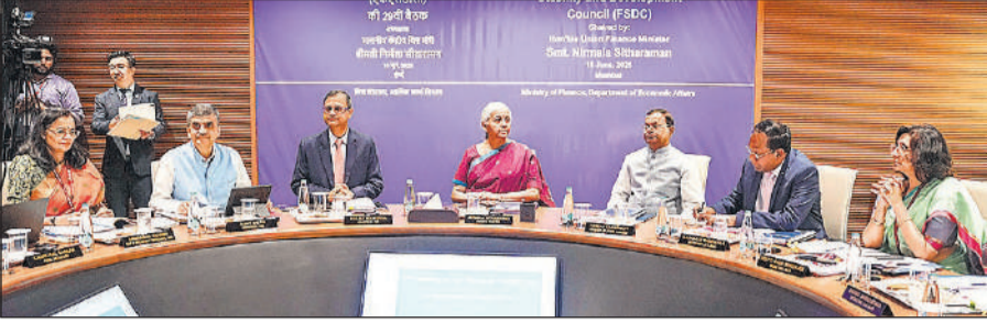
मुंबई में वित्तीय स्थिरता और विकास परिषद की 29वीं बैठक को संबोधित करती निर्मला सीतारमण।

वित्त मंत्रालय ने एक बयान में कहा कि वित्त मंत्री ने परिषद से सक्रिय कदम उठाने का आह्वान किया ताकि नागरिकों को वित्तीय क्षेत्र में केवाईसी (अपने ग्राहक को जानो) से संबंधित प्रक्रियाओं के संबंध में सहज अनुभव मिल सकें। इस दौरान भारतीय प्रतिभूति