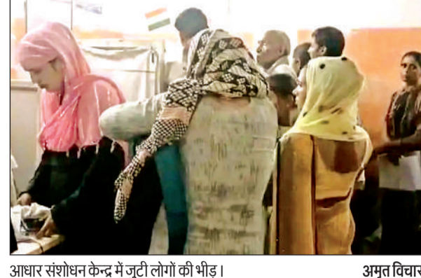
आधार संशोधन केन्द्र में जुटी लोगों की भीड़।

अमृत विचार। तहसील लोक निर्माण विभाग मार्ग पर स्थित आधार संशोधन केन्द्र में अव्यवस्थाओं का बोलबाला है। प्रति दिन सैकड़ों लोग आधार कार्ड संशोधन के लिए केन्द्र पहुंचते हैं। घंटों लाइन पर लगे रहने के बाद भी नम्बर नहीं आता है, जिससे दूरदराज से आने वाले तमाम लोग किराया-भाड़ा खर्च कर बैरंग लौट जाते हैं। पंखों कूलर की भी कोई व्यवस्था न होने से लोग गर्मी से खासा परेशान रहते हैं। मालूम हो कि आधार कार्ड में छोटी छोटी गलतियां होने के कारण उसमें संशोधन कराने के लिए आधार संशोधन केन्द्र पर भारी भीड़ जुटती है। जिसके चलते लोग घंटों आपने नम्बर आने का इंतजार रकते रहते हैं। तेज धूप और गर्म हवाओं के बीच लोग छोटे छोटे बच्चों को आधार संशोधन के लिए लेकर आते हैं। लेकिन केन्द्र संचालक काम न करके पहुंचे वाले लोगों को पहले