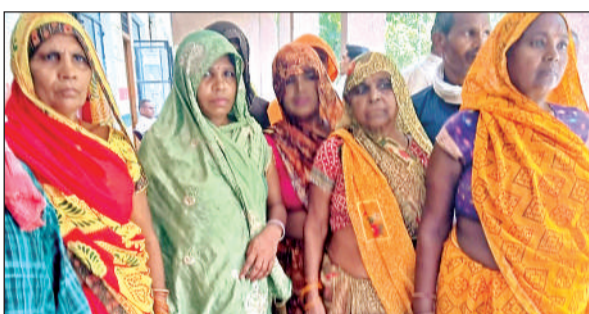
तहसील में खड़ी राशन कार्डधारक महिलाएं, पुरुष।