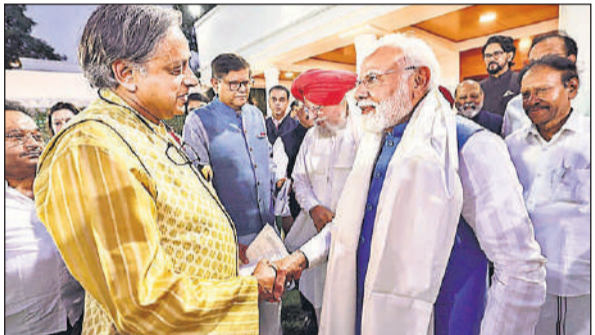
सर्वदलीय प्रतिनिधिमंडल के सदस्य शशि थरूर से मिलते प्रधानमंत्री मोदी।

प्रधानमंत्री नरेन्द्र मोदी ने मंगलवार को कहा कि उनकी सरकार के 11 वर्ष के कार्यकाल में रक्षा क्षेत्र में महत्वपूर्ण बदलाव आए हैं और रक्षा उत्पादन में आधुनिकीकरण तथा आत्मनिर्भरता दोनों पर स्पष्ट रूप से ध्यान केंद्रित किया गया है। प्रधानमंत्री ने एक्स पर अपने पोस्ट में कहा, पिछले 11 वर्ष में हमारे रक्षा क्षेत्र में महत्वपूर्ण बदलाव आए हैं तथा रक्षा उत्पादन के मामले में आधुनिकीकरण और आत्मनिर्भर बनने पर स्पष्ट ध्यान दिया गया है। यह देखकर खुशी होती है कि कैसे भारत के लोग देश को मजबूत बनाने के संकल्प के प्रति एकजुट हुए हैं।