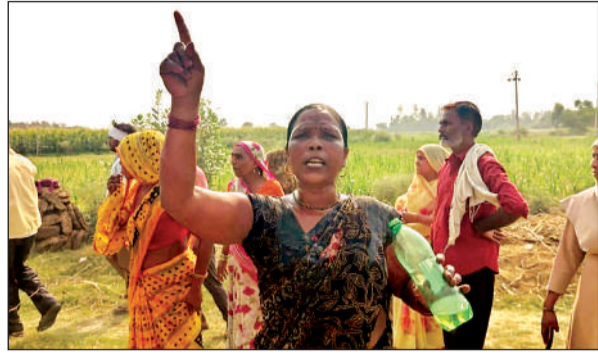
शरीर के ऊपर डीजल डालती महिला।

जिला पंचायत अध्यक्ष के पति पर विवादित जमीन पर कब्जा करने के आरोप