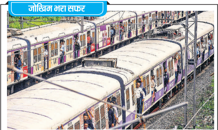
मुंबई में मंगलवार को भीड़भाड़ से भरी ट्रेनों में यात्रा करते लोग। एक दिन पहले टाणे के पास भीड़भाड़ वाली दो लोकल ट्रेन से गिरकर एक जीआरपी कास्टेबल सहित चार यात्रियों की मौत हो गई थी, नौ घायल हो गए थे।