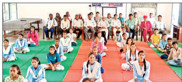
राजकीय इंटर कॉलेज उमदा में समर कैंप समापन के दौरान उपस्थित विद्यार्थी, शिक्षक व अभिभावक।