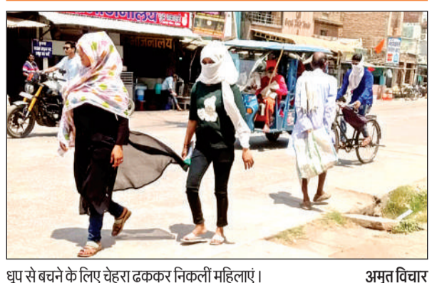
धूप से बचने के लिए चेहरा ढककर निकली महिलाएं।