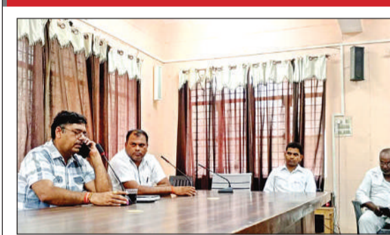
वकीलों के साथ बैठक करते तहसीलदार।