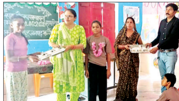
शिक्षिका को सम्मानित करते प्रभारी प्रधानाध्यापक।