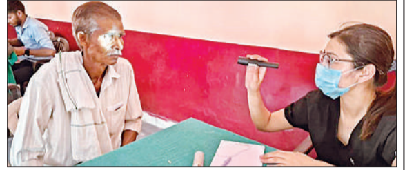
नेत्र रोगी का परीक्षण करती चिकित्सक।