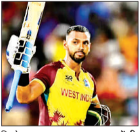
निकोलस पूरन। ● एजेंसी

हाल ही में अंतरराष्ट्रीय क्रिकेट को अलविदा कहने वाले वेस्टइंडीज के स्टार बल्लेबाज निकोलस पूरन को मेजर लीग क्रिकेट (एमएलसी) के आगामी सत्र के लिए एमआई न्यूयॉर्क का कप्तान बनाया गया है। 29 वर्ष के पूरन ने मंगलवार को अंतरराष्ट्रीय क्रिकेट से विदा ली थी। एमएलसी का पहला सत्र जीतने वाली टीम ने एक्स पर लिखा हमारी टीम का नया कमांडर होगा कप्तान निकोलस पूरन। आईपीएल में मुंबई इंडियंस की मालिक रिलायंस इंडस्ट्रीज की टीम ने लिखा बायें हाथ के विकेटकीपर बल्लेबाज दुनिया के