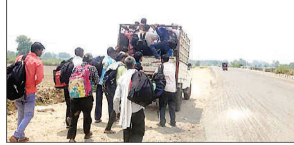
सवारियां ढोता डग्गामार वाहन।

डग्गामार वाहन हरदोई-शाहजहांपुर हाईवे मार्ग पर बंझिइक