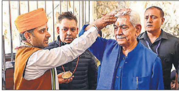
उपराज्यपाल मनोज सिन्हा ने पवित्र अमरनाथ गुफा में प्रथम पूजा की, जो वार्षिक अमरनाथ यात्रा की औपचारिक शुरुआत का प्रतीक है।

जम्मू कश्मीर के उपराज्यपाल मनोज सिन्हा ने बुधवार को कहा कि आगामी वार्षिक अमरनाथ यात्रा के लिए सुरक्षा के पुख्ता इंतजाम किए गए हैं। सिन्हा ने श्रद्धालुओं से बड़ी संख्या में पवित्र गुफा में बाबा बर्फानी के दर्शन के लिए आने की अपील की। सिन्हा ने पवित्र गुफा में प्रथम पूजा कर इस वर्ष की वार्षिक अमरनाथ यात्रा की औपचारिक शुरुआत की। सिन्हा ने कहा, प्रथम पूजा संपन्न हो गई। मैं श्रद्धालुओं से अनुरोध करता हूँ कि वे बड़ी संख्या में यात्रा के लिए आएँ। यह यात्रा तीन जुलाई से शुरू होगी और नौ अगस्त के रक्षा बंधन के दिन समाप्त होगी। उन्होंने कहा कि श्राइन बोर्ड और प्रशासन ने इस वर्ष तीर्थयात्रियों के लिए सुविधाओं में