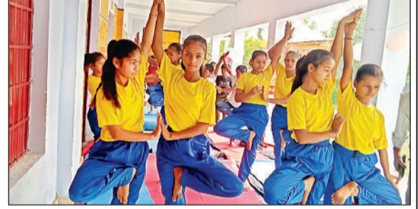
समर कैंप में योग का अभ्यास करती छात्राएं।