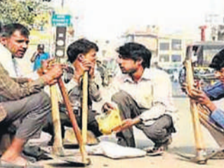
● अंतरराष्ट्रीय श्रम सम्मेलन के 113वें सत्र में श्रम मंत्री मनसुख मांडविया ने दिया बयान

अंतरराष्ट्रीय श्रम संगठन (आईएलओ) ने कहा है कि भारत में सामाजिक सुरक्षा दायरे में आने वाले लोगों की संख्या बढ़ी है। 2025 में यह कुल आबादी के 64.3 प्रतिशत तक पहुंच गई, जबकि 2015 में यह आंकड़ा 19 प्रतिशत था। आईएलओ के आंकड़ों के अनुसार, भारत वर्तमान में 94 करोड़ नागरिकों को सामाजिक सुरक्षा प्रदान करता है। इसके साथ लाभाधिक्य की संख्या के मामले में भारत दुनिया में दूसरे स्थान पर है। आईएलओ के अंतरराष्ट्रीय श्रम सम्मेलन के 113वें सत्र में भाग लेने के लिए जिनेवा गये श्रम मंत्री मनसुख मांडविया ने बयान में कहा, यह दुनिया भर में सामाजिक सुरक्षा दायरे में सबसे तेज विस्तार है। यह 'अत्योदय' यानी