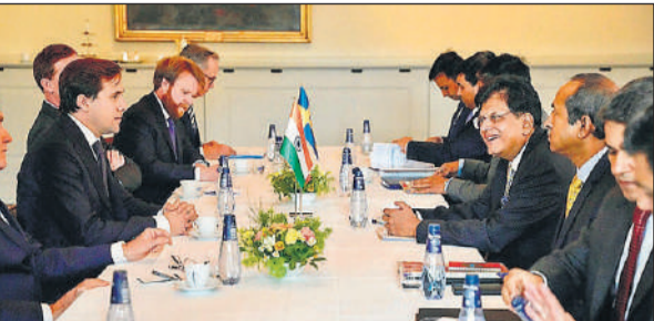
उद्योग मंत्री पीयूष गोयल स्वीडन में बैठक के दौरान चर्चा करते हुए।

वाणिज्य एवं उद्योग मंत्री पीयूष गोयल ने कहा कि विश्व व्यापार गंभीर भू-राजनीतिक चुनौतियों का सामना कर रहा है, लेकिन भारत ऐसे समय में लगातार विजेता के रूप में उभरा है और देश का वस्तुओं एवं सेवाओं का निर्यात निश्चित रूप से 2025-26 में 825 अरब डॉलर को पार कर जाएगा। रूस-यूक्रेन संघर्ष, इजराइल-हमास युद्ध और लाल सागर संकट के कारण वैश्विक आर्थिक अनिश्चितताओं के बावजूद देश का समग्र निर्यात 2023-24 में 778 अरब अमेरिकी डॉलर के मुकाबले 2024-25 में 825 अरब अमेरिकी डॉलर के सर्वकालिक उच्च स्तर पर पहुंच गया। गोयल ने कहा कि कुछ बहुपक्षीय निकायों के अनुमान के अनुसार, वैश्विक व्यापार में संकुचन होगा। उन्होंने कहा, दुनिया गंभीर