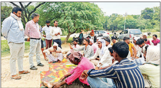
धरने पर बैठे ग्रामीणों को समझाते अवर अभियंता।