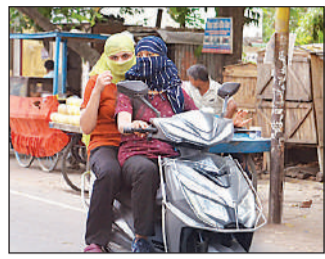
सिर व चेहरा ढककर जाती युवतियां।

हरदोई, अमृत विचार। उमसमरी भीषण गर्मी से लोग बेहाल हैं। दिन में धिलचिलती धूप राहगीरों के लिए परेशानी का सबब बनी हुई है। बुधवार को तापमान 40 डिग्री सेल्सियस पहुंच गया। साइकिल और बाइक चालकों को तपती सड़कें और गर्म हवाएं पूरी तरह परेशान करती रहीं। गर्मी के कारण कार्यालय व दुकानों में भी आवाजाही कम देखी गई। गर्मी से सिर्फ इंसान ही नहीं, जानवर भी परेशान नजर आए। पशुपानी की तलाश में इधर उधर भटकते नजर आए। अगर में जल स्रोतों की कमी ने उनकी प्यास बुझाने के सभी रास्ते बंद कर दिए। हालात तब और खराब हो गए जब बिजली की बार-बार कटौती ने लोगों को बेहाल कर दिया। मौसम विभाग ने आने वाले दिनों में गर्मी बढ़ने की चेतावनी दी है।