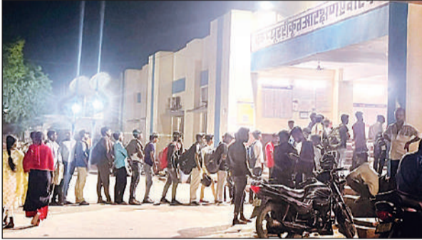
टिकट लेने के लिए लगी यात्रियों की लाइन।