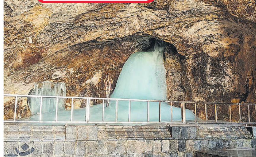
जम्मू-कश्मीर के उपराज्यपाल मनोज सिन्हा ने बुधवार को पवित्र अमरनाथ गुफा में प्रथम पूजा कर वार्षिक यात्रा की औपचारिक शुरुआत की, गुफा में मौजूद बाबा बर्फीनी के 3 जुलाई से लोग दर्शन कर सकेंगे। (खबर पेज-12)