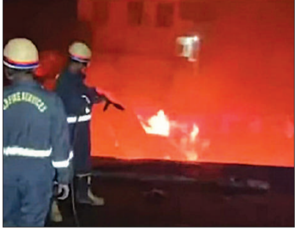
बाम्बे साड़ी सेल में लगी आग बुझाते दमकलकर्मी।

अमृत विचार। शहर में बाम्बे साड़ी सेल में आधी रात में अचानक आग लग गई। बिजली के शॉर्ट सर्किट से हुए हादसे से पूरे इलाके में भगदड़ मच गई। घंटे आग की लपटें उठती रहीं, पहले दमकल की दो गाड़ियां पहुंचीं, लेकिन उनका पहुंचना नाकाफी रहा, उसके बाद एक-एक कर चार गाड़ियों के पहुंचने पर तीन घंटे जूझने के बाद आग काबू हो सकी। हादसे में करीब-करीब 60 लाख की साड़ियां राख है गई।