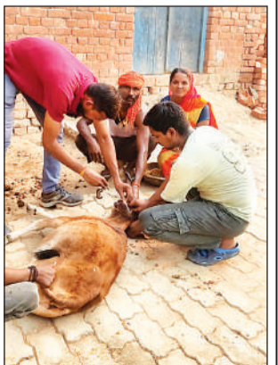
गाय का इलाज करते गौ रक्षक।