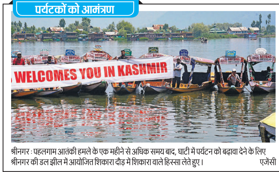
श्रीनगर : पहलगाम आतंकी हमले के एक महीने से अधिक समय बाद, घाटी में पर्यटन को बढ़ावा देने के लिए श्रीनगर की डल झील में आयोजित शिकारा दौड़ में शिकारा वाले हिस्सा लेते हुए।