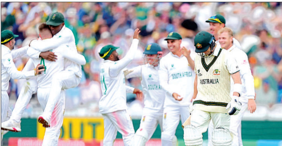
ऑस्ट्रेलिया के स्टीव स्मिथ को आउट करने के बाद जश्न मनाते दक्षिण अफ्रीका के खिलाड़ी।

स्टीव स्मिथ ने 10 चौकों की मदद से 66 रनों की पारी खेली। इसके बाद एलेक्स कैरी (23) रन बनाकर केशव महाराज को शिकार बने। इसके बाद रबाडा और यानसन ने ऑस्ट्रेलिया पारी को समेटने में देर नहीं लगाई। बो वेबस्टर ने 11 चौकों की मदद से (72) रनों की पारी खेली। उन्हें रबाडा ने आउट किया। कप्तान पैट कर्मिस (एक) और मिचेल स्टार्क (एक) को रबाडा ने बोल्ट आउट किया। नेथन लायन (शून्य) को मार्को यानसन बोल्ट किया। दक्षिण अफ्रीकी गेंदबाजों ने ऑस्ट्रेलिया की टीम को 56.4 ओवर में 212 के स्कोर पर ढेर कर दिया। इससे पहले आज यहां लाइंस के मैदान पर दक्षिण अफ्रीका के कप्तान टेम्बा बावुमा ने टॉस जीतकर