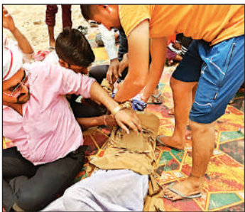
धरने पर बेहोश पड़ा ग्रामीण।