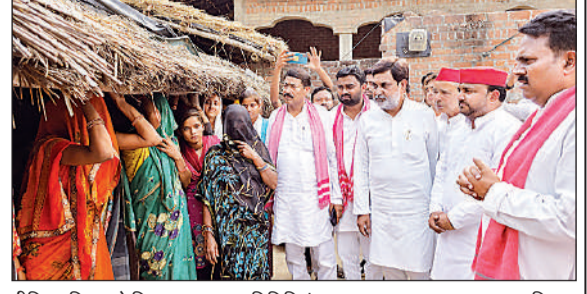
पीड़ित परिवार से मिलता सपा का प्रतिनिधि मंडल।