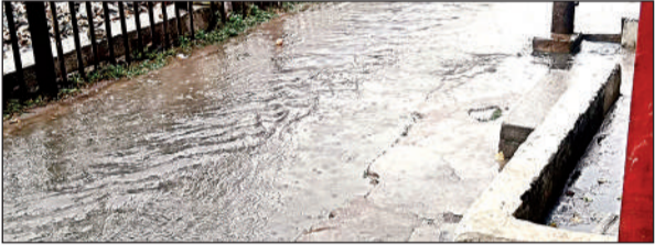
शहर की सड़कों पर भरा पानी।