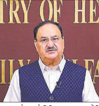
प्रथम सम्मेलन को डिजिटल माध्यम से संबोधित करते हुए यह बात कही। इस दो दिवसीय सम्मेलन का उद्देश्य विभिन्न एम्स द्वारा अपनाई गई अनुकरणीय विधियों को प्रदर्शित करना है, जिसमें योगी-

स्वास्थ्य मंत्री जेपी नड्डा ने शुक्रवार को कहा कि क्षेत्रीय असमानताओं को दूर करने के लिए देश के विभिन्न हिस्सों में स्थित प्रत्येक एम्स स्वास्थ्य देखभाल नवाचार और शिक्षा के केंद्र के रूप में कार्य करते हुए समतापूर्ण, वहनीय एवं साक्ष्य आधारित स्वास्थ्य सेवाएं प्रदान करते हैं। ये संस्थान सार्वजनिक स्वास्थ्य प्रणालियों को मजबूत करने, देखभाल के मानकों को बढ़ाने और स्वास्थ्य सेवा जुड़े विशेषज्ञों की एक नयी पीढ़ी को तैयार करने की सरकार की प्रतिबद्धता को दर्शाते हैं।