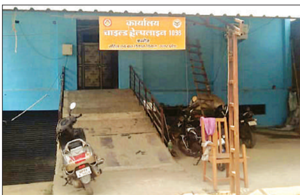
तिर्वा-कन्नौज रोड किनारे नसरपुर के पास स्थित चाइल्ड लाइन का कार्यालय।

करीब ढाई साल पहले भी महिला कल्याण विभाग की ओर से चयनित एजेंसी ने सेवायोजन पोर्टल पर बिना किसी सूचना को निकाले चहेतों के आवेदन ले लिए थे। साक्षात्कार तक की तैयारी व तारीख घोषित हो गई थी। इस मामले की शिकायत तत्कालीन सीडीओ आरएन सिंह से हुई थी। उस दौरान उन्होंने इंटरव्यू स्थगित कर दिए थे। साथ ही सेवायोजन पोर्टल पर सूचना प्रकाशित कराई गई तब कहीं जाकर