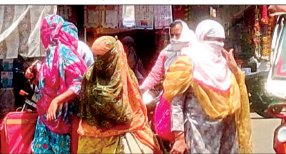
भीषण गर्मी के कारण चेहरे दककर निकलती महिलाएं।

पिछले दिनों की तरह शुक्रवार को भी गर्मी सुबह से ही अपने तीखे तेवर दिखा रही थी, जिसके चलते लोग काफी परेशानी महसूस कर रहे थे। धीरे-धीरे तापमान बढ़ता गया हालांकि धूप ज्यादा तेज नहीं थी, हल्के बादल थे लेकिन गर्मी में कोई कमी नहीं थी। दोपहर 2 बजे तापमान बढ़कर 42 डिग्री पर पहुंच