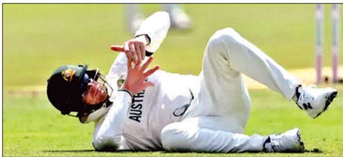
स्टीवन स्मिथ स्लिप में कैच लेने से चूक गए और उनकी उंगली में चोट लग गई।

मारक्रम 92 रन और कप्तान तेम्बा बावुमा 53 रन बनाकर क्रीज पर डटे हुए हैं। दक्षिण अफ्रीका अब जीत से 93 रन दूर है और उसके आठ विकेट शेष हैं। दिन के दूसरे सत्र में ऑस्ट्रेलिया को दोनों सफलता मिचेल् स्टार्क ने दिलायी। इससे पहले स्टार्क (नाबाद 58) की अर्धशतकीय पारी और आखिरी विकेट के लिए जोश हेजलवुड (17) के साथ 59 रन की साझेदारी के बूते ऑस्ट्रेलिया ने अपनी दूसरी पारी में 207 रन बनाकर दक्षिण अफ्रीका को चुनौतीपूर्ण लक्ष्य दिया। बल्लेबाजों के लिए आसान हुई