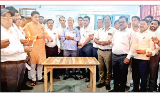
कैडल जलाकर श्रद्धांजलि देते वकील।