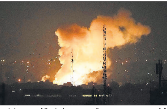
ईरान के तेहरान शहर में विस्फोट के बाद उड़ता धुआं।