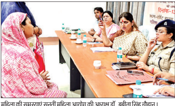
महिला की समस्याएं सुनती महिला आयोग की अध्यक्ष डॉ. बबीता सिंह चौहान।

बैठक में वृद्धावस्था पेंशन, विधवा पेंशन को लेकर उन्होंने जिला समाज कल्याण अधिकारी को निर्देशित किया कि ग्राम चौपाल लगाकर योजना का प्रचार-प्रसार करें। वृद्धावस्था पेंशन का सर्वे कराकर जरूरतमंद महिलाओं को योजना का लाभ अवश्य दें। उन्होंने समस्त अधिकारियों को निर्देश दिए कि सभी कार्यालयों में शिकायत पेट्री अवश्य लगाई जाए। उन्होंने पिछड़ा वर्ग कल्याण अधिकारी को