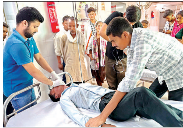
जिला अस्पताल की इमरजेंसी में भर्ती युवक का इलाज करते डॉक्टर।

अमृत विचार। ससुराल लेने गए पति के साथ पत्नी ने आने से साफ मना कर दिया। काफी मान मनव्वल के बाद भी पत्नी तैयार नहीं हुई। इससे आहत होकर शुकुवार को वह अपने घर लौटा और जहर खा लिया। हालत बिगड़ने पर परिजन उसे श्रीनगर सामुदायिक स्वास्थ्य केन्द्र ले गए, जहां डाक्टर ने प्राथमिक उपचार के बाद गंभीर हालत में जिला अस्पताल रेफर कर दिया। उसका इमरजेंसी वार्ड में इलाज चल रहा है।