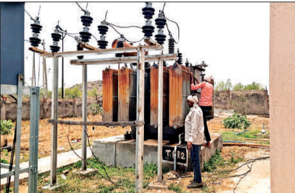
ट्रांसफॉर्मर ठीक करते बिजली कर्मचारी।

अमृत विचार। भीषण गर्मी में लोगों का बुरा हाल है। वहीं दूसरी तरफ बिजली कटौती लोगों के लिए मुसीबत बन गई है। गर्मी से जहां हायतौबा मंची है वहीं बिजली कटौती आग में घी डालने का काम कर रही है। कई कई घंटे बिजली न आने से लोगों की मुश्किलें बढ़ गई हैं, स्थिति यह है कि लोग बिजली जाने पर जाग कर रातें गुजार रहे हैं। छोटे छोटे बच्चों का गर्मी से बुरा हाल है।