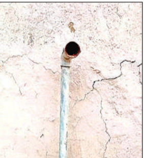
बिना टोंटी के लगा स्टैंड पोस्ट नल।