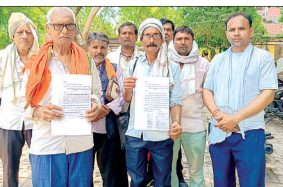
डीएम को ज्ञापन देने जाते रहिरका के ग्रामीण।