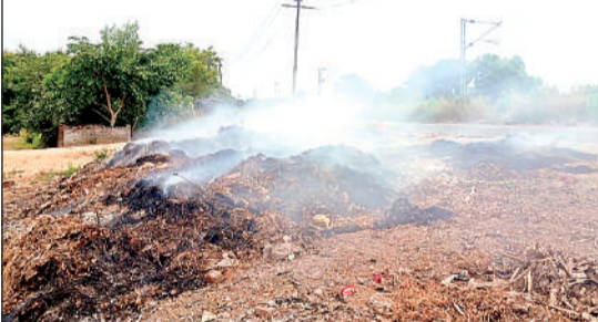
नगर पालिका की ओर से पेट्रोल पंप के आगे डाले गये कूड़े से उठता धुआं।