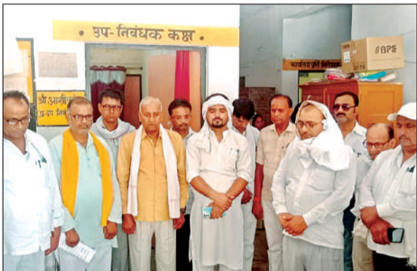
शोकसभा में दो मिनट का मौन रखकर शांति की प्रार्थना की गई।

अमृत विचार। अहमदाबाद के सरदार वल्लभभाई पटेल अंतरराष्ट्रीय हवाई अड्डे के समीप हुए भीषण विमान हादसे में एयर इंडिया का विमान दुर्घटनाग्रस्त होने से गुजरात के पूर्व मुख्यमंत्री और यात्रियों की मृत्यु से शोक की लहर है। चरखारी उपनिबंधक कार्यालय में मृतकों की आत्मा की शांति के लिए शोकसभा आयोजित कर दो मिनट का मौन रखा गया।