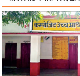
नगर क्षेत्र का कंपोजिट विद्यालय सरायमीरा प्रथम।