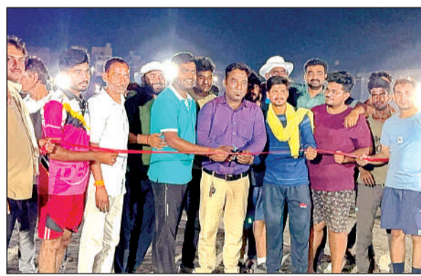
फीता काटकर टूर्नामेंट का उद्घाटन करते समाजसेवी।