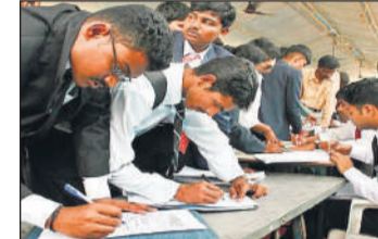
● सालाना आधार पर इसमें 1.8 प्रतिशत की मामूली गिरावट दर्ज की गई