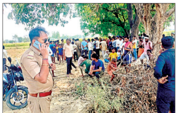
मौके पर मौजूद पुलिस व लगी ग्रामीणों की भीड़।