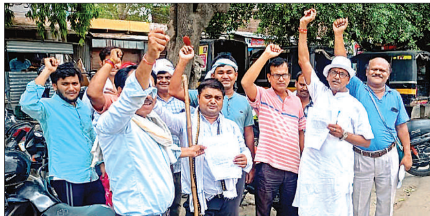
बिजली समस्या को लेकर आक्रोश जताते चकमाली अमानपुर के लोग।