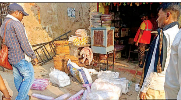
दुकान से पॉलीथीन जब्त करते नगर पालिका के कर्मचारी।

अमृत विचार। नगर पालिका परिषद की ओर से प्रतिबंधित पॉलीथीन के खिलाफ अभियान चलाकर शहर में चार दर्जन से अधिक दुकानों में छापेमारी की गई, जिसमें 70 किलो पॉलीथीन जब्त कर करीब एक दर्जन लोगों से साढ़े छह हजार जुर्माना वसूल गया।