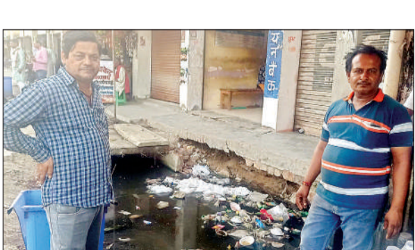
अंधूरे नाले में बजबजती गंदगी।

यातायात की चुस्त-दुरुस्त व्यवस्था करने के उद्देश्य से राजापुर देवी मंदिर तिराहे से बोड़ी पोखरी रैपुरा तक 18 किमी तक राष्ट्रीय राजमार्ग बनाया जा रहा है। सन् 2023 से 2024 के बीच नगर पंचायत क्षेत्र के अधिकांश भागों में ठेकेदार ने आधे अधूरे नाले, अधूरी सड़कें और स्ट्रीट लाइटों का काम किया और ठप कर दिया।