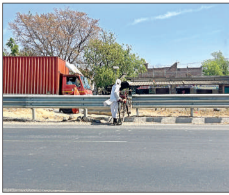
जान खतरे में डालकर हाईवे पार करत साइकिल सवार युद्ध, हाईवे पर बना अवैध कट।

बैठक के जरिए विभिन्न विभागों से आए अधिकारियों से चर्चा कर आगे की रणनीति बनाई जाती है। किस प्रकार सड़क हादसों को कम किया जाए और ब्लैक स्पॉट को निश्चित किया जाए। नेशनल हाईवे पर खुले अवैध कटों को बंद किया