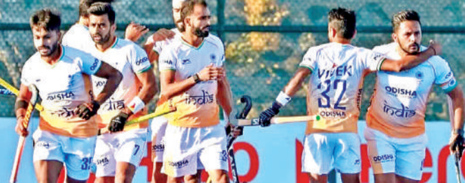
भारतीय हॉकी टीम।

लगातार चार मैच में हार से आहत भारतीय पुरुष हॉकी टीम को अगर खिताब की अपनी उम्मीदों को बनाए रखना है तो उसे ऑस्ट्रेलिया की मजबूत टीम के खिलाफ शनिवार को यहां होने वाले पुरुष एफआईएच प्रो लीग मैच में अपना सर्वश्रेष्ठ प्रदर्शन करना होगा। टूर्नामेंट का यूरोपीय चरण भारतीय पुरुष हॉकी टीम के लिए निराशाजनक रहा। उसे एम्स्टेलवीन में ओलंपिक चैंपियन नीदरलैंड से 1-2 और 2-3 से हार का सामना करना पड़ा। इसके बाद अर्जेंटीना के खिलाफ भी टीम दोनों मैच हार गई। भारत अभी 12 मैचों में 15 अंक लेकर पांचवें स्थान पर है और उसे महत्वपूर्ण अंक जुटाने और शीर्ष तीन में जगह बनाने की दौड़ में बने रहने के लिए ऑस्ट्रेलिया के खिलाफ मजबूती से वापसी करनी होगी। उंगली में चोट के