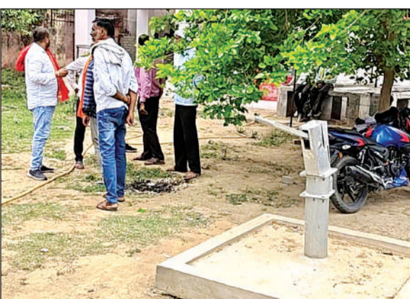
पोस्टमार्टम हाउस के पास खराब पड़ा हैंडपंप।

आसपास पानी की सुविधा न होने से उनको बोललें खरीद कर पानी पीना पड़ता है। वहीं मुख्यालय के पठकाणा मुहाल में भी दशकों पूर्व नज्जों के घर के बाहर सरकारी हैंडपंप लगाया गया था। जो कुछ महिनों से खराब हो जाने से स्थानीय लोगों को दूसरे लोगों के घरों के बाहर लगे नल से पानी भर कर पीना पड़ रहा है। दर्जनों मर्तबा शिकायत के बाद भी जल संस्थान इसकी मरम्मत को लेकर कोई उचित समाधान नहीं किया है। भीषण गर्मी में जल संकट से स्थानीय लोगों में आक्रोश व्याप्त है।