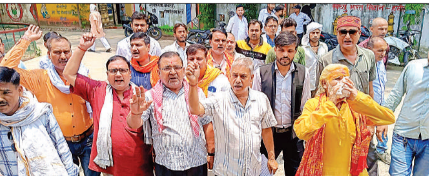
भाजपा नेता के सुसाइड मामले को लेकर शुक्रवार को कलेक्ट्रेट में प्रदर्शन करते ब्राह्मण महासभा के लोग।