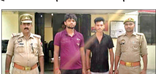
पुलिस गिरफ्तार में हत्या के आरोपी।