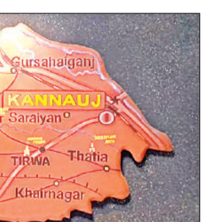
कन्नौज जिले का नक्शा।

जनपद कन्नौज में बिजली विभाग के खराब ट्रांसफॉर्मर की शिकायतों में सबसे फिसट्टी प्रदेश के 5 जिलों में अपना कन्नौज सबसे नीचे है। उपलब्धि 99.89 फीसदी, रैंक 72 व अंक 10 है। कुल आवेदन 933 आए जिसमें 893 को अनुमोदन मिला है और 38 लंबित हैं। दैनिक बिजली आपूर्ति ग्रामीण क्षेत्र में रैंक 65 और अंक 5 मिले हैं। शहरी क्षेत्र की रैंक भी 65 बताई गई है। प्रधानमंत्री किसान सम्मान निधि