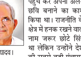
छोटे सिंह यादव।

बढ़ गई वह समाजवादी विचार धारा जुड़े राजनीतिक दलों के बैनर तले तीन बार सांसद चुने गए। 1996 में छिबरामऊ विधानसभा से विधायक चुने गये। उन्होंने अपने राजनीतिक जीवन लोकसभा व विधानसभा में मेदांता अस्पताल में लम्बी बीमारी के बाद निधन हो गया। उनके निधन की खबर मिलते ही राजनीतिक गलियारों में शोक की लहर दौड़ गई।