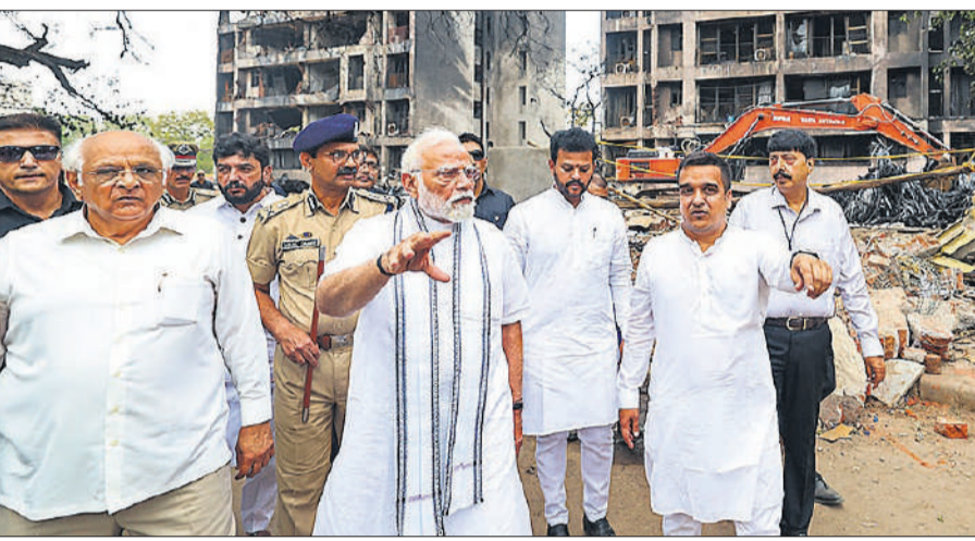
अहमदाबाद में दुर्घटनास्थल पर पहुंचे प्रधानमंत्री मोदी ने विमान हादसे के बारे में जानकारी ली।