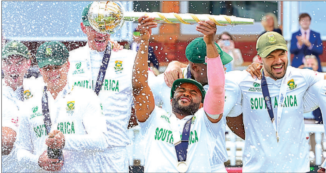
दक्षिण अफ्रीका के कप्तान टेम्बा बावुमा टीम के साथ विश्व टेस्ट चैंपियनशिप जीतने के बाद जश्न मनाते हुए।

ऑस्ट्रेलिया ने लगाया पूरा जोर : ऑस्ट्रेलिया ने मैच के चौथे दिन भी पूरा जोर लगाया जारी रखा और कप्तान पैट कमिंस की अगुवाई में उसके गेंदबाजों ने शुरुआती घंटे में दक्षिण अफ्रीका के बल्लेबाजों की कड़ी परीक्षा ली। दिन के तीसरे ओवर में जब कमिंस की गेंद पर कप्तान टेम्बा बावुमा (66) विकेट के पीछे एलेक्स कैरी के द्वारा लपके गये तब लगा कि टीम पिछली कई बार की तरह एक बार फिर जीत के करीब पहुंच कर फिसल ना जाये। दिन के शुरुआत 102 रन से करने वाले शतकवीर एडन मारक्रम (136) की अगुवाई में टीम ने हालांकि धैर्यपूर्ण बल्लेबाजी करते हुए