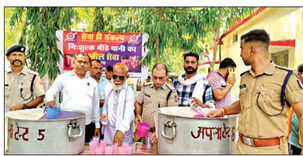
स्टाल लगाकर लोगों को शर्बत का वितरण किया गया।

अमृत विचार। जिले में तेज धूप और गर्म हवाओं के चलते तापमान 45 डिग्री सेल्सियस पहुंच जाने से लोगों का बुरा हाल है। सिहत भरी गर्मी से राहत दिलाए जाने के लिए रेलवे स्टेशन में रेलवे सुरक्षा बल और नगर पालिका परिषद ने संयुक्त रूप से अभियान चलकर यात्रियों को ठंडा पानी और शरबत पिलाकर पुनीत कार्य किया जा रहा है। इतना ही नहीं स्टेशन पर ट्रेन रुकते ही आरपीएफ के जवान व पालिका के सभासद यात्रियों को शरबत और ठंडा पानी देने पहुंच जाते हैं। गर्मी से राहत पहुंचाने के लिए चलाए जा रहे इस अभियान से यात्रियों और राहगीरों को राहत मिल रही है। रेलवे स्टेशन पर चलाए जा रहे