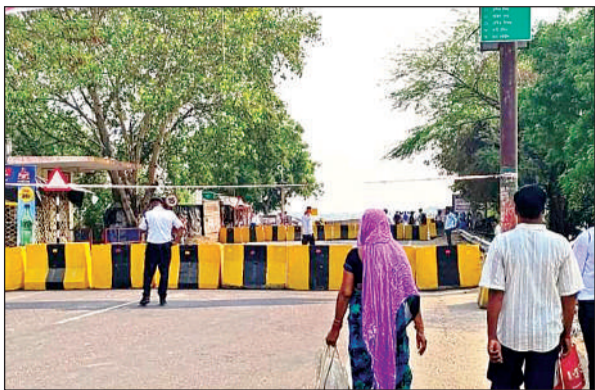
पुल की मरम्मत के लिए दोनों छोर पर बैरिकेडिंग कर ट्रैफिक रोका गया । अमृत विचार

अमृत विचार । यमुना नदी के जर्जर पुल की शनिवार सुबह से बेयरिंग बदलने का काम शुरू हो गया, जो लगातार 48 घंटे तक चलेगा । मरम्मत की वजह से नेशनल हाईवे को दोनों तरफ ब्लाक कर पुल से आवागमन पूरी तरह बंद कर दिया गया है । न सिर्फ वाहनों की आवाजाही बंद कर दी गई है, बल्कि पैदल निकलने पर भी रोक लगा दी गई है । हल्के और भारी वाहनों को वैकल्पिक मार्गों में डायवर्ट किया गया है । मरम्मत कार्य में तीन इंजीनियर और 15 एक्सपर्ट लगाए गए हैं । सोमवार से पुल पर आवागमन शुरू हो सकेगा ।