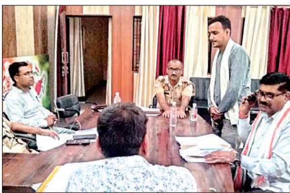
समस्याओं को सुनते अधिकारी।