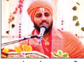
कथा सुनाते आचार्य।