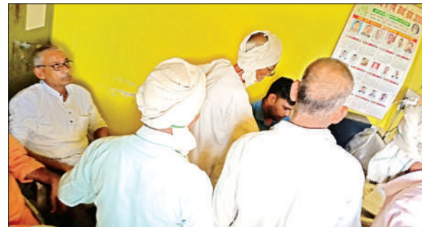
महेवा ब्लॉक में बीज लेने के लिए एकत्रित किसान।

शनिवार को कई किसान महेवा ब्लॉक पर अनुदानित धान का बीज लेने पहुंचे थे। परंतु गांव की गलत फीडिंग कृषि विभाग के पोर्टल पर होने के कारण उन्हे बीज नहीं मिल सका। महेवा ब्लॉक के करीब 9 गांव हैं जो दूसरे ग्राम पंचायत या दूसरे ब्लॉक में फीड कर दिए गए