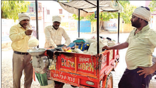
गर्मी में सत्तू की बिक्री बढ़ रही है।