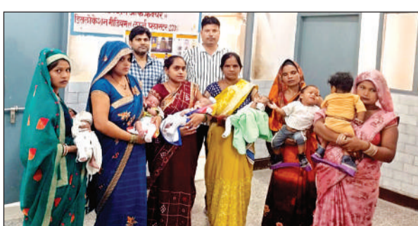
इलाज के लिए आए क्लब फुट पीड़ित बच्चे।