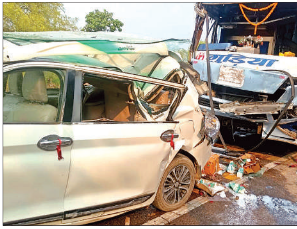
टक्कर के बाद क्षतिग्रस्त बस और कार।