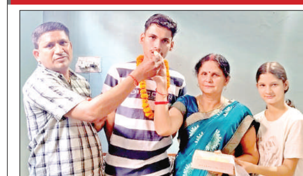
मिठाई खिलाकर खुशियां मनाते माता-पिता।