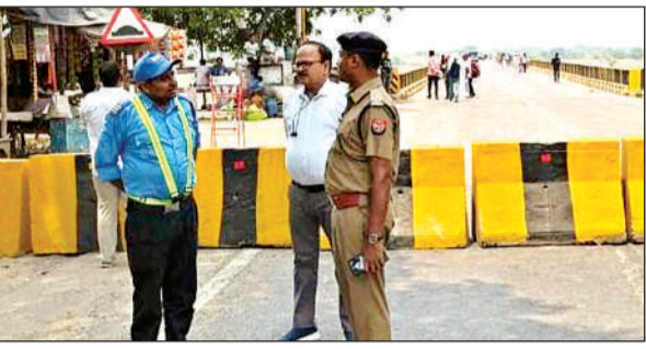
यमुना ब्रिज का निरीक्षण करते एडीएम व एएसपी । अमृत विचार