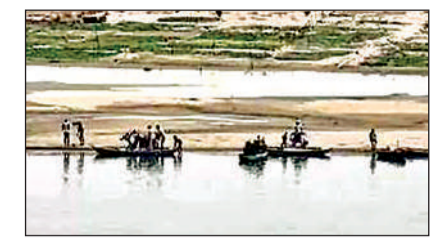
नावों के सहारे नदी पार करते लोग । अमृत विचार

यमुना नदी के पुल पर बेयरिंग की मरम्मत का काम शुरू होते ही पैदल यात्रियों को भी निकलने से रोक दिया गया । ऐसी स्थिति में जरूरी काम से कानपुर की ओर जाने वाले लोगों ने यमुना नदी पार करने के लिए नावों का सहारा लिया । नाविकों ने भी इस मौके का फायदा उठाते हुए नदी पार कराने के लिए यात्रियों से 50 से 100 रुपये तक वसूलें । तमाम लोगों ने बाइकों को भी नाव के जरिए उस पार पहुंचाया और फिर गंतय की ओर रवाना हुए । रविवार तक यही हालात रहेंगे ।