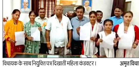
विधायक के साथ नियुक्ति पत्र दिखाती महिला कंडक्टर।