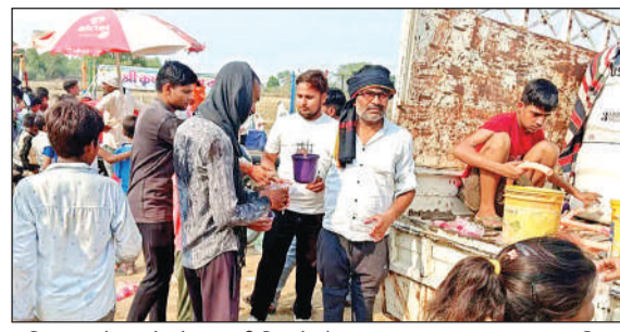
सुगिरा गांव में यज्ञ के दौरान पानी पिलाते लोग।