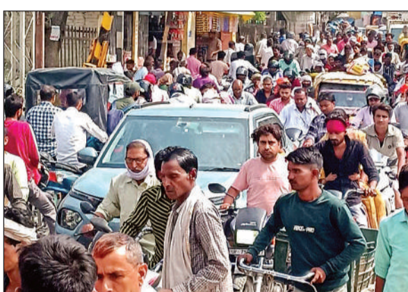
रेलवे क्रॉसिंग पर लगा जाम।