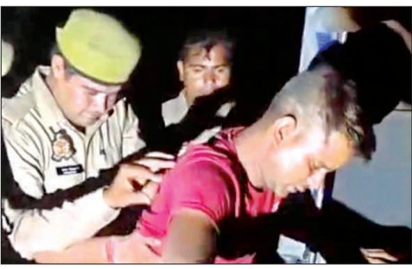
घायल बदमाशों को लेकर जाती पुलिस।