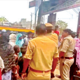
पालिका प्रशासन के विरुद्ध नारेबाजी करते लोग। अमृत विचार

प्रदर्शनकारियों ने आरोप लगाया कि क्षेत्र में तीन दिनों से बिजली की लगातार कटौती हो रही है, वहीं नगर पालिका की ओर से लगे ट्यूबवेल से भी पानी की आपूर्ति नहीं की जा रही है। इस कारण नहाने-पीने से लेकर दैनिक कार्यों तक में दिक्कत हो रही है। थाना फ्रेंड्स कॉलोनी और