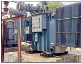
फुंका पड़ा ट्रांसफॉर्मर।

इस साल 45 डिग्री तापमान पहुंचने से जिले में गर्मी से लोगों का बुरा हाल है। लोग दिन-रात के कारण ट्रांसफॉर्मर फुंक गए हैं। जिससे भीषण गर्मी में लोगों का बुरा हाल है। हर साल गर्मी के मौसम में ओवर लोड होने के कारण ट्रांसफॉर्मर फुंक जाते हैं। लेकिन महकमे में आज क्षमता बढ़ाने के लिए कोई ध्यान नहीं दिया है।