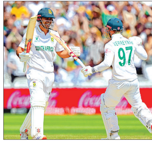
दक्षिण अफ्रीका के डेविड बेडिंघम (बाएं) और काइल वेरेन विजयी रन बनाने के बाद जश्न मनाते हुए।

गेंदबाजी : स्टार्क 14.4-1-66-3, हेजलवुड 19-2-58-1, कमिंस 17-0-59-1, लियोन 26-4-66-0, वेबस्टर 5-0-13-0, हेड 2-0-8-0