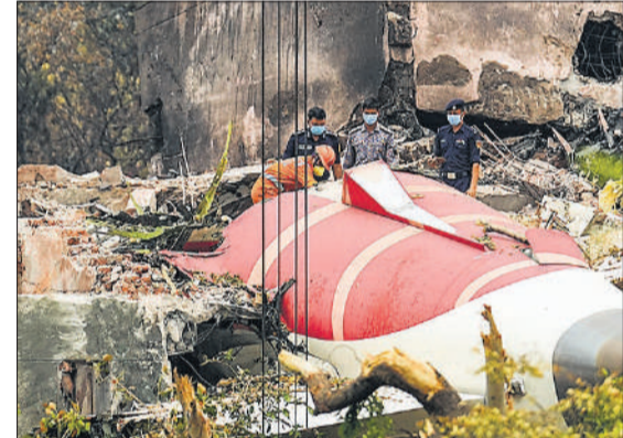
अहमदाबाद में विमान के मलबे की जांच करती टीम।

नागरिक उड्डयन मंत्री के राममोहन नायडू ने कहा कि विमानन नियामक नागर विमानन अहमदाबाद दुर्घटना (डीजीसीए) ने टाटा के स्वामित्व वाली विमान कंपनी के बोइंग 787 श्रृंखला के विमानों की विस्तारित निगरानी के आदेश दिए हैं। एअर इंडिया ने सोशल मीडिया मंच एक्स पर एक पोस्ट में कहा कि उसने अपने नौ बोइंग 787 ड्रीमलाइनर