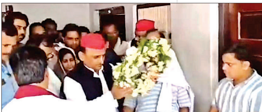
श्रद्धा सुमन अर्पित करते सपा मुखिया अखिलेश यादव।