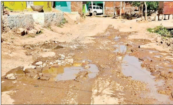
यह है सड़क का हाल।

सैकड़ों वाहनों का होता है आवागमन : मऊ महिला पुल को