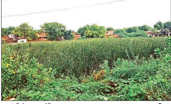
जलकुंभी से पटा पड़ा पौथिया का फूटा तालाब । अमृत विचार

अमृत विचार । पौथिया गांव में राट-हमीरपुर मार्ग के किनारे प्राचीन तालाब को फूटा तालाब के नाम से जाना जाता है । जनप्रतिनिधियों और अधिकारियों की अनदेखी से इसका अस्तित्व समाप्त होता जा रहा है । तालाब हमेशा गंदे पानी, गुंदला और जलकुंभी से पटा रहता है । तालाब का जीर्णोद्धार न होने से यह बेमकसद साबित हो रहा है । लोगों ने इसे अमृत सरोवर बनाने की मांग उठाई है । विकास खंड क्षेत्र के बड़ी आबादी वाले पौथिया गांव स्थित आशामाई मंदिर के समीप राट-हमीरपुर स्टेट तालाब जलकुंभी और गुंदला से पटा है । कुछ वर्षों पहले तक तालाब का