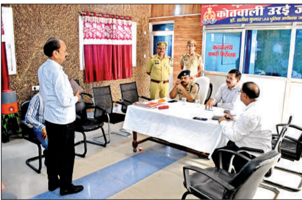
परियादी की समस्याएं सुनते अधिकारी।