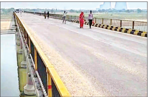
मरम्मत शुरू होने से पहले पुल पर निकलते इक्का-दुक्का लोग ।

48 घंटे तक पुल पर मरम्मत कार्य होगा । सोमवार से आवागमन चालू हो सकेगा ।