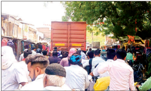
इस तरह रोजाना लगता है जाम।

मऊ के राष्ट्रीय राजमार्ग को यमुना रोड जोड़ती है, जो मुख्य चौराहे से ब्लॉक मार्केट होकर पंचायत भवन के बगल से निकलती है। रास्तों पर कौशांबी की ओर से आने वाले भारी वाहनों के चलते सड़क खस्ताहाल हो चुकी है। जानकारी के अनुसार, जिसका करीब साढ़े आठ करोड़ का टेंडर भी हो चुका है लेकिन अभी तक काम भी नहीं शुरू किया जा सका। आयेदिन वाहनों के पलटने या गिर जाने से सड़क हादसे होते