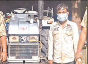
पकड़ा गया आरोपी युवक।