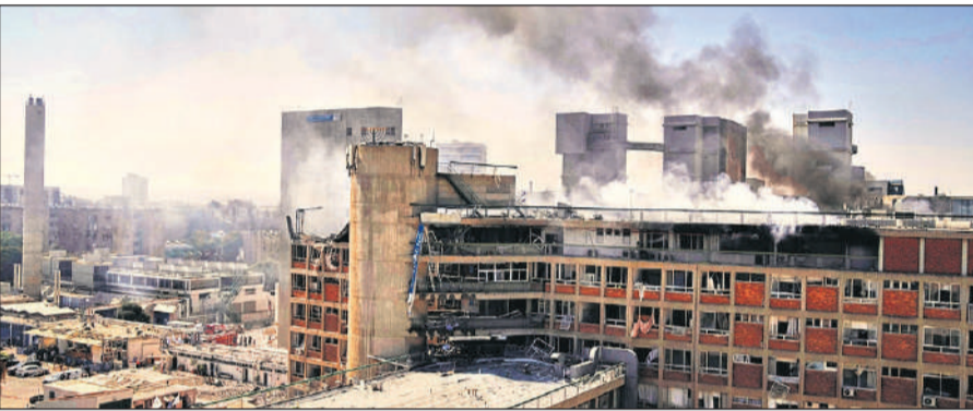
इजराइल के बीरशेबा में ईरान से दागी गई मिसाइल की चपेट में आने के बाद एक इमारत से उड़ता धुआं।

पाकिस्तान के सेना प्रमुख आसिम मुनीर ने अमेरिका में हुई मुलाकातों के दौरान क्षेत्रीय शांति व स्थिरता और नियमों पर आधारित अंतर्राष्ट्रीय व्यवस्था के प्रति प्रतिबद्धता जताई। पाकिस्तानी सेना की मीडिया शाखा इंटर सर्विस पब्लिक रिलेशंस ने एक बयान में कहा कि मुनीर ने अमेरिकी ट्रंप के साथ मुलाकात के बाद वाशिंगटन डीसी में वरिष्ठ स्कॉलर, विश्लेषकों, नीति विशेषज्ञों और प्रमुख अंतरराष्ट्रीय मीडिया संस्थानों के प्रतिनिधियों के साथ व्यापक वार्ता की। मुनीर अमेरिकी वैचारिक समूहों और सामरिक मामलों के संस्थानों के प्रतिनिधियों के साथ बातचीत से प्रमुख क्षेत्रीय व वैश्विक मुद्दों पर पाकिस्तान के सैद्धांतिक रुख को स्पष्ट करने व पाकिस्तान के सामरिक दृष्टिकोण को समझ को बढ़ाने का अवसर मिला।