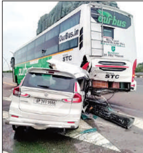
बस में घुसी कार।