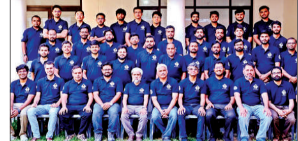
आईआईटी में मौजूद स्टाफ और छात्र।