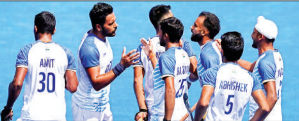
भारतीय हॉकी टीम।

1.2 और 2.3 से पराजय मिली जबकि अर्जेंटीना ने उसे 3.2 और 2.1 से और आस्ट्रेलिया ने 3.2 और 3.2 से हराया। ऐसा नहीं है कि भारतीय टीम ने यूरोप में अच्छा प्रदर्शन नहीं किया लेकिन आखिरी क्षणों में गोल गंवाने की आदत का उसे खामियाजा भुगतना पड़ा है।