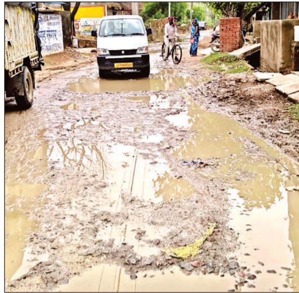
मैथा में हथिका रोड पर गुजरना आसान नहीं।