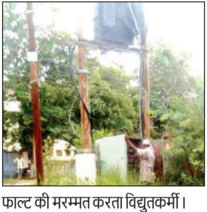
फाल्ट की मरम्मत करता विद्युतकर्मों।

अमृत विचार। गुरुवार को पहली मानसूनी बारिश ने जिले की विद्युत व्यवस्था को ध्वस्त कर दिया। अकबरपुर के आंबेडकर नगर वार्ड के शुक्ल तालाब मोहल्ले में फाल्ट से 22 घंटे बिजली गुल रही। वहीं रूरा कस्बा में भी पूरी रात बिजली न आने से करीब 20 हजार से अधिक आबादी बेहाल रही।