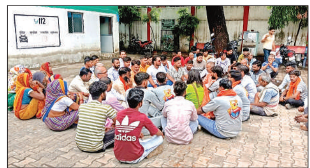
भोगनीपुर कोतवाली में हनुमान चालीसा पाठ करते विहिप व बजरंग दल पदाधिकारी।

● युवक और युवती को बरामद कर पूछताछ कर रही पुलिस