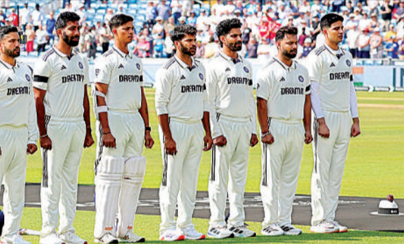
भारतीय खिलाड़ी टेस्ट मैच के पहले दिन खेल शुरू होने से पहले अपने राष्ट्रगान के लिए खड़े हुए।

लीड्स : भारत और इंग्लैंड के क्रिकेटरों और मैदानी अंपायरों ने यहां पहले टेस्ट से पूर्व अहमदाबाद में विमान दुर्घटना में मारे गए लोगों की स्मृति में एक मिनट का मौन रखा। 14 जून को एयर इंडिया की लंदन जाने वाली उड़ान के दुर्घटनाग्रस्त होने से 241 यात्री और चालक दल के सदस्यों की मौत हो गई थी। भारत के उपकप्तान ऋषभ पंत ने बुधवार को मीडिया से कहा था विमान (दुर्घटना) में जो कुछ हुआ, उससे पूरा भारत निराश है, लेकिन हम अपनी तरफ से सिर्फ यही कर सकते हैं कि हम भारत को फिर से कैसे खुश कर सकते हैं। नये कप्तान शुभमन गिल की अगुवाई में भारतीय टीम 2007 के बाद इंग्लैंड में पहली टेस्ट शृंखला जीतने की कोशिश में है।