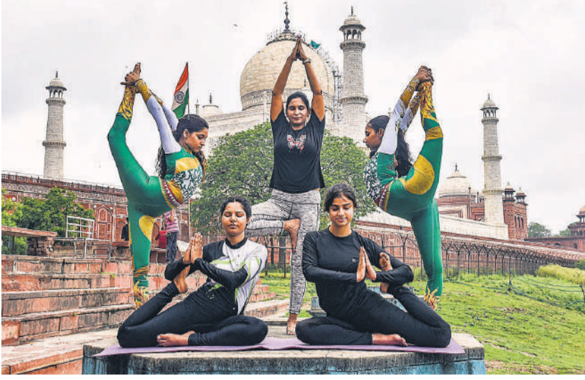
भारत के साथ-साथ दुनियाभर में शनिवार को अंतर्राष्ट्रीय योग दिवस धूमधाम से मनाया जाएगा। आगरा में शुक्रवार को ताजमहल के पीछे दशरा घाट पर योग करती महिलाएं।