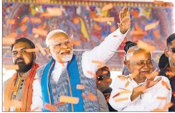
लोगों का अभिवादन करते प्रधानमंत्री मोदी, साथ में बिहार के मुख्यमंत्री नीतीश कुमार।

प्रधानमंत्री नरेन्द्र मोदी ने कहा कि भारत के विश्व की तीसरी सबसे बड़ी अर्थव्यवस्था के रूप में उभरने में बिहार की बड़ी भूमिका होगी। दुनिया भर की प्रगति से बहुत प्रभावित हैं। वे देख रहे हैं कि भारत दुनिया की तीसरी सबसे बड़ी अर्थव्यवस्था बन रहा है। इसमें बिहार निश्चित रूप से बड़ी भूमिका निभाएगा।