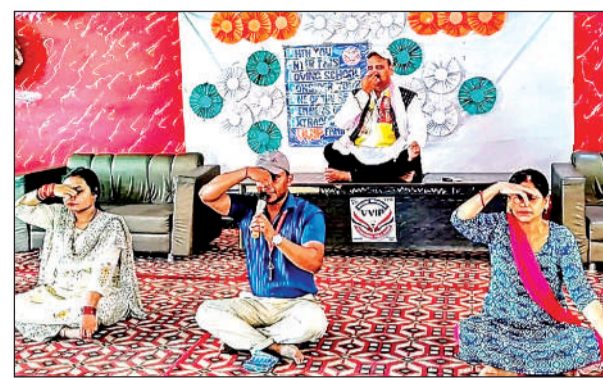
बच्चों को योग सिखाने प्रशिक्षक।