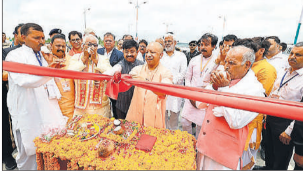
आजमगढ़ के सलारपुर में गोरखपुर लिंक एक्सप्रेस वे का लोकार्पण करते मुख्यमंत्री।

अमृत विचार : मुख्यमंत्री योगी आदित्यनाथ ने शुक्रवार आजमगढ़ और गोरखपुर दोनों तरफ से 7,283 करोड़ की लागत से बने 91.352 किलोमीटर गोरखपुर लिंक एक्सप्रेस-वे का लोकार्पण किया। इस मौके पर अपने संबोधन में पिछली सरकारों पर हमला करते हुए मुख्यमंत्री ने कहा कि वे विकास कार्य करने की बजाय डी-कंपनी (दाऊद गिरोह) के साथ साझेदारी करती थीं। कहा कि कभी पहचान के संकट से जूझने वाला आजमगढ़ जिला आज अदम्य साहस का गढ़ बन गया है। प्रदेश में आम आदमी की सुरक्षा के साथ खिलवाड़ करने वाले के लिए यमलोक का टिकट कट जाता है। लोकार्पण के बाद आजमगढ़ के सलारपुर, फूलपुर में जनसभा को संबोधित करते हुए योगी ने कहा