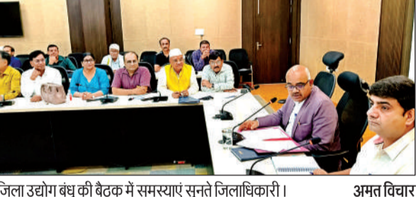
जिला उद्योग बंधु की बैठक में समस्याएं सुनते जिलाधिकारी। अमृत विचार

कानपुर। आईआईटी कानपुर के स्मार्ट मेटेरियल्स, स्ट्रक्चर्स और सिस्टम्स लैब के 25 साल पूरे होने पर कार्यक्रम आयोजित हुआ। समारोह में बताया गया कि 8 जून 2000 को स्थापित एसएमएसएस प्रयोगशाला ने विभिन्न परियोजना के ग्रॉट-इन-एड समर्थन से स्मार्ट मेटेरियल्स में उत्कृष्टता केंद्र के रूप में निरंतर विकास किया है। लैब को इसरो, एचएएल और गेल जैसी प्रमुख संस्थाओं ने भी इस प्रयोगशाला को वित्तीय सहायता दी है। यह लैब डिजाइन और रोबोटिक्स में लगातार बेहतर बनने की कोशिश करती रही है।