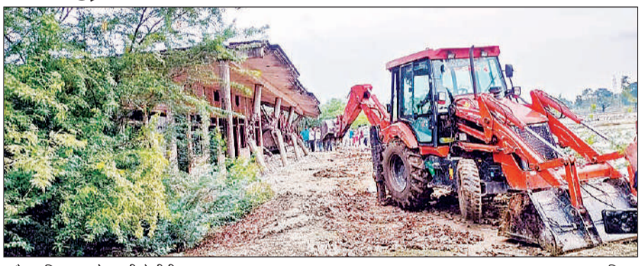
अवैध अतिक्रमण को हटाती जैसीबी।

अमृत विचार। गौरीगंज कोतवाली क्षेत्र के माधवपुर वार्ड नंबर 13 में चकमागं की भूमि पर किए गए अवैध कब्जे पर शुक्रवार को प्रशासन का बुलडोजर चला। दो दिन पहले इसी स्थान पर अतिक्रमण हटाने पहुंची राजस्व टीम और एसडीएम पर दबंगों ने हमला कर दिया था, जिसमें नायब तहसीलदार और लेखापाल घायल हो गए थे।