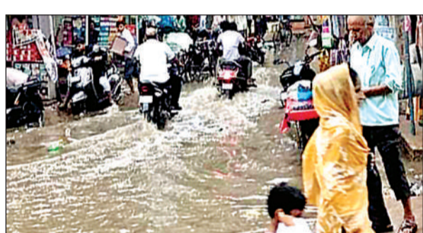
बारिश होने के बाद जलभराव से निकलते वाहन सवार।