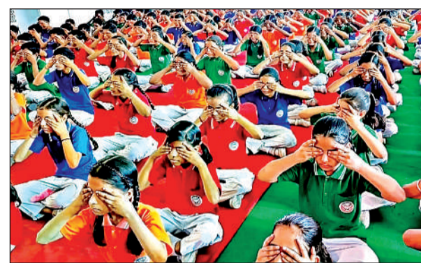
योग करते बच्चे।