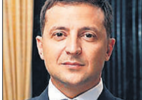
सोलोमिंस्की जिले में स्थित इमारत का दौरा किया और वहां हमले में मारे गए लोगों को श्रद्धांजलि अर्पित की। जेलेंस्की ने कहा यह हमला दुनिया को यह दिखाता है कि कि रूस युद्धविराम को स्वीकार नहीं करता और हत्या का विकल्प चुनता है। उन्होंने साथ ही रूस पर दबाव डालने के लिए तैयार यूक्रेन के सहयोगियों का आभार व्यक्त किया। जेलेंस्की ने कहा कि रूस ने 440 से अधिक ड्रोन और 32 मिसाइलें दागीं

इस हमले में 28 लोग मारे गए और 142 अन्य घायल हो गए। जेलेंस्की ने राष्ट्रपति कार्यालय के प्रमुख ऑटेंडें यरमक और आंतरिक मंत्री इगोर के साथ गुरुवार सुबह कीव के