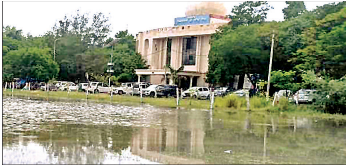
शुक्रवार को झमाझम बरसात से कलेक्ट्रेट के मैदान भर भर गया पानी।