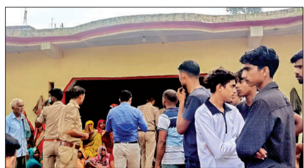
घर के बाहर मौजूद पुलिस बल व परिजन।