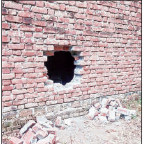
चोरों द्वारा लगाई गई सैध।

अमृत विचार। पेस्ट्रीसाइड व्यापारी के घर अज्ञात चोरों ने रात्रि नकब लगाकर पांच लाख के आभूषण सहित दो लाख की नगदी चोरी कर ले गए। पुलिस व फॉरेंसिक टीम ने मौके पर पहुंचकर जांच पड़ताल की।