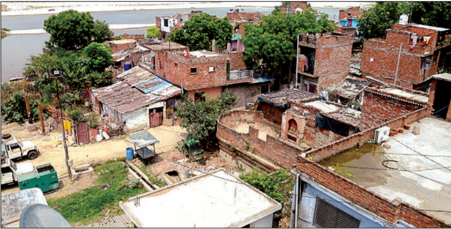
रानी घाट पर गंगा नदी के किनारे बने मकान।

अमृत विचार। एनजीटी और सुप्रीम कोर्ट की रोक के बावजूद गंगा व पांडु नदी के पास बेधड़क अवैध निर्माण जारी हैं। नदियों के पास अवैध कॉलोनाइजर्स प्लांटिंग काटकर बेच रहे हैं। केडीए ने ऐसे 71 से अधिक निर्माण कर्ताओं (बिल्डर्स) को चिह्नित किया है, लेकिन इनपर कोई कार्रवाई न होने की वजह से पुराने के साथ नये कॉलोनाइजर्स के हौसले और बढ़ गये हैं। गंगा नदी के पास कटरी, ख्योरा, बनीयापुर, हिंदूपुर, धरपुर, प्रतापपुर हरी, चिरान गांव, गंगापुर केडीए ग्रीन के पीछे, हिंदूपुर डल्लापुर बिदूर, सिंहपुर कछार, रानी घाट और पांडु नदी में महेरबानसिंह का पुरवा, वरुण विहार, बरां के मोहल्लों में निचले इलाकों में सोसायटी का निर्माण जारी है। बरसात में कई क्षेत्र डूबने के मुहाने पर खड़े हो जायेंगे।