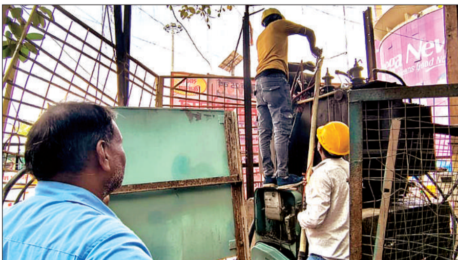
बिजली मरम्मत का कार्य करता केस्को कर्मी।

शहर में गुरुवार शाम पांच बजे से बारिश शुरू हुई तो रात 1 बजे तक जारी रही। इससे बिजली व्यवस्था लड़खड़ा गई। किदवाई नगर साइड नंबर एक, छवनी परिषद स्टॉफ कॉलोनी, गोलाघाट, 56 कैट नवशील अपार्टमेंट, फेथफूलगंज, रेलबाजार, रमईपुर व बाजपुर में बिजली 24 घंटे तक गुल रही। इसके अलावा पीरोड, गांधी नगर, सीसामऊ, नई सड़क परेड, उर्सला अस्पताल कैपस, दर्शनपुरवा, गुमटी नंबर पांच, ओमपुरवा, नवीन नगर, काकादेवी, शिव नगर, चकेरी, शास्त्री नगर, परदेमनपुर, पोखरपुर, कल्याणपुर, मूलगंज, बाबूपुरवा,