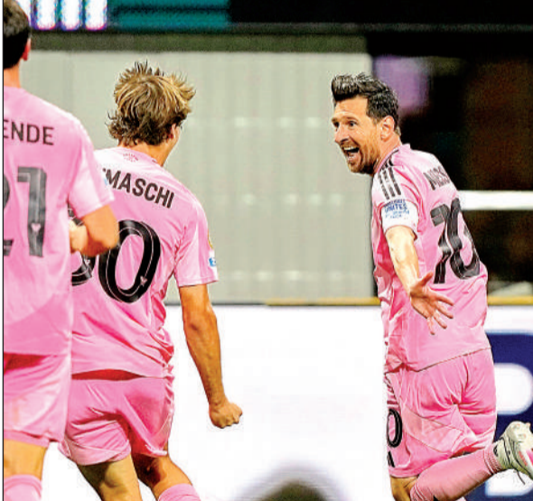
इंटर मियामी के लियोनेल मेस्सी (दाएं) अटलांटा में इंटर मियामी और एफसी पोर्टो के बीच वलब विश्व कप ग्रुप ए फुटबॉल मैच में दूसरा गोल करने के बाद जश्न मनाते हुए।

लीड्स : भारत और इंग्लैंड के क्रिकेटरों और मैदानी अंपायरों ने यहां पहले टेस्ट से पूर्व अहमदाबाद में विमान दुर्घटना में मारे गए लोगों की स्मृति में एक मिनट का मौन रखा। 14 जून को एयर इंडिया की लंदन जाने वाली उड़ान के दुर्घटनाग्रस्त होने से 241 यात्री और चालक दल के सदस्यों की मौत हो गई थी। भारत के उपकप्तान ऋषभ पंत ने बुधवार को मीडिया से कहा था विमान (दुर्घटना) में जो कुछ हुआ, उससे पूरा भारत निराश है, लेकिन हम अपनी तरफ से सिर्फ यही कर सकते हैं कि हम भारत को फिर से कैसे खुश कर सकते हैं। नये कप्तान शुभमन गिल की अगुवाई में भारतीय टीम 2007 के बाद इंग्लैंड में पहली टेस्ट शृंखला जीतने की कोशिश में है।