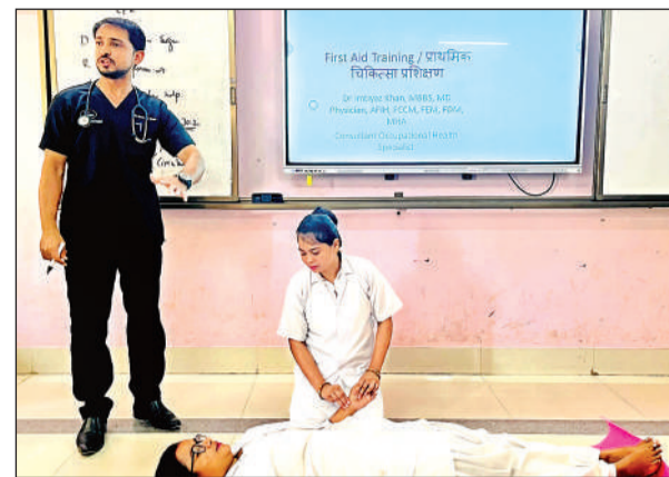
डेमो के दौरान सीपीआर देने के बाद जांच करती नर्स।