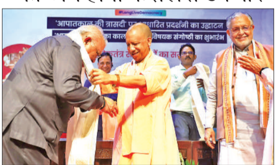
लोकतंत्र सेनानियों का सम्मान करते मुख्यमंत्री योगी आदित्यनाथ।