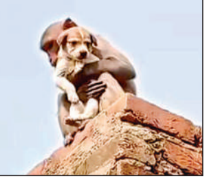
पिल्ले को गोदी में लेकर छत पर बैठा बंदर।