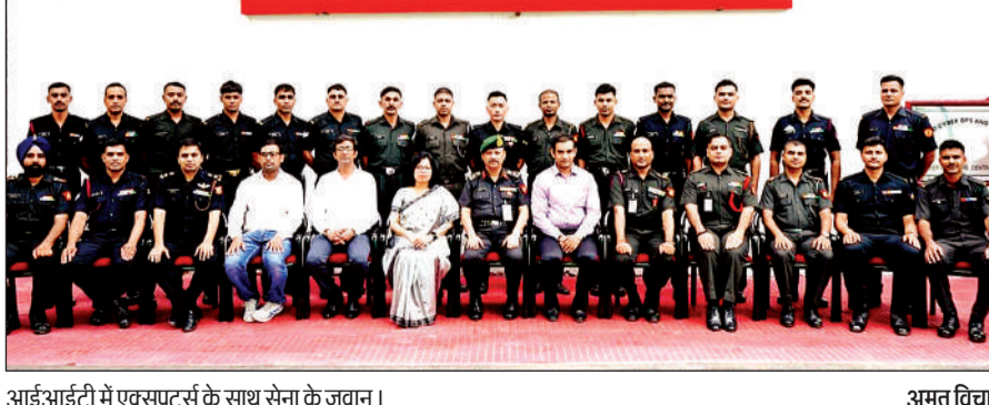
आईआईटी में एक्सपर्ट्स के साथ सेना के जवान। अमृत विचार