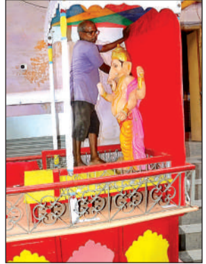
सज रहा रथ।