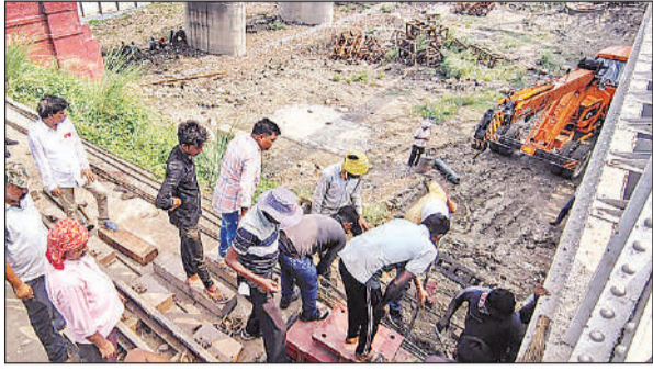
काम के दौरान मौजूद रेलवे के अधिकारी और कर्मचारी।