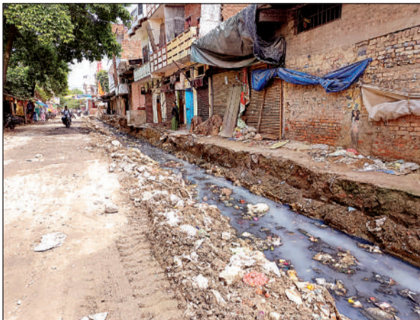
शारदानगर सब्जी मंडी में नाला तोड़ दिया है।