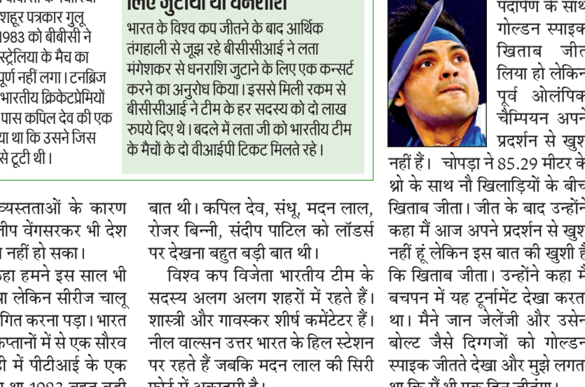
लता मंगेशकर बीसीसीआई के लिए जुटाया था धनराशि

भारत के विश्व कप जीतने के बाद आर्थिक तंगहाली से जूझ रहे बीसीसीआई ने लता मंगेशकर से धनराशि जुटाने के लिए एक कन्सर्ट करने का अनुरोध किया। इससे मिली रकम से बीसीसीआई ने टीम के हर सदस्य को दो लाख रुपये दिए थे। बदले में लता जी को भारतीय टीम के मैचों के दो वीआईपी टिकट मिलते रहे।