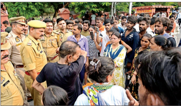
पुलिस ने परिजनों को समझाकर शांत कराया।