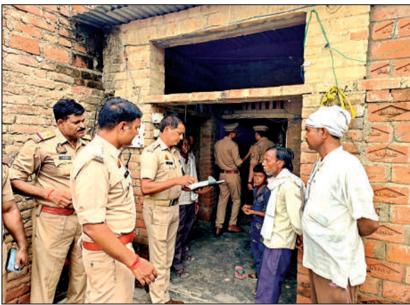
मामले की जांच करती पुलिस।