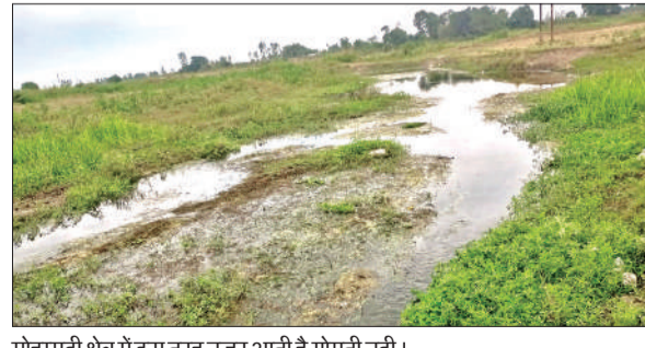
मोहम्मदी क्षेत्र में इस तरह नहर आती है गोमती नदी।

अमृत विचार : देश में नदियों को बचाने, उनकी अविरलता को कायम रखने के लिए समय-समय पर तमाम अभियान चलाए जाते रहे हैं, लेकिन इन सबके बीच आदि गंगा के नाम से प्रसिद्ध पौराणिक नदी गोमती लखीमपुर में आज भी अपने अस्तित्व को तलाश रही है। गोमती की अविरल जलधारा के लिए भी लोग आगे आए, अभियान चले, लेकिन इस नदी का कायाकल्प नहीं हो सका। जिले में बरवर (मोहम्मदी क्षेत्र) से गुजरती नदी में घाटा जलस्तर, व्याप्त गंदगी, जनता, जनप्रतिनिधि और प्रशासनिक अनेदखी भारी पड़ रही