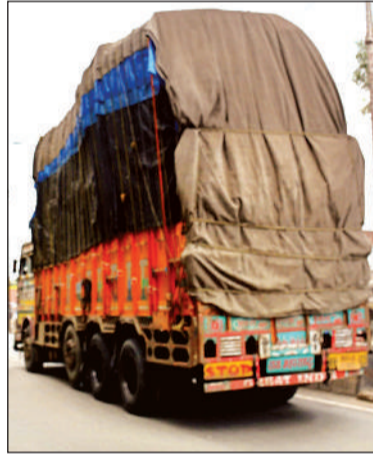
हाईवे पर दौड़ रहे बिना नंबर वाले ट्रक।