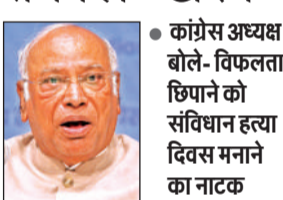
● कांग्रेस अध्यक्ष बोले- विफलता छिपाने को संविधान हत्या दिवस मनाने का नाटक

कांग्रेस अध्यक्ष मल्लिकार्जुन खरगे ने बुधवार को आपातकाल की 50वीं बरसी पर प्रधानमंत्री नरेन्द्र मोदी के हमले को लेकर उन पर पलटवार किया और आरोप लगाया कि पिछले 11 साल से देश में अघोषित आपातकाल है तथा भाजपा मोदी सरकार की विफलताओं को छिपाने के लिए 'संविधान हत्या दिवस' मनाने का नाटक कर रही है। उन्होंने महाराष्ट्र विस चुनाव का हवाला देते हुए दावा किया कि निर्वाचन आयोग मोदी सरकार को कठपुतली बन गया है। राज्यसभा में नेता प्रतिपक्ष ने यह भी कहा कि प्रधानमंत्री मोदी के कारण ही आज संविधान संकट में है। खरगे ने कहा,