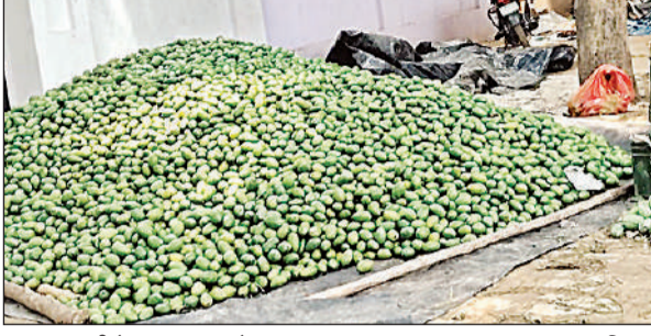
हसनगंज मंडी में लगा आम का ढेर।

बता दें आम फल पट्टी हसनगंज की मंडियों में इस समय आम की भरमार है। एक से बढ़कर एक आम की किस्में मंडी की शोभा बढ़ा रही हैं। हसनगंज क्षेत्र में मियागंज व फरहदपुर दो मंडियां संचालित हैं। इनसे देश के कोने कोने से लेकर विदेशों तक आम भेजा जाता है। यहां मुंबई, दिल्ली, कलकत्ता, बनारस, पंजाब, चंडीगढ़, हरियाणा, मध्यप्रदेश आदि जिलों से महीनों पहले व्यापारी आकर डेरा जमा लेते हैं और आम की खरीदारी कर इसका निर्यात करते हैं। रोज सैकड़ों टन आम का इन मंडियों से निर्यात होता है। बारिश होने के बाद आम का स्वाद भी बढ़ गया है और इसके दामों में भी कमी आई है। हालांकि भारी पैदावार व विक्री से किसानों व व्यापारियों के चेहरे पर चमक देखी जा सकती है। इस समय दशहरी के साथ चौसा, लखनौआ व लंगड़ा के अलावा आम की अन्य प्रमुख प्रजातियां मंडी में अपना वर्चस्व कायम किये हैं।