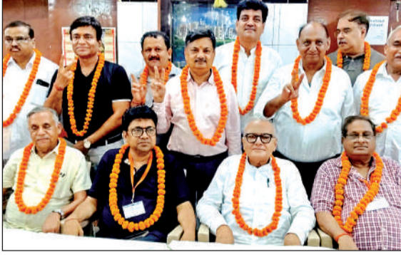
यूपी किराना सेवा समिति के नुने सदस्य। अमृत विचार

कानपुर। प्रदेश सरकार ने सामूहिक विवाह में फर्जीवाड़ा रोकने के लिए बायोमेट्रिक अटेंडेंस फार्मूला लागू करने का फैसला किया है। इससे आवेदन करने वाले का सही फर्जीवाड़ा नहीं कर पाएगा। सरकार द्वारा मध्यम व गरीब वर्ग की बेटियों के विवाह के लिए सामूहिक विवाह की योजना लागू की है लेकिन जिन्हें इसका लाभ मिलना चाहिए, उनके बजाय हेराफेरी करने वाले तमाम लोग इसका लाभ लेने लगे। कई बार ऐसे मामले पकड़े जा चुके हैं। इसलिए अब बायोमेट्रिक अटेंडेंस से वर-वधू का मिलान कराया जाएगा। इससे दोनों का पूरा ब्यौरा निकलकर सामने आ जाएगा जिससे न तो कोई अपनी आयु छुपा सकेगा और न ही अपना नाम, पता गलत दर्ज करा पाएगा। शादी अनुदान का भी लाभ लेने वालों को झटका लगेगा।