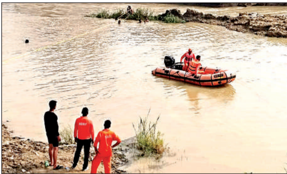
सेंगुर नदी में डूबे युवक की तलाश करती एनडीआरएफ की टीम।

● सेंगुर नदी के चेकडैम में नहाने वक्त डूबा था फतेपुर का युवक