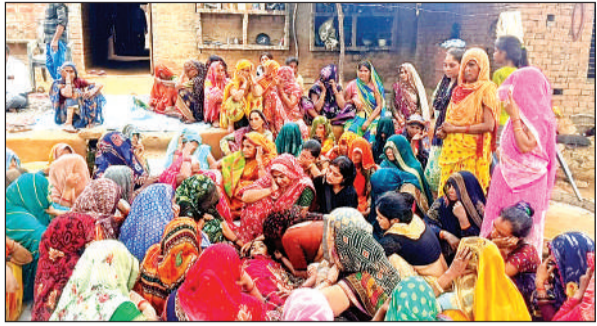
किशोरी की मौत पर रोती-बिलखती परिवार की महिलाएं।

● सांस की आस में परिजन ले गए मध्य प्रदेश के रतनगढ़