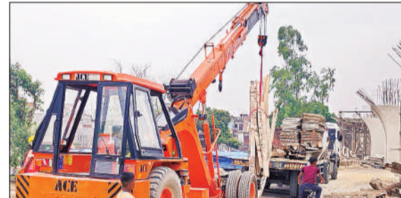
आरओबी स्थल पर क्रैन से हटाई जाती निर्माण सामग्री।