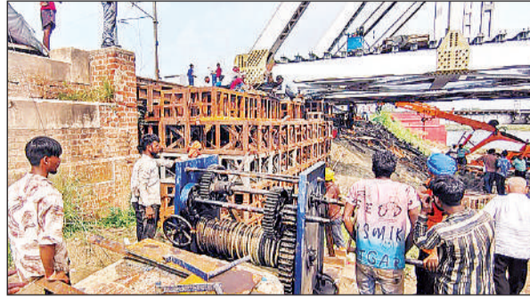
छमकनाली 109 पुलिया की शिपिंग का होगा कार्य।

मिशन रफ्तार के तहत छमकनाली 109 पुलिया का बदला गया स्ट्रक्चर