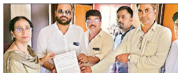
खंड शिक्षाधिकारी को ज्ञापन देते शिक्षक।

बता दें कि एक जुलाई से बच्चों की कक्षाएं प्रारंभ हो जाएंगी। इसके पूर्व ही विलय का कार्य पूर्ण होना चाहिए, ताकि बच्चों को किसी तरह की परेशानी का सामना न करना पड़े। हालांकि इस आदेश के विरोध में शिक्षकों व ग्रामीणों ने