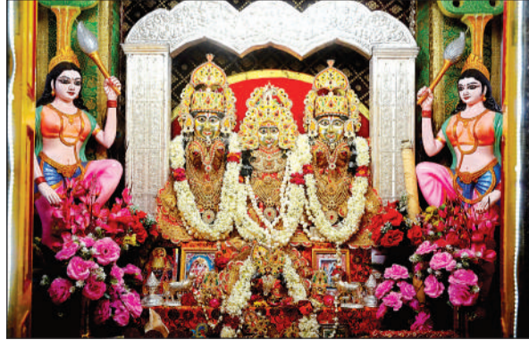
प्रभु का सुंदर श्रृंगार किया गया।