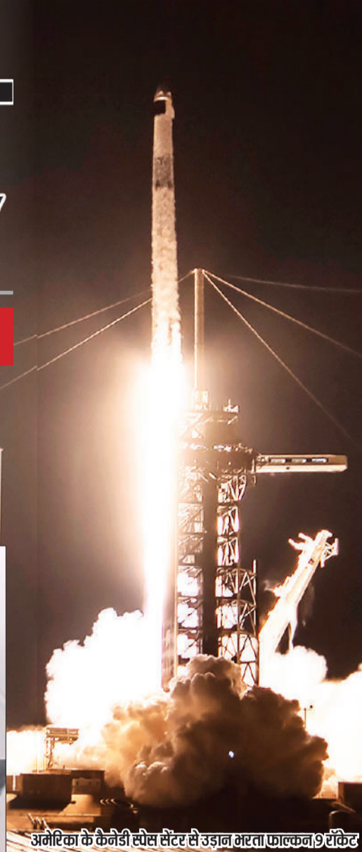
अमेरिका के केनेडी स्पेस सेंटर से उड़ान भरता फाल्कन-9 रॉकेट

यात्रियों ने अपने नए कैप्सूल का नाम 'ग्रेस' बताया। अंतरिक्ष यात्री अंतर्राष्ट्रीय अंतरिक्ष स्टेशन में 14 दिन बिताएंगे और अपने मिशन के दौरान 60 प्रयोग करेंगे।