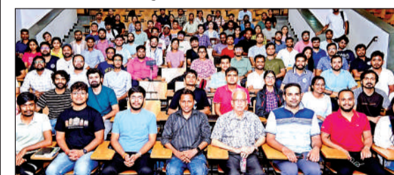
आईआईटी में कार्यशाला में मौजूद एक्सपर्ट व स्टूडेंट।