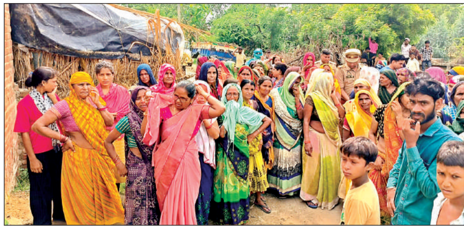
हत्या के बाद मौके पर जमा भीड़।