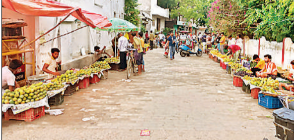
शहर में लगी आम मंडी में खरीदारी करते लोग।