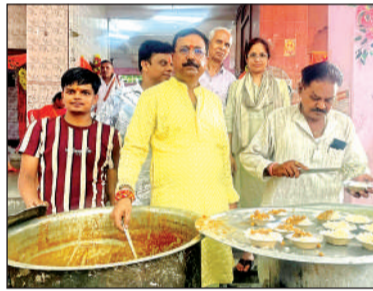
बालाजी सेवा समिति ने भंडारा किया।