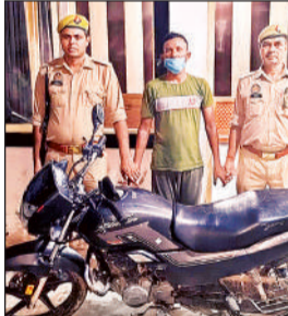
पुलिस गिरफ्त में इनामी शातिर चोर।