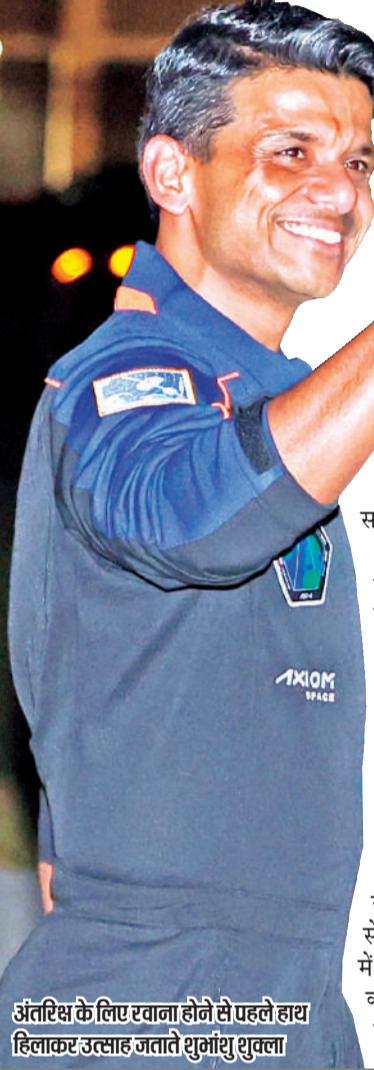
नई दिल्ली, एजेंसी