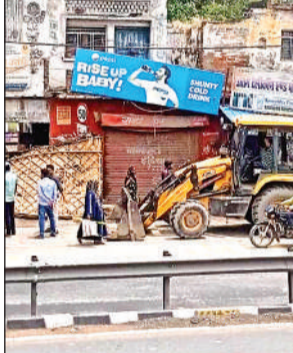
रनियां में अवैध अतिक्रमण को दहाता बुलडोजर।

कानपुर-इटावा व झांसी को जोड़ने वाला नेशनल हाईवे रनियां नगर पंचायत से होकर गुजरता है। हाईवे के दोनों ओर घनी आबादी है और हर रोज हजारों लोगों का आवागमन होता है। दुकानों के अतिक्रमण के कारण हाईवे पर रास्ता संकरा हो गया है और दिन जाम लगता है। वहीं ओवरब्रिज न होने के चलते हाईवे पर करते समय हादसे होने से कई लोगों की मौत भी हो चुकी है। जिसके चलते