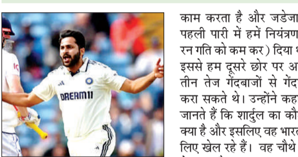
शार्दुल ठाकुर।

पूर्व भारतीय कप्तान दिलीप वेंगसरकर ने 'पीटीआई' से कहा कुलदीप को टीम में होना चाहिए। चार तेज गेंदबाजों के साथ खेलने का कोई मतलब नहीं है। शार्दुल या प्रसिद्ध में से कोई भी उनके लिए जगह बना सकता है। इंग्लैंड में टीम अक्सर चार तेज गेंदबाजों के साथ मैदान पर उतरते रहते हैं लेकिन मौजूदा