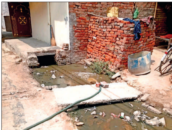
बिनगांवा का कच्चा नाला मुसीबत बना है।

शहर में ऐसे कई नाले हैं जो क्षतिग्रस्त हो गए हैं और उनमें न तो दीवार बनाई गई है और न ही उन्हें ढका गया है।