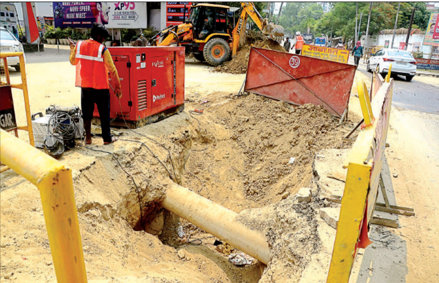
तिलकनगर में खुदी पड़ी सड़क।

बैठक में नहरों की सफाई न होने और अवैध बस्तियों की वजह से मकड़ीखेड़ा क्षेत्र जलभराव का मुद्दा भी उठा। नगर स्वास्थ्य अधिकारी