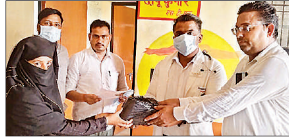
महिला को पोषण पोटेली देते सीएचसी प्रभारी व अन्य।