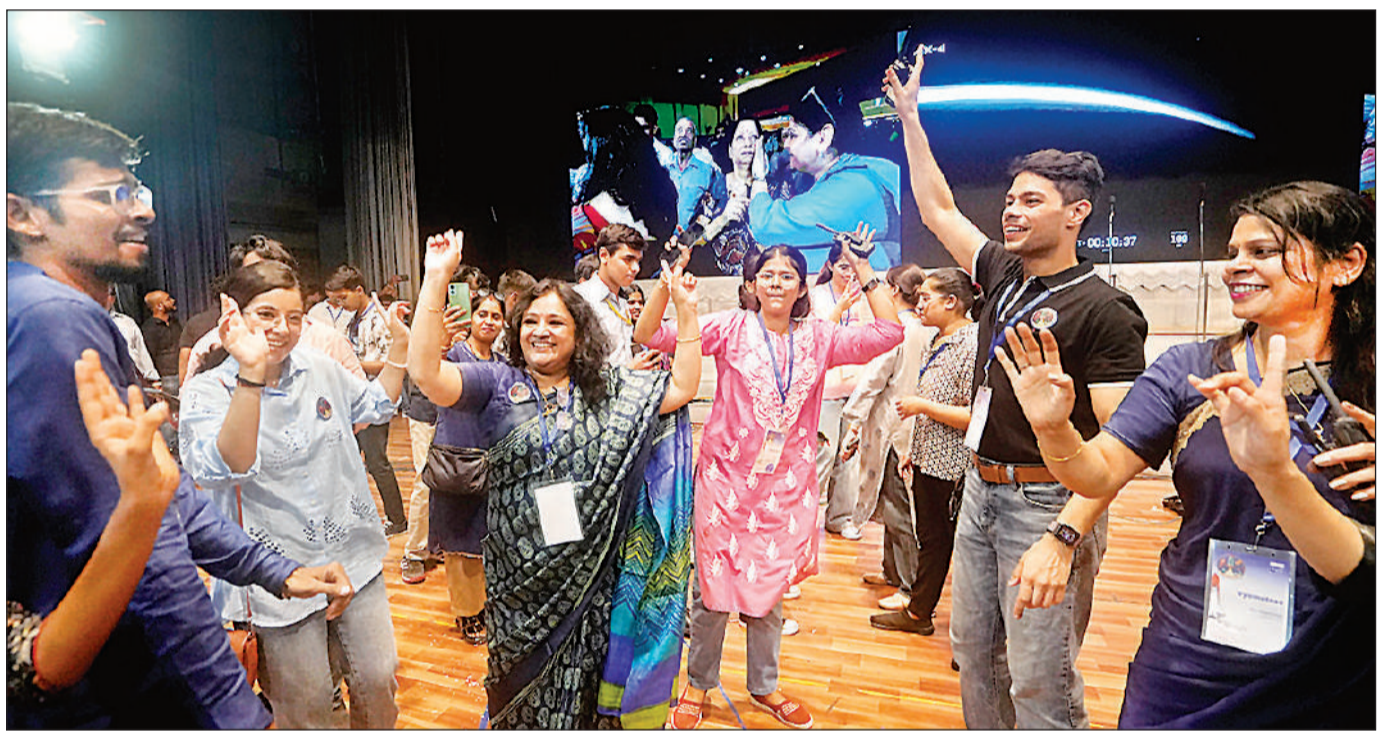
स्पेश शटल ने जैसे ही अंतरिक्ष के लिए उड़ान भरी, लखनऊ के सीएमएस में सीधा प्रसारण देख रहे लोग मारे खुशी थिरकने लगे।

नमस्कार। मेरे प्यारे देशवासियों, क्या यात्रा है। हम 41 साल बाद एक बार फिर अंतरिक्ष में वापस आए हैं। यह एक अद्भुत सवारी है। हम 7.5 किलोमीटर प्रति सेकंड की गति से पृथ्वी के चारों ओर घूम रहे हैं। मेरे कंधों पर उभरा हुआ तिरंगा मुझे बताता है कि मैं आप सभी के साथ हूँ। मेरी यह यात्रा अंतर्राष्ट्रीय अंतरिक्ष स्टेशन (आईएसएस) की शुरुआत नहीं है, बल्कि भारत के मानव अंतरिक्ष कार्यक्रम की शुरुआत है। मैं चाहता हूँ कि आप सभी इसका हिस्सा बनें। इस यात्रा पर आपका सीना भी गर्व से चौड़ा हो जाना चाहिए... आइए, मिलकर भारत के मानव अंतरिक्ष कार्यक्रम की शुरुआत करें। लखनऊ के शुभांशु ने जब यह संदेश भेजा तो उसे पढ़कर/देखकर मौजूद राजधानीवासी गर्व से अभिभूत हो गए। शुभांशु के अंतरिक्ष में रवाना होते ही समूचा सीएमएस कंपाउंड भारत माता की जय और वंदेमातरम का जयघोष गूँज उठा। शुभांशु ने सीएमएस से शिक्षा पाई है।