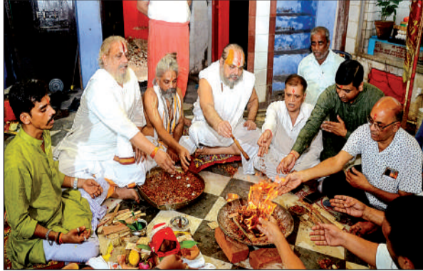
हवन करते महंत और भक्त।