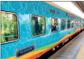
वीआईपी ट्रेन में चूहे की उछलकूद से तारों में शार्ट सर्किट हुआ

अमृत विचार। भाऊपुर के पास वीआईपी ट्रेन हमसफर एक्सप्रेस में एसी कोच में तारों में शार्ट सर्किट से एसी कोच में धुआं भर गया। फायर अलार्म बजने लगा जिससे यात्रियों में अफरातफरी मच गई। कानपुर सेंट्रल स्टेशन पर इंजीनियरों ने मरम्मत की, तब ट्रेन को आगे रवाना किया गया। दिल्ली से कटिहार जा रही गाड़ी संख्या 15706 हमसफर एक्सप्रेस मंगलवार की शाम 4.45 बजे कटिहार के लिए रवाना हुई थी। इस गाड़ी के एसी कोच बी-8 के एसी पैनल में एक चूहा घुस गया। देर रात जब ये ट्रेन भाऊपुर क्रास कर