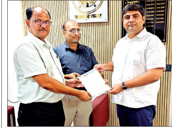
उपायुक्त उद्योग को ज्ञापन देते उद्यमी।