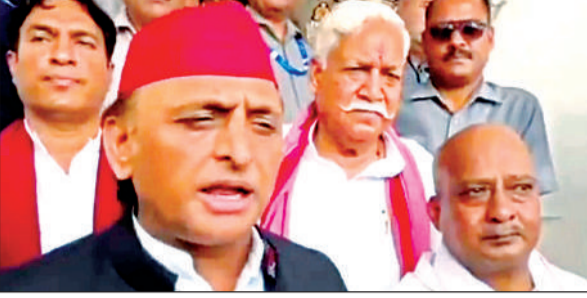
पत्रकारों से वार्ता करते सपा मुखिया अखिलेश यादव

शहर के बीवीगंज स्थित गोस्ट हाउस में बुधवार को तेरहवीं के कार्यक्रम में शिरकत करने आए समाजवादी पार्टी के मुखिया एवं पूर्व मुख्यमंत्री अखिलेश यादव ने पत्रकारों से वार्ता के दौरान भाजपा के इमरजेंसी कार्यक्रम पर तंज