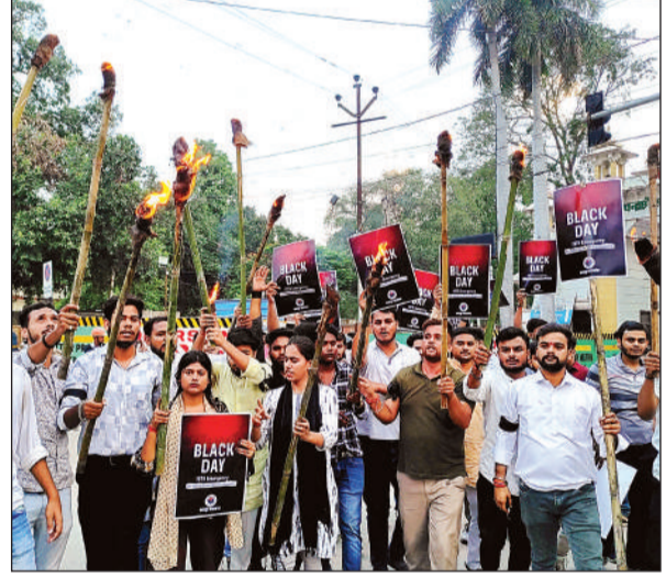
कंपनीबाग चौराहे से जुलूस निकालते छात्र-छात्राएं।

को बंद कराकर खानापूरी कर दी। बताते चलें कि घाटमपुर मार्ग पर प्रतिदिन लगभग 1 लाख डंपर व ट्रक दौड़ रहे हैं जिसमें 60 प्रतिशत ऐसे वाहन हैं जिनमें नंबर प्लेट नहीं होती है लेकिन पांच मिनट अभियान चला आरटीओ खानापूरी करके अभियान खत्म कर देता है।