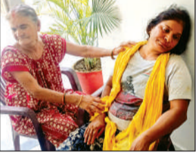
पत्नी बेसुध हो गई।