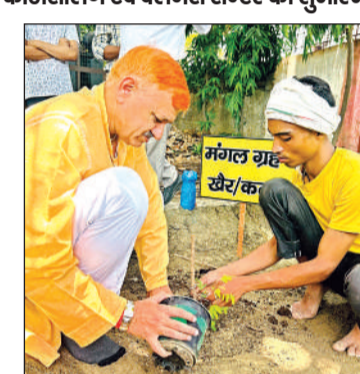
पार्क में पौधरोपण किया गया।

कानपुर। शिक्षा संस्कृति उद्यान न्यास कानपुर प्रांत द्वारा मंगलवार को आरएसपुरम सर्वोदय नगर स्थित एक पार्क को गीत लेते हुए उसको ईको पार्क के तौर पर सुसज्जित करते हुए उसका शुभारंभ किया। इस पार्क को कबाड़ की वस्तुओं से सज्जाया और संवारा गया। शुभारंभ के मौके पर यहां नव गृहों से संबंधित पौधों को रोपित करते हुए नवग्रह वाटिका लगाई गई। इसके बाद गीतानगर स्थित हरि