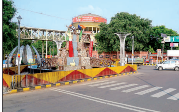
नानाराव पार्क तिराहा पर लगेगी नानाराव पेशवा की प्रतिमा।