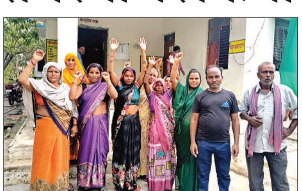
शंभुआ सबस्टेशन पर प्रदर्शन करती महिलाएं।

अमृत विचार। बिधनू शंभुआ के श्यामनगर बस्ती में बीते एक सप्ताह से बिजली आपूर्ति टप है। पहले बिजली का पोल टूटा फिर ट्रांसफार्मर फुंक गया। समस्या लेकर पहुंचे उपभोगताओं को निस्तारण की जगह सबस्टेशन से टरका दिया गया। जिससे नाराज दो दर्जन से अधिक महिलाएं बुधवार को शंभुआ सबस्टेशन पहुंचीं और जमकर हंगामा करते हुए नारेबाजी की। एक घंटे प्रदर्शन के बाद अधिकारियों ने 24 घंटे के अंदर निस्तारण का भरोसा दिलाया।