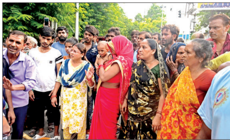
शव लेकर सड़क पर जाम लगाए परिजन।