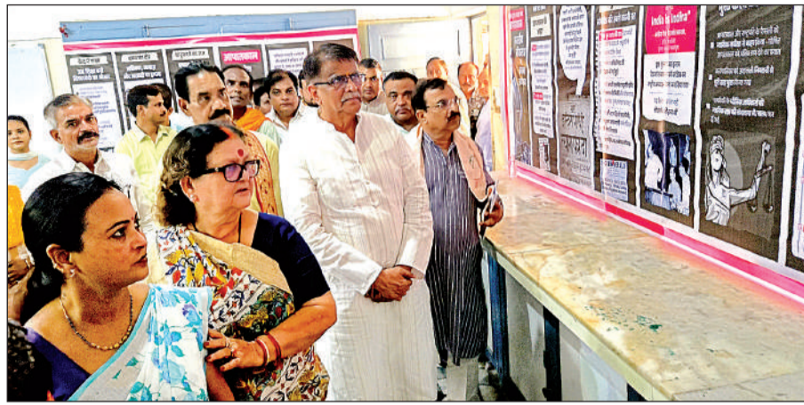
आपातकाल दिवस पर आयोजित प्रदर्शनी देखते भाजपा के राष्ट्रीय मंत्री ओमप्रकाश धनखड़।

आपातकाल दिवस पर भाजपा के राष्ट्रीय मंत्री ओमप्रकाश धनखड़ ने कहा, बीएनएसडी में प्रदर्शनी देखी