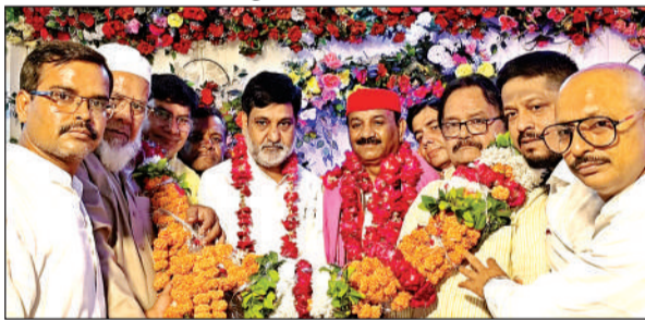
गंगापुल पर सपा के प्रदेश अध्यक्ष का स्वागत करते सपाईं।

बुधवार शाम सपा प्रदेश अध्यक्ष का पार्टी कार्यकर्ताओं ने जाजमऊ गंगापुल पर जोरदार स्वागत किया। प्रदेश अध्यक्ष ने आरोप लगाया कि पीडीएम मिशन अभियान की सफलता को देखकर भाजपा पीडीएम पर अत्याचार कर