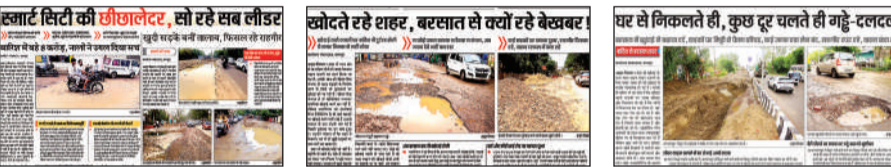
सड़कों की खोदाई से परेशानी पर अमृत विचार ने चलाया था अभियान।