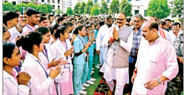
कार्यक्रम में मुख्य अतिथि के रूप में पहुंचे डिप्टी सीएम ब्रजेश पाठक।

उन्होंने कहा कि देशवासियों पर अत्याचार करने वाली कांग्रेस को देश की जनता कभी माफ नहीं