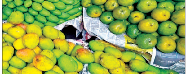
दुकान में बिंदी के लिए रखे आम।

● विषैले तत्वों से सबसे ज्यादा लिावर पर पड़ता प्रभाव