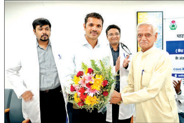
चिकित्सकों के साथ बुजुर्ग।