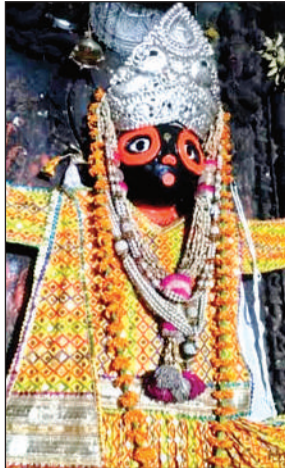
प्रभु जगन्नाथ जी की प्रतिमा।

आज शाम 4 बजे प्रभु बलभद्र माता सुभद्रा तथा भगवान जगन्नाथ मंदिर से रथ में विराजेगे और पूजा आरती के साथ भगवान जगन्नाथ जी की रथयात्रा भक्तों के साथ लगभग 6 बजे कल्याणपुर बैरी स्थित दुर्गा मंदिर में पहुंच कर पूर्ण होगी। भगवान जगन्नाथ जी बैरी स्थित दुर्गापुर मंदिर में 5 जुलाई की शाम तक रहेंगे। 5 जुलाई की शाम 4 बजे पुनः सभी भगवान रथ में विराजेगे और पूजा अर्चना के बाद रथ यात्रा प्रारम्भ होगी और पुनः जगन्नाथ मंदिर पहुंचेगी। रथ यात्रा मंदिर पहुंचने के बाद भगवान जगन्नाथ रथ से ही भक्तों को दर्शन देंगे। 8 जुलाई को भगवान जगन्नाथ अपने मंदिर में विराजेगे।