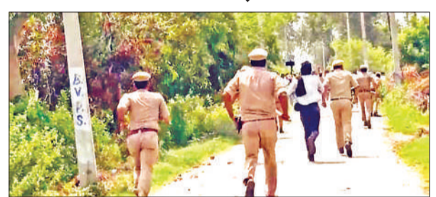
इटावा में उपद्रव कर रहे युवकों को खदेड़ती पुलिस।

क्षेत्र के दांदरपुर में यादव विपरीत के भागवताचार्यों के साथ हुई बदसलूकी का मामला गहराता जा रहा है। बुधवार की देर रात दो