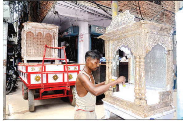
महाप्रभु के लिए तैयार किया जा रहा सिंहासन।

बिरजी भगत मंदिर में होगा प्रभु का चंद्रन से श्रृंगार और सजाया जाएगा फूल बंगला