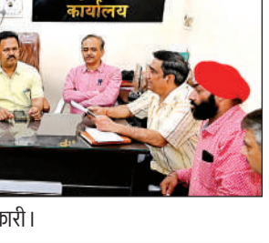
बैठक में कारोबारियों की समस्या सुनते अधिकारी।