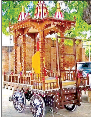
इसी रथ में विराजेगे प्रभु जगन्नाथ जी।