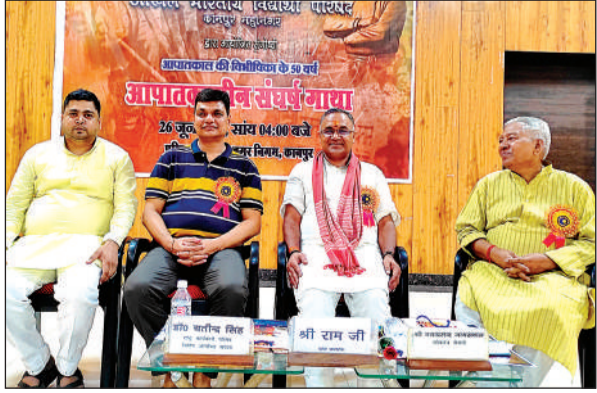
कार्यक्रम के दौरान मंच पर मौजूद अतिथि।

वहां पर मौजूद लोगों को संबोधित करते हुए उन्होंने बताया कि आपातकाल की संघर्ष गाथा आज की युवा तरुणाई को जानना चाहिये। आपातकाल की संघर्ष गाथा को उस समय के लोगों के मुखावर बिंदु से सुनकर हम सभी के अंदर राष्ट्रभक्ति के संचार के साथ साथ नई ऊर्जा और राष्ट्रीय