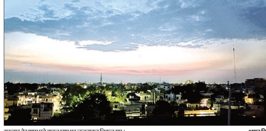
गुरुवार देर शाम घने बादल छाए पर ललचाकर निकल गए। अमृत विचार

बरामद हुए। चोरी की रकम से ही उसने आई फोन खरीदा था, जिसे भी पुलिस ने बरामद किया है। www.amritvichar.com पर भी खबरें पढ़ें