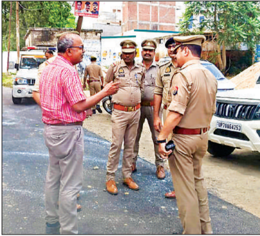
सुरक्षा को लेकर जांच पड़ताल करते पुलिस कर्मी।