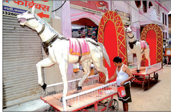
रथयात्रा के लिए तैयार किया जा रहा रथ।

आज जनरलगंज के जगन्नाथ मंदिर बाईजी से प्रभु निकालेंगे नगर भ्रमण पर