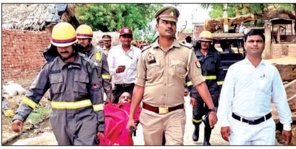
मॉक ड्रिल के दौरान नदी में डूबे बुजुर्ग को चिकित्सा शिविर ले जाती दमकल टीम।

सिकंदरा तहसील क्षेत्र के लगभग 20 गांवों में बाढ़ का खतरा मंडराने लगा है। लगातार बढ़ रहे जलस्तर को देखते हुए प्रशासन ने इन गांवों में सतर्कता टीमों को सक्रिय कर दिया है। जैसलपुर महदेवा, बैजामऊ बांगर, गौररीतन बांगर, गौहानी बांगर को हाई अलर्ट पर रखा गया है। इन गांवों में बाढ़ राहत चोकियां स्थापित की जाएंगी। इन गांवों में 20 से 25 हजार की आबादी है। हर बार