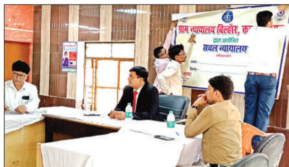
ग्राम न्यायालय बिल्हौर में मौजूद न्यायिक मजिस्ट्रेट व अन्य।