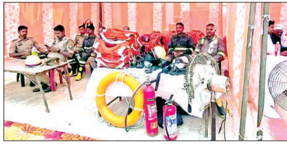
राहत कैम्प में सुरक्षा उपकरणों के साथ मौजूद दमकल व पुलिस टीम।