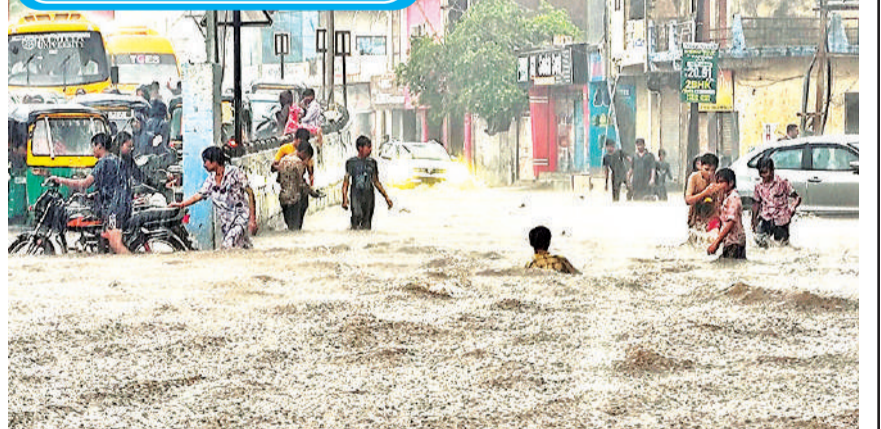
गुजरात के राजकोट में भारी बारिश के बाद कई इलाकों में जलभराव हो गया, जिससे आम जनजीवन प्रभावित हो गया। वहीं दूसरी ओर बच्चों ने इसे खेल का अवसर बना लिया और पानी भरें सड़कों पर मस्ती करते नजर आए। एंजेंसी

एक महिला को इसलिए गुजारा भत्ते से वंचित नहीं कर सकते क्योंकि वह कमाती है : बंबई हाईकोर्ट