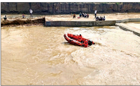
सेंगुर नदी में डूबे युवक की तलाश करती एसडीआरएफ टीम।

● एसडीआरएफ टीम तलाश में जुटी, एनडीआरएफ लौटी