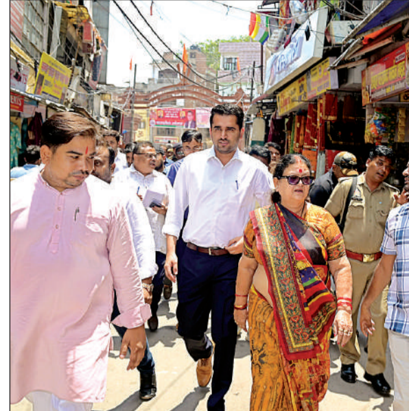
रथयात्रा रूट का निरीक्षण करती महापौर और नगर आयुक्त।

कानपुर। जिलाधिकारी जितेंद्र प्रताप सिंह ने गुरुवार को जगन्नाथ रथयात्रा की तैयारियों का स्थलीय निरीक्षण किया। जिलाधिकारी के मुताबिक रथयात्रा न केवल श्रद्धा को प्रतीक है, बल्कि सामाजिक समरसता और सांस्कृतिक एकाता का जीवंत उदाहरण भी है। रथयात्रा 27 जून को शाम पांच बजे से शुरू होकर करीब 5.5 किलोमीटर लंबे मार्ग से होकर गुजरेगी। जिलाधिकारी ने कहा कि यह परंपरा उत्तर प्रदेश और उड़ीसा के बीच सांस्कृतिक सेतु की तरह है, जिसे प्रशासन पूर्ण सुरक्षा, समन्वय और गरिमा के साथ संपन्न कराने को कटिबद्ध है। उन्होंने क्षेत्र में जो भी समस्याएं हैं उनका समाधान करने का आदेश अधिकारियों को दिया।