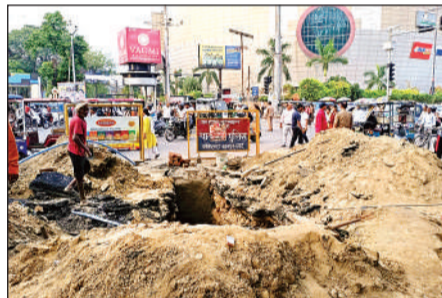
नाला की सफाई नहीं की गई है। पाइप लाइन फटने से बड़ा चौराहा पर की गई सड़क की खोदाई।