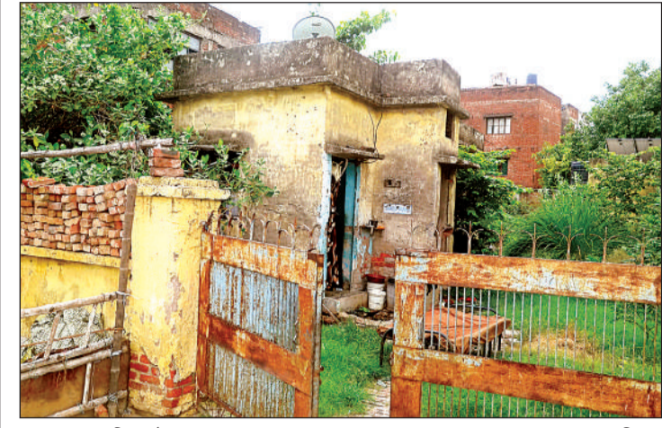
बंद पड़ा सामुदायिक शौचालय।

अमृत विचार। नहर पट्टियों पर काबिज लोग नहर के किनारे खुले में शौच कर रहे हैं। सड़कों के किनारे और घनी बस्तियों में रहने वाले लोग भी वेधड़क सुबह या रात के अंधेरे में पाकों या नालों के किनारे की जगह का इस्तेमाल शौच के लिए कर रहे हैं। बात यहीं तक नहीं है, तमाम मोहल्लों में सर्विस लेन या फुटपाथ के किनारे बनी शौचालय बनी हैं। स्मार्ट सिटी और ओडीएफ फ्री शहर का यह बुरा हाल नगर निगम की जांच में सामने आया है। हालांकि इस समस्या का बड़ा कारण नगर निगम क्षेत्र में बने शौचालय और यूरिनलॉ की खस्ताहाल स्थिति भी है। लेकिन अगर इस पर रोक नहीं लगी तो शहर की स्वच्छता रैकिंग पर प्रतिकूल असर पड़ सकता है। इसे देखते हुए खुले में शौच करने की गतिविधिया सख्ती से रोकने के लिये टीम बनाने की कवायद शुरू हो गई है। शहर में बने 96 सामुदायिक शौचालय पूरी तरह जर्जर हैं, जबकि 62 शौचालयों में पानी की कोई व्यवस्था नहीं है। यह