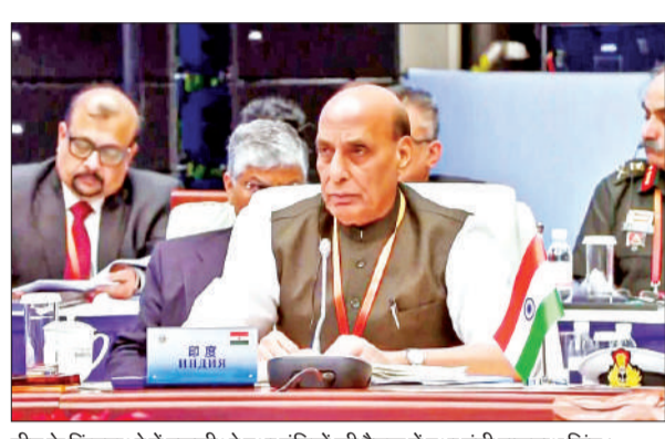
चीन के किंगदाओ में एससीओ रक्षा मंत्रियों की बैठक में रक्षा मंत्री राजनाथ सिंह।

रक्षा मंत्री राजनाथ सिंह ने पहलगा आतंकवादी हमले को नजरअंदाज करने और पाकिस्तान समर्थित सीमा पार आतंकवाद पर भारत की चिंताओं को स्पष्ट रूप से संबोधित नहीं करने को लेकर गुरुवार को शंघाई सहयोग संगठन (एससीओ) के संयुक्त वक्तव्य पर हस्ताक्षर करने से इनकार कर दिया। मामले से परिचित व्यक्तियों ने बताया कि एससीओ आम सहमति के तहत काम करता है, लिहाजा वक्तव्य का समर्थन करने से सिंह के इनकार के परिणामस्वरूप एससीओ रक्षा मंत्रियों का सम्मेलन संयुक्त वक्तव्य जारी किए बिना ही समाप्त हो गया। उन्होंने कहा कि मौजूदा वक्तव्य में न तो पहलगा आतंकवादी हमले का उल्लेख किया गया और न ही सीमा पार आतंकवाद को लेकर भारत के