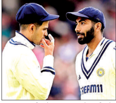
कप्तान शुभमन गिल ने शतक लगा इरादे जता दिए थे। बुमराह ने भी एक पारी में पांच विकेट लिए।

केपल राहुल ने शीर्ष क्रम में शानदार प्रदर्शन किया जिससे निकट भविष्य के लिए उनके बल्लेबाजी स्थान पर बहस बंद हो गई। उन्होंने दिखाया कि इंग्लैंड की परिस्थितियों में बल्लेबाजी करने का तरीका क्या है। उनके सलामी जोड़ीदार यशस्वी जायसवाल ने ऑस्ट्रेलिया के अपने पहले दौर की शुरुआत में यादगार शतक लगाया था और इंग्लैंड में अपनी पहली पारी में यही दोहराया। गिल ने जिस तरह