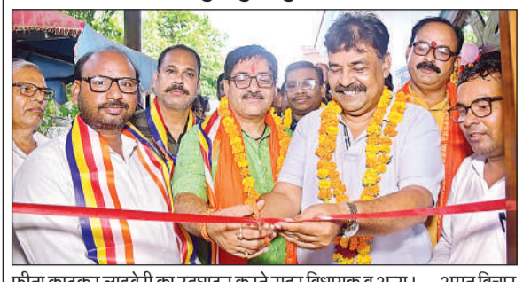
फीता काटकर लाइब्रेरी का उद्घाटन करते सदर विधायक व अन्य।

छात्र-छात्राओं के लिए शुरू हुई प्रबुद्ध लाइब्रेरी