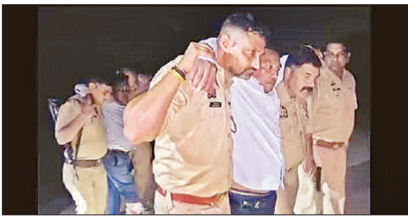
मुठभेड़ में घायल हुए बदमाशों को ले जाती पुलिस।