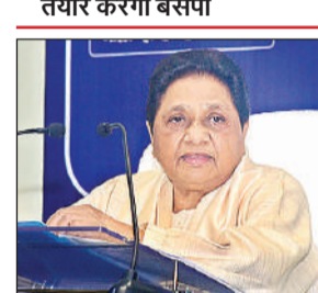
प्रेस कॉन्फ्रेंस करती बसपा प्रमुख मायावती।

अमृत विचार : बसपा प्रमुख मायावती ने कहा कि अगर संविधान की मूल भावना से छेड़छाड़ हुई तो बसपा चुप नहीं बैठेगी। संविधान की रक्षा के लिए देश भर में सड़कों पर उतरेगी। बसपा प्रमुख शनिवार को पार्टी के प्रदेश कार्यालय में आयोजित प्रेस कॉन्फ्रेंस को संबोधित कर रही थीं। उन्होंने चेतावनी देते हुए कहा कि कांग्रेस व भाजपा ने मिलकर संविधान में गैर जरूरी संशोधन किये हैं। उन्होंने कहा कि बसपा देश भर में मजबूत संगठन तैयार करेगी और आने वाले लोकसभा