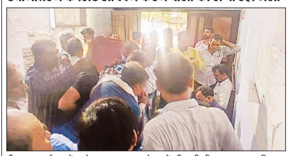
बीएसए कार्यालय में आवेदन पत्र जमा करने वालों की लगी भीड़।