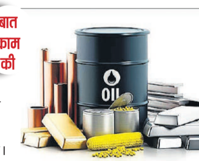
बात का क की

हार्ड क्मोडिटी वे प्राकृतिक संसाधन होते हैं जिन्हें जमीन से निकाला जाता है, जैसे कि कच्चा तेल, सोना, चांदी, तांबा और प्राकृतिक गैस। ये वस्तुएं वैश्विक अर्थव्यवस्था में अत्यंत महत्वपूर्ण भूमिका निभाती हैं और निवेशकों के लिए एक अलग परिस्मिति वर्ग प्रदान करती हैं। हार्ड क्मोडिटी में निवेश का उपयोग मुद्रास्फीति से बचाव, पोर्टफोलियो में विविधता और दीर्घकालिक रिटर्न के लिए किया जाता है। हालांकि, इनमें निवेश के साथ कुछ जोखिम भी जुड़े होते हैं जैसे वैश्विक घटनाएं, कीमतों में अस्थिरता और मांग-आपूर्ति में बदलाव।