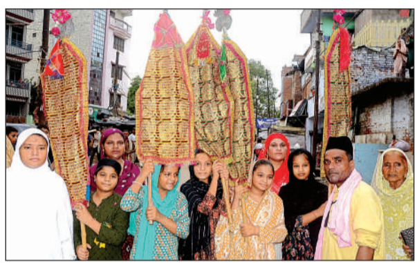
बकरमंडी में निकला अलम जुलूस।