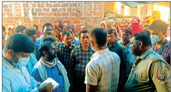
लक्ष्मणपुर गांव में युवक की मौत पर छानबीन करती पुलिस।