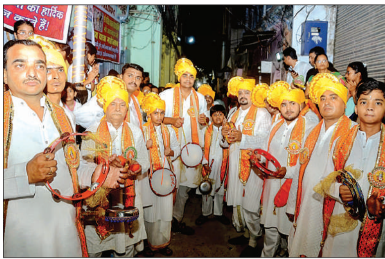
शोभायात्रा में कई मंडलों के सदस्य गाते-बजाते चले।