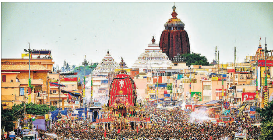
ओडिशा के पुरी में रथ यात्रा उत्सव के दौरान लोग भगवान जगन्नाथ के रथ को खींचते श्रद्धालु।