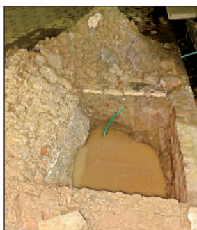
सत्यम विहार में लीकेज से गड्ढे में भरा पानी।