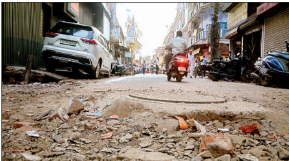
धनकुट्टी की क्षतिग्रस्त रोड।

शहर में ऐसी कई सड़कें हैं, जिनमें एक या दो नदों, बल्कि गड्ढे ही गड्ढे हैं। यह गड्ढे बारिश के मौसम में लोगों के लिए काल बन सकते हैं,