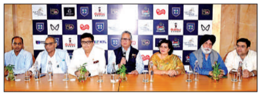
एल्युमिनी मीट की जानकारी देते आयोजक।