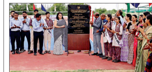
बच्चों के साथ मौजूद शिक्षक व मुख्य अतिथि।