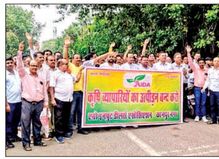
प्रदर्शन करते कीटनाशक व्यापारी।