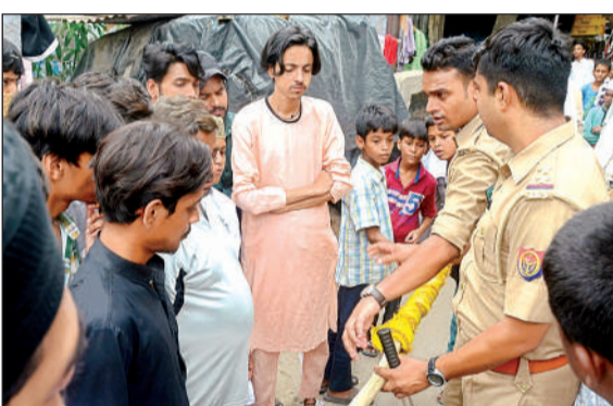
चुनीगंज पुलिस चौकी में अलम छोटा करवाती पुलिस।