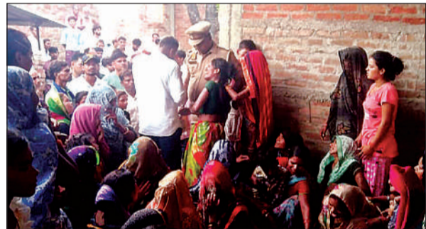
युवक की मौत पर रोती-बिलखती परिवार की महिलाएं।