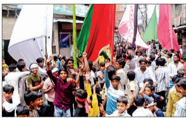
जुलूस में शामिल लोगों ने मातम किया।