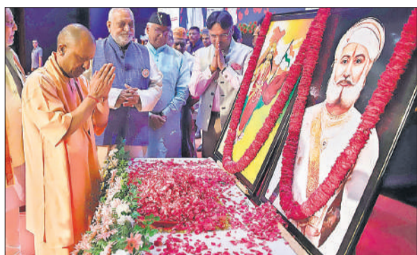
दानवीर भामाशाह के चित्र पर पुष्प अर्पित करते मुख्यमंत्री योगी आदित्यनाथ।

अभिनेत्री शेफाली जरीवाला की मौत की फॉरेंसिक जांच शुरू