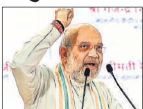
● वीडियो कॉन्फ्रेंस से कार्यक्रम को गृहमंत्री ने किया संबोधित

शाह ने भारत के स्वतंत्रता संग्राम में आदिवासी नेता गोविंद गुरु के योगदान को याद करते हुए कहा कि उन्होंने ब्रिटिश शासन के दौरान क्षेत्र के लोगों की अंतरात्मा को जगाया। शाह, वीडियो कॉन्फ्रेंस के जरिए