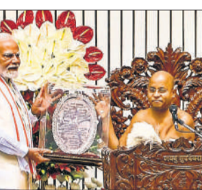
विद्यानंद जी महाराज के शताब्दी समारोह में शामिल मोदी।

प्रधानमंत्री ने कहा कि सरकार की कई कल्याणकारी योजनाएं आचार्य विद्यानंद महाराज के विचारों से प्रेरित