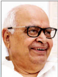
हृदय नारायण दीक्षित पूर्व विधानसभा अध्यक्ष उ.प्र.

शाश्वत तत्वों को सृजन का विषय बनाने की भारतीय परंपरा महत्वपूर्ण है। तात्कालिक विकृतियों को हटाना और शाश्वत मूल्यों की प्रतिष्ठा जरूरी है। संस्कृति के सारगर्भ से जुड़ने की यह बात महत्वपूर्ण है। साहित्य का प्रभाव समाज पर पड़ता है और समाज का साहित्य पर भी। रामकथा में