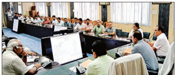
अभियान को लेकर डीएम की अध्यक्षता में द्वितीय अंतर्विभागीय बैठक हुई।