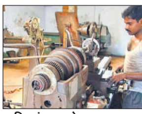
● वित्त मंत्रालय ने कहा- सरकार एमएसएमई क्षेत्र की विकास यात्रा को दे रही है गति

उसने कहा कि म्यूचुअल क्रेडिट गारंटी योजना के तहत 100 करोड़ रुपये तक के एमएसएमई ऋणों पर