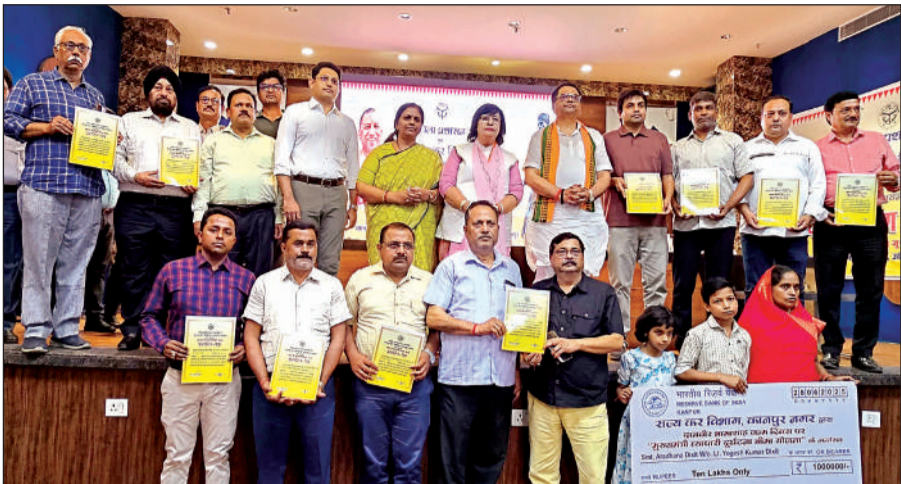
समारोह में व्यापारियों का सम्मान किया गया।