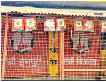
बंद पड़ी दुकानें।

कृषि विभाग के उत्पीड़न से आजिज जनपद के समस्त खाद, बीज व कीटनाशक विक्रेताओं ने एपी उन्नत डीलर्स एसोसिएशन उत्तर प्रदेश के आह्वान पर शनिवार