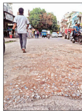
गीता नगर की टूटी पड़ी सड़क।

चलना फिरना तक मुस्किल है। मैनावती मार्ग की भी एक साइड की सड़क खस्ता हाल है। सड़क की हालत खराब होने और कई सड़कों पर गड्ढे होने की वजह से बाइक व स्कूटी सवार लोगों को काफी परेशानी का सामना करना पड़ रहा है। यहां पर लोग अक्सर गिरकर चोटहिल होते रहते हैं। इसके अलावा कार सवार लोगों को भी परेशानी का सामना करना पड़ता है। वाबजूद इसके जिम्मेदार अधिकारी जान के भी अनजान बने हुए हैं।