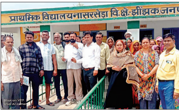
नासरखेड़ा स्कूल में प्रदर्शन के बाद असहमति पत्र देते लोग।