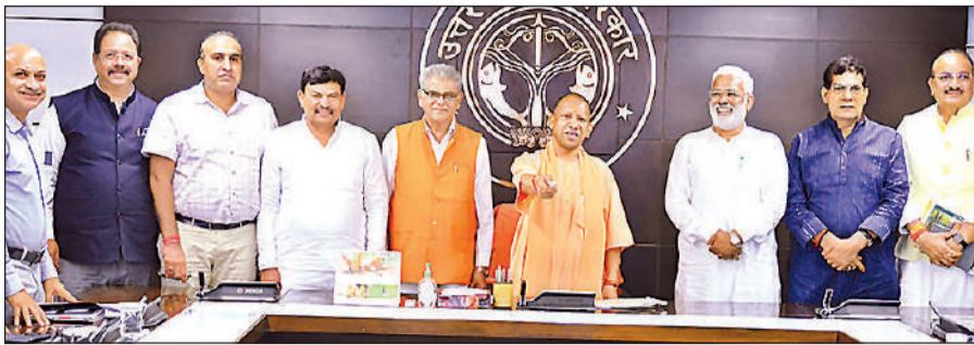
लखनऊ में उच्च स्तरीय बैठक के दौरान पौधरोपण अभियान का लोगो जारी करते मुख्यमंत्री योगी, साथ में अन्य।

राज्य ब्यूरो, लखनऊ अमृत विचार : प्रदेश में आगामी जुलाई माह में आयोजित होने जा रहे वन महोत्सव को लेकर मुख्यमंत्री योगी आदित्यनाथ ने शनिवार को उच्च स्तरीय समीक्षा बैठक की। पौधरोपण महाभियान-2025 का लोगो जारी करते हुए कहा कि इस बार एक दिन में प्रदेश की कुल जनसंख्या से भी अधिक पौधे लगाने का लक्ष्य लेकर चल रहे हैं। एक पेड़ मां के नाम थीम पर महाभियान में सामूहिक प्रयास प्रदेश को हीटवेव से ग्रीनवेव की ओर ले जा रहा है। मुख्यमंत्री ने अधिकारियों को स्पष्ट निर्देश दिए कि अभियान को प्रदेशव्यापी जनांदोलन का रूप दिया जाए। उन्होंने कहा कि वर्ष 2017 से 2024 के बीच प्रदेश में 204.92