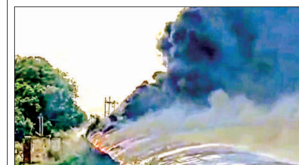
अंडर पास में लगी विकराल आग।