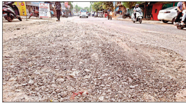
काकादेव की उखड़ी पड़ी सड़क।

परमपुरवा समेत आदि तमाम क्षेत्रों की सड़कों में गड्ढे ही गड्ढे हैं। वहीं नाला रोड से कंधी मोहाल होते हुए नाजीम अली ढाल तक सड़क काफी खराब हो चुकी है। बर्रा सचान चौराहा से शास्त्री चौक तक एक साइड पर तो लोगों का चलना दूबर है। बर्रा बाईपास से लेकर करंही तक सड़क न सिर्फ गड्ढा युक्त है, बल्कि यहां पर बेमौसम जलभराव भी बना रहता है, जबकि करंही से लेकर ठाकुर चौराहा से आगे तक तो सड़क ही लापता है। यहां पर लोगों का