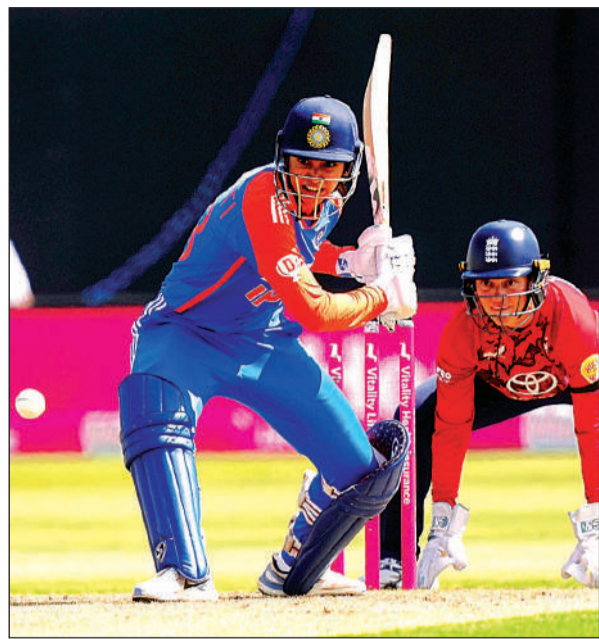
नॉटिंघम में महिला अंतर्राष्ट्रीय टी20 के दौरान बल्लेबाजी करती भारतीय टीम की कार्यवाहक कप्तान स्मृति मंधाना।