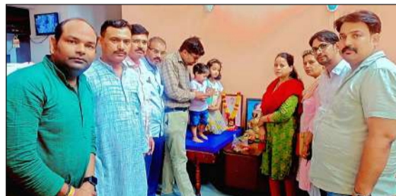
दिवंगत शिक्षक को श्रद्धांजलि देते टीचर सेल्फ केयर टीम के पदाधिकारी।