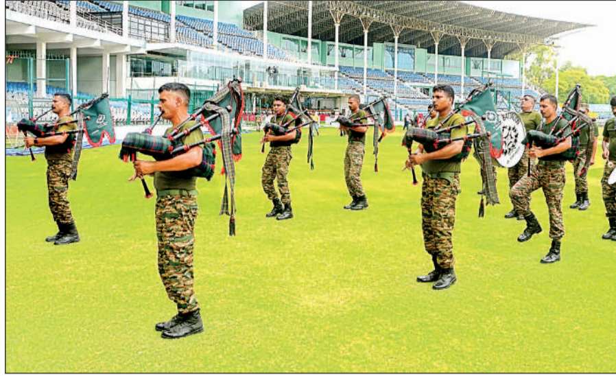
ग्रीनपार्क में सेना के बैड ने रिहर्सल किया।