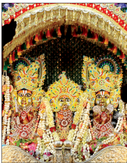
रथ पर सवार प्रभु चले नगर भ्रमण को।