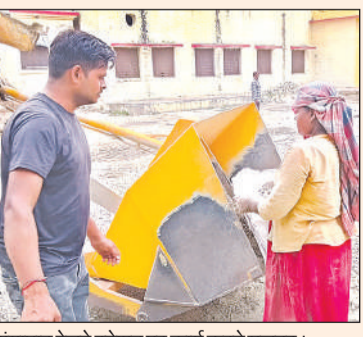
गंगाघाट रेलवे स्टेशन पर कार्य करते मजदूर।