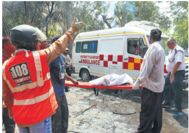
विमान हादसे में मारे गए एक यात्रा का शव ले जाते स्वास्थ्यकर्मी।