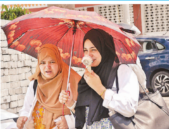
तेज धूप व गर्मी से राहत पाने के लिए मेडिकल कॉलेज की नर्स छाता लगाकर और हाथ में बैटरी वाले पंखे से मुंह पर हवा करती हुई।