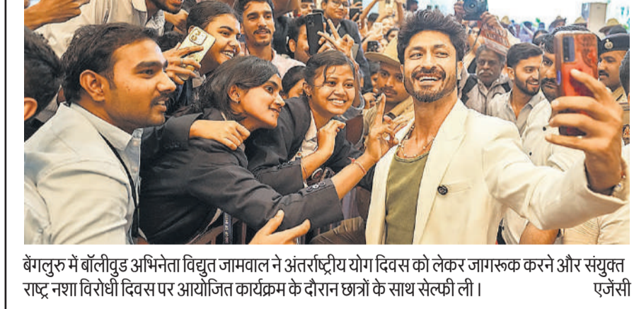
बंगलुरु में बॉलीवुड अभिनेता विद्युत जामवाल ने अंतर्राष्ट्रीय योग दिवस को लेकर जागरूक करने और संयुक्त राष्ट्र नशा विरोधी दिवस पर आयोजित कार्यक्रम के दौरान छात्रों के साथ सेल्फी ली।