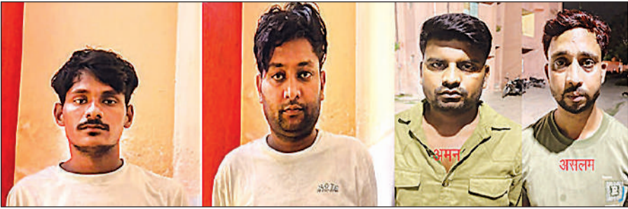
अलीगढ़ के टप्पल में मुठभेड़ में पकड़े गये बदमाश।

एसटीएफ एएसपी राकेश के मुताबिक आगरा यूनिट और टप्पल थाने की पुलिस को रात 10:30 बजे सूचना मिली कि कृपालपुर कंसेरा अंडरपास के पास कुछ बदमाशों हैं। पुलिस मौके पर पहुंची तो कार सवार बदमाशों ने टीम पर फायरिंग कर दी। पुलिस ने बदमाशों की घेराबंदी कर जवाबी फायरिंग की। फायरिंग में