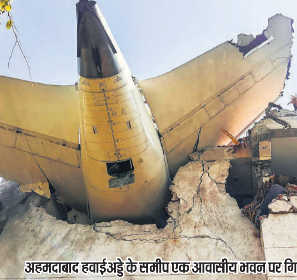
अहमदाबाद हवाई अड्डे के समीप एक आवासीय मकान पर गिरा विमान का मलबा।