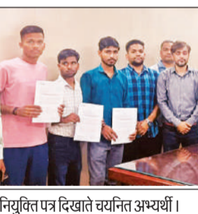
नियुक्त पत्र दिखाते चयनित अभ्यर्थी। अमृत विचार