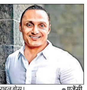
राहुल बोस।

'इंग्लिश ऑगस्ट', 'मिस्टर एंड मिसेज अय्यर' और 'चमेली' जैसी फिल्मों में अपने अभिनय की छाप छोड़ने वाले 57 साल के बोस ने भारत के लिए रग्बी के 17 मैच खेले हैं। वह पिछले दो दशकों से अधिक समय से भारत में इस खेल का चेहरा रहे हैं। जीएमआर स्पोर्ट्स के समर्थन से भारत में पहली रग्बी