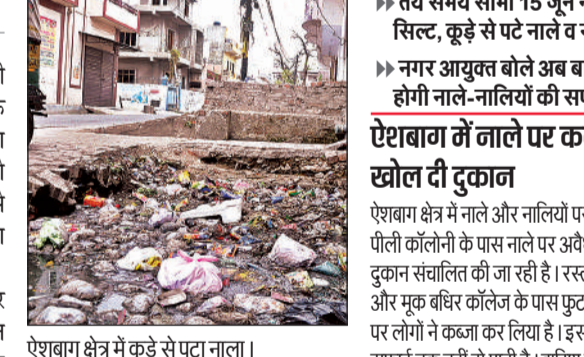
ऐशाबाग क्षेत्र में कूड़े से पटा नाला।