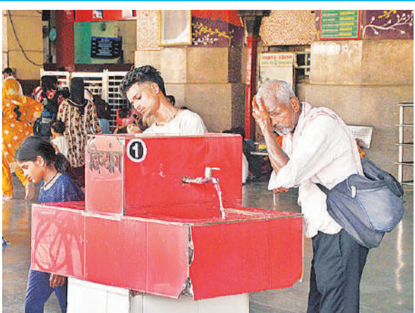
गर्मी से परेशान होकर चारबाग रेलवे स्टेशन पर पानी से मुंह धुलकर गर्मी से निजात पाने का प्रयास करता बुजुर्ग।