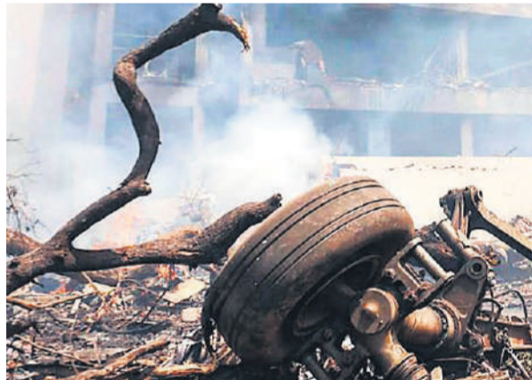
घटनास्थल पर टूटा पड़ा बोईंग विमान का एक पहिया।

ने कहा कि अभी कोई निष्कर्ष निकालना जल्दबाजी होगी, लेकिन हादसे के समय की तस्वीरों से ऐसे सवाल उठते हैं कि विमान के ऊंचा उठने के समय स्लैट्स और फ्लैप्स सही स्थिति में थे या नहीं। उन्होंने कहा कि तस्वीर में हवाई जहाज का अगला नुकीला हिस्सा 'नोज' ऊपर की ओर उठता हुआ और फिर नीचे की ओर गिरता हुआ दिखाई दे रहा है। इससे पता चलता है कि हवाई जहाज पर्याप्त उठान नहीं ले पा रहा है। स्लैट्स और फ्लैप्स को इस तरह से रखा जाना चाहिए कि पंख कम गति पर अधिक लिफ्ट बना सकें। कॉक्स ने कहा कि विमान को पीछे से देखने पर ऐसा नहीं लगता कि पीछे के किनारे के फ्लैप्स उस स्थिति में हैं, जैसी संभावना है। लेकिन मैं इस बात को लेकर बहुत सतर्क हूँ कि तस्वीर की गुणवत्ता इतनी अच्छी नहीं है कि मैं कोई निष्कर्ष निकाल सकूँ।