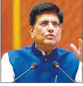
● उद्योग मंत्री ने कहा - एफटीए वार्ता को अंतिम रूप देने के काफ़ी करीब

वाणिज्य एवं उद्योग मंत्री पीयूष गोयल ने गुरुवार को कहा कि भारत और यूरोपीय संघ (ईयू) के बीच प्रस्तावित मुक्त व्यापार समझौते (एफटीए) के लिए गैर-शुल्क बाधाओं का समाधान ढूंढना महत्वपूर्ण है और दोनों पक्ष इन मुद्दों के समाधान के लिए सक्रियता से काम कर रहे हैं। उन्होंने कहा कि दोनों पक्ष प्रस्तावित मुक्त व्यापार समझौते के लिए वार्ता को अंतिम रूप देने के काफ़ी करीब हैं। गोयल ने यहां पत्रकारों से कहा, महत्वपूर्ण प्रगति हुई है। आधे से अधिक खंड तैयार हैं। विषय-वस्तु के संदर्भ में, मैं कहूंगा कि हम बाजार पहुंच के लिए करीब 90 प्रतिशत तैयार हैं। जिन महत्वपूर्ण मुद्दों पर ध्यान दिया जाना है, वे हैं - गैर-शुल्क बाधाएं और यूरोपीय संघ तथा भारत के बीच व्यापार को कैसे सहज, आसान व बेहतर बनाया जाए। उन्होंने कहा कि भारत और