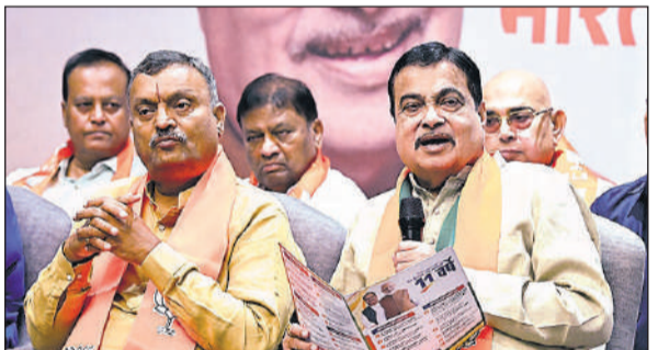
नागपुर में आयोजित कार्यक्रम में उपस्थित केंद्रीय मंत्री नितिन गडकरी।

केंद्रीय मंत्री नितिन गडकरी ने गुरुवार को कहा कि मोदी सरकार लोकसभा तथा विधानसभाओं में महिलाओं को 33 प्रतिशत आरक्षण देने के लिए प्रतिबद्ध है। मोदी सरकार के 11 वर्षों के कार्यकाल को देश के इतिहास में बहुत महत्वपूर्ण बताते हुए उन्होंने कहा कि इससे पहले के 60 वर्षों में विभिन्न क्षेत्रों में जो नहीं हो सका, उसे वर्तमान सरकार ने हासिल किया है। प्रधानमंत्री मोदी के नेतृत्व वाली सरकार के 11 वर्ष पूरे होने पर नागपुर में एक संवाददाता सम्मेलन को संबोधित करते हुए उन्होंने विश्वास व्यक्त किया कि इस वर्ष के अंत तक देश की 'लॉजिस्टिक्स' लागत घटकर नौ प्रतिशत पर आ जाएगी, जिससे निर्यात को बढ़ावा मिलेगा