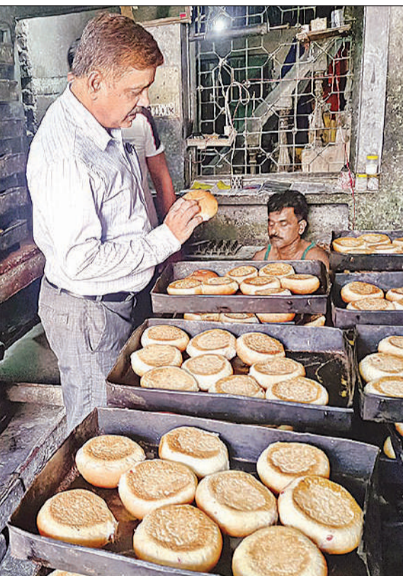
बेकरी से नमूने लेती एफएसडीए टीम।

नगर निगम ने गुरुवार को सरोजनीनगर तहसील के ग्राम कल्ली पश्चिम में सरकारी जमीन से अतिक्रमण हटाने के लिए अभियान चलाया। अपर नगर आयुक्त नम्रता सिंह द्वारा गठित टीम ने 3.20 करोड़ मूल्य की कुल 0.151 हेक्टेयर सरकारी जमीन अतिक्रमण मुक्त कराई। गाटा संख्या-1820 (0.126 हेक्टेयर, खाद का गड्ढा) और 1792 ख (0.025 हेक्टेयर, नवीन परती) में दर्ज भूमि पर पर स्थानीय लोगों द्वारा अवैध कब्जा करके निर्माण किया जा रहा था। नगर निगम और तहसील प्रशासन की संयुक्त टीम ने जेसीबी से अवैध निर्माण ध्वस्त करके अपना बाढ़ लगा दिया।