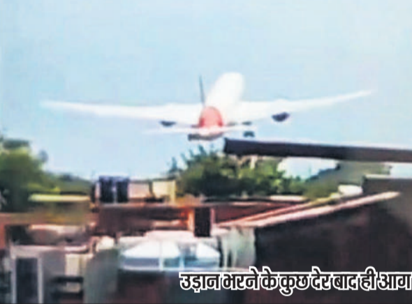
उड़ान भरने के कुछ देर बाद ही आग का गोला बना विमान।