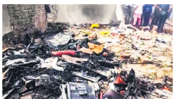
हादसे के बाद घटनास्थल पर बिखरा विमान का मलबा।