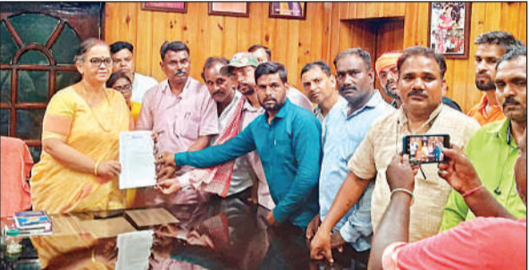
महापौर को उनके कार्यालय में ज्ञापन देते सफाई कर्मचारी। अमृत विचार

अमृत विचार : नगर निगम के सफाई कर्मचारियों ने गुरुवार को जोन 6 कार्यालय के बाहर धरना-प्रदर्शन किया। कर्मचारियों ने जोनल अधिकारी के खिलाफ जमकर नारेबाजी की। लखनऊ सफाई कर्मचारी यूनियन के तत्वावधान में आयोजित धरने में सहयोगी सफाई कर्मचारी संगठनों के पदाधिकारी, बीट ईंचांच तथा सफाई सुपरवाइजर शामिल हुए।