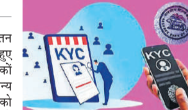
● आरबीआई ने बैंकों से ग्राहकों को उचित तरीके से नोटिस देने को कहा

भारतीय रिजर्व बैंक ने केवाईसी अद्यतन के मामले में ग्राहकों को राहत देते हुए कदम उठाया है। इसके तहत बैंकों और आरबीआई के दायरे में आने वाले वित्तीय संस्थानों से अपने ग्राहकों को केवाईसी के समय-समय पर अद्यतन करने के लिए उपयुक्त तरीके से नोटिस देने को कहा गया है। आरबीआई ने गुरुवार एक परिपत्र में कहा कि उसने अपने ग्राहकों को जानें (केवाईसी) के समय-समय पर अद्यतन में बड़ी संख्या में लंबित मामलों को देखा है। इसमें प्रत्यक्ष लाभ अंतरण (डीबीटी)/इलेक्ट्रॉनिक लाभ अंतरण (ईबीटी) के तहत राशि प्राप्त के लिए खोले गए खाते और प्रधानमंत्री जनधन