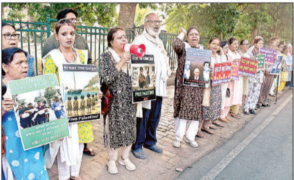
मानव श्रृंखला बनाकर प्रदर्शन करते सामाजिक कार्यकर्ता।