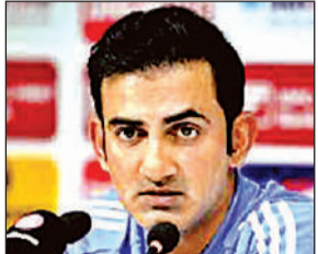
● भारत के मुख्य कोच गौतम गंभीर ने दी सलाह

गंभीर ने 'बीसीसीआई.टीवी' से अश्विन, रोहित और कोहली के हाल ही में संन्यास का जिक्र करते हुए कहा इस दौर को देखने के दो तरीके हैं। एक तो यह कि हम अपने तीन सबसे अनुभवी खिलाड़ियों के बिना हैं या हमें देश के लिए कुछ खास करने का भार अभूतपूर्व अवसर मिला है। भारत के पूर्व सलामी बल्लेबाज ने कहा कि वह शुभमन गिल की अगुआई वाली मौजूदा टीम में कुछ खास