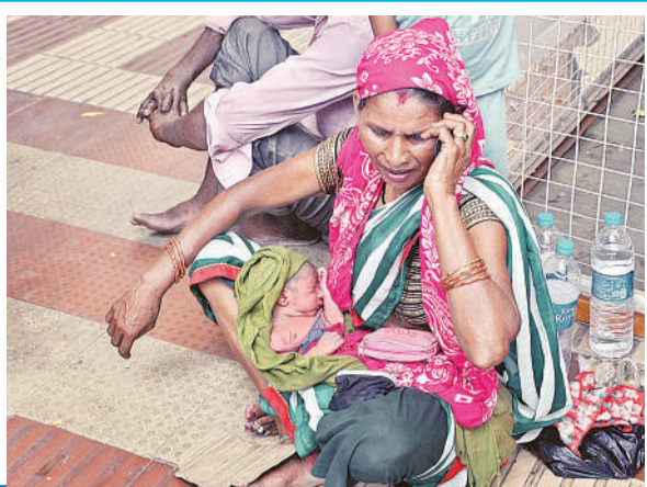
जानलेवा गर्मी कवीन मेरी अस्पताल के गेट पर बच्चे को गोद में लेकर चिलचिलाती गर्मी में बैठी महिला।