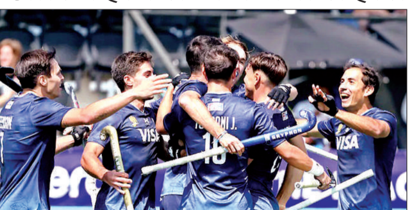
जीत का जश्न मनाते हुए अर्जेंटीना के खिलाड़ी।