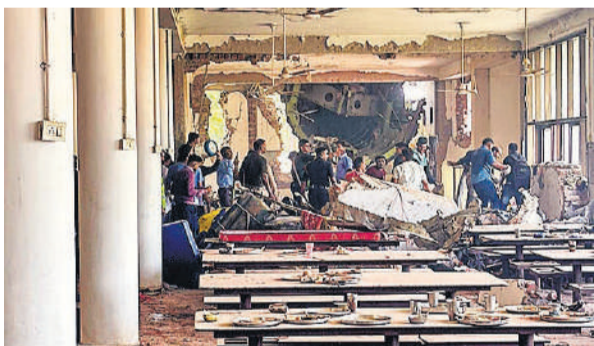
इमारत से विमान के टकराने से पूर्व कैटीन में छात्र खाना खा रहे थे।