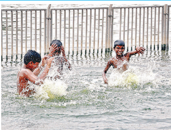
चिलचिलाती गर्मी में नहाने से बढ़िया क्या हो सकता है खासकर बालपन में। लक्ष्मण मेला स्थल स्थित गोमती नदी में नहाते बच्चे।