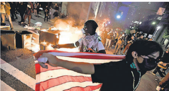
एक प्रदर्शनकारी ने कूड़ेदान के सामने अमेरिकी झंडा लहराया।

संवाद एजेंसी रिया नोवोस्ती के एक संवाददाता ने बताया कि जब पुलिस प्रदर्शनकारियों को घेर रही थी, तब कई पत्रकार भी वहां मौजूद थे। इससे पहले दिन में पुलिस ने कर्पूर क्षेत्र के बाहर सैकड़ों प्रदर्शनकारियों के एक समूह के खिलाफ रबर की गोलियों का इस्तेमाल किया, जिसके बाद प्रदर्शनकारी पीछे हट गए लेकिन तितर-बितर नहीं हुए।