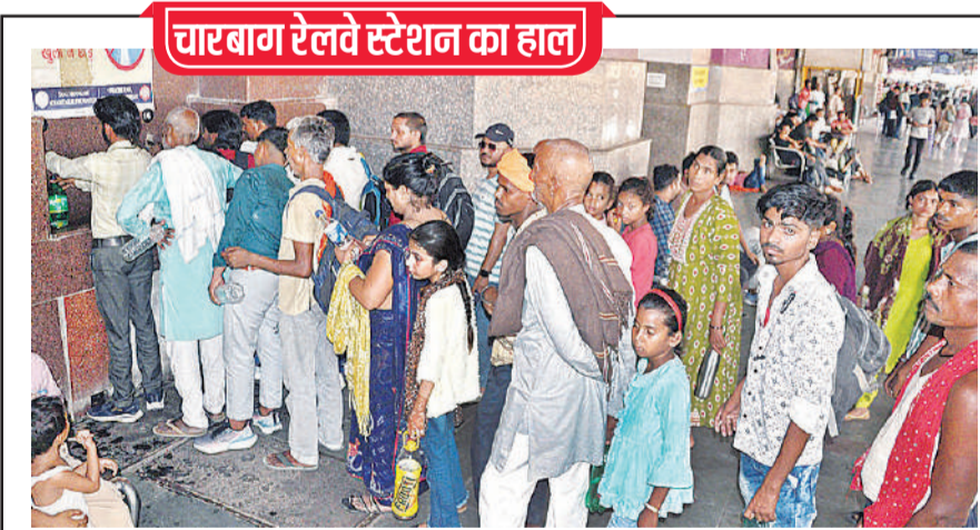
गुरुवार को राजधानी का तापमान 44 डिग्री सेल्सियस तक पहुंच गया, जो अब तक का लखनऊ का सबसे गर्म दिन रहा। गर्मी व चिलचिलाती धूप से बचने के लिए राजधानीवासी तरह-तरह के उपाय करते दिखे, कुछ ऐसा ही हाल चारबाग रेलवे स्टेशन पर भी देखने को मिला, जहां पानी के लिए लोगों की लम्बी कतार देखने को मिली।