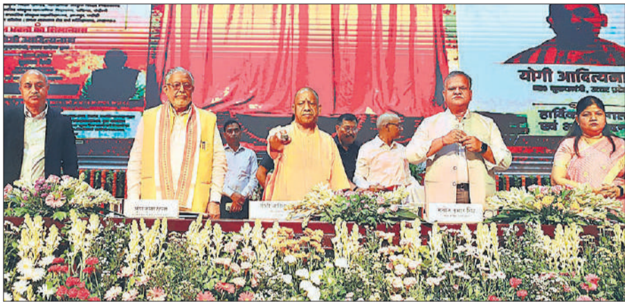
लोकभवन में सम्मान समारोह की शुरुआत करते मुख्यमंत्री योगी।

मुख्यमंत्री ने मेधावी छात्रों को सम्मानित करने के लिए गुरुवार को लोकभवन में आयोजित एक कार्यक्रम को संबोधित करते हुए कहा कि सार्वजनिक संपत्ति निजी संपत्ति नहीं है। यह पूरे समाज के योगदान से बनती है। अगर कोई इसे नुकसान पहुंचाता है तो वह राष्ट्र को नुकसान पहुंचा रहा होता है। इस तरह के कृत्यों को उजागर किया जाना और रोका जाना चाहिए। उन्होंने कहा कि आप सभी के पास मोबाइल फोन हैं। अगर किसी को सरकारी संपत्ति को नुकसान पहुंचाते हुए देखते हैं, तो उसका वीडियो बनाएं और उसे वायरल करें। हम सुनिश्चित करेंगे कि उस व्यक्ति की पहचान करके उससे वसूली की जाए। यूपी बोर्ड,