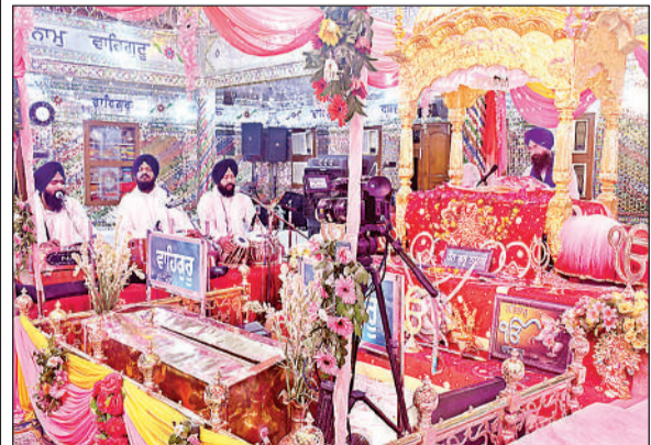
गुरुद्वारा नाका हिडोला में सुखमनी साहिब का पाठ करते धर्मगुरु।