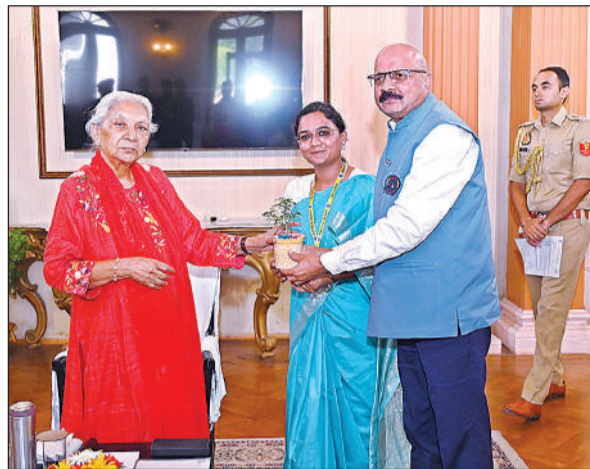
राज्यपाल आनंदीबेन पटेल से मुलाकात करते प्रशिक्षु अधिकारी।

अमृत विचार, लखनऊ: भारतीय रेल प्रबंधन सेवा-2022 बैच के प्रशिक्षु अधिकारियों ने गुरुवार को राज्यपाल आनंदीबेन पटेल से मुलाकात की। इस दौरान राज्यपाल ने भारतीय रेल के विशाल नेटवर्क, उसकी सामाजिक-आर्थिक भूमिका व जनता की सेवा में रेल कर्मियों की जिम्मेदारियों के प्रति सजग रहने का संदेश दिया। राज्यपाल ने कहा कि भारतीय रेल देश की जीवन रेखा है, इसके संचालन में पारदर्शिता, समयबद्धता और जनता के प्रति संवेदनशीलता अत्यंत आवश्यक है। उन्होंने कहा कि अधिकारी अपने ज्ञान, कौशल और ऊर्जा का उपयोग राष्ट्र निर्माण में करें।