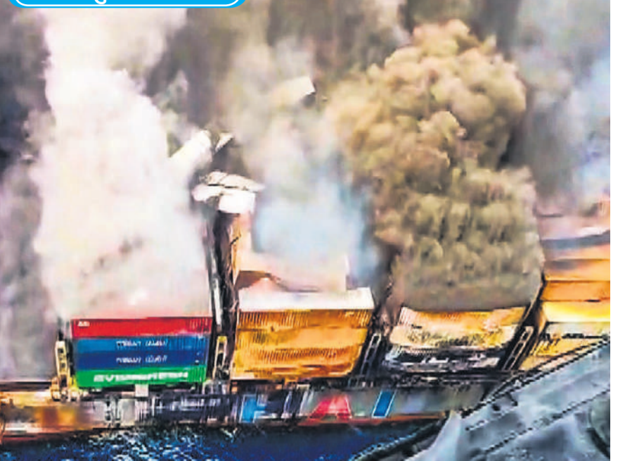
केरल के तट से कुछ दूर सिंगापुर के जहाज में लगी आग कई दिन बाद भी बुझाई नहीं जा सकी है। जहाज में भरे विस्फोटकों में लगातार धमाके हो रहे हैं जिसकी वजह से आग और भड़कती जा रही है।