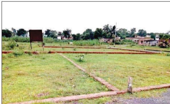
कृषि भूमि पर की गई प्लांटिंग।

मालूम हो कि जिले में एक दशक पहले 2.40 लाख हेक्टेयर में कृषि भूमि में फसल की पैदावार होती थी। शहर के आसपास की भूमि में भी किसान फसल की बुवाई करता था।