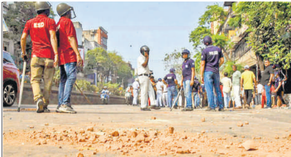
मध्य कोलकाता में शनिवार को प्रधानमंत्री मोदी की रैली के पूर्व भाजपा और तृणमूल कांग्रेस कार्यकर्ताओं के बीच झड़प के बाद सड़क पर बिखरी ईंटें और मौजूद पुलिस।

झड़प के बीच, यह आरोप भी सामने आया कि गिरिश पार्क इलाके में पश्चिम बंगाल की मंत्री शशि पांजा के आवास पर पथराव किया गया। यह झड़प रैली स्थल से लगभग पांच किलोमीटर दूर उस समय हुई जब भाजपा समर्थक प्रधानमंत्री की रैली में शामिल होने