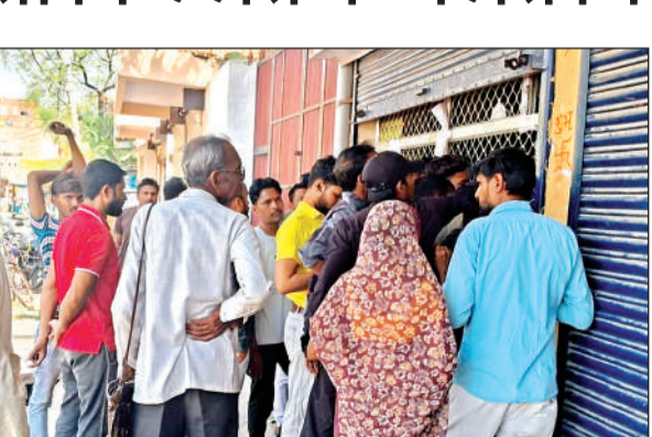
एजेंसी में गैस बुकिंग कराते भीड़ में शिक्षक व रखे सिलेंडर।

अमृत विचार। जिले में बढ़ती गैस की किल्लत में जहां गैस उपभोक्ता परेशान हैं, वहीं दूसरी तरफ शिक्षकों को मिड-डे-मील के लिए सिलेंडर के लाले पड़े हुए हैं। हालत यह है कि दिन भर बुकिंग के लिए खड़े रहने के बाद भी बुकिंग न होने से उपभोक्ताओं को चूल्हों में आग जलाकर खाना बनाना पड़ रहा है। वहीं शिक्षक मिड डे मील के लिए गैस सिलेंडर हासिल करने के लिए स्कूल से लौटने के बाद बुकिंग के लिए जद्दोजहद करते हैं। गौरतलब है कि पूर्व में मिड डे मील के एक सप्ताह में सिलेंडर मिल जाता था, लेकिन अब 25 दिन के बाद ही मिड डे मील का सिलेंडर का नंबर लगेगा, जबकि विद्यालयों में सैकड़ों बच्चों का प्रतिदिन भोजन