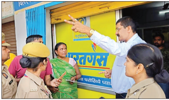
कमालगंज स्थित गैस एजेंसी में निर्देश देते डीएम आशुतोष कुमार द्विवेदी। अमृत विचार

जिलाधिकारी ने निर्देश दिए कि सभी उपभोक्ताओं को समयबद्ध तरीके से गैस सिलेंडर की आपूर्ति सुनिश्चित की जाए और जिन उपभोक्ताओं की बुकिंग लंबित है, उन्हें प्राथमिकता के आधार पर गैस उपलब्ध कराई जाए। डीएम ने स्पष्ट निर्देश दिए कि गैस सिलेंडर वितरण में किसी भी प्रकार की कालाबाजारी या अनियमितता नहीं होनी चाहिए।