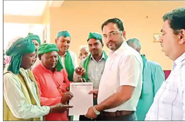
तहसीलदार को ज्ञापन देते किसान नेता।

ज्ञापन में प्रमुख मांगों में कायमगंज सामुदायिक स्वास्थ्य केंद्र में चिकित्सकों की कमी को दूर करने और एक सर्जन की तैनाती की मांग शामिल है। यूनियन ने इंडेन और एचपी गैस की कालाबाजारी रोकने तथा बंद किए गए बुकिंग कार्यालयों को फिर से खोलने की भी अपील की। किसानों ने आरोप लगाया कि कायमगंज राजकीय बीज भंडार में कर्मचारी अपने चहेतों को निशुल्क बीज वितरित कर रहे हैं, जिस पर रोक लगाने की मांग की गई। तहसील