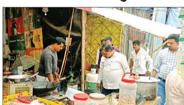
दुकानों पर चेकिंग करते जिम्मेदार।