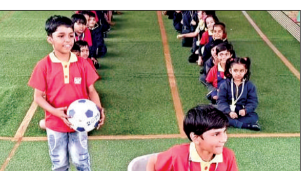
खेल प्रतियोगिता में भाग लेते नन्हे मुन्हे बच्चे।