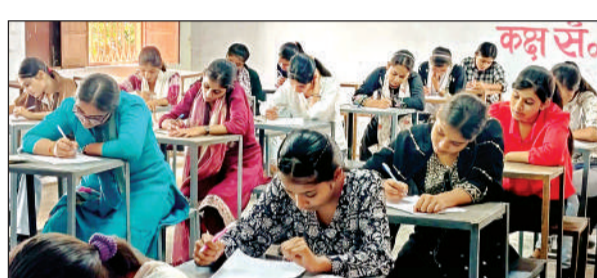
उन्नयन प्रतियोगिता में प्रतिभाग करती छात्राएं।