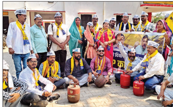
गैस सिलेंडर लेकर विरोध प्रदर्शन करते आम आदमी पार्टी के कार्यकर्ता।