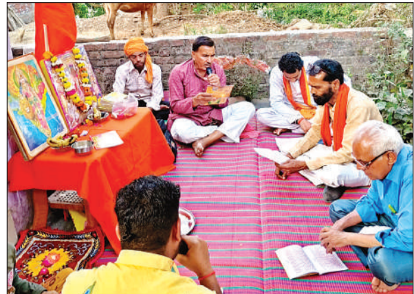
सुंदरकांड पाठ करते लोग।