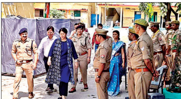
परीक्षा केंद्र का निरीक्षण करते अधिकारी।

अमृत विचार। जिलाधिकारी गजल भारद्वाज और पुलिस अधीक्षक प्रबल प्रताप सिंह ने संयुक्त रूप से जिले में आयोजित उपनिरीक्षक सीधी भर्ती परीक्षा 2025 को पूर्णतः निष्पक्ष, पारदर्शी एवं शांतिपूर्ण वातावरण में संपन्न कराने के उद्देश्य से शनिवार को जिले के विभिन्न परीक्षा केंद्रों का निरीक्षण किया। निरीक्षण के दौरान ड्यूटी में तैनात पुलिस बल को सतर्कता के साथ अपने दायित्वों का निर्वहन करने के निर्देश दिए। जिलाधिकारी एवं पुलिस अधीक्षक ने परीक्षा केंद्रों का स्थलीय भ्रमण कर सुरक्षा व्यवस्था, अभ्यर्थियों की प्रवेश प्रक्रिया, यातायात व्यवस्था