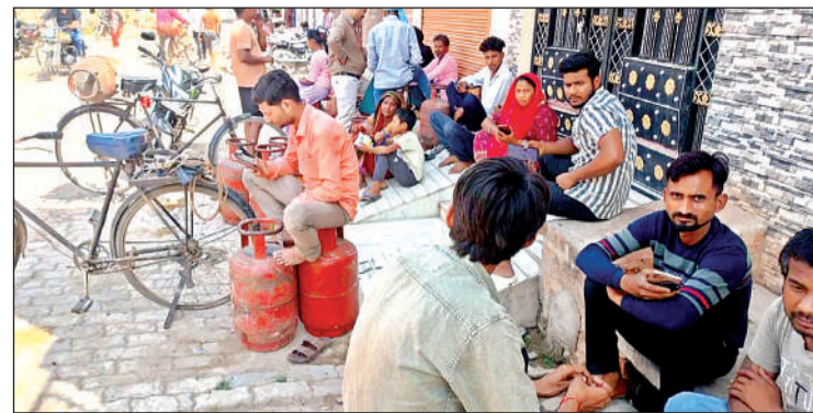
गैस सिलेंडर के इंतजार में बैठे उपभोक्ता।