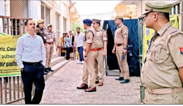
शहर के सुशीला देवी बालिका इंटर कॉलेज परीक्षा केंद्र में निरीक्षण करते डीएम व एसपी।

कॉलेज, सेठ बासुदेव सहाय इंटर कॉलेज, गोमती देवी गर्ल्स इंटर कॉलेज मकरंदनगर, पीएसएम पीजी कॉलेज, केकेसीएन इंटर कॉलेज तथा केके इंटर कॉलेज का निरीक्षण कर सुरक्षा व्यवस्था, बैठने के इंतजाम तथा अभ्यर्थियों के प्रवेश संबंधी प्रबंधों का सत्यापन किया। आज यानि रविवार को भी आठों केंद्रों पर दो पालियों में परीक्षा कराई जाएगी। जिम्मेदारों ने गोपनीय परीक्षा सामग्री के सुरक्षित रख-रखाव, अभ्यर्थियों