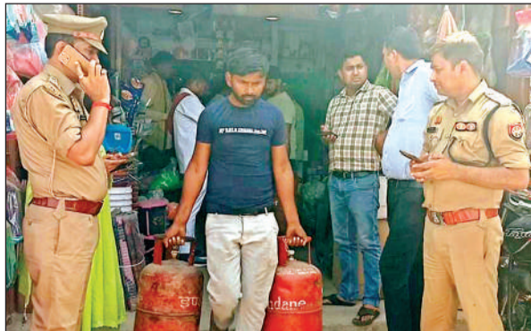
दुकान पर छापा मारने पहुंची टीम।