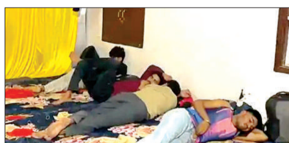
धर्मशाला में ठहरे पुलिस भर्ती के अभ्यर्थी।