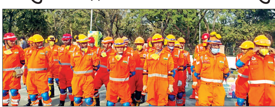
भूकंप से बचाव के टिप्स देते अधिकारी।

भूकंप आपातकाल स्थिति में आमजनमानस एवं नागरिकों की सुरक्षा भूकंप के दौरान किस प्रकार की जायें एवं क्षतिग्रस्त इमारतों में से किस तरह लोगों को बाहर निकाल कर फंसे हुए/घायल लोगों की जान बचायी जाये। इस माँक अभ्यास का उद्देश्य आमजन एवं संस्थानों को आपदा की स्थिति में त्वरित और प्रभावी प्रतिक्रिया के लिए तैयार करने से रहा। इस माँक ड्रिल का आयोजन जिला प्रशासन, एनडीआरएफ, सिविल डिफेंस, फायर सर्विस, जिला प्रशासन एवं आपदा मित्रों, होमगार्ड विभाग