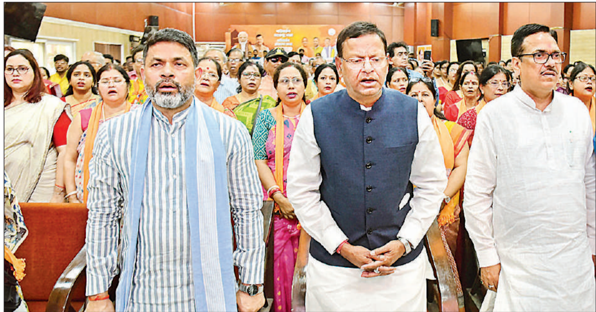
प्रधानमंत्री नरेंद्र मोदी की कोलकाता में आयोजित जनसभा के लाइव प्रसारण को सुनने के लिए लखनऊ स्थित भाजपा मुख्यालय में बंगाली समाज के प्रतिनिधि एकत्र हुए। इस अवसर पर भारतीय जनता पार्टी के प्रदेश अध्यक्ष एवं केंद्रीय वित्त राज्य मंत्री पंकज चौधरी समेत अन्य पार्टी नेता मौजूद रहे।