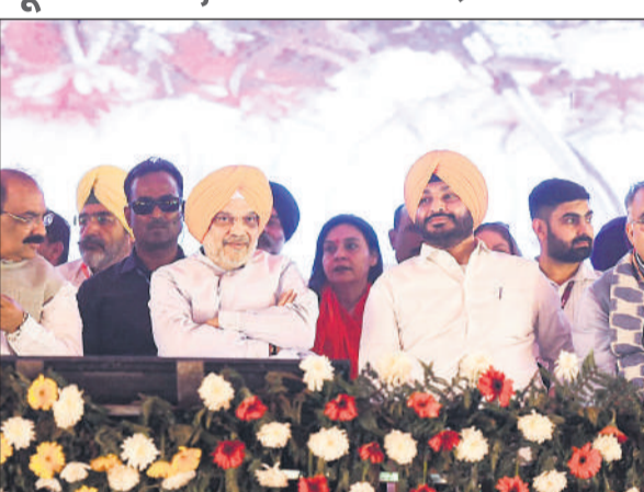
पंजाब के मोगा में बदलाव रैली के दौरान मंच पर भाजपा नेताओं तरुण चुध, रवनीत सिंह बिट्टू और अन्य नेताओं के साथ केंद्रीय गृह मंत्री अमित शाह दिखाई दे रहे हैं।

केंद्रीय गृह मंत्री अमित शाह ने कानून-व्यवस्था, नशे की समस्या, धर्मांतरण और भ्रष्टाचार जैसे मुद्दों पर शनिवार को पंजाब की भगवंत मान सरकार पर निशाना साधा और आरोप लगाया कि यह सरकार आम आदमी पार्टी (आप) के प्रमुख अरविंद केजरीवाल के लिए एक एटीएम बन गई है। उन्होंने मतदाताओं से अपील की कि वे 2027 के विधानसभा चुनाव में भाजपा को एक मौका दें ताकि राज्य में बदलाव लाया जा सके।