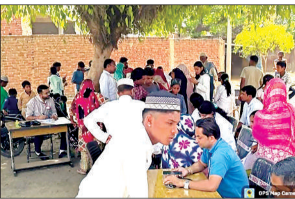
स्वास्थ्य शिविर में मरीजों को देखते चिकित्सक।