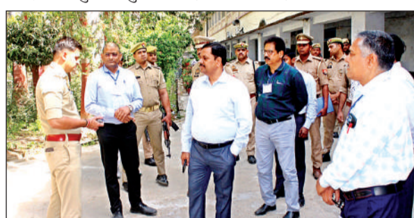
निरीक्षण करते डीएम व एसपी।

सके। निरीक्षण के दौरान जिला पंचायत इण्टर कॉलेज मुरादगंज, जनता इण्टर कॉलेज अजीतमल, विवेकानंद ग्रामोद्योग महाविद्यालय दिबियापुर एवं वैदिक टेक्नीकल एवं औद्योगिक इंटर कॉलेज दिबियापुर में पहुंचकर व्यवस्थाएं देखीं और केंद्र व्यवस्थापकों को निर्देशित किया कि केंद्र में सीसीटीवी का संचालन तथा विद्युत आपूर्ति निर्बाध रूप से सुनिश्चित की जाए जिससे किसी प्रकार की कोई शिकायत का अवसर न मिले। इस अवसर पर सेक्टर मजिस्ट्रेट, स्टैटिक मजिस्ट्रेट सहित संबंधित अधिकारी आदि उपस्थित रहे।