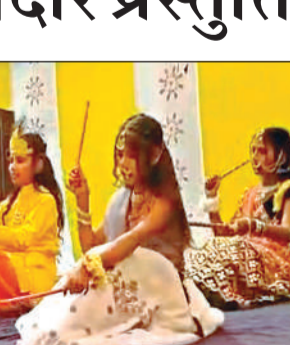
कार्यक्रम की प्रस्तुति देते बच्चे।