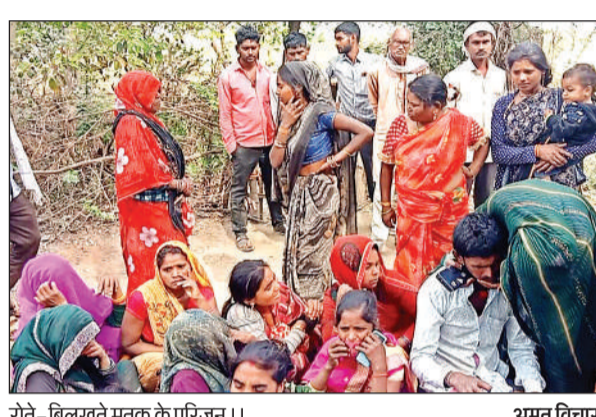
रोते-बिलखते मृतक के परिजन।।