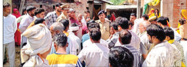
घटना स्थल पर मौजूद पुलिस व गांव के लोग।

अमृत विचार । थाना क्षेत्र के गांव गोपियागंज में शनिवार सुबह एक नवविवाहिता की संदिग्ध परिस्थितियों में मौत हो गई। सूचना मिलते ही मायके पक्ष के लोग भी मौके पर पहुंच गए और पुलिस को घटना की जानकारी दी।