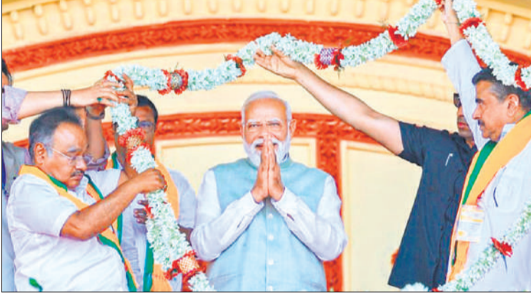
कोलकाता के ब्रिगेड परेड ग्राउंड में एक रैली के दौरान प्रधानमंत्री नरेंद्र मोदी को माला पहनाने भाजपा नेता।

प्रधानमंत्री ने शनिवार को असम के सिलचर में रैली को संबोधित करते हुए कहा कि केंद्र सरकार वैश्विक संघर्षों के कारण लोगों पर पड़ने वाले प्रभावों को कम करने के लिए काम कर रही है। साथ ही आरोप लगाया कि विपक्षी पार्टी कांग्रेस देश में दहशत पैदा करने की कोशिश करके गैर-जिम्मेदाराना व्यवहार कर रही है। कांग्रेस को एक जिम्मेदार राजनीतिक दल की भूमिका निभानी चाहिए थी लेकिन वह ऐसा करने में विफल रही। वह आज झूठे वादों की दुकान बन चुकी है और दहशत फैलाने की कोशिश कर रही है।