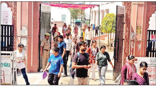
इस्लामिया परीक्षा केंद्र से परीक्षा देकर वापस निकलते परीक्षार्थी।

अमृत विचार । पुलिस दरोगा भर्ती परीक्षा कड़ी निगरानी के बीच दो पालियों में कराई गई। सीसीटीवी से भी परीक्षा पर नजर रखी गई इसके साथ ही अधिकारियों ने भी निरीक्षण किया। मुख्य गेट पर ही अभ्यर्थियों की तलाशी ली गई और आधार कार्ड का मिलान भी किया गया। परीक्षा की पहली पाली सुबह 10 बजे शुरू हुई लेकिन 9 बजे से ही अभ्यर्थियों की परीक्षा केंद्रों पर पहुंचने का सिलसिला शुरू हो गया था। परीक्षा से पहले अभ्यर्थियों के आधार कार्ड का मिलान किया गया और अंगुठा भी लगवाया गया। इसके बाद ही उन्हें परीक्षा केंद्र के अंदर जाने की अनुमति मिली।