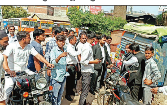
रोडवेज बस स्टैंड के गेट पर मौजूद अधिवक्ता।

अमृत विचार। रोडवेज बस स्टैंड के गेट पर रोडवेज बस के चालक ने ग्रामीण की बाइक में टक्कर मार कर टेली दुकान को रगड़ दिया। इससे उसका पल्ला टूट गया। इससे नाराज वकीलों ने स्टैंड पर हंगामा काटा। बाद में वकील चालक को पकड़कर कोतवाली ले गये। जहां उन्होंने चालक के खिलाफ तहरीर दी है।