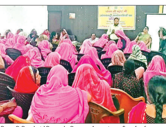
प्रशिक्षण शिविर को संबोधित करते प्रशिक्षक व मौजूद आंगनबाड़ी कार्यकर्ता।

अमृत विचार। बाल विकास और पुष्पाहार विभाग की ओर से चलाए गए केंद्र सरकार की पोषण भी पढ़ाई भी योजना के तहत ब्लॉक सभागार में शनिवार को आंगनबाड़ी कार्यकर्ताओं का तीन दिवसीय प्रशिक्षण संपन्न हुआ। इसका उद्देश्य बच्चों के पोषण, स्वास्थ्य और शुरुआती शिक्षा को जोड़ना है। आंगनबाड़ी कार्यकर्ताओं को पोषण ट्रैकर एप प्रधानमंत्री मातृ वंदना योजना और बच्चों को कैसे पढ़ाई के साथ-साथ अपने स्वास्थ्य का भी ध्यान रखने के बारे में बताया गया। भावगीत, कहानी, खेल-खिलौने के साथ छोटे-छोटे बच्चों को प्रशिक्षित करने का प्रशिक्षण दिया गया। प्रथम दिन पढ़ाई, दूसरे दिन पोषण तथा अंतिम दिन पोषण