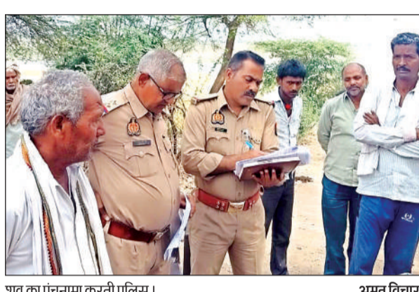
शव का पंचनामा करती पुलिस।