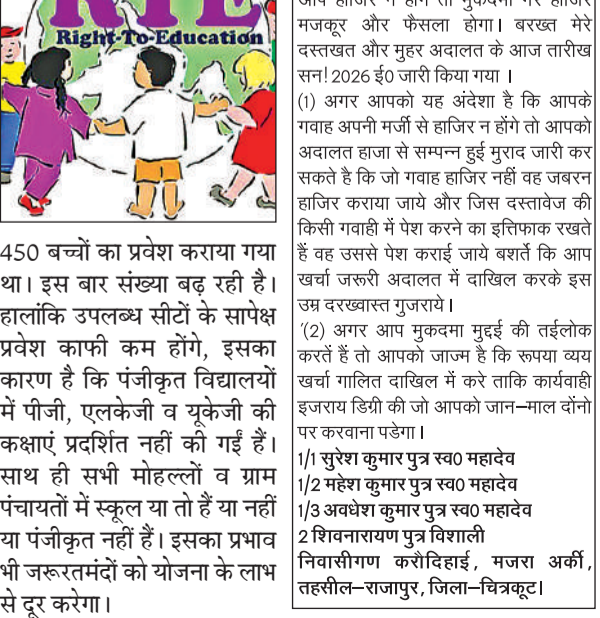
अमृत विचार में प्रकाशित खबर।