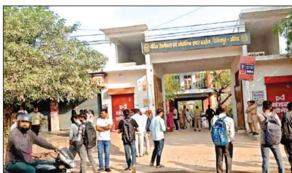
परीक्षा केंद्र के बाहर तैनात पुलिस।