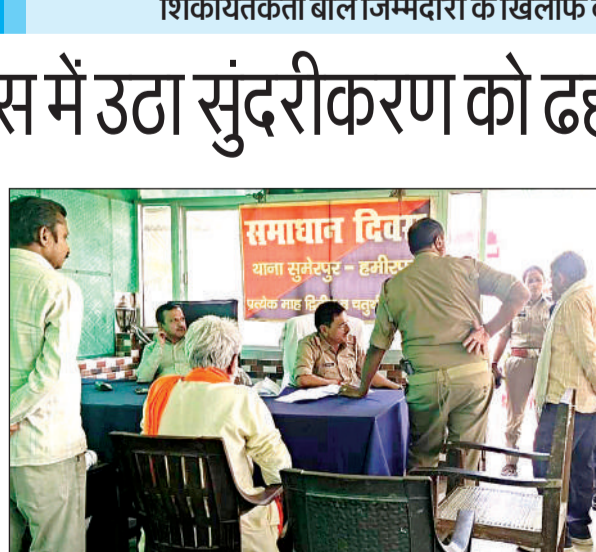
थाने में आयोजित समाधान दिवस में शिकायत दर्ज कराते लोग।

अमृत विचार। कस्बे के श्री गायत्री गंगा घाट में चल रहे ध्वस्तीकरण का मामला 16वें दिन समाधान दिवस में पहुंचा। शिकायतकर्ताओं ने कहा कि अगर बगैर टेंडर प्रक्रिया के नगर पंचायत कार्य करा रही थी तो अध्यक्ष एवं अधिशासी अधिकारी के खिलाफ कार्रवाई की जाए अन्यथा सुंदरीकरण को ढहाने वालों के खिलाफ कड़ी कार्रवाई की जाए। मामले की जांच के लिए कमेटी का गठन किया गया है। कस्बे के श्री गायत्री गंगा घाट में नगर पंचायत की ओर से सुंदरीकरण