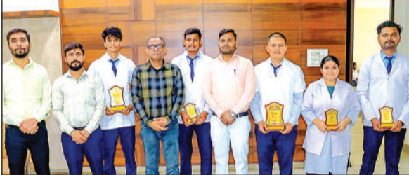
छात्रों के साथ कालेज का स्टाफ।