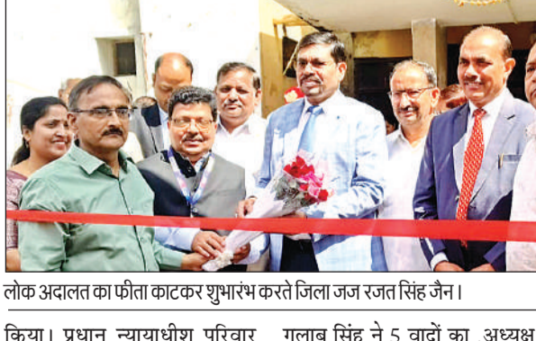
लोक अदालत का फीता काटकर शुभारंभ करते जिला जज रजत सिंह जैन।

अमृत विचार । उत्तर प्रदेश राज्य विधिक सेवा प्राधिकरण लखनऊ की ओर से जिला जज रजत सिंह जैन की अध्यक्षता में लोक अदालत लगाई गई। इस राष्ट्रीय लोक अदालत में सकल रूप से 1,32,782 वादों का निस्तारण किया गया। इसमें 17 वैवाहिक प्रकरणों का निस्तारण किया गया व 4 जोड़ों की विवाह कराई गई।