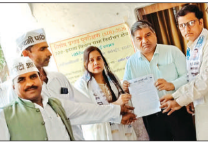
आम आदमी पार्टी के कार्यकर्ता ज्ञापन देते हुए

लाइन लग रही है और लोगों को समय पर सिलेंडर नहीं मिल पा रहा है। सपा नेताओं का कहना है कि सरकार को इस समस्या का जल्द समाधान करना चाहिए।