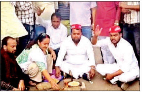
चूल्हे पर खाना बनाकर प्रदर्शन करते सपाई।

सपा कार्यकर्ताओं ने कहा कि गैस की आपूर्ति न होने से आम लोग परेशान हैं। सरकार को तुरंत व्यवस्था सुधारनी चाहिए। गैस की कमी की खबरों के बीच समाजवादी पार्टी के कार्यकर्ता शनिवार को शहर के शास्त्री चौराहे पर एकत्र हुए उन्होंने खाली गैस सिलेंडर के साथ चूल्हा जलाकर रोटियां बनाई और गैस संकट को लेकर विरोध जताया। प्रदर्शनकारियों का कहना था कि गैस की आपूर्ति प्रभावित होने से आम लोगों के सामने खाना बनाने तक की समस्या खड़ी हो गई है। प्रदर्शन में शामिल कार्यकर्ताओं ने कहा कि गैस एजेंसियों पर लंबी