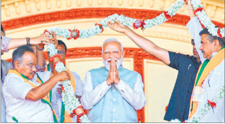
कोलकाता के ब्रिगेड परेड ग्राउंड में एक रैली के दौरान प्रधानमंत्री नरेंद्र मोदी को माला पहनाते भाजपा नेता।

प्रधानमंत्री ने शनिवार को असम के सिलचर में रैली को संबोधित करते हुए कहा कि केंद्र सरकार वैश्विक संघर्षों के कारण लोगों पर पड़ने वाले प्रभावों को कम करने के लिए काम कर रही है। साथ ही आरोप लगाया कि विपक्षी पार्टी कांग्रेस देश में दहशत पैदा करने की कोशिश करके गैर-जिम्मेदाराना व्यवहार कर रही है। कांग्रेस को एक जिम्मेदार राजनीतिक दल की भूमिका निभानी चाहिए थी लेकिन वह ऐसा करने में विफल रही। वह आज झूठे वादों की दुकान बन चुकी है और दहशत फैलाने की कोशिश कर रही है।