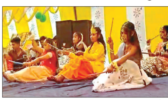
कार्यक्रम की प्रस्तुति देते बच्चे।