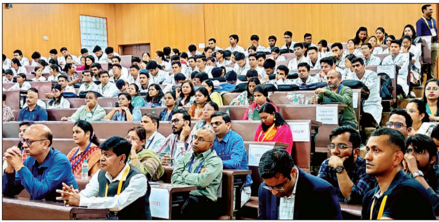
जीएसवीएम मेडिकल कॉलेज में शनिवार को फिजियोलॉजी विभाग ने यूपी एसोपिकॉन आयोजित किया।

जीएसवीएम मेडिकल कॉलेज में शनिवार को फिजियोलॉजी विभाग द्वारा आयोजित उत्तर प्रदेश फिजियोलॉजी कॉन्फ्रेंस-यूपी एसोपिकॉन के तीसरे दिन फिजियोलॉजी एंड इंटरफेस व्हेयर