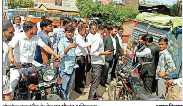
रोडवेज बस स्टैंड के गेट पर मौजूद अधिवक्ता।