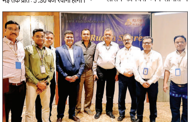
संगोष्ठी में पहुंचे निवेशक और सीए। अमृत विचार

कानपुर। होली पर भीड़ को देखते हुए रेलवे प्रशासन ने लोकमान्य तिलक टर्मिनल (मुंबई) से बनारस के लिए साप्ताहिक ट्रेन चलाने की घोषणा की गई है। इस गाड़ी में 9 स्लीपर, 1एसी द्वितीय, 4 सामान्य, 6 एसी तृतीय एवं 2 पार्सलवाहन होंगे। गाड़ी संख्या 01073 लोकमान्य तिलक टर्मिनल से 15 अप्रैल से 30 अप्रैल तक प्रत्येक बुधवार एवं गुरुवार को दोपहर 12.15 बजे रवाना होगी। नासिक दोपहर 3.12 बजे, भुसावळ सायं 7.10 बजे, बीना प्रातः 8.50 बजे, गोविंदपुरी दोपहर 2.40 बजे, सुबेदारगंज सायं 5.50 बजे एवं बनारस रात 11.23 बजे पहुंचेगी। गाड़ी संख्या 01074 बनारस से प्रत्येक शुक्रवार एवं शनिवार 17 अप्रैल से 2 मई तक प्रातः 5.30 बजे रवाना होगी।