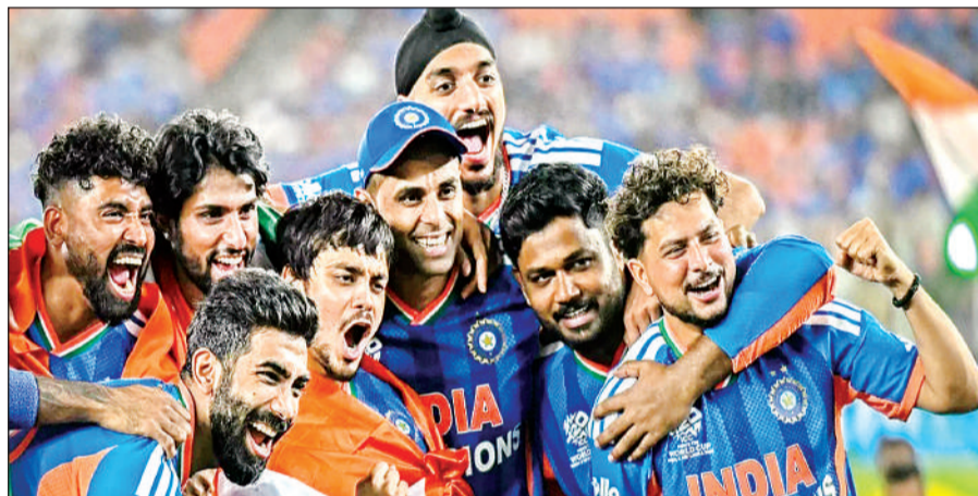
टी-20 विश्व कप विजेता भारतीय टीम।

इस समारोह में उन अन्य भारतीय टीमों को भी सम्मानित किया जाएगा जिन्होंने हाल के दिनों