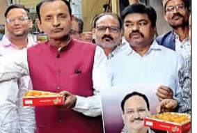
गल्ला मंडी में भी लड्डू बाँटे गए।