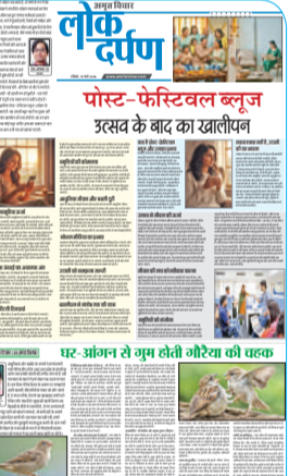
इस बार के रविवारीय संस्करण 'लोक दर्शन' में, पोस्ट-फेस्टिवल ब्लूज उत्सव के बाद का खालीपन व अन्य विषयों पर विशेष सामग्री दी जा रही है।

प्रधानमंत्री मोदी ने पश्चिम बंगाल में टीएमसी पर राष्ट्रपति द्रौपदी मुर्मू का अपमान करके सभी हदें पार करने का आरोप लगाया। मोदी ने कहा कि पार्टी ने न केवल राष्ट्र की प्रमुख का अपमान किया बल्कि देश के आदिवासियों और संविधान का भी अपमान किया। पिछले हफ्ते मुर्मू की उतर बंगाल यात्रा के दौरान पैदा हुए विवाद के बीच मोदी ने ये आरोप लगाए हैं। राष्ट्रपति ने अपने कार्यक्रम का स्थल अंतिम क्षण में बदल दिए जाने पर नाराजगी जताई थी और सवाल उठाया था कि हवाई अड्डे पर उनका स्वागत करने के लिए मुख्यमंत्री ममता या राज्य का कोई मंत्री मौजूद क्यों नहीं था। राज्य सरकार पर तीखा हमला बोलते हुए मोदी ने आरोप लगाया कि बंगाल में वर्तमान सरकार के तहत आदिवासी, दलित और गरीब लोग सबसे ज्यादा प्रभावित हैं।