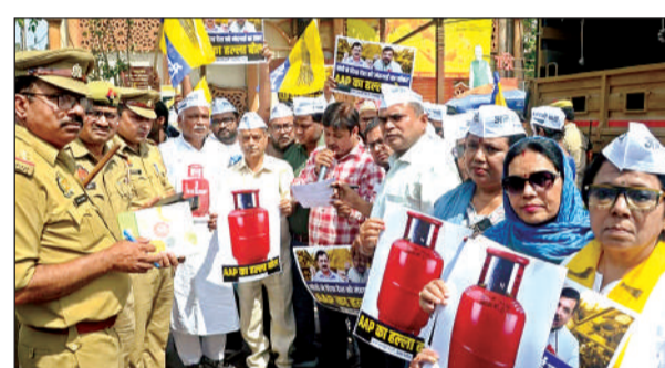
घंटाघर में प्रदर्शन करते आम आदमी पार्टी के कार्यकर्ता।

कहा कि एलपीजी गैस की बढ़ी हुई कीमत और कामशियल गैस सिलेंडर की किल्लत से दुकानों, फैक्ट्रियों, ठेले और खोमके वालों का व्यापार समाप्त हो चुका है, जिससे लाखों