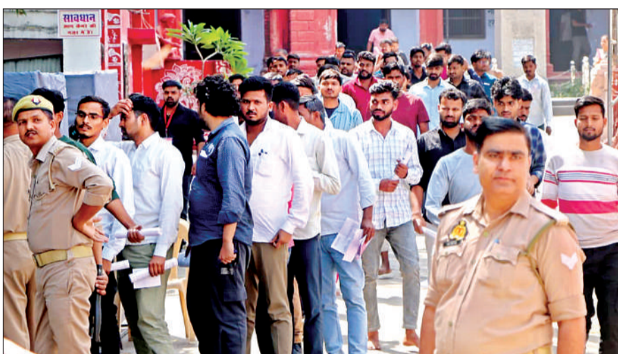
परीक्षार्थियों को कतार में लगाकर जांच के बाद परीक्षा केंद्र में प्रवेश दिया गया।

अमृत विचार। कड़ी सुरक्षा व्यवस्था और सीसीटीवी कैमरों की निगरानी में शनिवार को उपनिरीक्षक (एसआई) व समकक्ष पदों की भर्ती परीक्षा का पहला दिन शांतिपूर्ण ढंग से संपन्न हुआ। परीक्षा केंद्रों पर पहुंचे अभ्यर्थियों की सख्ती से जांच की गई। प्रतिबंधित सामग्री मिलने पर उसे जमा करकर बायोमेट्रिक व रेटीना जांच के बाद ही प्रवेश दिया गया। सुबह करीब 9:30 बजे अभ्यर्थियों को केंद्रों में प्रवेश मिला। उत्तर प्रदेश पुलिस भर्ती एवं प्रोन्नति बोर्ड, लखनऊ की ओर से शनिवार और रविवार को एसआई व समकक्ष पदों की सीधी भर्ती 2025 की लिखित परीक्षा शहर के 53 केंद्रों पर आयोजित की जा रही है। परीक्षा में कुल 77,760 अभ्यर्थी पंजीकृत हैं। पहले दिन की पहली और दूसरी पाली में 19,440-19,440 अभ्यर्थियों को शामिल हुए। सुबह सात बजे से ही अभ्यर्थी अपने परिजनों के साथ केंद्रों के बाहर पहुंचने लगे थे। प्रवेश से पहले