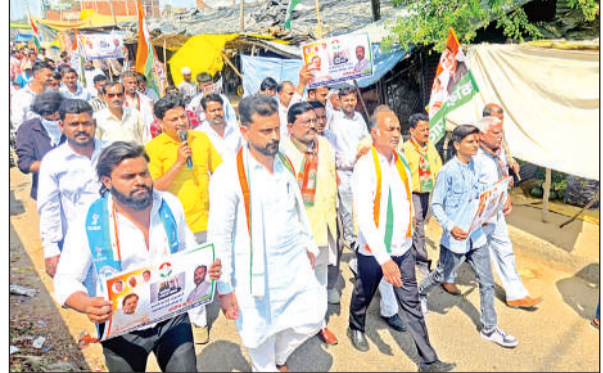
महाराजपुर विधानसभा में निकाली गई पदयात्रा।

अमृत विचार। जिला कांग्रेस कमेटी कानपुर नगर ग्रामीण द्वारा महाराजपुर विधानसभा के सरसौल ब्लॉक में न्याय संकल्प यात्रा निकालकर मनरेगा बचाओ संग्राम अभियान चलाया गया, जिसमें सैकड़ों कांग्रेसी शामिल हुए। एक असें बाद महाराजपुर विधायक क्षेत्र में कांग्रेसी सरगमीं दिखी। पदयात्रा में कांग्रेसी मनरेगा के सम्मान में कांग्रेस मैदान में, मनरेगा को बचाना है तो कांग्रेस को लाना है आदि नारे लगा रहे थे।