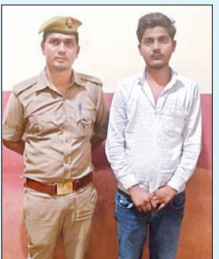
पुलिस गिरफ्त में खड़ा आरोपी।