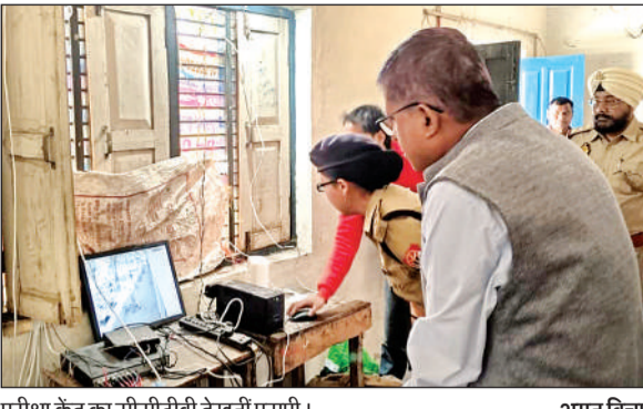
परीक्षा केंद्र का सीसीटीवी देखती एसपी। अमृत विचार

निरीक्षण के दौरान जिलाधिकारी एवं पुलिस अधीक्षक ने परीक्षा केंद्र पर सुरक्षा व्यवस्था, अभ्यर्थियों की प्रवेश व्यवस्था, कक्ष निरीक्षकों की तैनाती, सीसीटीवी निगरानी, स्ट्रॉन्ग रूम की सुरक्षा, प्रश्नपत्रों के सुरक्षित