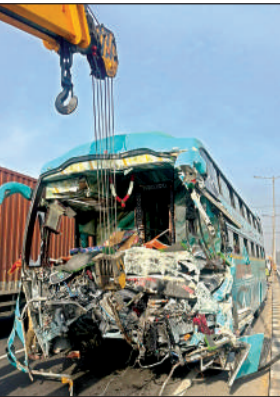
क्रेन से क्षतिग्रस्त बस को हटाया गया।