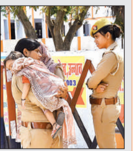
गोद में मासूम बच्चे को लेकर इयूटी करती महिला सिपाही।

शुभम निगम, उन्नाव शहर के डीएसएन कॉलेज में दरोगा भर्ती परीक्षा के दौरान एक भावुक कर देने वाला दृश्य दिखा। यहां सुरक्षा व्यवस्था में तेनात एक महिला सिपाही अपने मासूम बच्चे को गोद में लेकर मुस्तेदी से कर्तव्य निभाती नजर आई। घर पर बच्चे की देखभाल की समस्या के बावजूद उन्होंने इयूटी से मुंह नहीं मोड़ा और ममता व जिम्मेदारी का यह संतुलन केंद्र पर आए परीक्षार्थियों के लिए प्रेरणा का केंद्र बना रहा। सभी ने महिला सिपाही की इस कर्तव्य परायणता की सराहना की।