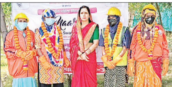
सम्मानित महिला सफाई कर्मियों के साथ मौजूद नगर पालिकाध्यक्ष। अमृत विचार

शुक्लागंज उन्नाव अमृत विचार: अंतर्राष्ट्रीय महिला दिवस पर स्वच्छ भारत मिशन नगरीय के अंतर्गत 8 से 14 मार्च 2026 तक नगर पालिका गंगाघाट द्वारा कई कार्यक्रम आयोजित किए गए। इसका उद्देश्य समाज की आधारस्तंभ महिलाओं, विशेषकर महिला सफाई मित्रों के योगदान को सम्मानित करना व उनके स्वास्थ्य व अधिकारों के प्रति जागरूक करना रहा। इस दौरान शनिवार को गगनी खंडा स्थित एमआरएफ सेंटर में महिला सफाई कर्मियों के सामान्य स्वास्थ्य परीक्षण कराए गए और सफाई कार्य के दौरान होने वाली संभावित बीमारियों से बचाव के लिए चिकित्सीय परामर्श दिए गए। साथ ही उज्ज्वला योजना और कन्या सुमंगला योजना जैसी सरकारी योजनाओं की जानकारी दी गई। समारोह में अध्यक्ष ने उक्तुष्ट कार्य करने वाली महिला सफाई मित्रों को पुष्पहार पहनाकर सम्मानित किया और एमआरएफ सेंटर के संचालन में उन्हें प्राथमिकता देने का आश्वासन दिया।