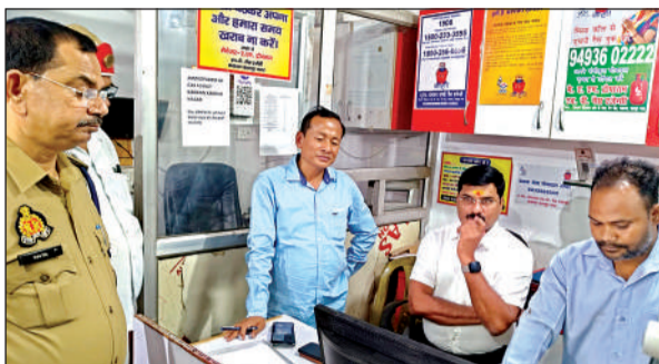
गैस एजेंसी की जांच पड़ताल करते अधिकारी।

अमृत विचार। ग्रामीण इलाकों में गैस सिलेंडरों की बुकिंग को लेकर उपभोक्ताओं की परेशानियां कम होने का नाम नहीं ले रही हैं। ओटीपी आधारित बुकिंग सिस्टम का पूरी तरह पालन न होना और सर्वर की धोमी गति वर्तमान में सबसे बड़ी बाधा बनकर उभरी है। शनिवार को बिल्हौर तहसील क्षेत्र के कई छोटे-बड़े कस्बों में गैस एजेंसी पर ग्राहकों की लंबी भीड़ नजर आई। वहीं लोग गैस खोजने की अफवाह में और भी ज्यादा पैनिक नजर आ रहे हैं, जिसके लिए तहसील के अधिकारी भी फील्ड पर उतरकर लोगों को समझाते दिखे। शनिवार को क्षेत्र में रसोई गैस