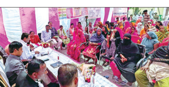
चौपाल में लोगों ने साझा की समस्याएं।