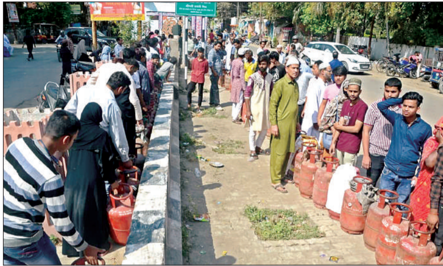
शनिवार को लाजपत नगर में गैस के लिए लंबी कतार लगी रही।