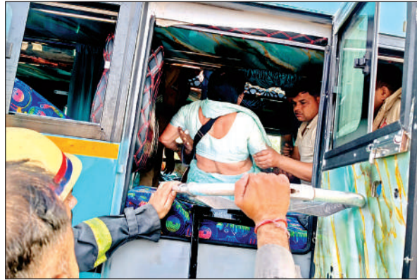
आपातकालीन खिड़की से घायल महिला को निकालती पुलिस।