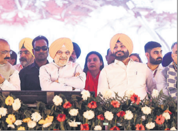
पंजाब के मोगा में बदलाव रैली के दौरान मंच पर भाजपा नेताओं तरुण चुध, रवनीत सिंह बिट्टू और अन्य नेताओं के साथ केंद्रीय गृह मंत्री अमित शाह दिखाई दे रहे हैं।

मोगा (पंजाब), एजेंसी केंद्रीय गृह मंत्री अमित शाह ने कानून-व्यवस्था, नशे की समस्या, धर्मांतरण और भ्रष्टाचार जैसे मुद्दों पर शनिवार को पंजाब की भगवंत मान सरकार पर निशाना साधा और आरोप लगाया कि यह सरकार आम आदमी पार्टी (आप) के प्रमुख अरविंद केजरीवाल के लिए एक एटीएम बन गई है। उन्होंने मतदाताओं से अपील की कि वे 2027 के विधानसभा चुनाव में भाजपा को एक मौका दें ताकि राज्य में बदलाव लाया जा सके।