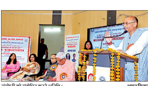
संगोष्ठी को संबोधित करते अतिथि।