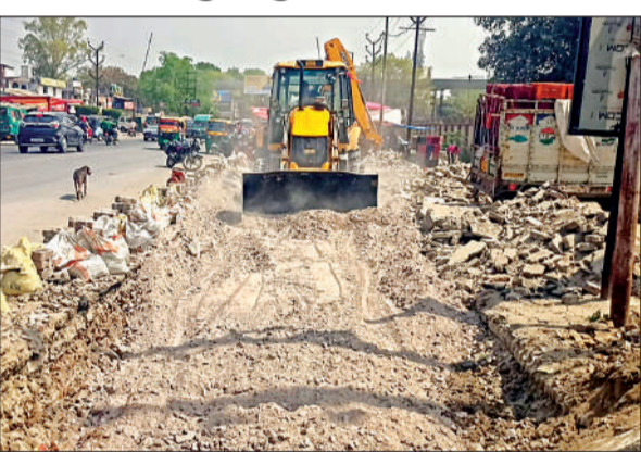
विजय नगर चौराहे के पास सड़क चौड़ीकरण शुरू हुआ। अमृत विचार

अमृत विचार। विजय नगर चौराहा से भौती बाईपास तिराहे तक लगने वाले जाम से लाखों लोगों को छुटकारा दिलाने के लिए मार्ग को फोरलेन करने का काम शुरू हो गया। शासन से बजट पास होने के बाद लोक निर्माण विभाग ने चौड़ीकरण का कार्य शुरू किया। वर्तमान में यहाँ पर सड़क के किनारे खोदाई का कार्य किया जा रहा है और बुलडोजर व रोलर से गिट्टी आदि का समतलीकरण का कार्य शुरू हो गया है।