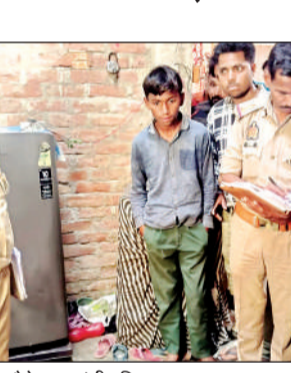
घटना के बाद मौके पर पहुंची पुलिस।