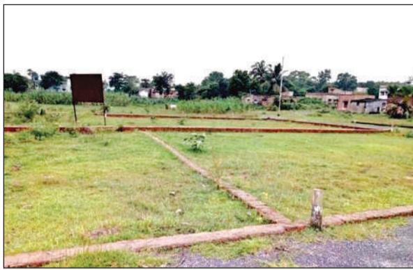
कृषि भूमि पर की गई प्लांटिंग।

हालत यह है कि सोना उगलने वाली भूमि अब हरी भरी न रहकर बंजर सी हो गई है। इस भूमि पर