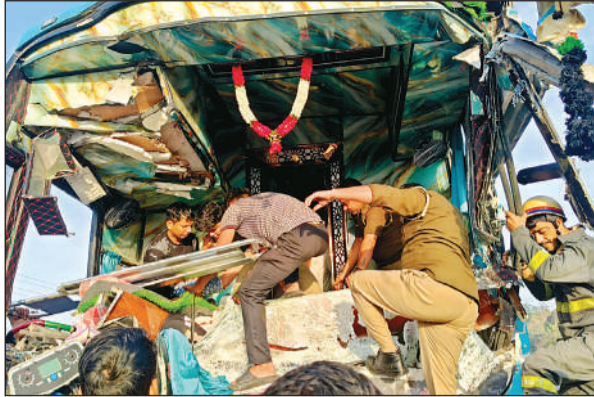
दुर्घटनाग्रस्त बस से घायलों को निकालती पुलिस।