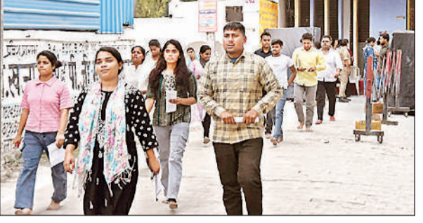
परीक्षा देकर केंद्र से निकलते परीक्षार्थी। अमृत विचार तलाशी का कार्य कर सके। बता दें कि शहर के डॉ. जीनाथजी दयाल बालिका इंटर कॉलेज, अटल बिहारी इंटर कॉलेज, श्याम कुमारी सेठ बालिका

कार्यालय संवाददाता उन्नाव रहे। जबकि द्वितीय पाली में 2400 परीक्षार्थियों में 1644 उपस्थित व 756 अनुपस्थित रहे। इस प्रकार दोनों पालियों में 4800 छात्रों में 3258 उपस्थित व 1542 अनुपस्थित रहे। सीसीटीवी कैमरा की निगरानी में स्टेटिक मजिस्ट्रेट लेकर परीक्षा में सम्मिलित होने का जायजा लेते हुए मातहतों को जरूरी निर्देश दिये। परीक्षा केंद्रों में प्रवेश के समय जिन परीक्षार्थियों के बायोमेट्रिक नहीं हो सके उन्हें भी लिखित लेकर परीक्षा में सम्मिलित होने की अनुमति दी गई। फिर भी प्रथम पाली में 2400 परीक्षार्थियों में 1614 उपस्थित व 786 अनुपस्थित