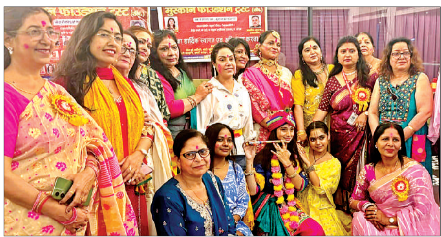
मुस्कान फाउंडेशन की ओर से आयोजित कार्यक्रम में भाग लेती महिलाएं।