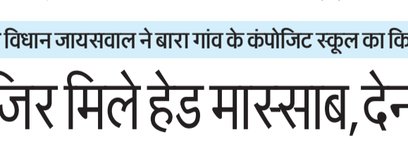
निरीक्षण के दौरान बच्चों से पढ़न-पाठन के बारे में जानकारी लेते सीडीओ।

गतिविधियों, व्यवस्थाओं एवं साफ-सफाई की स्थिति का जायजा लिया। निरीक्षण के समय मुख्य विकास अधिकारी ने कक्षाओं में जाकर बच्चों से बातचीत की तथा उनकी शैक्षिक गुणवत्ता का आकलन किया। उन्होंने अध्यापकों को निर्देशित किया कि