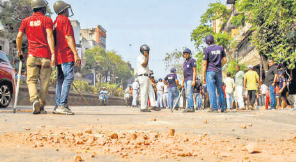
मध्य कोलकाता में शनिवार को प्रधानमंत्री मोदी की रैली के पूर्व भाजपा और तृणमूल कांग्रेस कार्यकर्ताओं के बीच झड़प के बाद सड़क पर बिखरी ईंटें और मौजूद पुलिस।

●मंत्री के घर पर भी पथराव, भाजपा नेता व एक पुलिस अफसर घायल कोलकाता, एजेंसी मध्य कोलकाता में शनिवार को प्रधानमंत्री नरेन्द्र मोदी की रैली से करीब आधा घंटा पहले तृणमूल कांग्रेस (टीएमसी) और भारतीय जनता पार्टी के समर्थकों के बीच झड़प हुई, जिसमें एक पुलिस अधिकारी और भाजपा के एक नेता घायल हो गए। झड़प के बीच, यह आरोप भी सामने आया कि गिरिश पार्क इलाके में पश्चिम बंगाल की मंत्री शशि पांजा के आवास पर पथराव किया गया। यह झड़प रैली स्थल से लगभग पांच किलोमीटर दूर उस समय हुई जब भाजपा समर्थक प्रधानमंत्री की रैली में शामिल होने