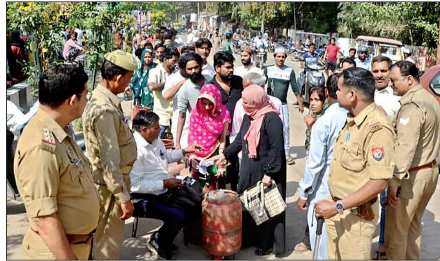
जेके मंदिर के पास पुलिस की मौजूदगी में गैस सिलेंडर बांटे गए।