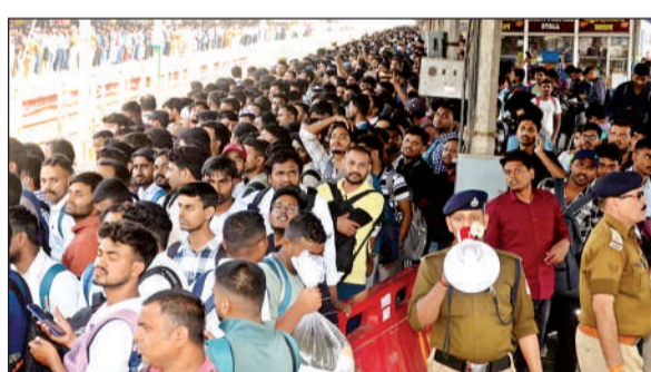
सेंट्रल स्टेशन परीक्षार्थियों की भीड़।

अमृत विचार। डायरेक्ट रिक्रूटमेंट पुलिस परीक्षा 14 व 15 मार्च को प्रस्तावित है, पहले दिन शनिवार को अतिरिक्त भीड़ को देखते हुए रेलवे ने कई विशेष ट्रेनें चलाई हैं लेकिन उसके बाद भी कई ट्रेनों के आरक्षण कोच में परीक्षार्थियों की भीड़ घुस गयी जिन्हें निकालने में जीआरपी और आरपीएफ को पसीने छूट गए। शनिवार को पुलिस परीक्षा को देखते हुए झांसी से कानपुर के लिए दो विशेष ट्रेनें चलाई गईं, इसके बाद भी लखनऊ, झांसी, आगरा, इटावा की ओर जाने वाली ट्रेनों के आरक्षण कोच में जबरन परीक्षार्थियों की भीड़