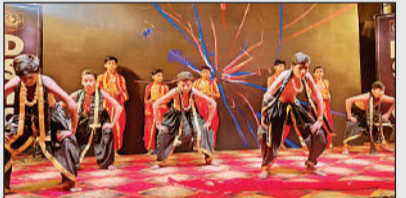
दयानंद स्कूल में होता रंगारंग कार्यक्रम।