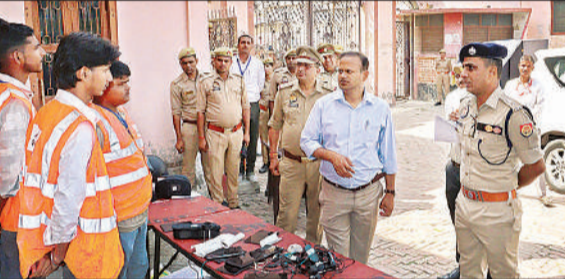
डीएवी पीजी कॉलेज में निरीक्षण करते डीएम और एसपी।