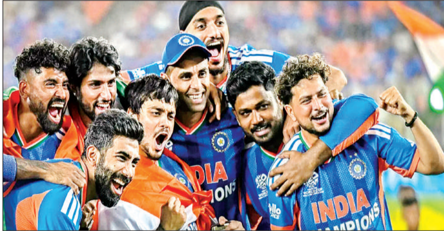
टी-20 विश्व कप विजेता भारतीय टीम।

इस समारोह में उन अन्य भारतीय टीमों को भी सम्मानित किया जाएगा जिन्होंने हाल के दिनों