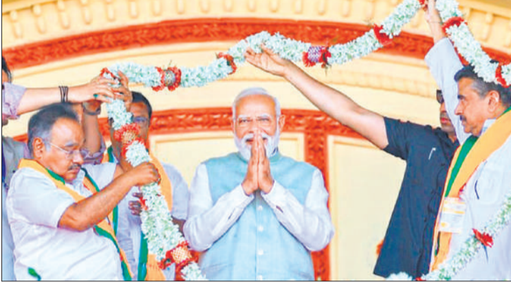
कोलकाता के ब्रिगेड परेड ग्राउंड में एक रैली के दौरान प्रधानमंत्री नरेंद्र मोदी को माला पहनाते भाजपा नेता।

प्रधानमंत्री मोदी ने असम में विधानसभा चुनावों से पहले सिलचर में शनिवार को 23,550 करोड़ रुपये की परियोजनाओं की शुरुआत की। वहीं पश्चिम बंगाल में 18,680 करोड़ की विभिन्न परियोजनाओं की शुरुआत करते हुए कहा कि राज्य से भारत के विकास का नया अध्याय लिखा जा रहा है। उन्होंने सिलचर में कहा, उसके (कांग्रेस) पास न तो असम के लिए कोई दूरदृष्टि है और न ही राष्ट्र के लिए वे (कांग्रेस नेता)