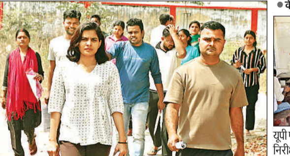
मेथोडिस्ट गर्ल्स इंटर कॉलेज से एसआई की परीक्षा देकर निकलते परीक्षार्थी।

अमृत विचार: जिले में शनिवार को हुई पुलिस उप निरीक्षक भर्ती परीक्षा (एसआई) 5755 अभ्यर्थियों ने दी और 2405 ने छोड़ दी इस प्रकार कुल 29 फीसदी परीक्षार्थियों ने परीक्षा छोड़ दी। परीक्षा केंद्रों पर कड़ी सुरक्षा के लिए बड़ी संख्या में फोर्स की तैनाती की गई। केंद्रों पर मजिस्ट्रेटों की मौजूदगी रही। उत्तर प्रदेश पुलिस भर्ती एवं प्रोन्नति बोर्ड से जिले के 12 परीक्षा केंद्रों पर उप निरीक्षक परीक्षा के पहले दिन दो पालियों में आयोजित की गई। पहली पाली में 4080 में से 2849 अभ्यर्थी उपस्थित और 1231 अनुपस्थित। दूसरी पाली में 4080 में से 2906 अभ्यर्थी परीक्षा में उपस्थित हुए जबकि 1174 अनुपस्थित रहे। दोनों पालियों की परीक्षा में औसतन 29.47 फीसदी परीक्षार्थी अनुपस्थित रहे।