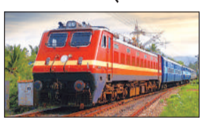
वर्ष 2020 में कोरोना के दौरान नकहा जंगल से लखनऊ तक चलने वाली इस पैसेंजर ट्रेन का संचालन बंद कर दिया गया था। संभावित समय सारिणी के अनुसार प्रस्तावित 55061 पैसेंजर नकहा जंगल से रात करीब 11 बजे प्रस्थान करेगी और गोंडा, जरवल रोड, धाघरा घाट, चौकाघाट, बुढ़वल जंक्शन, बाराबंकी, सफेदाबाद और बादशाहनगर होते हुए सुबह 9:25 बजे डालीगंज रेलवे स्टेशन पहुंचेगी। वहीं वापसी में 55062 पैसेंजर डालीगंज से शाम 5:20 बजे रवाना होगी।

बाराबंकी: अमृत विचार : यात्रीगण कृपया ध्यान दें, गोंडा पैसेंजर ट्रेन कुछ ही मिनटों में आने वाली है...का एनाउंसमेंट फिर से सुनने को मिलेगा। लखनऊ से बलरामपुर वाया गोंडा होकर सफर करने वाले रेल यात्रियों के लिए छह साल से बंद पड़ी लखनऊ गोंडा पैसेंजर ट्रेन के संचालन को हरी झंडी मिल गई है। ट्रेन चारबाग के बजाय डालीगंज से चलेगी।