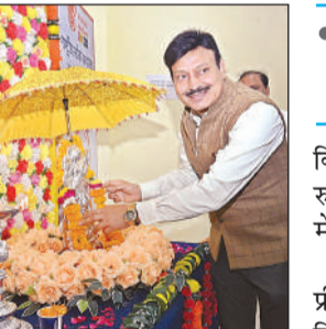
राष्ट्रीय लोक अदालत का शुभारंभ करते जनपद न्यायाधीश रणजय कुमार वर्मा।

अमृत विचार : कचहरी में आयोजित राष्ट्रीय लोक अदालत का शुभारंभ जनपद न्यायाधीश रणजय कुमार वर्मा ने किया। उन्होंने कहा कि लोक अदालत की मूल भावना में लोक कल्याण की भावना समाहित है। अपर जिला जज/नोडल अधिकारी राष्ट्रीय लोक अदालत दीपक यादव और जिला विधिक सेवा प्राधिकरण की सचिव रंजिनी शुक्ला के अनुसार राष्ट्रीय लोक अदालत में कुल 81803 वादों को निस्तारित किया गया। कुल समझौता राशि रु.1823350335 रुपये है। इसमें पीठासीन अधिकारी