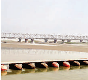
प्रगति पर पीपलुल का निर्माण कार्य।