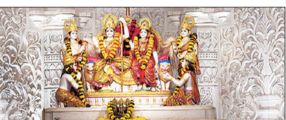
प्रथम तल पर सजा राजा राम का दरबार।

अमृत विचार : राम मंदिर में पहली बार सिया संग विराजमान राजाराम का भी जन्मोत्सव मनाया जाएगा। राजाराम नौ दिनों तक व्रत रखेंगे। 19 मार्च से प्रारंभ हो रहे चैत्र शुक्ल नवरात्रि पर नौ दिनों तक भव्य श्रृंगार होगा। सुंदर झांकी सजाई जाएगी, और इस दौरान प्रति दिन फलहार व्यंजनों का भोग भी लगाया जाएगा। राममंदिर में रामलला के जन्मोत्सव की भव्य तैयारी है। पहली बार भूतल पर विराजमान रामलला के साथ प्रथम तल पर राम दरबार के भी अलौकिक दर्शन प्राप्त होंगे। फूलों से पूरे गर्भगृह को सजाया जाएगा। रामनवमी पर बाल स्वरूप श्री रामलला पंचामृत से अभिषेक होंगे। बेशुमार डिजाइन से तैयार पिला वस्त्र धारण करेंगे। हीरा, पन्ना जड़ित स्वर्ण मुकुट और हार को भी धारण करेंगे। वहीं इस दौरान दोपहर 12 बजे राम मंदिर के साथ