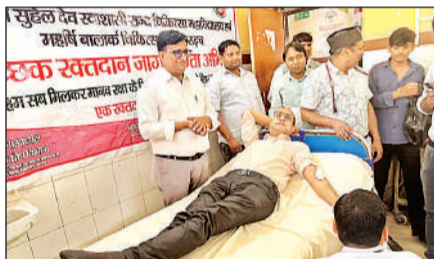
कैसरगंज सीएचसी में रक्तदान करते लोग।