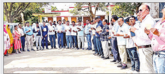
पत्र भेजते शिक्षक।