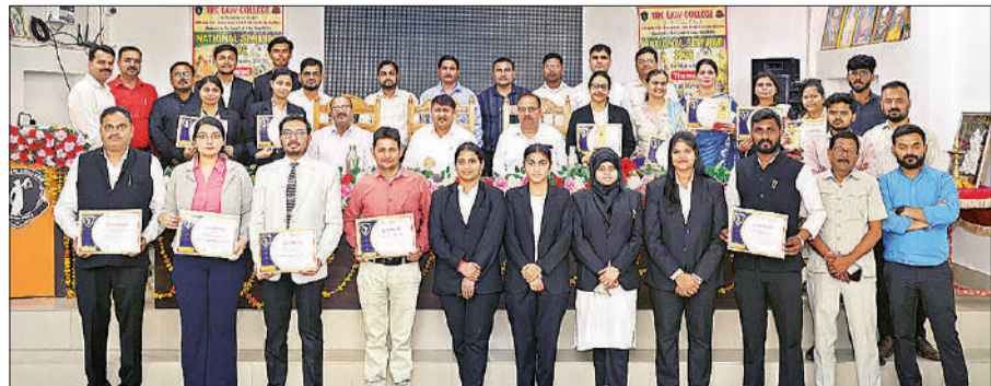
सम्मानित प्रतिभागियों के साथ प्राचार्य व अन्य।