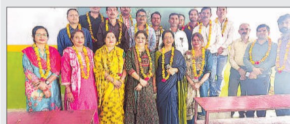
बैठक के दौरान कार्यकारिणी के पदाधिकारी।