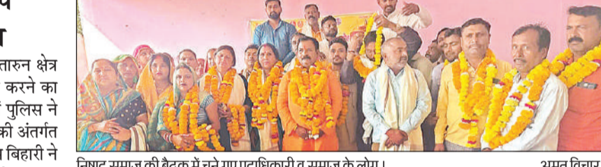
निषाद समाज की बैठक में चुने गए पदाधिकारी व समाज के लोग।