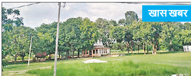
पांडितपुर स्थित श्रद्धेय स्मरण की तपोस्थली।