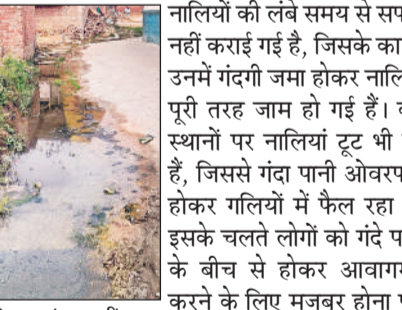
चौक नालिया बर्बाद कर रही नगर पंचायत की दास्ता।

अमृत विचार । नगर पंचायत जहांगीरगंज क्षेत्र के मोहल्ला हेमराजपुर घोसियाना में नालियों की नियमित सफाई न होने के कारण गंदगी की गंभीर समस्या उत्पन्न हो गई है। नालियां गंदगी से भरकर बजबजा रही हैं और उनका गंदा पानी और कचरा गलियों से बाहर बह रहा है, जिससे स्थानीय लोगों को भारी परेशानी का सामना करना पड़ रहा है। स्थानीय लोगों ने कई बार नगर पंचायत जहांगीरगंज में शिकायत किया, लेकिन जिम्मेदार अधिकारी इस ओर ध्यान नहीं दे रहे हैं।