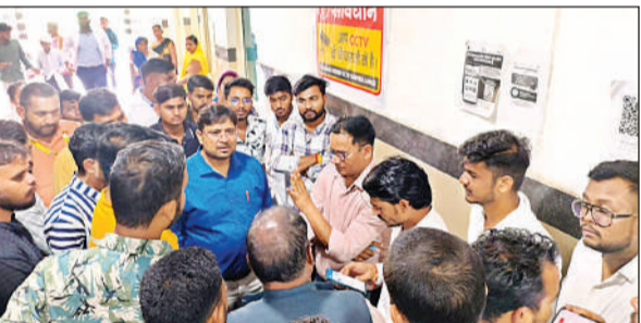
ट्रामा सेंटर में परिजनों से बातचीत करते चिकित्सक।

अमृत विचार : दर्शननगर स्थित राजर्षि दशरथ मेडिकल कॉलेज के डिप्लोमा छात्र की संदिग्ध परिस्थितियों में मौत हो जाने का मामला सामने आया है। पेट दर्द की शिकायत के बाद उसे ट्रामा सेंटर में भर्ती कराया गया था। पोस्टमार्टम न कराने की मांग को लेकर चिकित्सक-स्टाफ व परिजनों के बीच नोकझोंक हुई। बड़ी संख्या में विद्यार्थी घंटों वहीं जमे रहे। पुलिस की मौजूदगी में शव को पोस्टमार्टम के लिए भेजा गया। सुल्तानपुर के दोस्तपुर निवासी