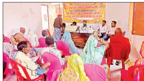
कैप में इलाज कराते ग्रामीण।