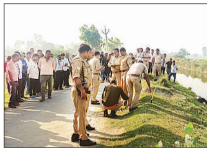
घटनास्थल पर जांच करती पुलिस टीम व इकट्ठा ग्रामीण।