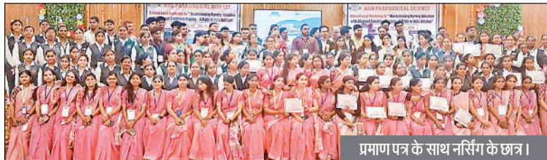
प्रमाण पत्र के साथ नर्सिंग के छात्र।