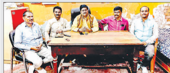
बैठक करते शिक्षक नेता।