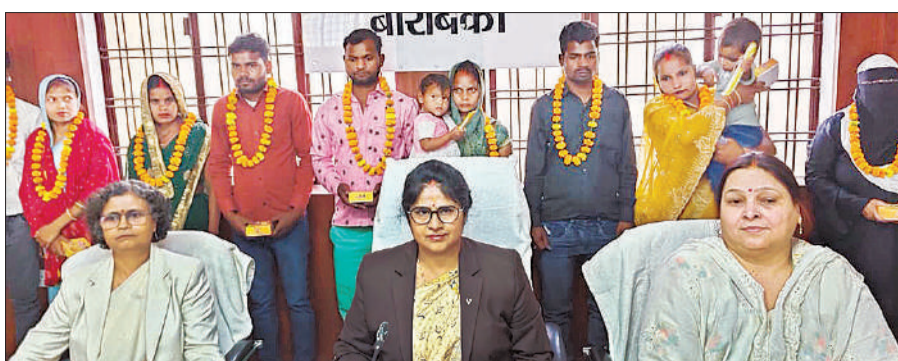
जनपद न्यायाधीश व पारिवारिक विवाद के निपटारे के बाद दंपति।

स्तर पर वैवाहिक, राजस्व, बैंक और विभिन्न विभागों के 1,41,993 मामलों का निस्तारण कर 22,94,93,239 रुपये वसूले गए। पारिवारिक न्यायालयों ने 197 मामलों का निस्तारण किया। मोटर दुर्घटना दावा अधिकरण द्वारा 143 मुकदमों का निस्तारण कर 9,06,72,076 रुपये प्रतिफल राशि के रूप में वसूले गए। सभी मजिस्ट्रेट न्यायालयों ने 32,467 मुकदमों का निस्तारण कर 37,30,570 रुपये वसूले। इसमें सुधा सिंह, सीजेएम बाराबंकी ने सर्वाधिक 10,619 मुकदमों का निस्तारण कर 4,62,100/- रुपये वसूले। दीवानी न्यायालयों ने 147 वादों का निस्तारण किया, जिसमें