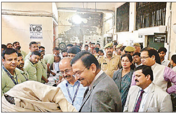
लोक अदालत के दौरान मौजूद न्यायाधीश राजेश कुमार सिंह व अन्य अधिकारी।

अमृत विचार। जिला विधिक सेवा प्राधिकरण, बहराइच के अध्यक्ष/जनपद न्यायाधीश राजेश कुमार सिंह के नेतृत्व में आयोजित राष्ट्रीय लोक अदालत में 01 लाख 90 हजार 387 वादों का निस्तारण किया गया। राष्ट्रीय लोक अदालत का शुभारम्भ दीवानी न्यायालय परिसर में स्थित सभागार में जनपद न्यायाधीश/अध्यक्ष, जिला विधिक सेवा प्राधिकरण, बहराइच राजेश कुमार सिंह द्वारा दीप प्रज्वलित कर किया गया। इस दौरान उन्होंने संबंधित अधिकारियों को लोगों की समस्या का समाधान निर्धारित समय से करने के निर्देश दिए। राष्ट्रीय लोक अदालत में कुल 190387 वादों का निस्तारण किया गया। जिसमें