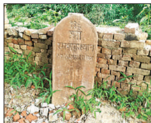
श्रद्धेय स्मरण की तपोस्थली पर लगा एडवर्ड शिलालेख।