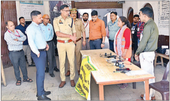
परीक्षा के दौरान निरीक्षण करते डीएम व एस्प्री।