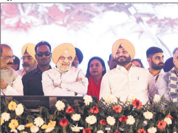
पंजाब के मोगा में बदलाव रैली के दौरान मंच पर भाजपा नेताओं तरुण चुध, रवनीत सिंह बिट्टू और अन्य नेताओं के साथ केंद्रीय गृह मंत्री अमित शाह दिखाई दे रहे हैं।

मोगा में एक बदलाव रैली में चुनावी बिगुल बजाते हुए भाजपा के वरिष्ठ नेता शाह ने राज्य के लोगों से कहा कि उन्होंने कांग्रेस, अकाली दल और 'आप' को कई मौके दिए हैं। शाह ने आरोप लगाया, आज पंजाब कर्ज, नशे, धर्मांतरण, भ्रष्टाचार और गैंगस्टर्स के आतंक के कारण बर्बाद हो गया है। उन्होंने कहा कि यदि कोई पंजाब को नशे और अन्य समस्याओं से मुक्त कर सकता है, तो वह केवल नरेन्द्र