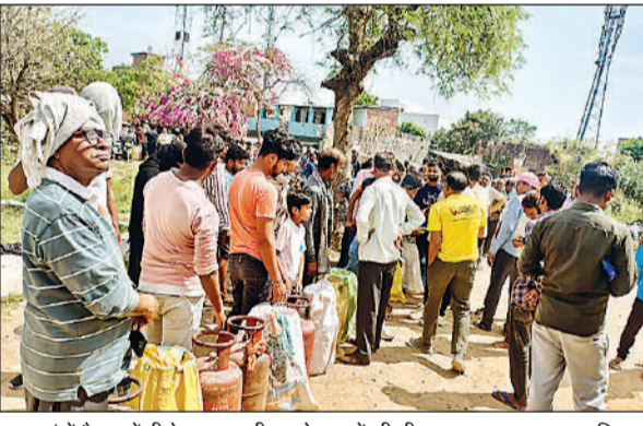
बछरावां में गैस एजेंसी के बाहर लगी उपभोक्ताओं की भीड़। अमृत विचार

अमृत विचार। नीते एक सप्ताह से गैस सिलेंडर लेने के लिए उपभोक्ता सुबह से ही लंबी-लंबी लाइनें लगाकर सिलेंडर पाने का प्रयास कर रहे हैं। सिलेंडर के लिए भारी भीड़ होने के चलते लोगों को परेशानी उठानी पड़ रही है। धूप में उपभोक्ता 6 से 7 घंटे तक गैस सिलेंडर पाने के लिए इंतजार करते हैं, इसके बावजूद अधिकारिता उपभोक्ताओं को गैस नहीं मिल पा रही है। जिस कारण गैस सिलेंडर लेने वाले उपभोक्ताओं में आक्रोश व्याप्त है।