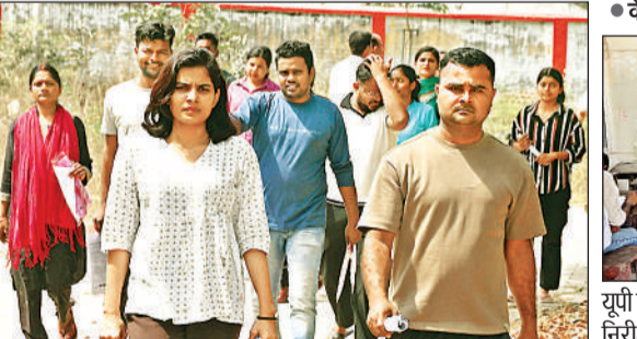
मेथोडिस्ट गर्ल्स इंटर कॉलेज से एसआई की परीक्षा देकर निकलते परीक्षार्थी।

अमृत विचार: जिले में शनिवार को हुई पुलिस उप निरीक्षक भर्ती परीक्षा (एसआई) 5755 अभ्यर्थियों ने दी और 2405 ने छोड़ दी इस प्रकार कुल 29 फीसदी परीक्षार्थियों ने परीक्षा छोड़ दी। परीक्षा केंद्रों पर कड़ी सुरक्षा के लिए बड़ी संख्या में फोर्स की तैनाती की गई। केंद्रों पर मजिस्ट्रेटों की मौजूदगी रही।