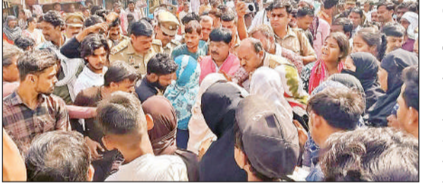
मौके पर मौजूद पुलिस व लोग व मुजीब की फाइल फोटो।

फतेहपुर चौरासी उन्नाव, अमृत विचार। सवारियों के इंतजार में खड़े ऑटो चालक को तेज रफ्तार ट्रक ने टक्कर मार दी। इसमें उसकी मौके पर मौत हो गई। पुलिस ने शव को पोस्टमार्टम के लिए भेजा है।