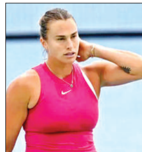
एरिना सबालेंका व एलेना रयबाकिना।

बेलारूस की शीर्ष वरीयता प्राप्त खिलाड़ी सबालेंका ने शुक्रवार रात बीएनपी पारिबास ओपन में नोस्कोवा को एक घंटे 28 मिनट में हराया। रविवार को फाइनल में उनका मुकाबला कजाकिस्तान की तीसरे नंबर की खिलाड़ी एलेना रिबाकिना से होगा। रिबाकिना ने दूसरे सेमीफाइनल में यूक्रेन की नौवें नंबर की खिलाड़ी एलिना स्वितोलिना को