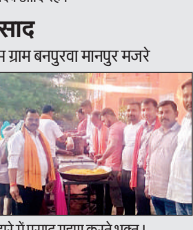
भंडारे में प्रसाद ग्रहण करते भक्त।