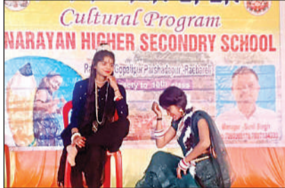
वार्षिकोत्सव में कार्यक्रम प्रस्तुत करते बच्चे।