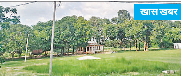
पंडितपुर स्थित श्रद्धि रमणक की तोपस्थली।

शिलालेख लगाए गए थे। इनमें कई स्थानों के शिलालेख गायब हो गए लेकिन अधिसंख्य स्थानों पर यह आज भी मौजूद है। वर्ष 2018 में प्रकाशित अयोध्या के 84 कोस पर आधारित शोध ग्रंथ 'अहो अयोध्या' में इन स्थानों को खोजकर तत्समय की स्थिति और पौराणिकता को नए