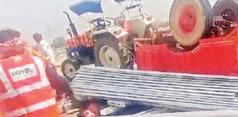
एक्सप्रेस-वे पर पलटी पड़ी ट्रैक्टर-द्राली।

बहेटामुजावर थानाक्षेत्र में निर्माणाधीन गंगा एक्सप्रेस-वे का निर्माण लगभग समाप्त होने को है। कार्यवाई संस्थाएं कार्य को अंतिम रूप देने में लगी हैं। शनिवार दोपहर ट्रैक्टर ट्रॉली से लोहे के एंगल लादकर मजदूर प्रयागराज से मेरठ जा रहे थे। तभी