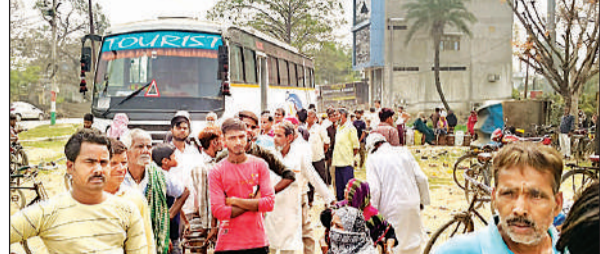
गैस एजेंसी के बाहर अपने नंबर की प्रतीक्षा करते उपभोक्ता।