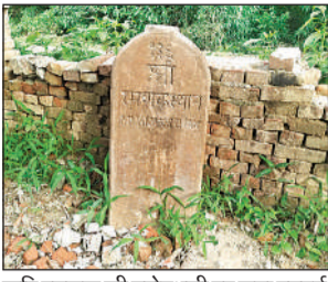
श्रद्धि रमणक की तोपस्थली पर लगा एडवर्ड शिलालेख।

अयोध्या की 84 कोसी परिधि में अयोध्या, गोंडा, बस्ती और अंबेडकरनगर में कुल 151 तीर्थ स्थल चिह्नित किए गए थे। इनमें से 148 स्थानों पर वर्ष 1902 में एडवर्ड