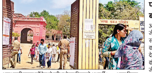
आरआरडी इण्टर कॉलेज से परीक्षा देकर निकलते अभ्यर्थी।