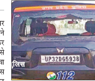
पीआरवी वाहन का टूटा शीशा।