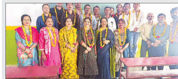
बैठक के दौरान कार्यकारिणी के पदाधिकारी।