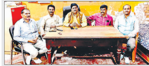
बैठक करते शिक्षक नेता।