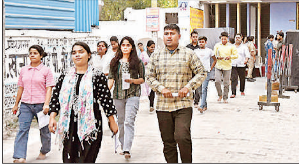
परीक्षा देकर केंद्र से निकलते परीक्षार्थी।

रहे। जबकि द्वितीय पाली में 2400 परीक्षार्थियों में 1644 उपस्थित व 756 अनुपस्थित रहे। इस प्रकार दोनों पालियों में 4800 छात्रों में 3258 उपस्थित व 1542 अनुपस्थित रहे। सीसीटीवी कैमरा की निगरानी में स्टेटिक मजिस्ट्रेट के केंद्रों का निरीक्षण कर व्यवस्थाओं को एसडीएम, एडीएम, एएसपी स्तर के अधिकारी सभी 8 केंद्रों में गस्त करते रहे। जिनकी ड्यूटी केंद्रों में पहले से ही लगी थी। हर केंद्र में इतना फोर्स था जितने परीक्षार्थी थे। महिला परीक्षार्थियों की संख्या अधिक होने से लखनऊ से अतिरिक्त फोर्स बुलाया गया था। ताकि महिला परीक्षार्थियों को