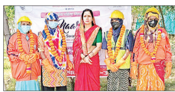
सम्मानित महिला सफाई कर्मियों के साथ मौजूद नगर पालिकाध्यक्ष।

इस दौरान शनिवार को गगनी खेड़ा स्थित एमआरएफ सेंटर में महिला सफाई कर्मियों के सामान्य स्वास्थ्य परीक्षण कराए गए और सफाई कार्य के दौरान होने वाली संभावित बीमारियों से बचाव के लिए चिकित्सीय परामर्श दिए गए। साथ ही