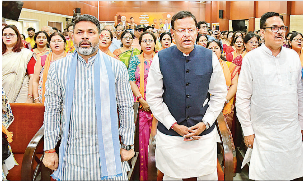
प्रधानमंत्री नरेंद्र मोदी की कोलकाता में आयोजित जनसभा के लाइव प्रसारण को सुनने के लिए लखनऊ स्थित भाजपा मुख्यालय में बंगाली समाज के प्रतिनिधि एकत्र हुए। इस अवसर पर भारतीय जनता पार्टी के प्रदेश अध्यक्ष एवं केंद्रीय वित्त राज्य मंत्री पंकज चौधरी समेत अन्य पार्टी नेता मौजूद रहे।