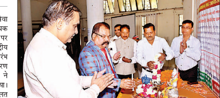
राष्ट्रीय लोक अदालत का शुभारंभ करते जिला जज।

जिला जज ने कहा कि लोक अदालत का उद्देश्य अधिक से अधिक वाद सुलह समझौते के आधार पर निस्तारित किया जाना है। इससे लोगों को कोर्ट कचहरी की दौड़ लगाने से राहत मिलेगी। लोक अदालत में विभिन्न न्यायालयों में लंबित व प्री-लिटिगेशन मामलों का निस्तारण