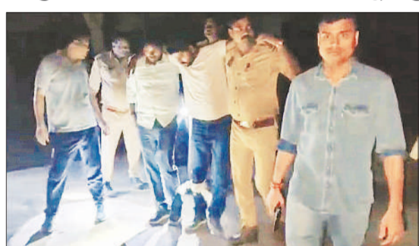
मुठभेड़ में घायल बदमाश को लाती पुलिस।

अमृत विचार : स्वाट व असद्रा थाना पुलिस की एक बदमाश से मुठभेड़ हो गई। बदमाश की चलाई गोली स्वाट प्रभारी के कान छूकर निकल गई, जिससे वह बाल बाल बचे। हालांकि जवाबी फायरिंग से इनामिया अभियुक्त घायल हो गया और उसे सीएचसी में भर्ती कराया गया है।