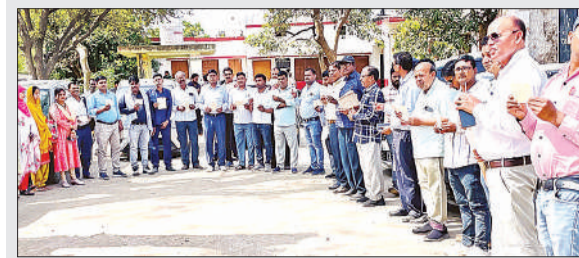
पत्र भेजते शिक्षक।