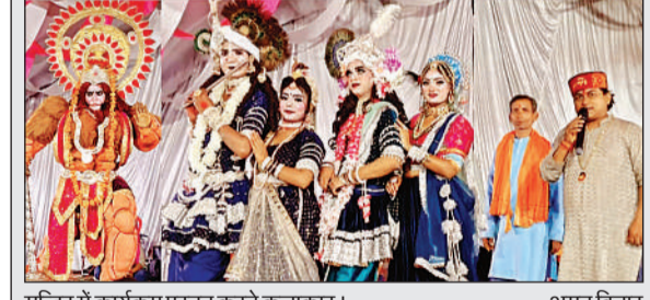
मंदिर में कार्यक्रम प्रस्तुत करते कलाकार।