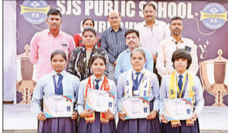
कार्यक्रम में पुरस्कृत किए गए बच्चे। अमृत विचार