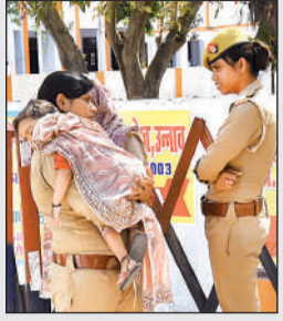
गोद में मासूम बच्चे को लेकर ड्यूटी करती महिला सिपाही।

शहर के डीएसएन कॉलेज में दरोगा भर्ती परीक्षा के दौरान एक भावुक कर देने वाला दृश्य दिखा। यहां सुरक्षा व्यवस्था में तेनात एक महिला सिपाही अपने मासूम बच्चे को गोद में लेकर मुस्तेदी से कर्तव्य निभाती नजर आई। घर पर बच्चे की देखभाल की समस्या के बावजूद उन्होंने ड्यूटी से मुंह नहीं मोड़ा और ममता व जिम्मेदारी का यह संतुलन केंद्र पर आए परीक्षार्थियों के लिए प्रेरणा का केंद्र बना रहा। सभी ने महिला सिपाही की इस कर्तव्य परायणता की सराहना की।