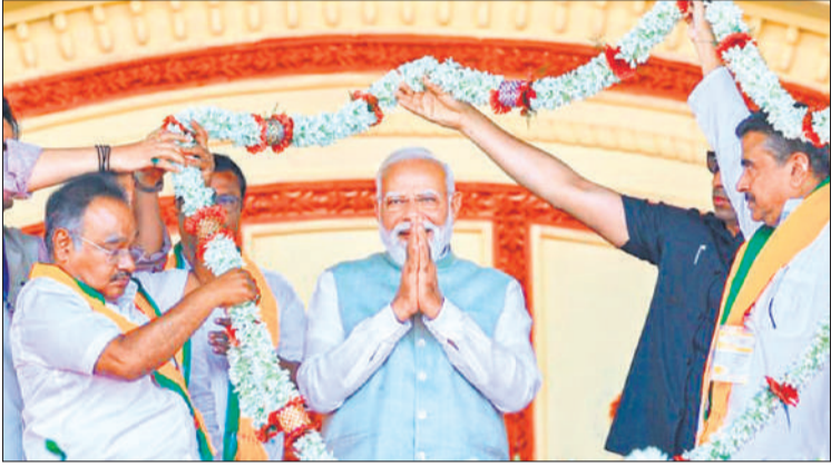
कोलकाता के ब्रिगेड परेड ग्राउंड में एक रैली के दौरान प्रधानमंत्री नरेंद्र मोदी को माला पहनाते भाजपा नेता।

प्रधानमंत्री ने शनिवार को असम के सिलचर में रैली को संबोधित करते हुए कहा कि केंद्र सरकार वैश्विक संघर्षों के कारण लोगों पर पड़ने वाले प्रभावों को कम करने के लिए काम कर रही है। साथ ही आरोप लगाया कि विपक्षी पार्टी कांग्रेस देश में दहशत पैदा करने की कोशिश करके गैर-हिंसेद्वारा व्यवहार कर रही है। कांग्रेस को एक हिंसेद्वारा राजनीतिक दल की भूमिका निभानी चाहिए थी लेकिन वह ऐसा करने में विफल रही। वह आज झूठे वादों की दुकान बन चुकी है और दहशत फैलाने की कोशिश कर रही है।