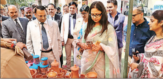
लोक अदालत में स्टाल का जायजा लेते न्यायाधीश।