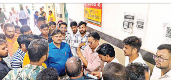
ट्रामा सेंटर में परिजनो से बातचीत करते चिकित्सक।

अमृत विचार : दर्शननगर स्थित राजर्षि दशरथ मेडिकल कॉलेज के डिप्लोमा छात्र की संदिग्ध परिस्थितियों में मौत हो जाने का मामला सामने आया है। पेट दर्द की शिकायत के बाद उसे ट्रामा सेंटर में भर्ती कराया गया था। पोस्टमार्टम न कराने की मांग को लेकर चिकित्सक-स्टाफ व परिजनों के बीच नोकझोंक हुई। बड़ी संख्या में विद्यार्थी घंटों वहीं जमे रहे। पुलिस की मौजूदगी में शव को पोस्टमार्टम के लिए भेजा गया। सुल्तानपुर के दोस्तपुर निवासी