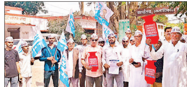
प्रदर्शन करते आम आदमी पार्टी के पदाधिकारी और सदस्य।