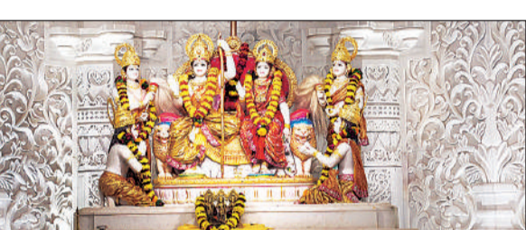
प्रथम तल पर सजा राजा राम का दरबार।

राममंदिर में रामलला के जन्मोत्सव की भव्य तैयारी है। पहली बार भूतल पर विराजमान रामलला के साथ प्रथम तल पर राम दरबार के भी अलौकिक दर्शन प्राप्त होंगे। फूलों से पूरे गर्भगृह को सजाया जाएगा। रामनवमी पर बाल स्वरूप श्री रामलला पंचामृत से अभिषेक होंगे। बेशुमार डिजाइन से तैयार पिता वस्त्र धारण करेंगे। हीरा, पन्ना जड़ित स्वर्ण मुकुट और हार को भी धारण करेंगे। वहीं इस दौरान दोपहर 12 बजे राम मंदिर के साथ