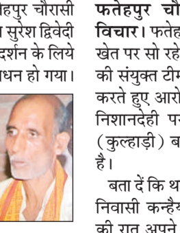
पुलिस गिरफ्त में हत्यारोपी।

पुलिस ने हत्या की रिपोर्ट दर्ज कर जांच शुरू की थी। एसपी ने खुलासे के लिए पुलिस के अलावा स्वाट व सर्विलांस