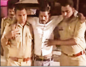
मुठभेड़ में गोली लगने से घायल आरोपी को अस्पताल लेकर जाती पुलिस।

अमृत विचार। पत्नी की पिटाई के दौरान नशेड़ी जेट ने बीच-बचाव करने पहुंची बहू की गोली मार कर हत्या कर दी और भाग निकला। केस दर्ज कर आरोपी की तलाश में जुटी पुलिस ने उसे घेर लिया। वह लखनऊ भागने की फिराक में था। पुलिस से खुद को फिरता देख आरोपी ने गोली चला दी। जवाबी फायरिंग में उसके बाएं पैर में गोली लगी, जिससे वह घायल होकर गिर गया। जिसके बाद पुलिस ने उसे गिरफ्तार कर लिया।