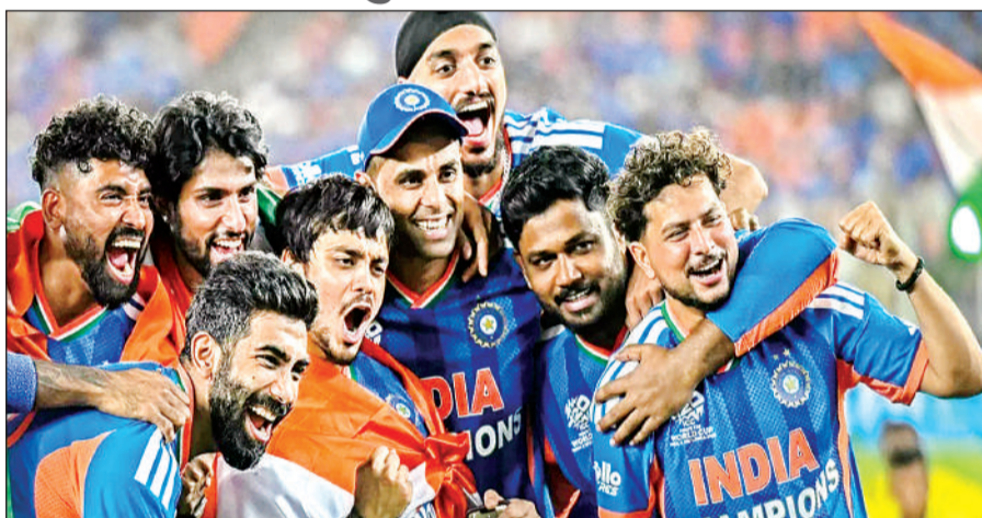
टी-20 विश्व कप विजेता भारतीय टीम।

इस समारोह में उन अन्य भारतीय टीमों को भी सम्मानित किया जाएगा जिन्होंने हाल के दिनों