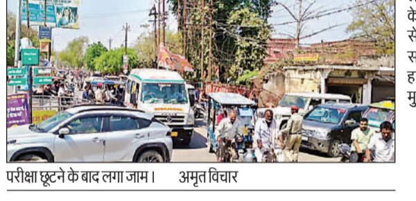
परीक्षा छूटने के बाद लगा जाम। अमृत विचार

उपस्थित और अनुपस्थित अभ्यर्थियों की संख्या : परीक्षा प्रथम पाली में 2880 पंजीकृत थे, जिसमें से 1924 उपस्थित रहे। अनुपस्थित अभ्यर्थियों की संख्या 956 रही। वहीं दूसरी पाली में पंजीकृत अभ्यर्थियों की संख्या 2880 थी। इसमें 1966 उपस्थित थे, जबकि अनुपस्थित परीक्षार्थियों की संख्या 914 रही।