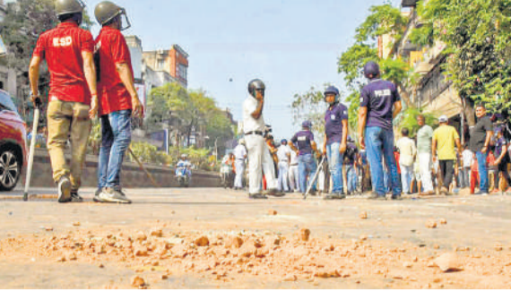
मध्य कोलकाता में शनिवार को प्रधानमंत्री मोदी की रैली के पूर्व भाजपा और तृणमूल कांग्रेस कार्यकर्ताओं के बीच झड़प के बाद सड़क पर बिखरी ईंटें और मौजूद पुलिस।

झड़प के बीच, यह आरोप भी सामने आया कि गिरिश पार्क इलाके में पश्चिम बंगाल की मंत्री शशि पांजा के आवास पर पथराव किया गया। यह झड़प रैली स्थल से लगभग पांच किलोमीटर दूर उस समय हुई जब भाजपा समर्थक प्रधानमंत्री की रैली में शामिल होने