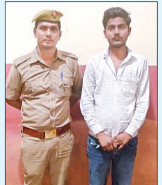
पुलिस गिरफ्तार में खड़ा आरोपी।