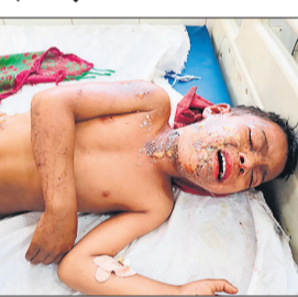
जिला अस्पताल में भर्ती बच्चा।