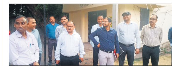
शहर में चेंकिंग अभियान चलाती टीम।