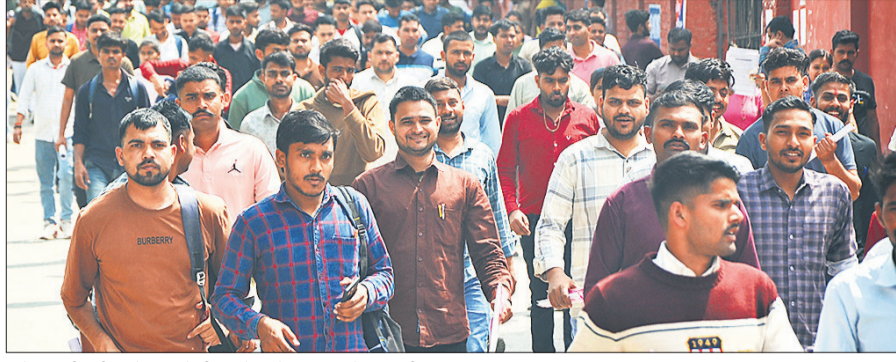
दरोगा भर्ती परीक्षा देकर बरेली कॉलेज से बाहर आते अभ्यर्थी।

4 हजार से अधिक अभ्यर्थियों ने छोड़ी परीक्षा : पुलिस दरोगा भर्ती परीक्षा की