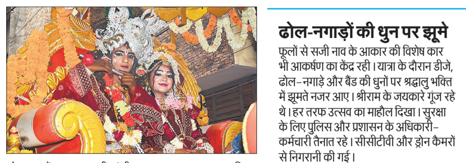
शोभायात्रा में राधा-कृष्ण की झांकी।