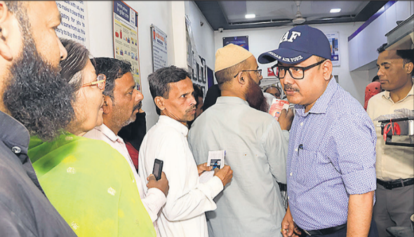
गैस एजेंसी का निरीक्षण कर बुकिंग करने पहुंचे उपभोक्ताओं से बातचीत करते डीएम।