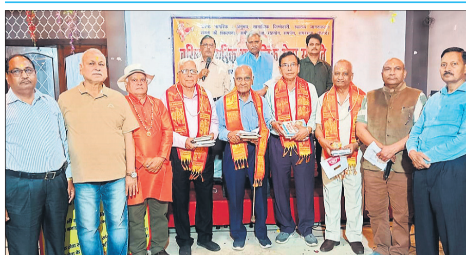
कार्यक्रम में 80 वर्ष से अधिक उम्र के सदस्यों को सम्मानित किया गया।

● वरिष्ठ नागरिक सामाजिक सेवा समिति का होली मिलन समारोह आयोजित