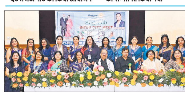
इंटरसिटी मीट में उपस्थित मुख्य अतिथि और रोटरी क्लब बरेली फ्रेग्रेस की पदाधिकारी।

● रोटरी क्लब बरेली फ्रेग्रेस ने इंटरसिटी मीट का किया आयोजन