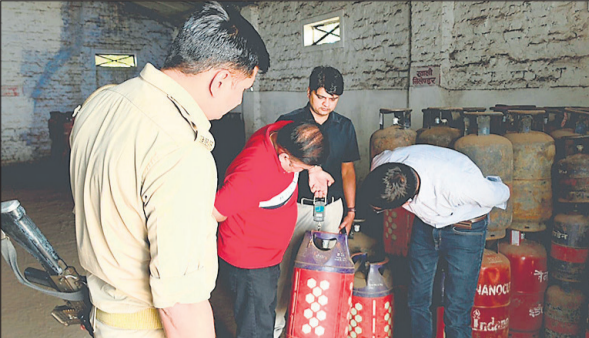
गैस एजेंसी के गोदाम का निरीक्षण करते एडीएम, डीएसओ व अन्य।

लगभग सभी एजेंसियों पर दो दिन में अधिकारियों ने स्टॉक चेक कर लिया है। शुक्रवार को सभी एजेंसियों पर एसडीएम, सीओ, बीडीओ, इस्पेक्टर आदि अफसरों ने जांच की। शनिवार को सभी एजेंसियों में ऑनलाइन स्टॉक देखने के बाद उसका गोदाम के स्टॉक से मिलान कराया है। डीएम ने कहा कि उपभोक्ताओं को गैस मिल रही है। उन्होंने निरीक्षण के दौरान गैस एजेंसियों के संचालकों को निर्देश दिए हैं कि कोई वृद्ध महिला या पुरुष उपभोक्ता बुकिंग कराने आते हैं तो उनके घर पर सीधे सिलेंडर पहुंचाने की व्यवस्था करें।