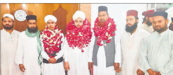
कुरान मजीद मुकम्मल होने पर कारी और सामां की गुलापोशी की गई। ● अमृत विचार