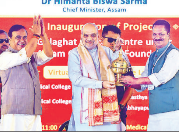
केंद्रीय गृह मंत्री अमित शाह ने रविवार को गुवाहाटी में प्राग्ज्योतिषपुर मेडिकल कॉलेज और अस्पताल का उद्घाटन किया। असम के सीएम हेमंत बिश्वा शर्मा भी मौजूद रहे।

शाह ने 2,092 करोड़ रुपये की स्वास्थ्य सेवा परियोजनाओं का उद्घाटन और आधारशिला रखते हुए कहा कि 10 साल पहले असम की स्वास्थ्य सेवा व्यवस्था बदहाल थी क्योंकि कांग्रेस केवल अपने नेताओं के परिवारों की आर्थिक स्थिति के लिए काम कर रही थी। केंद्रीय मंत्री ने आरोप लगाया कि 2016 तक कांग्रेस के शासनकाल के दौरान इस क्षेत्र में भ्रष्टाचार हुआ था और कहा कि 15 वर्षों तक, हर साल, राज्य के स्वास्थ्य बजट से 150 करोड़ रुपये उन्होंने अपनी जेब में डाल लिए।