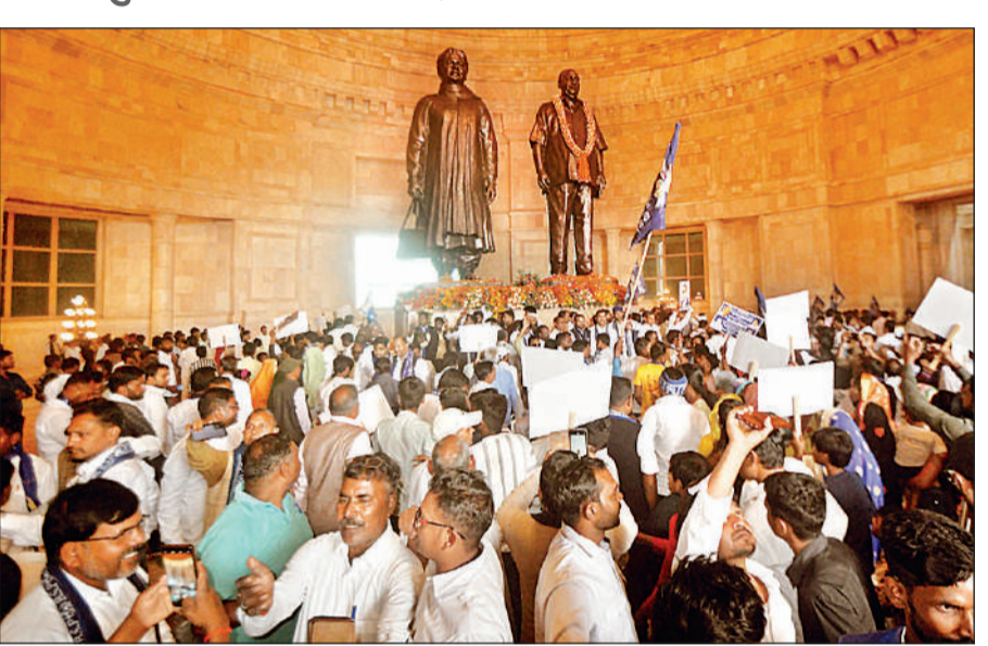
लखनऊ : मान्यवर श्री कांशीराम जी स्मारक स्थल पर श्रद्धांजलि देने भारी संख्या में पहुंचे बसपा कार्यकर्ता।

बसपा प्रमुख ने रविवार को पार्टी संस्थापक कांशीराम की जयंती पर उन्हें श्रद्धांजलि दी। साथ ही कहा, कांशीराम ने बीआर आंबेडकर की विचारधारा और आंदोलन को पूरे देश में आगे बढ़ाने के लिए अपना पूरा जीवन समर्पित किया। पार्टी की ओर से मायावती के जारी बयान में कहा गया कि कांशीराम के “सामाजिक परिवर्तन और आर्थिक मुक्ति” के आंदोलन को मजबूत बनाने और चुनावी सफलता हासिल करने का संकल्प लिया गया है। साथ ही दावा किया कि बहुजन समाज के हितों के लिए वही “असली पार्टी और आंदोलन” है। पार्टी ने आपण लगाया कि समाजवादी पार्टी समेत अन्य विरोधी दलों की कथनी और करनी में अंतर है, जिससे बहुजन समाज की एकता और सत्ता प्राप्ति के मिशन को नुकसान होता है।