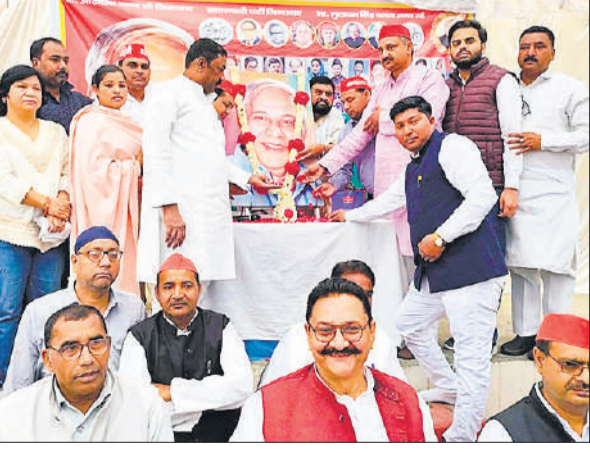
कांशीराम के चित्र पर पुष्प चढ़ाते पदाधिकारी व कार्यकर्ता।