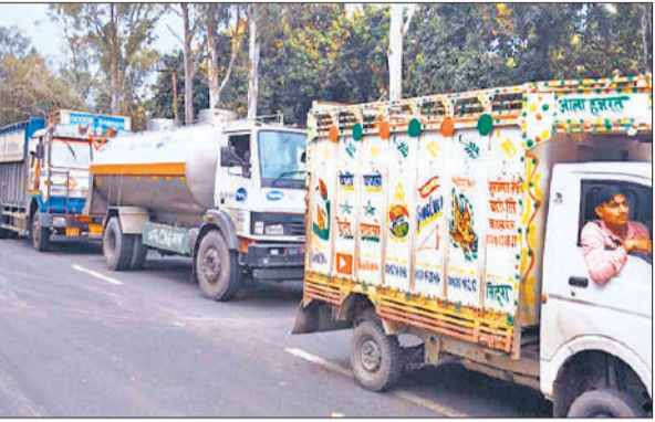
जाम लगने से मार्ग पर खड़े वाहन।

गजरोला, अमृत विचार : एलपीजी घरेलू गैस सिलेंडर की किल्लत के बीच उपभोक्ता सुबह से ही गैस गोदामों के बाहर लंबी कतार में लग रहे हैं। वहीं कामर्शियल गैस सिलेंडर की आपूर्ति बंद होने से फूड़ कारोबार पर 30 फीसदी तक असर पड़ा है। कई दिन सिलेंडर न मिलने से घरों में बिजली की खपत बढ़ गई है। गैस सिलेंडर की उपलब्धता को लेकर बनी अनिश्चितता के बीच लोगों में उहापोह का माहौल है। ऑनलाइन गैस बुकिंग हो नहीं रही है, और दिनभर लंबी कतार लगने के बाद भी उपभोक्ता खाली हाथ लौटने को मजबूर हैं। रविवार को शहर के चौपाला पर घरेलू एलपीजी गैस सिलेंडर दो हजार रुपये में और कामर्शियल सिलेंडर तीन हजार रुपये में मिलने की चर्चा आम रही। एजेंसी संचालकों और कर्मचारियों से तीखी नोकझोंक हो रही है।