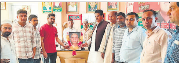
संभल में कांशीराम जयंती मनाते सभा कार्यक्रम।