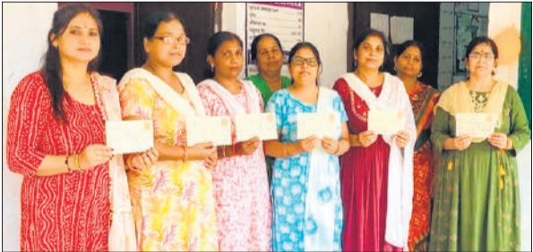
टीईटी के विरोध में पोस्टकार्ड के साथ शिक्षिकाएं।