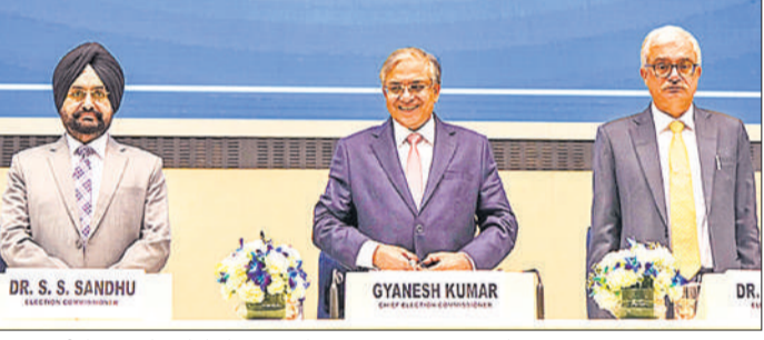
नई दिल्ली में चुनाव के बारे में घोषणा करते मुख्य चुनाव आयुक्त ज्ञानेश कुमार।

नई दिल्ली, एजेंसी निर्वाचन आयोग ने रविवार को पश्चिम बंगाल, केरल, असम, तमिलनाडु और पुडुचेरी में विधानसभा चुनाव की तारीखों की घोषणा की। सभी राज्यों में मतगणना 4 मई को होगी। मुख्य निर्वाचन आयुक्त ज्ञानेश कुमार ने बताया कि बंगाल में दो चरण में 23 और 29 अप्रैल को मतदान होगा। उन्होंने बताया कि तमिलनाडु की 234 सदस्यीय विधानसभा के लिए 23 अप्रैल को मतदान होगा। कुमार ने बताया कि केरल, असम और पुडुचेरी के लिए नौ अप्रैल को एक चरण में मतदान होगा। उन्होंने बताया कि चारों राज्यों और केंद्र शासित प्रदेश विधानसभा चुनाव के लिए 824 सीटों पर मतगणना चार मई को होगी। चुनाव हिंसा या प्रलोभन से मुक्त होने चाहिए और आयोग किसी भी उल्लंघन के खिलाफ कड़ी कार्रवाई