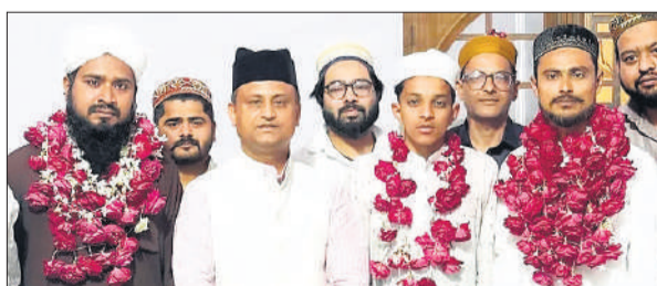
मस्जिद में कुरान मजीद मुकम्मल होने के बाद कारी और हाफिज की गुलापोशी हुई।

मजीद की तिलावत से अल्लाह की रहमत बरसती है। कुरान मजीद मुकम्मल होने पर हुई तकरीर में मौलाना ने कहा कि कुरान को समझकर पढ़ना चाहिए। कुरान मजीद में हर मसले का हल मौजूद है। कुरान मजीद की तिलावत से अल्लाह बहुत खुश होता है वह अपने बंदे पर रहमतों की बारिश कर देता है। माहे