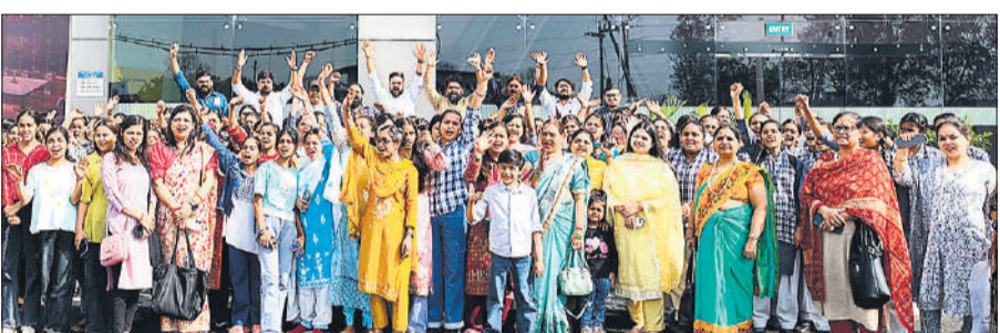
फिल्म देखने के बाद सिनेमा हाल के बाहर खड़ी छात्राएँ एवं अभिभावक।