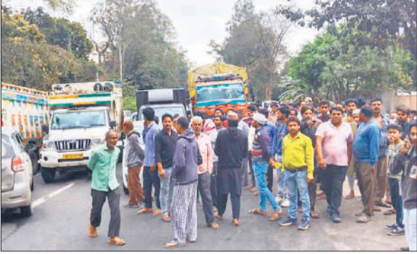
गैस की किल्लत को लेकर जाम लगाते उपभोक्ता।

लगातार घरेलू गैस की किल्लत के चलते उपभोक्ता परेशान हो रहे हैं। वही प्रशासनिक अधिकारी गैस की कोई भी कमी न होना बता रहे हैं। रविवार को सुबह चार बजे से नगर के गजरोला मार्ग स्थित दिपपुर गेट के निकट गैस गोदाम पर उपभोक्ताओं की लाइन लगनी शुरू हो गई थी। 9 बजे तक गैस एजेंसी स्वामी द्वारा कोई भी जवाब न दिए जाने से उपभोक्ताओं का धैर्य जवाब दे गया। उन्होंने