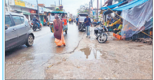
वर्षा के चलते सड़क पर कीचड़। ●अमृत विचार

कांठ, अमृत विचार : ग्रीष्म ऋतु वर्षा होने से मौसम का मिजाज बदलने का कारण मौसम में सर्दी का एहसास हुआ। रविवार को सूर्योदय के साथ ही मौसम का मिजाज अचानक बदल गया। दिन में कई बार रुक-रुक कर वर्षा होती रही। पूरे दिन बादल छाप रहे और आकाश में बादलों की गड़बड़ाहट और बिजली कड़कने की आवाज सुनाई देती रही। ईद की खरीदारी के लिए इन दिनों बाजारों में रौनक है लेकिन रविवार को बाजार में सन्नाटा छाया रहा। पुराने रोडवेज पर सड़क चौड़ीकरण के कारण सड़क के दोनों ओर खोदे गए गड्डों में जल भराव के कारण लोगों को परेशानी उठानी पड़ी। वाहन फंसेकर गिरने से सवार चोटिल हो गए। गेहूं, सरसों की फसल खराब होने की आशंका से किसान परेशान हो उठे।