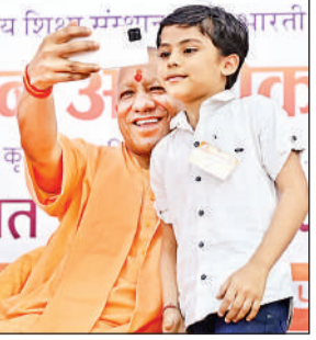
बच्चे के साथ सेल्फी लेते मुख्यमंत्री योगी।

रानी पद्मिनी की वंशावली सैकड़ों वर्ष बाद आज भी है। सनातन की मर्यादा सदैव अमर है और रहेगी।