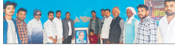
काशीराम के चित्र पर श्रद्धासुमन अर्पित करते कार्यकर्ता।