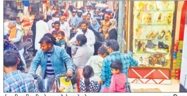
ईद की खरीदारी को बाजारों में उमड़े लोग। ●अमृत विचार

अमृत विचार : ईद का त्योहार नजदीक आते ही बाजारों में रौनक बढ़ गई है। शनिवार को बड़ी संख्या में लोग खरीदारी के लिए बाजार पहुंचे, जिसके कारण मुख्य बाजार समेत कई मार्गों पर जाम की स्थिति बन गई। इससे राहगीरों और वाहन चालकों को काफी परेशानी का सामना करना पड़ा। सुबह से ही कपड़े, जूते, सेवइयां, मिठाई और अन्य आवश्यक सामान खरीदने के लिए लोगों की भीड़ बाजार में उमड़ने लगी। दोपहर होते-होते स्थिति यह हो गई कि बाजार में पैदल चलना भी मुश्किल हो गया। दुकानों के सामने लगी भीड़, सड़क किनारे खड़े वाहन और बड़ी संख्या में चल रहे ई-रिक्शा के कारण यातायात व्यवस्था प्रभावित हो गई। कई स्थानों पर वाहनों की लंबी कतारें लग गईं और लोगों को जाम में