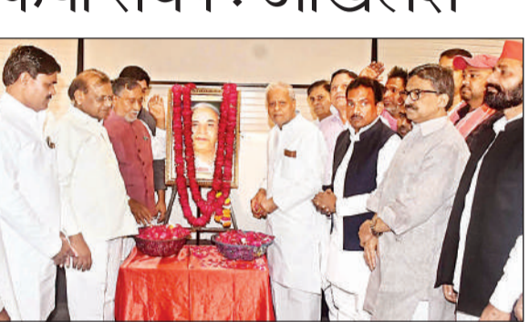
सपा मुख्यालय पर कांशीराम के चित्र पर पुष्पांजलि अर्पित करते पार्टी नेता।

मनाई गई। इस मौके पर सपा प्रमुख अखिलेश यादव ने जारी संदेश में कहा कि कांशीराम एक प्रमुख भारतीय राजनेता और समाज सुधारक थे, जिन्होंने बहुजन समाज को सम्मानजनक स्थान दिलाने के लिए जीवनभर संघर्ष किया। सपा प्रमुख ने रविवार को कहा कि 1971 में बामसेफ और 1984