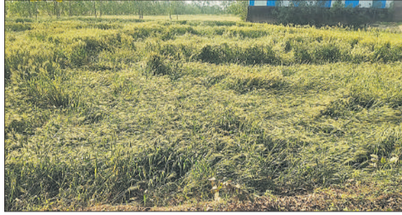
मलपुरा लक्ष्मीपुर में तेज हवा व बारिश से गिरी गेहूं की फसल। ●अमृत विचार

और ओलावृष्टि हुई तो गेहूं को भारी नुकसान हो सकता है। कई किसानों ने बताया कि फसल लगभग तैयार है और कुछ स्थानों पर कटाई भी शुरू हो चुकी है, इसलिए इस समय बारिश और तेज हवा फसल के लिए बेहद नुकसानदेह साबित हो सकती है। मौसम में आए इस बदलाव से पिछले कुछ दिनों से पड़ रही गर्मी से लोगों को राहत मिली है।