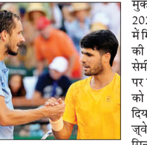
दानिल मेदवेदेव व कार्लोस अल्काराज।

ओपन और कतर ओपन के खिताब शामिल हैं। मेदवेदेव ने इस जीत से अल्काराज और सिनर के बीच एक और फाइनल की संभावना को खत्म कर दिया। मेदवेदेव इससे पहले अल्काराज