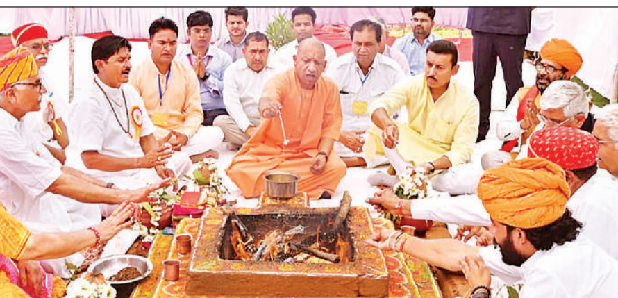
चित्तौड़गढ़ किले में आयोजित जौहर श्रद्धांजलि समारोह में हवन-पूजन करते मुख्यमंत्री योगी, साथ में अन्य।

“मूल जानना बड़ा कठिन है नदियों का-वीरों का, धनुष छोड़कर और गोत्र क्या होला रणधीरों का। पाते हैं सम्मान तोपोबल से भूतल पर शूर, जाति-जाति का शोर मचाते केवल कायर, क्रूर।” मुख्यमंत्री ने कहा कि जिन्हें कुछ नहीं करना है, वे