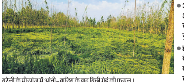
बरेली के मीरगंज में आंधी-बारिश के बाद बिछी गेहूं की फसल।