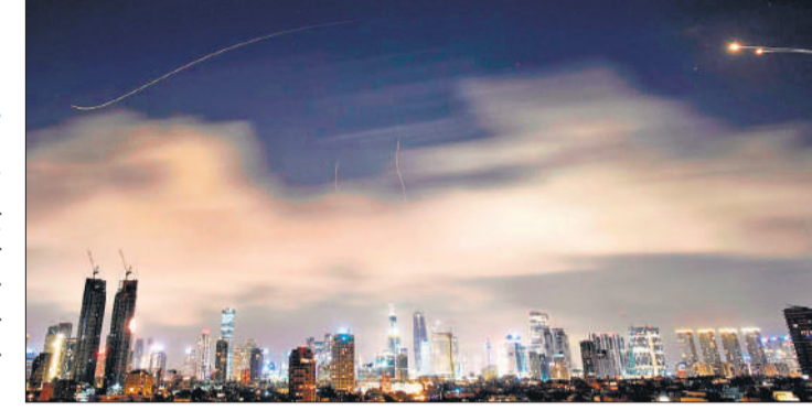
ईरानी हमले के दौरान इजराइली वायु रक्षा प्रणाली ने मिसाइलों को रोकने के लिए गोलीबारी की।

काहिरा, एजेंसी ईरान ने हमलों का दायरा और व्यापक करने की धमकी दिए जाने के बीच इजराइल और फारस की खाड़ी के आसपास के पड़ोसी देशों पर हमले किए। इस संघर्ष के कारण वैश्विक विमानन सेवाएं अस्त-व्यस्त हो गई हैं, तेल निर्यात बाधित हुआ है और दुनियाभर में ईंधन की कीमतों में वृद्धि हुई है। अमेरिकी राष्ट्रपति ट्रंप ने कहा कि उन्हें आशा है कि तेल व गैस के निर्यात पर निर्भर देश हॉर्मुज स्ट्रेट