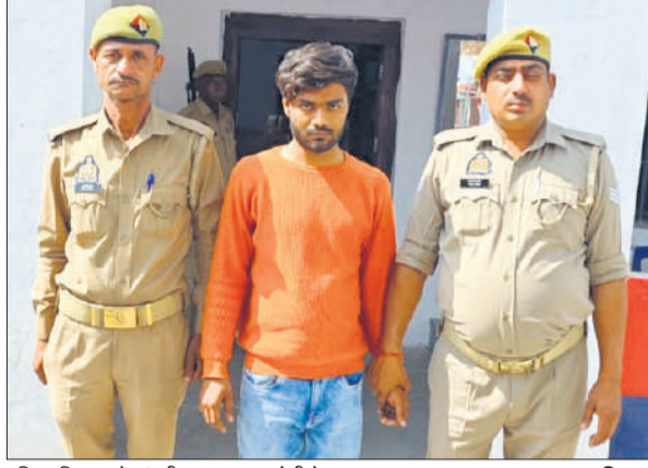
पुलिस गिरफ्तार में मां की हत्या का आरोपी बेटा।