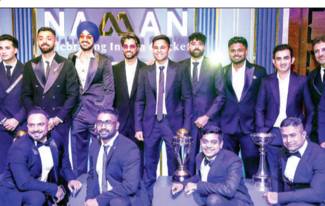
नमन अवार्ड्स के दौरान टी-20 विश्व कप विजेता टीम के साथ कप्तान सूर्यकुमार यादव। महिला क्रिकेट टीम की खिलाड़ी स्नेह राणा, रेणुका सिंह, शेफाली वर्मा और क्रांति गौड़।

यह सम्मान भारतीय क्रिकेट में उनके बेहतरीन योगदान को देखते हुए दिया गया। गिल के लिए 2025 का साल बेहद शानदार रहा और