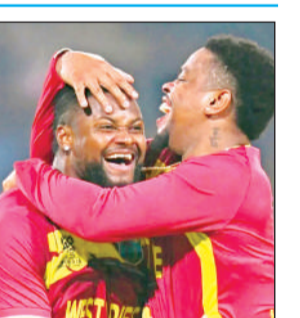
घर पहुंचने की खुशी।

ने वृहस्पतिवार को घोषणा की थी कि खिलाड़ियों का आखिरी समूह भी रवाना हो गया है। शनिवार को जारी एक बयान में सीडब्ल्यूआई ने पुष्टि की कि टूर्नामेंट में वेस्टइंडीज टीम का हिस्सा रहे सभी खिलाड़ी और टीम प्रबंधन के सदस्य अपनी