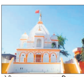
लोदीपुर धाम।

अमृत विचार: बिश्नोई समाज की आस्था का प्रतीक लोदीपुर धाम का 495 वां वार्षिक उत्सव चैत्र अमावस्या पर 18 मार्च को धूमधाम से मनाया जाएगा। इससे पूर्व 17 मार्च को गुरु जंभेश्वर शोभायात्रा बैड बाजे के साथ निकाली जाएगी। शोभा यात्रा गुरु जंभेश्वर मार्ग, हरथला होते हुए लोदीपुर धाम तक जाएगी। इसमें प्रथम बार नगीना का अखाड़ा सम्मिलित होने जा रहा है। सायं काल संत समाज के कर कमलों द्वारा मन्दिर पर ध्वजा रोहण किया जाएगा। रात लगभग 8 बजे आरती, जागरण, संत प्रवचन, कीर्तन, संतो और अतिथियों का सम्मान होगा। 18 मार्च, सुबह 7:00 बजे से 10:00 बजे तक महायज्ञ, और पाहल का वितरण होगा। अखण्ड ज्योति दर्शन पर्यावरण गोष्ठी, का आयोजन किया गया है।