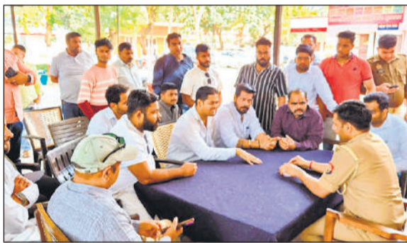
सिविल लाइन कोतवाली में अधिकारी से वार्ता करते ब्राह्मण समाज के लोग।

डॉक्टरों ने सैफ (18) निवासी मोहल्ला करेशियान,