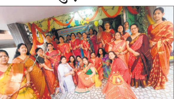
कार्यक्रम में अलायंस क्लब मधुवन मैत्री एवं मिलन की सदस्य।