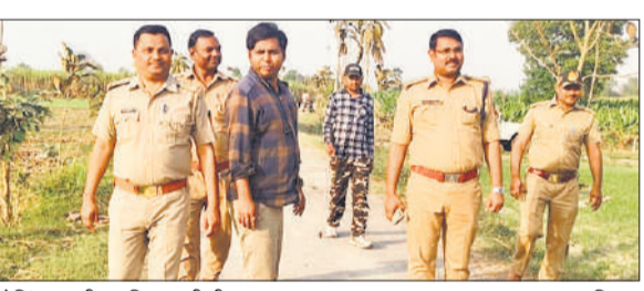
पेट्रोलिंग करती वन विभाग की टीम।