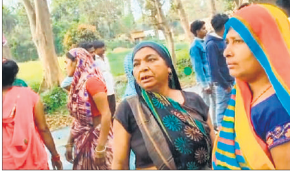
महिलाओं के साथ जाम लगाकर प्रदर्शन करते लोग।