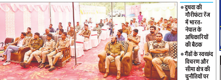
बैठक में मौजूद भारत व नेपाल के अधिकारी।