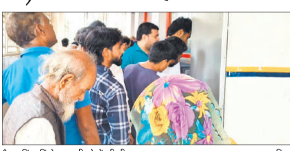
गैस बुकिंग विंडो पर लगी लोगों की भीड़।