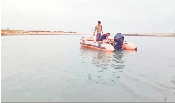
शारदा नदी में तलाश करती एसडीआरएफ की टीम।

शनिवार को एसडीआरएफ की टीम को भी बुलाया गया, लेकिन मोटर बोट में खराबी होने के कारण समय पर सर्च अभियान शुरू नहीं हो सका। इससे परिजनों और ग्रामीणों में नाराजगी बढ़ गई।