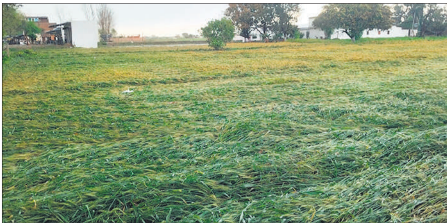
बिजुआ क्षेत्र में तेज आंधी से गिरी गेहूं की फसल।

अमृत विचार: मार्च की शुरुआत से ही मौसम का मिजाज लगातार बदलता नजर आ रहा है। एक सप्ताह पहले तक जहाँ तापमान में लगातार बढ़ोतरी होने से लोगों को अप्रैल जैसी गर्मी का अहसास होने लगा था, वहीं रविवार दोपहर बाद अचानक मौसम ने करवट ले ली। आसमान में घने बादल छा गए और देर शाम से तेज हवाओं के साथ हल्की बारिश शुरू हो गई। आसमान में बिजली कड़की और गरज के साथ बूदाबांदी भी हुई। कुछ इलाकों में रुक-रुक कर हुई बारिश और तेज हवाओं के कारण तापमान में गिरावट दर्ज की गई, जिससे मौसम एकाएक ठंडा हो गया। वहीं, खेतों में खड़ी गेहूं और सरसों की फसल पर संकट मंडराने लगा है। इससे किसानों की चिंता बढ़ गई है। गोला गोकर्णनाथ। रविवार सुबह से ही आसमान में बादलों का डेरा बना रहा और बीच-बीच में तेज हवा के साथ बूदाबांदी होती रही। हवाओं की रफ्तार भी काफी तेज रही, जिससे पेड़-पौधे झूमते नजर आए। मौसम के अचानक ठंडा होने से लोगों को एक बार फिर हल्की ठंड का एहसास होने लगा। कई जगहों पर लोग गर्म