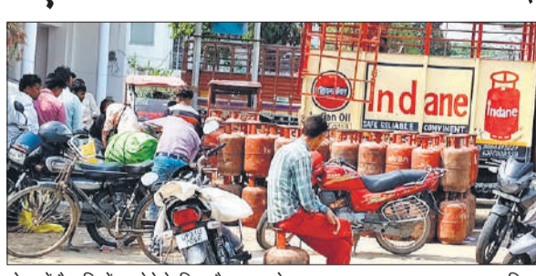
गोला में गैस सिलेंडर लेने के लिए मौजूद उपभोक्ता।