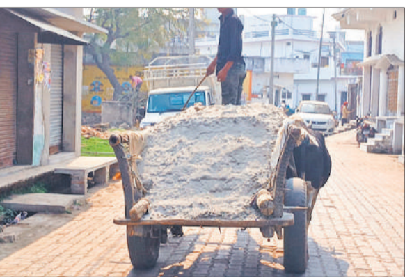
डनलप में भरकर ले जाई जा रही बालू।

अमृत विचार: सिंगाही थाना क्षेत्र में खनन इंसपेक्टर पर हुए जानलेवा हमले के बाद प्रशासन की सख्ती से कुछ समय के लिए अवैध बालू खनन पर लगाम लग गई थी, लेकिन अब एक बार फिर खनन माफिया सक्रिय हो गए हैं। माफिया अब खनन का तरीका बदलकर नदी से बालू निकालने का काम कर रहे हैं।