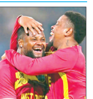
घर पहुंचने की खुशी।

ने वृहस्पतिवार को घोषणा की थी कि खिलाड़ियों का आखिरी समूह भी रवाना हो गया है। शनिवार को जारी एक बयान में सीडब्ल्यूआई ने पुष्टि की कि टूर्नामेंट में वेस्टइंडीज टीम का हिस्सा रहे सभी खिलाड़ी और टीम प्रबंधन के सदस्य अपनी