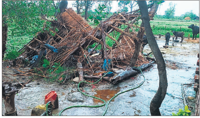
बोझवा गांव में आंधी-पानी में गिरा छप्पर।

इफ्तार सोमवार सुन्नी: 6:18 शिया: 6:19 सहरी मंगलवार सुन्नी: 4:49 शिया: 4:51