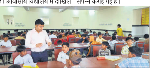
कक्ष निरीक्षकों की देखरेख में प्रवेश परीक्षा देते विद्यार्थी।