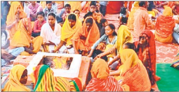
हवन कुंड में आहुतियां डालते श्रद्धालु।