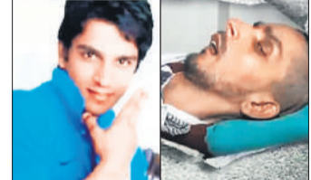
● इच्छा मृत्यु के लिए एम्स के पैलिटिव केयर में किया गया शिफ्ट