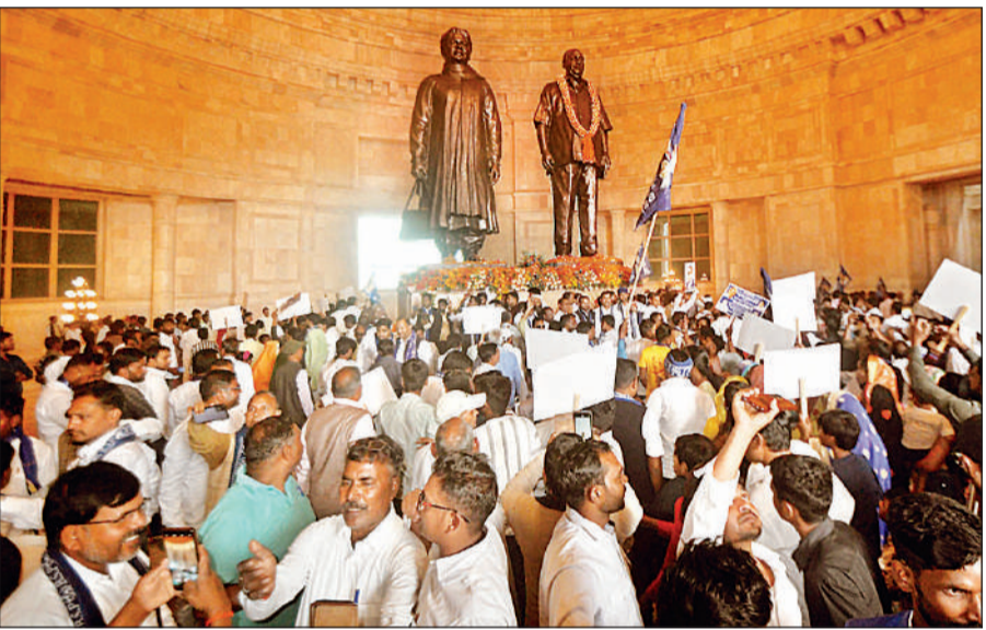
लखनऊ : मान्यवर श्री कांशीराम जी स्मारक स्थल पर श्रद्धांजलि देने भारी संख्या में पहुंचे बसपा कार्यकर्ता।

बसपा प्रमुख ने रविवार को पार्टी संस्थापक कांशीराम की जयंती पर उन्हें श्रद्धांजलि दी। साथ ही कहा, कांशीराम ने बीआर आंबेडकर की विचारधारा और आंदोलन को पूरे देश में आगे बढ़ाने के लिए अपना पूरा जीवन समर्पित किया। पार्टी की ओर से मायावती के जारी बयान में कहा गया कि कांशीराम के "सामाजिक परिवर्तन और आर्थिक मुक्ति" के आंदोलन को मजबूत बनाने और चुनावी सफलता हासिल करने का संकल्प लिया गया है। साथ ही दावा किया कि बहुजन समाज के हितों के लिए वही "असली पार्टी और आंदोलन" है। पार्टी ने आपण लगाया कि समाजवादी पार्टी समेत अन्य विरोधी दलों की कथनी और करनी में अंतर है, जिससे बहुजन समाज की एकता और सत्ता प्राप्ति के मिशन को नुकसान होता है।