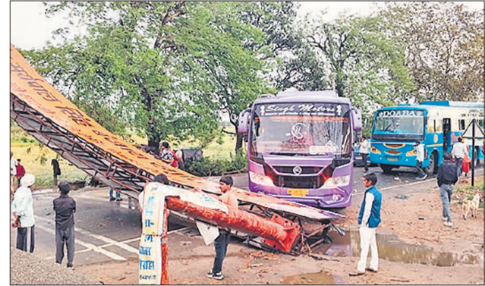
भीरा बिजुआ मार्ग पर बरमबाबा चौराहे पर बोर्ड गिरने से बाधित यातायात।