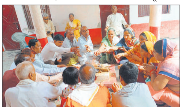
यज्ञ में आहुतियां देते श्रद्धालु।