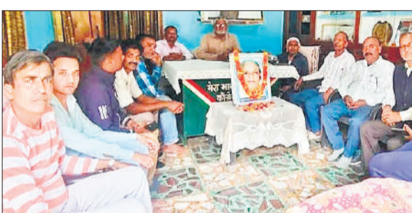
गोला में कांशीराम की जयंती मनाते कांग्रेसी।