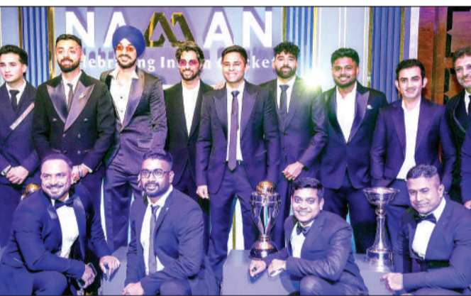
नमन अवार्ड्स के दौरान टी-20 विश्व कप विजेता टीम के साथ कप्तान सूर्यकुमार यादव। महिला क्रिकेट टीम की खिलाड़ी स्नेहा राणा, रेणुका सिंह, शेफाली वर्मा और क्रांति गौड़।

यह सम्मान भारतीय क्रिकेट में उनके बेहतरीन योगदान को देखते हुए दिया गया। गिल के लिए 2025 का साल बेहद शानदार रहा और