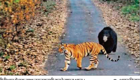
पीटीआर में एक साथ चलकदमी करते बाघ व भालू।

अमृत विचार : मानव-वन्यजीव संघर्ष पर अंकुश लगाने के लिए टाइगर रिजर्व प्रशासन की ओर से जंगल से सटे इलाकों में चलाया जा रहा मानव-सहअस्तित्व अभियान भले ही अभी कारगर होता नहीं दिख रहा है। मगर, पीलीभीत टाइगर रिजर्व के वन्यजीवों में सह अस्तित्व दिखने लगा है। दरअसल टाइगर रिजर्व में जंगल सफारी के दौरान बाघ और भालू एक साथ देखे गए। सैलानियों ने इस दुर्लभ नजारे को कैमरे में भी कैद कर लिया। अब इसका वीडियो तेजी से वायरल हो रहा है। हालांकि वन्यजीव विशेषज्ञ दो शिकारी वन्यजीवों का एक साथ होना स्वस्थ पारिस्थितिकी तंत्र का संकेत मानने के साथ भविष्य में संभावित संघर्ष की भूमिका होने की आशंका जता रहे हैं।