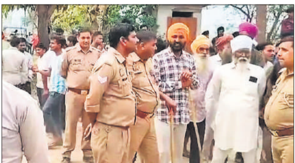
घटना स्थल पर मौजूद ग्रामीण, पुलिस और वन विभाग की टीम।

अमृत विचार: उत्तर निघासन की वन रेंज बेलरायां के रन नगर गांव में रविवार को उस समय अफरा-तफरी मच गई। जब एक तेंदुआ गांव में स्थित एक फार्म हाउस के भूसा गोदाम में घुस गया। तेंदुए को देखने और उसका वीडियो बनाने के प्रयास में गोदाम में गए किसान पर तेंदुए ने अचानक हमला कर दिया, जिससे किसान का एक हाथ जखमी हो गया। घटना के बाद पूरे गांव में दहशत का माहौल है।