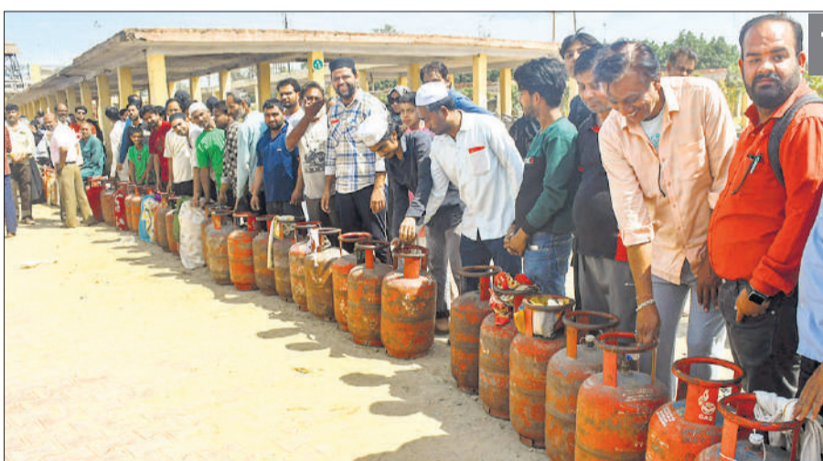
मेरठ में रविवार को एक गैस एजेंसी के बाहर सिलेंडर रिफिल कराने के लिए लगी लोगों को लंबी कतार।