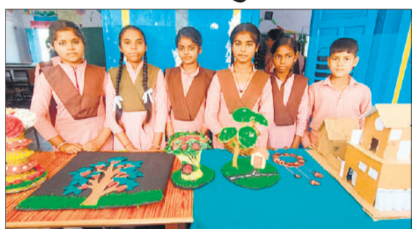
मेले में मॉडल पेश करते पीएमश्री कंपोजिट विद्यालय खासपुर के बच्चे।

के दौरान डिग्रि कॉलेज से नई बस्ती चौराहा तक बैरियर लगाकर रास्ता बंद कर दिया गया था। पहला बैरियर डिग्रि कॉलेज चौराहा पर लगाया गया था। जहां से परीक्षा के समय तक किसी भी वाहन को अंदर नहीं जाने दिया गया। सिर्फ पैदल ही लोग अंदर जा सके। इस दौरान कई लोगों की पुलिस से अंदर जाने को लेकर बहस भी हुई। दूसरा बैरियर ओम लॉन के मोड़ और तीसरा नई बस्ती चौराहा पर था। जहां से रास्ते सील कर दिए गए थे।