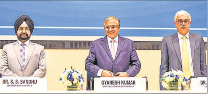
नई दिल्ली में चुनाव के बारे में घोषणा करते मुख्य चुनाव आयुक्त ज्ञानेश कुमार।

उन्होंने बताया कि चारों राज्यों और केंद्र शासित प्रदेश विधानसभा चुनाव के लिए 824 सीटों पर मतगणना चार मई को होगी। चुनाव हिंसा या प्रलोभन से मुक्त होने चाहिए और आयोग किसी भी उल्लंघन के खिलाफ कड़ी कार्रवाई