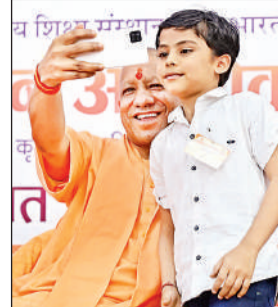
बच्चे के साथ सेल्फी लेते मुख्यमंत्री योगी।

रानी पद्मिनी की वंशावली सैकड़ों वर्ष बाद आज भी है। सनातन की मर्यादा सदैव अमर है और रहेगी।