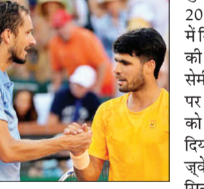
दानिल मेदवेदेव व कार्लोस अल्काराज।

ओपन और कतर ओपन के खिताब शामिल हैं। मेदवेदेव ने इस जीत से अल्काराज और सिनर के बीच एक और फाइनल की संभावना को खत्म कर दिया। मेदवेदेव इससे पहले अल्काराज