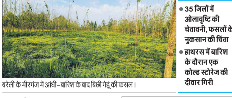
बरेली के मीरांज में आंधी-बारिश के बाद बिछी गेहूं की फसल।