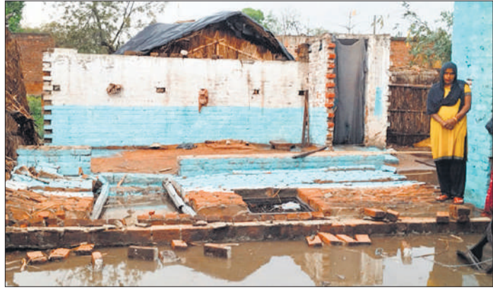
बिजुआ इलाके के भानपुर गांव में गिरी पक्की दीवार।