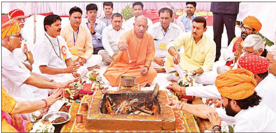
चित्तौड़गढ़ किले में आयोजित जौहर श्रद्धांजलि समारोह में हवन-पूजन करते मुख्यमंत्री योगी, साथ में अन्य।

"मूल जानना बड़ा कठिन है नदियों का-वीरों का, धनुष छोड़कर और गोत्र क्या होला रणधीरों का। पाते हैं सम्मान तपोबल से भूतल पर शूर, जाति-जाति का शोर मचाते केवल कायर, क्रूर।" मुख्यमंत्री ने कहा कि जिन्हें कुछ नहीं करना है, वे