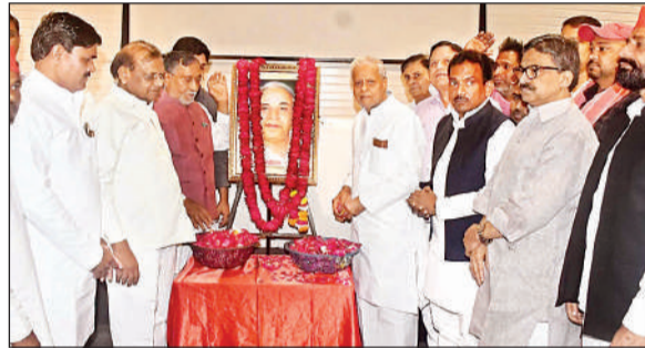
सपा मुख्यालय पर कांशीराम के चित्र पर पुष्पांजलि अर्पित करते पार्टी नेता।

मनाई गई। इस मौके पर सपा प्रमुख अखिलेश यादव ने जारी संदेश में कहा कि कांशीराम एक प्रमुख भारतीय राजनेता और समाज सुधारक थे, जिन्होंने बहुजन समाज को सम्मानजनक स्थान दिलाने के लिए जीवनभर संघर्ष किया। सपा प्रमुख ने रविवार को कहा कि 1971 में बामसेफ और 1984