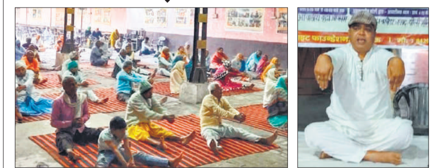
शिविर में रविवार सुबह योगाभ्यास करते वरिष्ठजन।