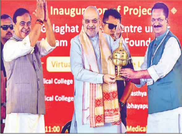
केंद्रीय गृह मंत्री अमित शाह ने रविवार को गुवाहाटी में प्राग्ज्योतिषपुर मेडिकल कॉलेज और अस्पताल का उद्घाटन किया। असम के सीएम हेमंत बिश्वा शर्मा भी मौजूद रहे।

शाह ने 2,092 करोड़ रुपये की स्वास्थ्य सेवा परियोजनाओं का उद्घाटन और आधारशिला रखते हुए कहा कि 10 साल पहले असम की स्वास्थ्य सेवा व्यवस्था बदहाल थी क्योंकि कांग्रेस केवल अपने नेताओं के परिवारों की आर्थिक स्थिति के लिए काम कर रही थी। केंद्रीय मंत्री ने आरोप लगाया कि 2016 तक कांग्रेस के शासनकाल के दौरान इस क्षेत्र में भ्रष्टाचार हुआ था और कहा कि 15 वर्षों तक, हर साल, राज्य के स्वास्थ्य बजट से 150 करोड़ रुपये उन्होंने अपनी जेब में डाल लिए।