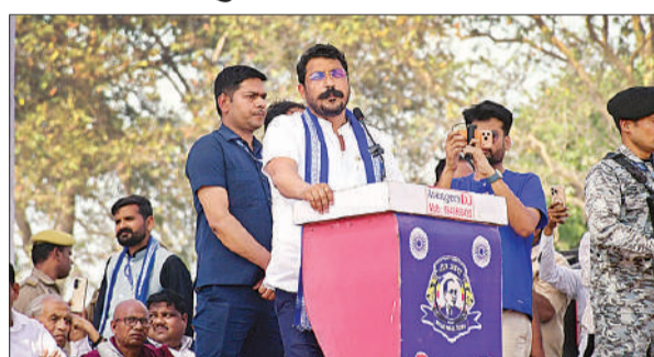
बड़े ल में सभा को संबोधित करते नगीना सांसद चंद्रशेखर।

बाराबंकी, अमृत विचार : भीम आर्मी प्रमुख व नगीना सांसद चंद्रशेखर आजाद 'राजगण' ने रविवार को बाराबंकी में आयोजित जनसभा में केंद्र व प्रदेश सरकार पर हमला बोला। उन्होंने बहुजन समाज से एकजुट होकर लोकतांत्रिक तरीके से बदलाव लाने की अपील करते हुए वर्ष 2027 के विधानसभा चुनाव में भाजपा सरकार को सत्ता से हटाने का आह्वान किया। मजीठा क्षेत्र में कांशीराम की जयंती तथा आजाद समाज पार्टी (कांशीराम) के स्थापना दिवस पर