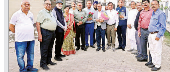
मंडल अध्यक्ष का स्वागत करते वलब के पदाधिकारी।