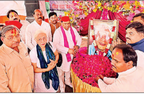
कांशीराम के चित्र पर माल्यार्पण करते सपा कार्यकर्ता।