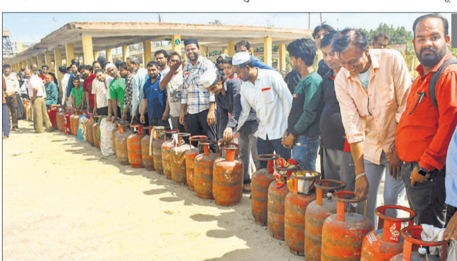
मेरठ में रविवार को एक गैस एजेंसी के बाहर सिलेंडर रिफिल कराने के लिए लगी लोगों को लंबी कतार।