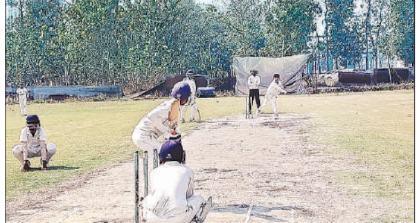
मैच खेलते खिलाड़ी।