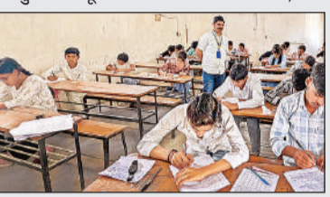
छात्रवृत्ति की परीक्षा में शामिल बच्चे।

रायबरेली, अमृत विचार। विद्यार्थी गुप ऑफ स्कूल की सभी शाखाओं शक्तिनगर, आर्य समाज कैम्पस खोया मंडी और चंदौली में रविवार को प्रभात कुमार वर्मा छात्रवृत्ति परीक्षा का आयोजन किया गया। इस परीक्षा के माध्यम से चयनित विद्यार्थियों को विद्यालय परिवार द्वारा नि:शुल्क शिक्षा के साथ