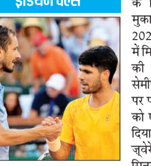
दानिल मेदवेदेव व कार्लोस अल्काराज।

ओपन और कतर ओपन के खिताब शामिल हैं। मेदवेदेव ने इस जीत से अल्काराज और सिनर के बीच एक और फाइनल की संभावना को खत्म कर दिया। मेदवेदेव इससे पहले अल्काराज