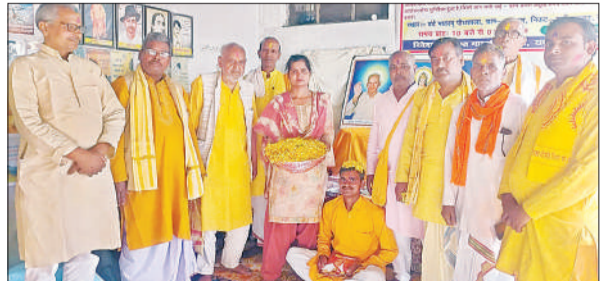
फूलों से होली खेलते गायत्री परिजन।