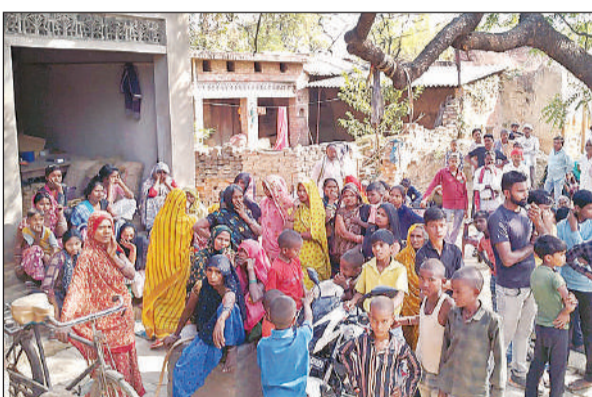
गुरुबवशागंज के पूरे दुनियापत गांव में शव मिलने के बाद मौजूद ग्रामीण।

गुरुबवशागंज थाना क्षेत्र के पूरे दुनियापत मजरे कोरिहर गांव का मामला, फॉरेंसिक टीम ने की जांच