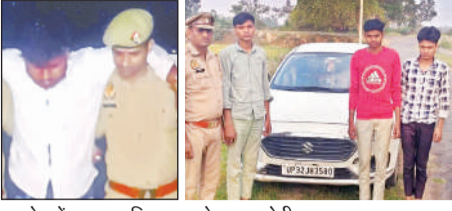
मुठभेड़ में घायल शातिर व पकड़े गए आरोपी।

अमृत विचार। थाना पुलिस ने लूट की घटना का सफल खुलासा करते हुए मुठभेड़ के बाद चार शातिर अभियुक्तों को गिरफ्तार कर लिया। पुलिस की जवाबी फायरिंग में एक आरोपी घायल हो गया, जबकि मुठभेड़ के दौरान एक पुलिसकर्मी भी घायल हो गया। पुलिस ने आरोपियों के कब्जे से 17,100 रुपये नकद, एक कार, मोबाइल फोन तथा एक अवैध तमंचा .315 बोर, एक जिंदा कारतूस और एक खोखा कारतूस बरामद किया है।