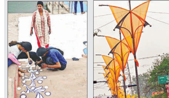
धनोखर सरवर पर बनायी जा रही रंगोली