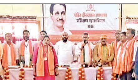
समापन पर राष्ट्रगान के समय मौजूद भाजपा कार्यकर्ता।