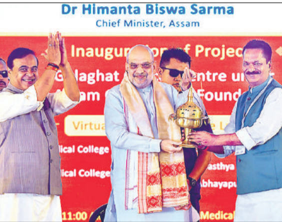
केंद्रीय गृह मंत्री अमित शाह ने रविवार को गुवाहाटी में प्राणज्योतिषपुर मेडिकल कॉलेज और अस्पताल का उद्घाटन किया। असम के सीएम हेमंत बिश्वा शर्मा भी मौजूद रहे।

केंद्रीय गृह मंत्री अमित शाह ने रविवार को आरोप लगाया कि कांग्रेस ने असम में 15 वर्ष के अपने शासनकाल के दौरान राज्य के स्वास्थ्य सेवा बजट से प्रति वर्ष 150 करोड़ रुपये अपनी जेब में डाल लिए। शाह ने कहा कि दूसरी ओर, भाजपा ने राज्य में अपने 10 साल के शासनकाल में इस क्षेत्र को पूरी तरह से बदल दिया है। शाह ने 2,092 करोड़ रुपये की स्वास्थ्य सेवा परियोजनाओं का उद्घाटन और आधारशिला रखते हुए कहा कि 10 साल पहले असम की स्वास्थ्य सेवा व्यवस्था बदहाल थी क्योंकि कांग्रेस केवल अपने नेताओं के परिवारों की आर्थिक स्थिति के लिए काम कर रही थी। केंद्रीय मंत्री ने आरोप लगाया कि 2016 तक कांग्रेस के शासनकाल के दौरान इस क्षेत्र में भ्रष्टाचार हुआ था और कहा कि 15 वर्षों तक, हर साल, राज्य के स्वास्थ्य बजट से 150 करोड़ रुपये उन्होंने अपनी जेब में डाल लिए।