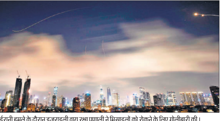
ईरानी हमले के दौरान इजराइली वायु रक्षा णणाली ने मिसाइलों को रोकने के लिए गोलीबारी की।

काहिरा, एजेंसी ईरान ने हमलों का दायरा और व्यापक करने की धमकी दिए जाने के बीच इजराइल और फारस की खाड़ी के आसपास के पड़ोसी देशों पर हमले किए। इस संघर्ष के कारण वैश्विक विमानन सेवाएं अस्त-व्यस्त हो गई हैं, तेल निर्यात बाधित हुआ है और दुनियाभर में ईंधन की कीमतों में वृद्धि हुई है। अमेरिकी राष्ट्रपति ट्रंप ने कहा कि उन्हें आशा है कि तेल व गैस के निर्यात पर निर्भर देश हॉर्मुज स्ट्रेट