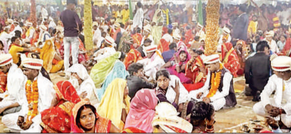
कुंडा में आयोजित सामूहिक विवाह में शामिल जोड़े।