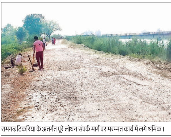
रामगढ़ टिकरिया के अंतर्गत पूरे लोहन संपर्क मार्ग पर मरम्मत कार्य में लगे श्रमिक।