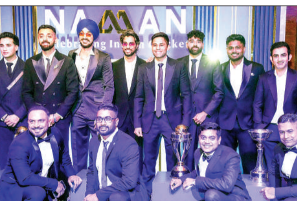
नमन अवार्ड्स के दौरान टी-20 विश्व कप विजेता टीम के साथ कप्तान सूर्यकुमार यादव। महिला क्रिकेट टीम की खिलाड़ी स्नेह राणा, रेणुका सिंह, शेफाली वर्मा और क्रांति गौड़।

यह सम्मान भारतीय क्रिकेट में उनके बेहतरीन योगदान को देखते हुए दिया गया। गिल के लिए 2025 का साल बेहद शानदार रहा और