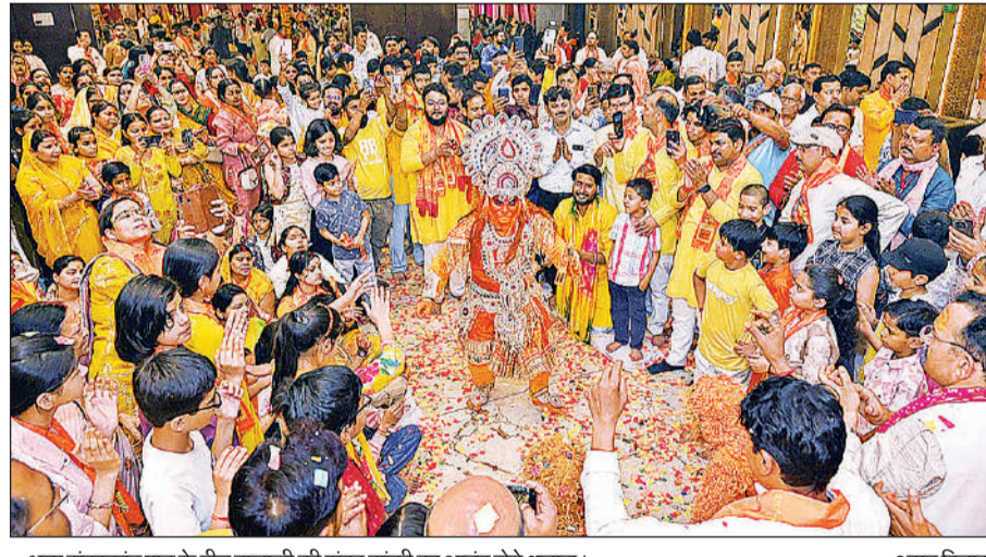
भव्य सुंदरकांड पाठ के बीच बालाजी की सुंदर झांकी का आनंद लेते श्रद्धालु।

पूरा वातावरण भक्तिमय हो गया और कार्यक्रम स्थल राम नाम के जयकारों से गूंज उठा। इस दौरान सुंदर झांकियों के माध्यम से रामायण के विभिन्न प्रसंगों का जीवंत प्रदर्शन किया गया, जिसे देखने के लिए बड़ी संख्या में लोग पहुंचे। झांकियों ने सभी का मन मोह लिया। कन्या भोज का आयोजन कर कन्याओं को उपहार भी वितरित किए गए। कार्यक्रम के अंत में श्रद्धालुओं को प्रसादी भोज वितरित किया गया। इस बीच बेसिक शिक्षक परिवार के सदस्य व नगर के गणमान्य लोग मौजूद रहे।