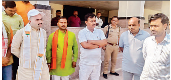
निरीक्षण करते राज्यमंत्री।