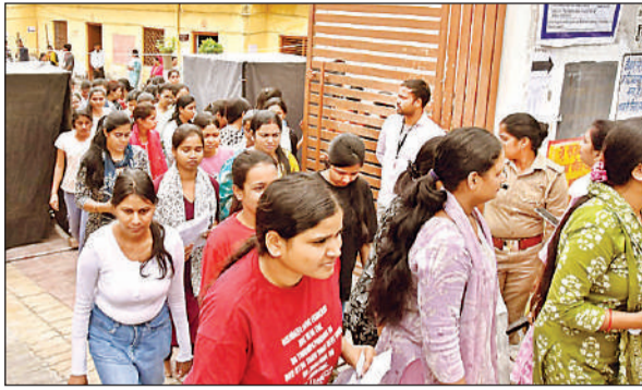
परीक्षा देकर बाहर निकलते अभ्यर्थी।