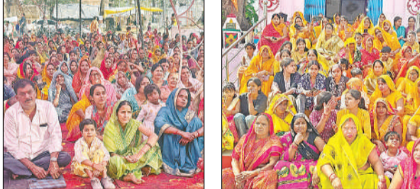
श्रीराम कथा में शामिल श्रद्धालु व कलश यात्रा में सम्मिलित हुई महिलाएं।