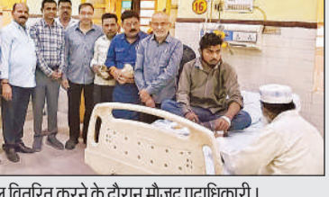
जिला अस्पताल में मरीजों को फल वितरित करने के दौरान मौजूद पदाधिकारी।