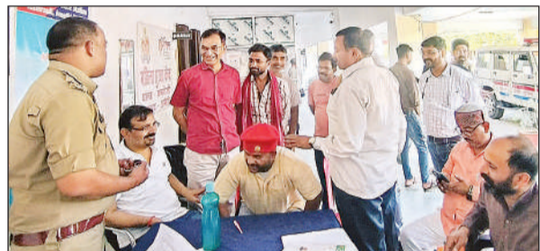
कार्रवाई को लेकर थाने पर तहरीर देते करणी सेना के पदाधिकारी।

करणी सेना के पदाधिकारियों ने तहरीर में लिखा है कि 15 मार्च 2026 रविवार को सुबह करीब 9 बजे संजय गांधी पॉलिटेक्निक चौराहे पर एक संगठन के लगभग 50 लोगों का समूह एकत्रित हुआ था। आरोप है कि इस दौरान कुछ लोगों द्वारा मुख्यमंत्री के खिलाफ आपत्तिजनक भाषा का प्रयोग किया गया और उसका वीडियो बनाकर