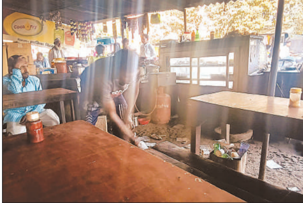
जायस के होटल पर घरेलू सिलेंडर का उपयोग करता संचालक। अमृत विचार

जगदीशपुर, शुकुल बाजार, रानीगंज, सिंहपुर, अहोरवा भवानी, समरौता, चारिसगंज, जामो, गौरीगंज, अमेठी, संग्रामपुर और इन्हौना जैसे इलाकों में यह स्थिति है। ढाबों, होटलों, चाय-समोसे की दुकानों और ठेलों पर घरेलू एलपीजी सिलिंडर प्रयोग किए जा रहे हैं। नियमों के अनुसार व्यावसायिक प्रतिष्ठानों को कमर्शियल गैस सिलिंडर का उपयोग करना चाहिए। लेकिन अधिक लाभ के लालच में घरेलू सिलिंडरों का इस्तेमाल हो रहा