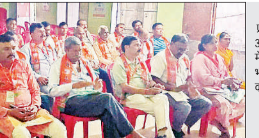
प्रशिक्षण अभियान में शामिल भाजपा कार्यकर्ता।