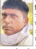
राम जीवन की फाइल फोटो।

अमृत विचार। बाजार से सब्जी खरीद कर वापस घर लौट रहा बाइक सवार सण्डीला-बांगरमऊ रोड पर बेकाबू रफ्तार की चपेट में आने से सड़क पर गिर पड़ा, जिससे उसके सिर में गहरी चोट पहुंची और वहीं पर मौत हो गई।