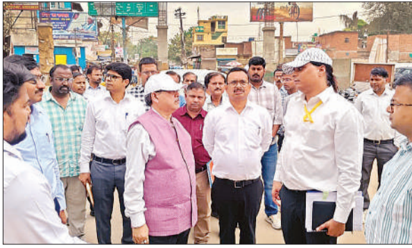
निर्माण कार्यों का जायजा लेते उत्तर रेलवे के महाप्रबंधक।

महाप्रबंधक विशेष ट्रेन से बाराबंकी रेलवे स्टेशन के प्लेटफार्म