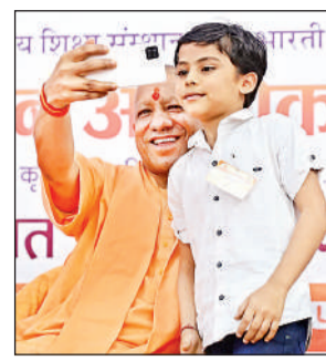
बच्चे के साथ सेल्फी लेते मुख्यमंत्री योगी।

रानी पद्मिनी की वंशावली सैकड़ों वर्ष बाद आज भी है। सनातन की मर्यादा सदैव अमर है और रहेगी।