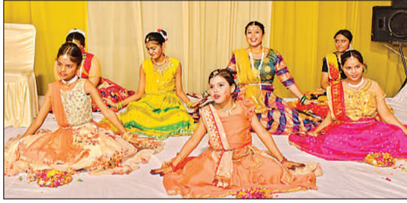
होली मिलन समारोह में सांस्कृतिक कार्यक्रम प्रस्तुत करती बालिकाएं।