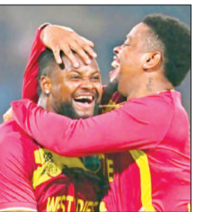
घर पहुंचने की खुशी।

● पश्चिम एशिया में चल रहे संघर्ष के कारण यात्रा में हुआ विलंब