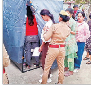
महिला परीक्षार्थियों की तलाशी लेती पुलिस।

अमृत विचार। जिले के विभिन्न परीक्षा केंद्रों पर रविवार को अंतिम दिन एसआई परीक्षा शांतिपूर्वक संपन्न हुई। निष्पक्ष परीक्षा शांतिपूर्ण संपन्न होने के बाद अधिकारियों ने राहत की सांस ली।