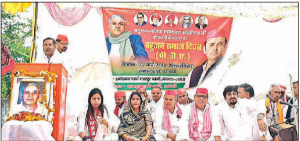
कांशीराम जयंती पर आयोजित कार्यक्रम में मौजूद सपा नेता व कार्यकर्ता।