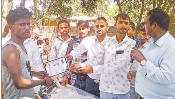
प्रमाण पत्र एवं पुरस्कार प्राप्त करते विजेता खिलाड़ी।