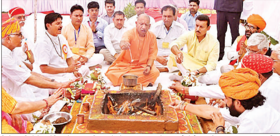
चित्तौड़गढ़ किले में आयोजित जौहर श्रद्धांजलि समारोह में हवन-पूजन करते मुख्यमंत्री योगी, साथ में अन्य।

"मूल जानना बड़ा कठिन है नदियों का-वीरों का, धनुष छोड़कर और गोत्र क्या होला रणधीरों का। पाते हैं सम्मान तोपोल से भूतल पर शूर, जाति-जाति का शोर मचाते केवल कायर, क्रूर।" मुख्यमंत्री ने कहा कि जिन्हें कुछ नहीं करना है, वे