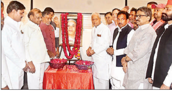
सपा मुख्यालय पर कांशीराम के चित्र पर पुष्पांजलि अर्पित करते पार्टी नेता।

सपा प्रमुख ने रविवार को कहा कि 1971 में बामसेफ और 1984 में बहुजन समाज पार्टी की स्थापना के दलित समाज में आत्मस्मान की भावना जगाई और उन्हें राजनीति में सम्मानजनक भागीदारी दिलाने का प्रयास किया। उन्होंने बताया कि कांशीराम और मुलायम सिंह यादव के बीच 1991 में हुए गठबंधन से राज्य में सझा सरकार बनी थी।