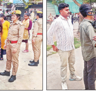
मेटल डिटेक्टर से परीक्षार्थी की जांच करता पुलिसकर्मी।