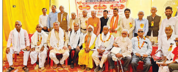
होली मिलन समारोह में मौजूद सम्मानित शिक्षक।