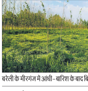
बरेली के मीरगंज में आंधी-बारिश के बाद बिछी गेहूं की फसल।