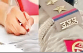
आवेदन किया था। जिन पदों पर भर्ती होनी है, उनमें उपनिरीक्षक नागरिक था। पहले दिन 14 मार्च को पहली पाली में कुल 3,93,939 अभ्यर्थियों को शामिल होना था। इनमें 2,63,839 ने परीक्षा दी। जबकि दूसरी पाली में कुल 3,93,941 अभ्यर्थियों को परीक्षा देनी थी और 2,67,843 अभ्यर्थी ही शामिल हुए। 15 मार्च को पहली पाली में

7,87,880 अभ्यर्थियों को परीक्षा देनी थी, लेकिन 5,45,721 ही पहुंचे। कड़ी सुरक्षा में परीक्षा सफाई संपन्न करा दी गई। उत्तर प्रदेश पुलिस भर्ती एवं प्रोन्नति बोर्ड लखनऊ द्वारा आयोजित एसआई व समकक्ष भर्ती परीक्षा का आयोजन शनिवार व रविवार को किया गया। बोर्ड ने कुल उपनिरीक्षक 10,77,403 अभ्यर्थी ही शामिल हुए। करीब 4,98,357 ने परीक्षा छोड़ दी। इसमें ढाई लाख ने प्रवेश पत्र ही डाउनलोड नहीं किया था। रविवार को दोनों पालियों में