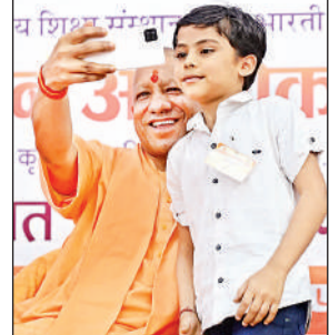
बच्चे के साथ सेल्फी लेते मुख्यमंत्री योगी।

रानी पद्मिनी की वंशावली सैकड़ों वर्ष बाद आज भी है। सनातन की मर्यादा सदैव अमर है और रहेगी।