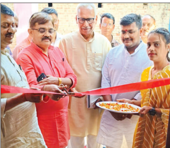
फीता काटकर सिलाई केंद्र का उद्घाटन करते अतिथि।