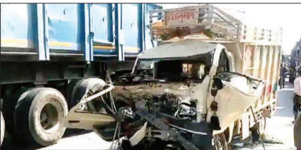
दुर्घटना के बाद खड़े डंपर और लोडर।