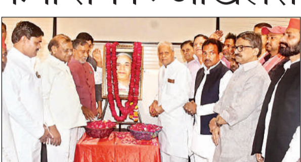
सपा मुख्यालय पर कांशीराम के चित्र पर पुष्पांजलि अर्पित करते पार्टी नेता।

मनाई गई। इस मौके पर सपा प्रमुख अखिलेश यादव ने जारी संदेश में कहा कि कांशीराम एक प्रमुख भारतीय राजनेता और समाज सुधारक थे, जिन्होंने बहुजन समाज को सम्मानजनक स्थान दिलाने के लिए जीवनभर संघर्ष किया। सपा प्रमुख ने रविवार को कहा कि 1971 में बामसेफ और 1984