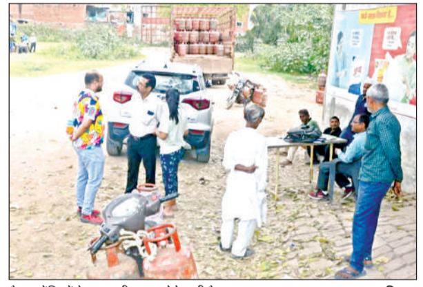
गैस एजेंसियों के बाहर भीड़ कम होने लगी है।

रविवार को अधिकतर गैस एजेंसियों पर भीड़ नहीं थी। शनिवार इन्हीं एजेंसियों पर मारपीट की नौबत थी जिससे पुलिस की निगरानी में सिलेंडर का वितरण करना पड़ा लेकिन रविवार को गैस की आपूर्ति सामान्य हो गयी। कामशियल सिलेंडर की दिक्कत बरकरार है। रेस्टोरेंट, होटल, चाय, पकौड़ा, समोसा, चाउमीन, बगर समेत फास्ट फूड की दुकानों के ताले नहीं खुले हैं और जगह जगह हजारों स्थानों