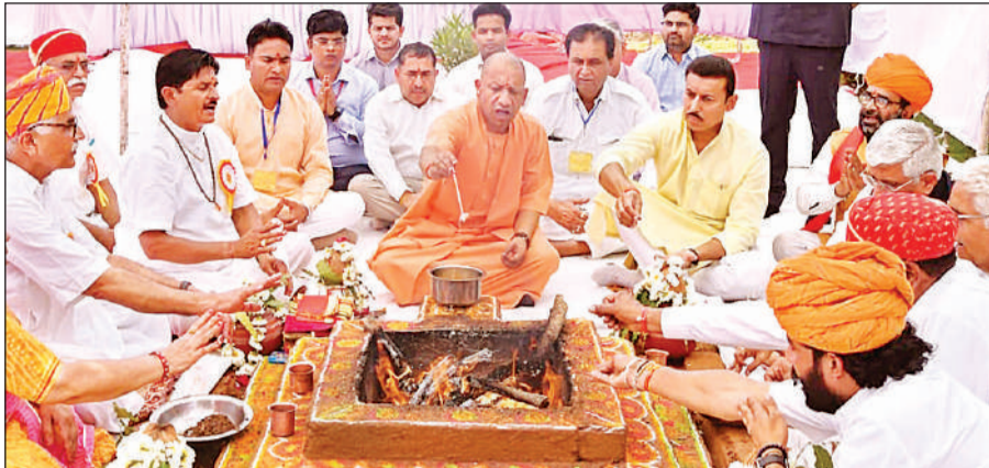
चित्तौड़गढ़ किले में आयोजित जौहर श्रद्धांजलि समारोह में हवन-पूजन करते मुख्यमंत्री योगी, साथ में अन्य।

"मूल जानना बड़ा कठिन है नदियों का-वीरों का, धनुष छोड़कर और गोत्र क्या होला रणधीरों का। पाते हैं सम्मान तपोबल से भूतल पर शूर, जाति-जाति का शोर मचाते केवल कायर, क्रूर।" मुख्यमंत्री ने कहा कि जिन्हें कुछ नहीं करना है, वे