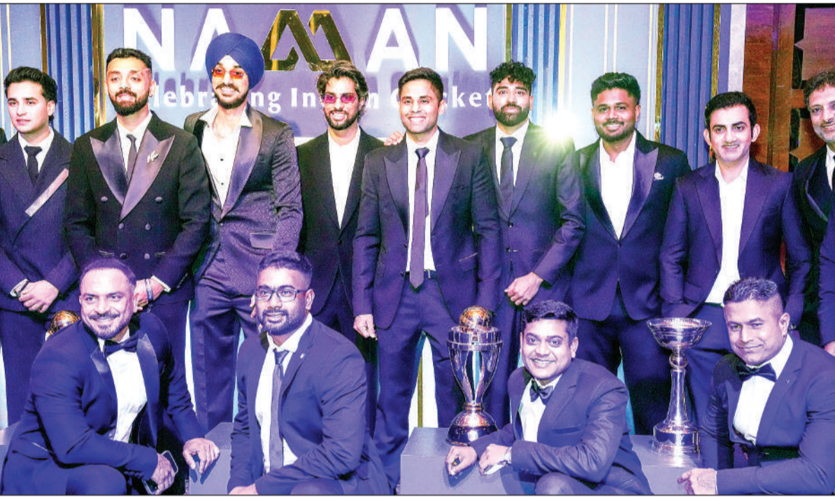
नमन अवार्ड्स के दौरान टी-20 विश्व कप विजेता टीम के साथ कप्तान सूर्यकुमार यादव।

गिल ने प्रतिष्ठित 'पॉली उमरीगर पुरस्कार' जीता जबकि मंधाना को यह पुरस्कार पांचवीं बार मिला। गिल का यह दूसरा 'क्रिकेटर ऑफ द ईयर' पुरस्कार है, इससे पहले उन्होंने 2023 में यह पुरस्कार जीता था। पूर्व दिग्गज खिलाड़ी रोजर बिन्नी, राहुल द्रविड़ और मिताली राज को भारतीय क्रिकेट बोर्ड (बीसीसीआई) के सर्वोच्च सम्मान 'कर्नल सी के नायडू लाइफटाइम अचीवमेंट' पुरस्कार से सम्मानित किया गया। यह सम्मान भारतीय क्रिकेट में उनके बेहतरीन योगदान को देखते हुए दिया गया। गिल के लिए 2025 का साल बेहद शानदार रहा और उन्होंने क्रिकेट के लंबे प्रारूपों में खुद को टीम के सबसे भरोसेमंद बल्लेबाज में से एक के तौर पर स्थापित किया। गिल ने कहा, मैं सबसे पहले यह पुरस्कार देने के लिए बीसीसीआई का धन्यवाद करना चाहता हूं। भारतीय क्रिकेट के कई महान और