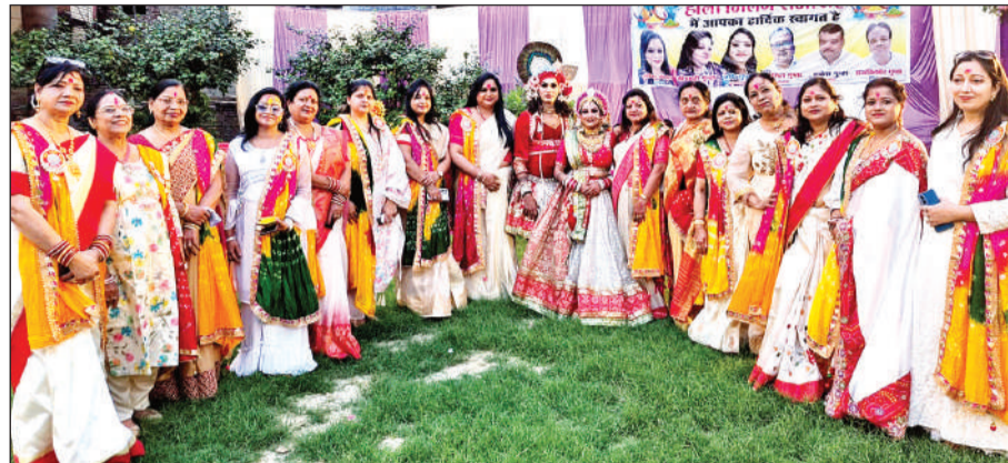
महिलाओं ने होली मिलन का आनंद लिया।

दौरान कुछ लोग काफी समय बाद मिले तो एक-दूसरे की कुशलक्षेम पूछी और यादें ताजा कीं। महिलाओं ने सुंदर पोशाक धारण कर समारोह में चार चांद लगा दिए। महिलाओं के कार्यक्रम में राधा-कृष्ण के संग फूलों की होली खेली गई और एक-दूसरे को गुलाल लगाया गया।