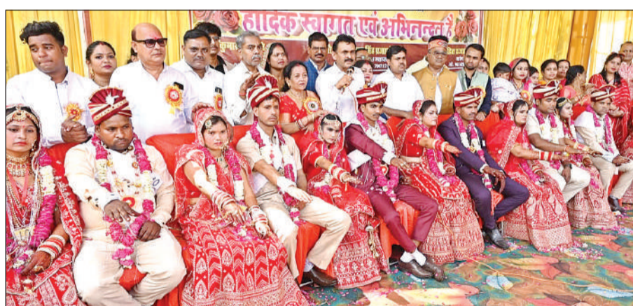
प्रजापति महासभा की ओर से सामूहिक विवाह समारोह हुआ।