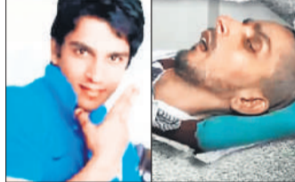
● इच्छा मृत्यु के लिए एम्स के पैलिटिव केयर में किया गया शिफ्ट