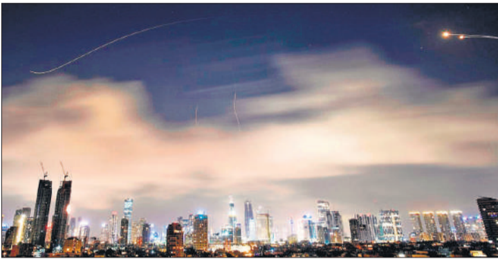
ईरानी हमले के दौरान इजराइली वायु रक्षा प्रणाली ने मिसाइलों को रोकने के लिए गोलीबारी की।

काहिरा, एजेंसी ईरान ने हमलों का दायरा और व्यापक करने की धमकी दिए जाने के बीच इजराइल और फारस की खाड़ी के आसपास के पड़ोसी देशों पर हमले किए। इस संघर्ष के कारण वैश्विक विमानन सेवाएं अस्त-व्यस्त हो गई हैं, तेल निर्यात बाधित हुआ है और दुनियाभर में ईंधन की कीमतों में वृद्धि हुई है।