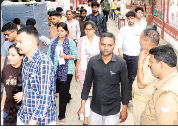
परीक्षा देकर निकलते परीक्षार्थी।

उत्तर प्रदेश पुलिस भर्ती एवं प्रोन्नति बोर्ड की ओर से एसआई व समकक्ष पदों की सीधी भर्ती-2025 की लिखित परीक्षा रविवार को भी