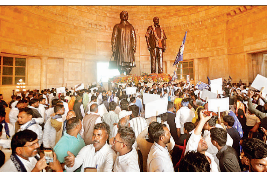
लखनऊ : मान्यवर श्री कांशीराम जी स्मारक स्थल पर श्रद्धांजलि देने भारी संख्या में पहुंचे बसपा कार्यकर्ता।

बसपा प्रमुख ने रविवार को पार्टी संस्थापक काशीराम की जयंती पर उन्हें श्रद्धांजलि दी। साथ ही कहा, कांशीराम ने बीआर आंबेडकर की विचारधारा और आंदोलन को पूरे देश में आगे बढ़ाने के लिए अपना पूरा जीवन समर्पित किया। पार्टी की ओर से मायावती के जारी बयान में कहा गया कि काशीराम के "सामाजिक परिवर्तन और आर्थिक मुक्ति" के आंदोलन को मजबूत बनाने और चुनावी सफलता हासिल करने का संकल्प लिया गया है। साथ ही दावा किया कि बहुजन समाज के हितों के लिए वही "असली पार्टी और आंदोलन" है। पार्टी ने आपण लगाया कि समाजवादी पार्टी समेत अन्य विरोधी दलों की कथनी और करनी में अंतर है, जिससे बहुजन समाज की एकता और सत्ता प्राप्ति के मिशन को नुकसान होता है।