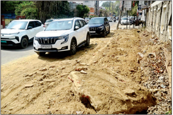
मुख्य सड़क खुदी पड़ी है।