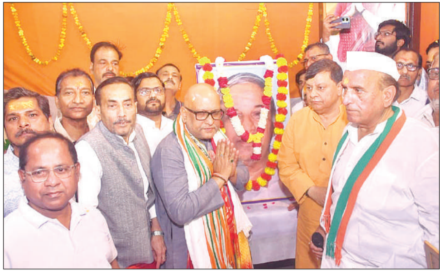
तिलक हाल में होली मिलन में आए कांग्रेस प्रदेश अध्यक्ष अजय राय का स्वागत किया गया।

रविवार को कानपुर महानगर कांग्रेस द्वारा तिलक हाल में आयोजित होली मिलन समारोह में बतौर मुख्य अतिथि शिरकत करने आए कांग्रेस के प्रदेश अध्यक्ष अजय राय पत्रकारों से सबूर थे। उन्होंने कहा कि देश-प्रदेश में महंगाई, बेरोजगारी, जनसमस्याएं बढ़ रही हैं। उन्होंने एक प्रश्न के उत्तर में कहा कि राष्ट्रीय नेतृत्व तय करेगा कि कानपुर में कितनी विस सीटों