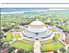
आदित्यनाथ के विजन के अनुरूप इस क्षेत्र को बौद्ध पर्यटन के प्रमुख केंद्र के रूप में विकसित किया जा रहा है। परियोजना के तहत पार्क के लैंडस्केप क्षेत्र में कई प्रमुख संरचनाओं का निर्माण लगभग पूरा हो चुका है। धर्मचक्र से संबंधित आठ संरचनाओं के आरसीसी फाउंडेशन तैयार हो चुके हैं।

● श्रावस्ती में बन रहा पार्क अंतरराष्ट्रीय पर्यटकों के लिए बनेगा आकर्षण का केंद्र