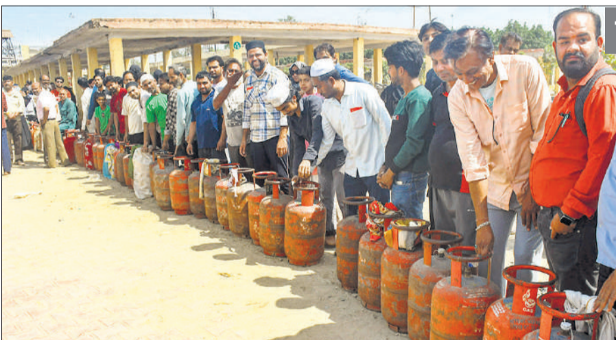
मेरठ में रविवार को एक गैस एजेंसी के बाहर सिलेंडर रिफिल कराने के लिए लगी लोगों को लंबी कतार।

जिला उपभोक्ता विवाद निवारण आयोग ने एटीएम में ग्राहक के बैंक खाते से राशि डेबिट होने के बाद नकदी नहीं मिलने को गंभीर मामला