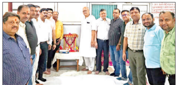
नई कार्यकारिणी का गठन किया गया।