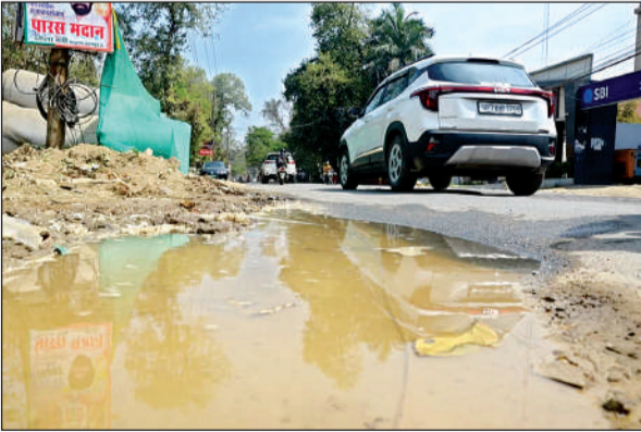
सड़क पर भरा पानी।