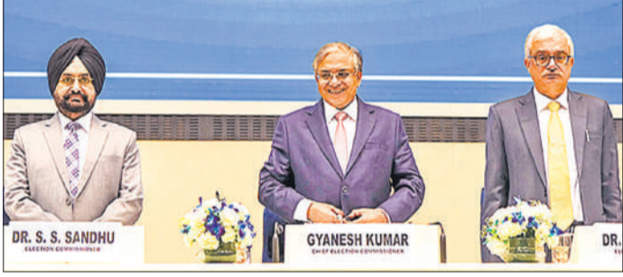
नई दिल्ली में चुनाव के बारे में घोषणा करते मुख्य चुनाव आयुक्त ज्ञानेश कुमार।

उन्होंने बताया कि चारों राज्यों और केंद्र शासित प्रदेश विधानसभा चुनाव के लिए 824 सीटों पर मतगणना चार मई को होगी। चुनाव हिंसा या प्रलोभन से मुक्त होने चाहिए और आयोग किसी भी उल्लंघन के खिलाफ कड़ी कार्रवाई