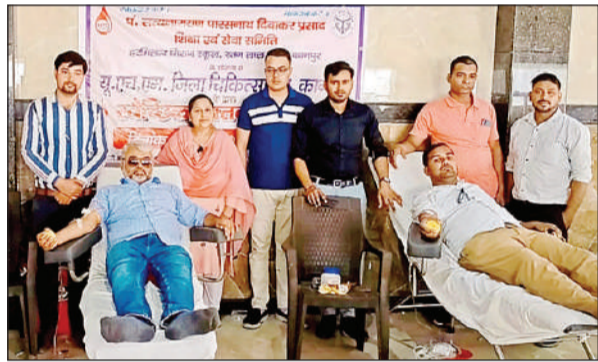
शिविर में रक्तदान करते लोग।