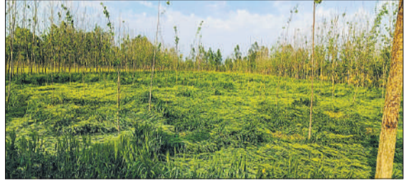
बरेली के मीरगंज में आंधी-बारिश के बाद बिछी गेहूँ की फसल।