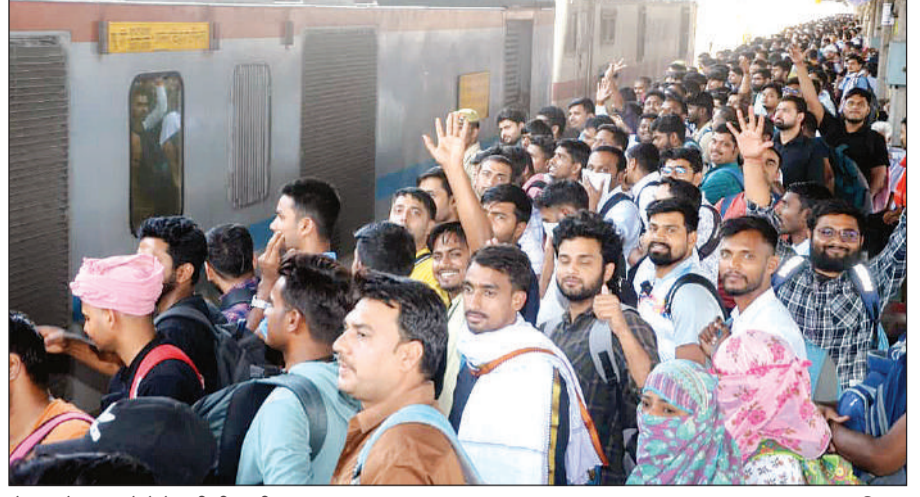
सेंट्रल स्टेशन पर ट्रेनों में भारी भीड़ रही।