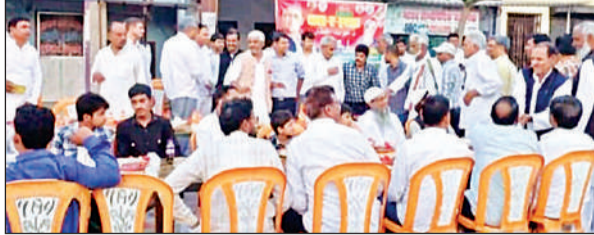
रोजा इफ्तार में प्रतिभाग करते नेता प्रतिपक्ष माता प्रसाद पांडेय।

रोजा इफ्तार से मजबूत होती है हिन्दू-मुस्लिम एकता