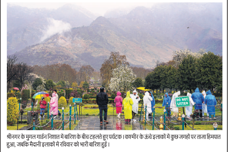
श्रीनगर के मुगल गार्डन निशात में बारिश के बीच टहलते हुए पर्यटक। कश्मीर के ऊंचे इलाकों में कुछ जगहों पर ताजा हिमपात हुआ, जबकि मैदानी इलाकों में रविवार को भारी बारिश हुई।