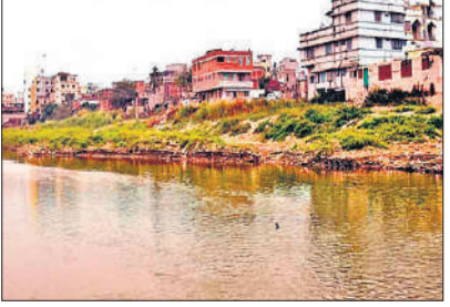
(स्वच्छ गंगा राष्ट्रीय मिशन प्राधिकरण) के सामने कौन-कौन सी बाधाएं या रुकावटें हैं? पीठ ने कहा, उपयुक्त सभी राज्यों से होकर बहने वाली गंगा नदी की रक्षा करने और यह सुनिश्चित करने के लिए कि नदी के मैदानी क्षेत्र और किनारे सभी प्रकार के अतिक्रमणों से मुक्त हों, प्राधिकरण क्या कदम उठाने का इरादा रखता है? कोर्ट ने गंगा बेसिन के कई राज्यों को नोटिस जारी किया और कहा कि इस

नदी के पर्यावरणीय प्रवाह को बनाए रखना मुख्य मुद्दा गौरतलब है कि 7 अक्टूबर 2016 की अधिसूचना पर्यावरण संरक्षण अधिनियम, 1986 के तहत जारी की गई थी, जिसका उद्देश्य गंगा नदी के संरक्षण, पुनर्जीवन और प्रबंधन के लिए दिशा-निर्देश तय करना है। इसमें नदी के पर्यावरणीय प्रवाह को बनाए रखना, प्रदूषण को रोकना और नदी के किनारों तथा फ्लडप्लेन की सुरक्षा सुनिश्चित करना शामिल है। कोर्ट ने कहा कि लगातार हो रहे अतिक्रमण को देखते हुए इन प्रावधानों की प्रभावी शीला की समीक्षा जरूरी है। सुप्रीम कोर्ट ने केंद्र सरकार और बिहार सरकार को अगली सुनवाई से पहले अपडेटेड रिपोर्ट दाखिल करने का निर्देश दिया है। मामले की अगली सुनवाई 23 अप्रैल 2026 को होगी।