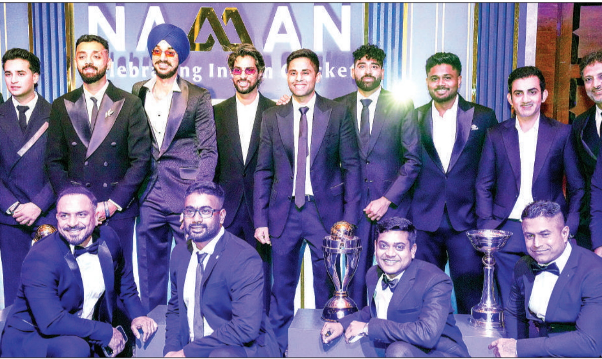
नमन अवार्ड्स के दौरान टी-20 विश्व कप विजेता टीम के साथ कप्तान सूर्यकुमार यादव।

भारत के टेस्ट कप्तान शुभमन गिल और स्मृति मंधाना को 2024-2025 में उनके उत्कृष्ट प्रदर्शन के लिए रविवार को यहां आयोजित बीसीसीआई नमन पुरस्कार 2026 समारोह में सर्वश्रेष्ठ अंतर्राष्ट्रीय क्रिकेटर (क्रमशः पुरुष और महिला वर्ग) चुना गया। गिल ने प्रतिष्ठित 'पॉली उमरीगर पुरस्कार' जीता जबकि मंधाना को यह पुरस्कार पांचवीं बार मिला। गिल का यह दूसरा 'क्रिकेटर ऑफ द ईयर' पुरस्कार है, इससे पहले उन्होंने 2023 में यह पुरस्कार जीता था। पूर्व दिग्गज खिलाड़ी रोजर बिन्नी, राहुल द्रविड़ और मिताली राज को भारतीय क्रिकेट बोर्ड (बीसीसीआई) के सर्वोच्च सम्मान 'कर्नल सी के नायडू लाइफटाइम अचीवमेंट' पुरस्कार से सम्मानित किया गया। यह सम्मान भारतीय क्रिकेट में उनके बेहतरीन योगदान को देखते हुए दिया गया। गिल के लिए 2025 का साल बेहद शानदार रहा और उन्होंने क्रिकेट के लंबे प्रारूपों में खुद को टीम के सबसे भरोसेमंद बल्लेबाज में से एक के तौर पर स्थापित किया। गिल ने कहा, मैं सबसे पहले यह पुरस्कार देने के लिए बीसीसीआई का धन्यवाद करना चाहता हूँ। भारतीय क्रिकेट के कई महान और