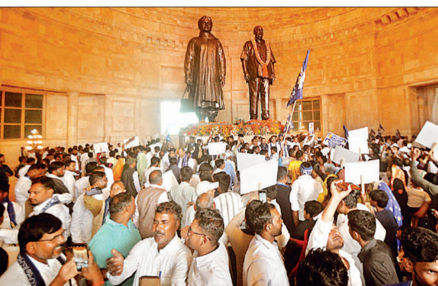
मान्यवर श्री कांशीराम जी स्मारक स्थल पर श्रद्धांजलि देने भारी संख्या में पहुंचे बसपा कार्यकर्ता।

बसपा प्रमुख ने रविवार को पार्टी संस्थापक काशीराम की जयंती पर उन्हें श्रद्धांजलि दी। साथ ही कहा, कांशीराम ने बीआर अंबेडकर की विचारधारा और आंदोलन को पूरे देश में आगे बढ़ाने के लिए अपना पूरा जीवन समर्पित किया। पार्टी की ओर से मायावती के जारी बयान में कहा गया कि कांशीराम के “सामाजिक परिवर्तन और आर्थिक मुक्ति” के आंदोलन को मजबूत बनाने और चुनावी सफलता हासिल करने का संकल्प लिया गया है। साथ ही दावा किया कि बहुजन समाज के हितों के लिए वही “असली पार्टी और आंदोलन” है। पार्टी ने आपत्त लगाया कि समाजवादी पार्टी समेत अन्य विरोधी दलों की कथनी और करनी में अंतर है, जिससे बहुजन समाज की एकता और सत्ता प्राप्त के मिशन को नुकसान होता है।