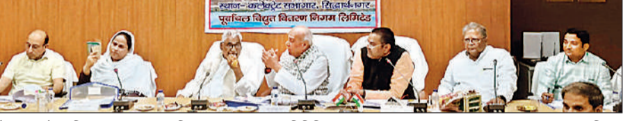
बैठक करते दुमरियागंज सांसद जगदम्बिका पाल व अन्य जनप्रतिनिधि।

बैठक में सांसद ने जनपद के विधानसभा बांसी के अन्तर्गत खेसरहा, विधानसभा इटवा के अन्तर्गत लोटा खुनियांव, विधानसभा शोहरतगढ़ के