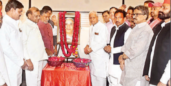
सपा मुख्यालय पर कांशीराम के चित्र पर पुष्पांजलि अर्पित करते पार्टी नेता।

में बहुजन समाज पार्टी की स्थापना कर दलित समाज में आत्मसम्मान की भावना जगाई और उन्हें राजनीति में सम्मानजनक भागीदारी दिलाने का प्रयास किया। उन्होंने बताया कि कांशीराम और मुलायम सिंह यादव के बीच 1991 में हुए गठबंधन से