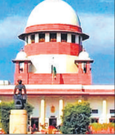
सुप्रीम कोर्ट ने केंद्र को गंगा नदी के किनारों और बाढ़ के मैदानी क्षेत्रों में अवैध निर्माणों पर एक व्यापक रिपोर्ट प्रस्तुत करने और अतिक्रमण हटाने के लिए उठाए गए कदमों को रिपोर्ट पर रखने को कहा।