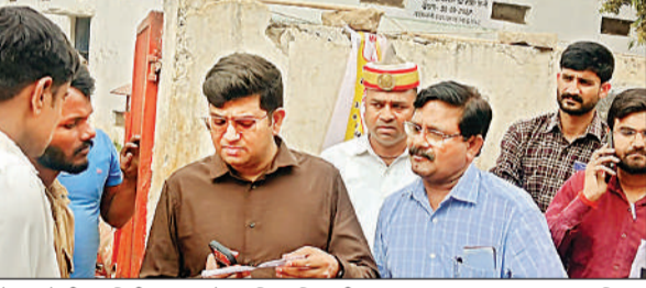
गैस एजेंसी का निरीक्षण करते हुए जिलाधिकारी।

जिलाधिकारी द्वारा गैस एजेंसी में उपलब्ध व्यवस्थाओं, अभिलेखों तथा उपभोक्ताओं को दी जा रही सेवाओं का गहनता से अवलोकन किया। गैस सिलेंडरों के भंडारण स्थल का निरीक्षण करते हुए सुरक्षा मानकों का पालन सुनिश्चित करने के निर्देश दिए। कहा कि गैस एजेंसियों पर सुरक्षा नियमों का कड़ाई से पालन किया जाना अत्यंत आवश्यक है, ताकि किसी भी प्रकार