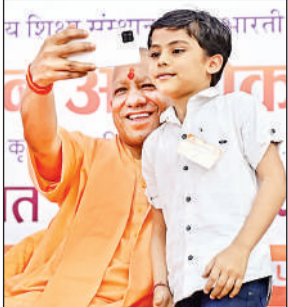
बच्चे के साथ सेल्फी लेते मुख्यमंत्री योगी।

कुल 3,93,940 अभ्यर्थियों में 2,70,803 ही परीक्षा केंद्र पहुंचे। जबकि दूसरी पाली में 3,93,940 में 2,74,918 अभ्यर्थियों ने परीक्षा दी। परीक्षा के दौरान लगभग 16 हजार सीसीटीवी कैमरों के माध्यम से परीक्षा केंद्रों पर कड़ी निगरानी रही। पुलिस भर्ती व प्रोन्नति बोर्ड ने हार्डनेगंज कोतवाली में सोशल मीडिया के प्लेटफॉर्म एक्स, टेलीग्राम, व्हाट्सएप व यूट्यूब पर भ्रामक सूचना फैलाकर धन उगाही व ठगी करने वालों के विरुद्ध सात से अधिक मुकदमें भी दर्ज कराए। एसटीएफ इन मामलों में कई आरोपियों की तलाश कर रही है।