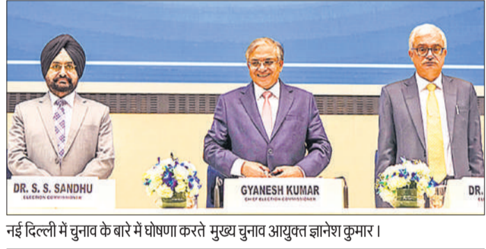
नई दिल्ली में चुनाव के बारे में घोषणा करते मुख्य चुनाव आयुक्त ज्ञानेश कुमार।

नई दिल्ली, एजेंसी निर्वाचन आयोग ने रविवार को पश्चिम बंगाल, केरल, असम, तमिलनाडु और पुडुचेरी में विधानसभा चुनाव की तारीखों की घोषणा की। सभी राज्यों में मतगणना 4 मई को होगी। मुख्य निर्वाचन आयुक्त ज्ञानेश कुमार ने बताया कि बंगाल में दो चरण में 23 और 29 अप्रैल को मतदान होगा। उन्होंने बताया कि तमिलनाडु की 234 सदस्यीय विधानसभा के लिए 23 अप्रैल को मतदान होगा। कुमार ने बताया कि केरल, असम और पुडुचेरी के लिए नौ अप्रैल को एक चरण में मतदान होगा। उन्होंने बताया कि चारों राज्यों और केंद्र शासित प्रदेश विधानसभा चुनाव के लिए 824 सीटों पर मतगणना चार मई को होगी। चुनाव हिंसा या प्रलोभन से मुक्त होने चाहिए और आयोग किसी भी उल्लंघन के खिलाफ कड़ी कार्रवाई करेगा।