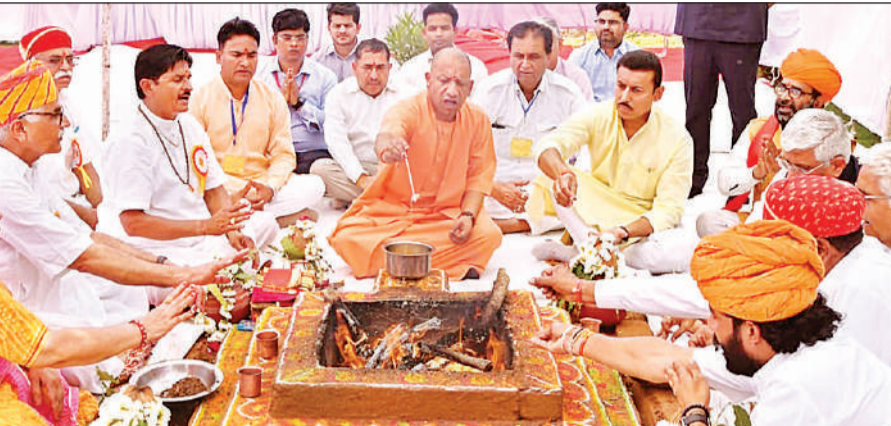
चित्तौड़गढ़ किले में आयोजित जौहर श्रद्धांजलि समारोह में हवन-पूजन करते मुख्यमंत्री योगी, साथ में अन्य।

“मूल जानना बड़ा कठिन है नदियों का-वीरों का, धनुष छोड़कर और गोत्र क्या होकर रणधीरों का। पाते हैं सम्मान तपोबल से भूतल पर शूर, जाति-जाति का शोर मचाते केवल कायर, क्रूर।” मुख्यमंत्री ने कहा कि जिन्हें कुछ नहीं करना है, वे