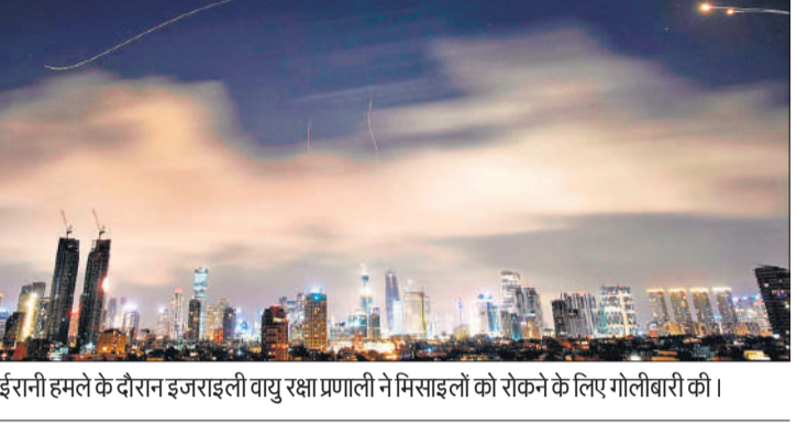
ईरानी हमले के दौरान इजराइली वायु रक्षा प्रणाली ने मिसाइलों को रोकने के लिए गोलीबारी की।

पहली बार ईरान ने दी खुली धमकी, यूएई के लोगों से तीन बंदरगाह खाली करने को कहा काहिरा, एजेंसी ईरान ने हमलों का दायरा और व्यापक करने की धमकी दिए जाने के बीच इजराइल और फारस की खाड़ी के आसपास के पड़ोसी देशों पर हमले किए। इस संघर्ष के कारण वैश्विक विमानन सेवाएं अस्त-व्यस्त हो गई हैं, तेल निर्यात बाधित हुआ है और दुनियाभर में ईंधन की कीमतों में वृद्धि हुई है। अमेरिकी राष्ट्रपति ट्रंप ने कहा कि उन्हें आशा है कि तेल व गैस के निर्यात पर निर्भर देश हॉर्मुज स्ट्रेट