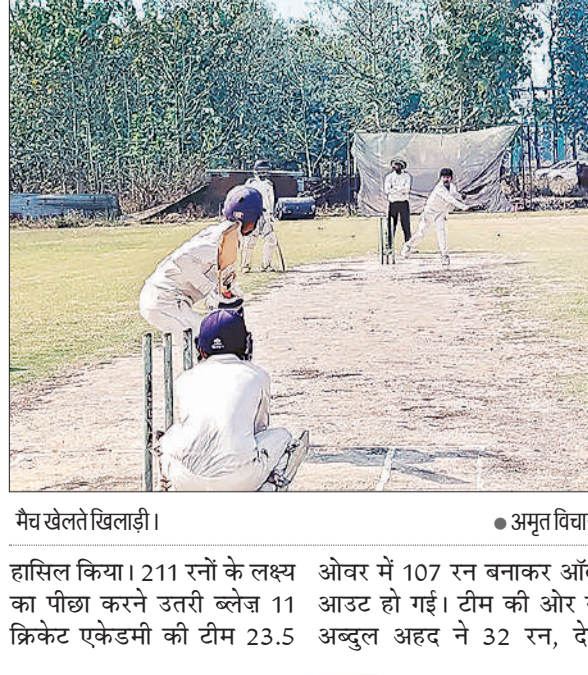
मैच खेलते खिलाड़ी।