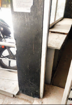
अंदर की टेबल टूटी हुई

अलीगंज सीएचसी में नई इमरजेंसी का निर्माण पूरा होने के बावजूद अब तक इसे ग्राउंड फ्लोर पर शिफ्ट नहीं किया गया है। फिलहाल इमरजेंसी सेवा पहली मंजिल से संचालित हो रही है, जिससे गर्भवती महिलाओं और अन्य मरीजों को रैप के सहारे ऊपर जाना पड़ता है। इससे उन्हें काफी परेशानी का सामना करना पड़ रहा है। नई इमरजेंसी में फिलहाल केवल सैपल कलेक्शन का काम ही किया जा रहा है। जगह कम होने के कारण मरीजों को पर्चा बनवाने में धक्का मुक्की का सामना करना पड़ता है। इसी समस्या को देखते हुए बीते साल सीएचसी गेट पर टिनशेड के नीचे नया पर्चा काउंटर बनाया गया था। तत्कालीन सीएचसी प्रभारी की ओर से पर्चा काउंटर का नए स्थान पर शिफ्ट नहीं किया गया। इस बीच बारिश का पानी काउंटर में भर गया, जिससे वहां रखा फर्नीचर पानी में डूब गया। समय पर फर्नीचर नहीं हटाने से हजारों रुपये का सामान खराब हो गया। इस मामले में मुख्य चिकित्सा अधिकारी (सीएमओ) डॉ. एनबी. सिंह ने कहा कि सीएचसी प्रभारी से जवाब तलब किया जाएगा और इसके लिए जिम्मेदार लोगों पर कार्रवाई की जाएगी।