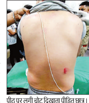
पीट पर लगी चोट दिखाता पीड़ित छात्र।