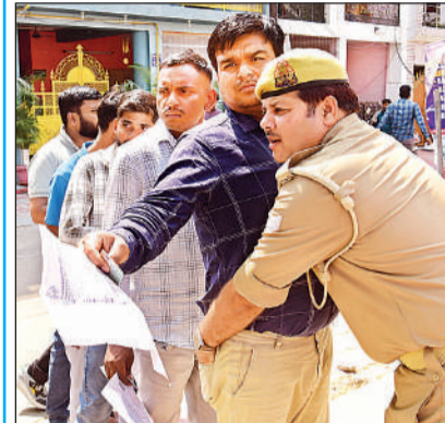
परीक्षा केंद्र पर अभ्यर्थी की तलाशी लेता पुलिसकर्मी।