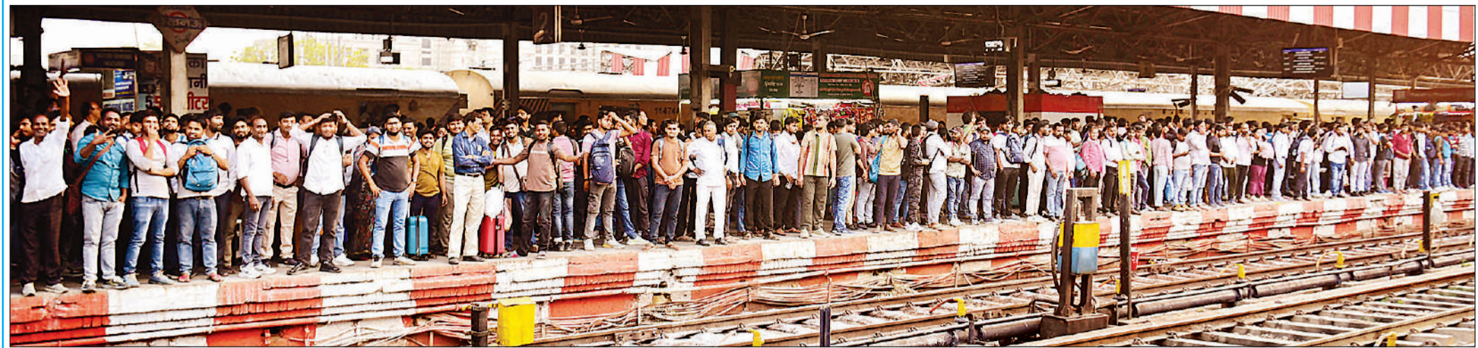
उत्तर प्रदेश पुलिस की उपनिरीक्षक परीक्षा के बाद चारबाग स्टेशन के प्लेटफार्म पर ट्रेन के इंतजार में खड़े अभ्यर्थी और अन्य यात्री।