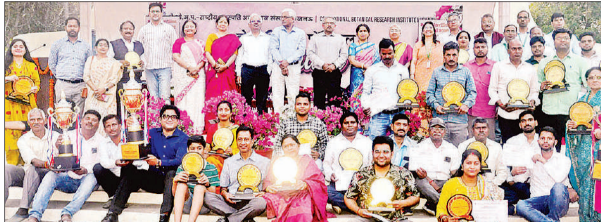
सीएसआईआर-राष्ट्रीय वनस्पति अनुसंधान संस्थान में हुए बोगनवेल्लिया उत्सव के विजेताओं के साथ अतिथि और आयोजक।

अमृत विचार, लखनऊ : लखनऊ विकास प्राधिकरण बसंतकुंज योजना में राष्ट्र प्रेरणा स्थल के पास पार्क व्यू अपार्टमेंट बनाएगा। इसकी ग्रीन कोरिडोर से सीधे कनेक्टिविटी मिलेगी। एलडीए ने कुल 364 प्रीमियम फ्लैट के लिए 6 अप्रैल तक पंजीयन खोले हैं। पार्क व्यू अपार्टमेंट की कनेक्टिविटी और लोकेशन काफी फ़ाइन होगी। यह पुराने लखनऊ के पुराने आवासीय क्षेत्र में बनेगा। पास में राष्ट्र प्रेरणा स्थल, ग्रीन कोरिडोर, आईआईएम रोड, दुश्मगा रोड और चौक जैसे महत्वपूर्ण क्षेत्र जुड़े हैं। अपार्टमेंट में चार टावर बनेंगे। टावर ए एवं बी में 16-16 फ्लोर, टावर सी में 20 फ्लोर तथा टावर डी 17 फ्लोर बनेंगे। 13 बीएचके, 3 बीएचके, सर्वेट श्रेणी के कुल 364 फ्लैट बनाए जाएंगे।