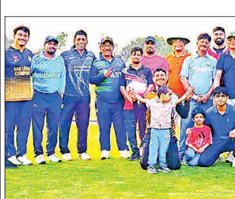
मैच के दौरान दोनों टीमों के खिलाड़ी व अन्य।