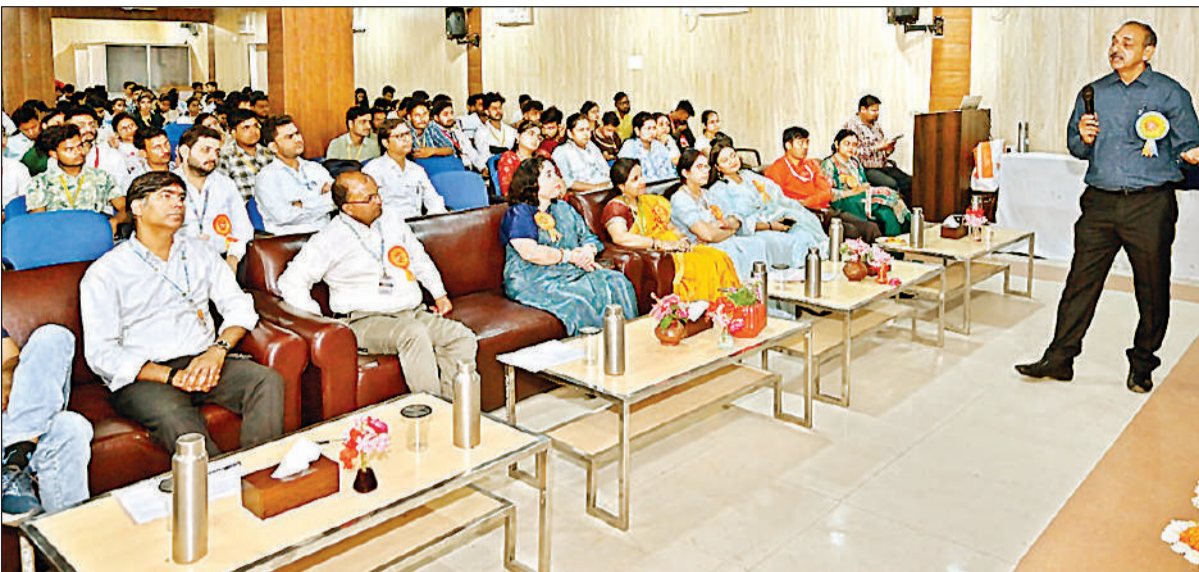
महर्षि यूनिवर्सिटी ऑफ इनफॉर्मेशन टेक्नोलॉजी में आर्टिफिशियल इंटेलिजेंस कार्यशाला में जानकारी देते विशेषज्ञ।