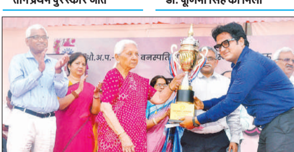
विजेता को ट्रॉफी देती राज्यपाल आनंदीबेन पटेल, साथ में अन्य।

● संस्था / नर्सरी निदेशक ट्रॉली पर एलडीए ने किया कब्जा