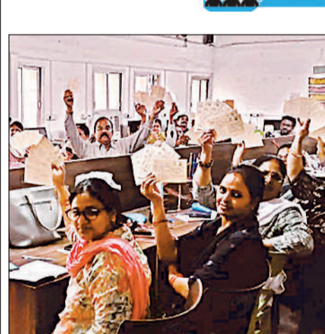
शिक्षक की पाती दिखाते प्राथमिक शिक्षक।