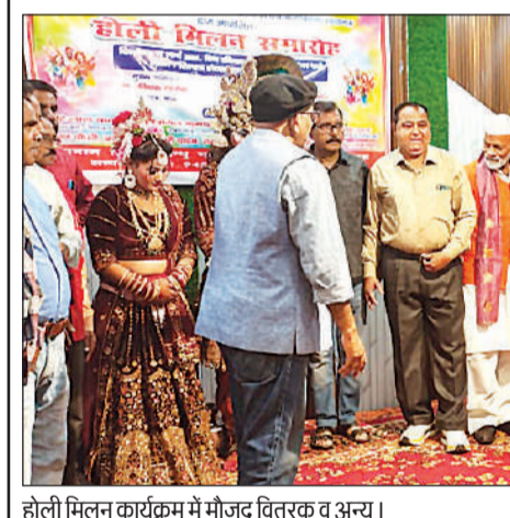
होली मिलन कार्यक्रम में मौजूद वितरक व अन्य।