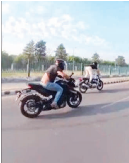
चलती बुलेट बाइक पर खड़े होकर स्टंट करता छात्र हादसे के बाद सड़क पर गिर पड़ा।