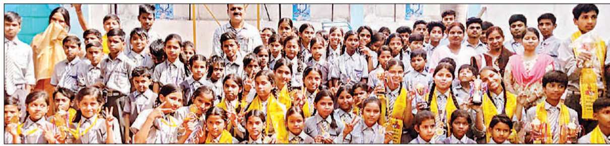
गोमतीनगर क्षेत्र के गीतापुरी खरगापुर स्थित जेपीएस एकेडमी के छात्र-छात्राओं को मेडल देकर सम्मानित किया गया।